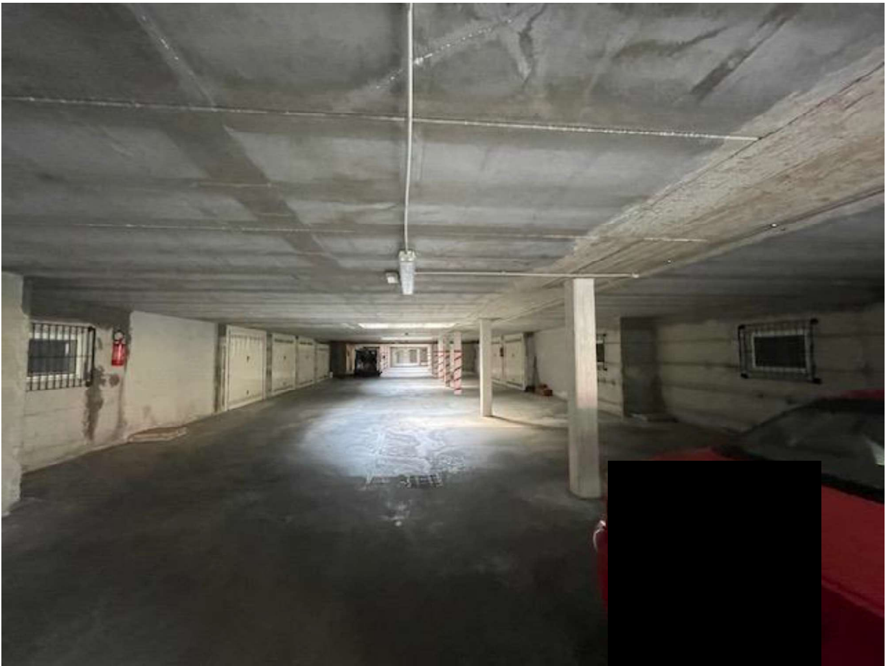
Vista di Insieme della zona manovra del locale autorimessa