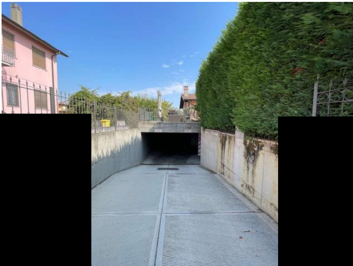
Rampa di Accesso al Piano Semi-interrato