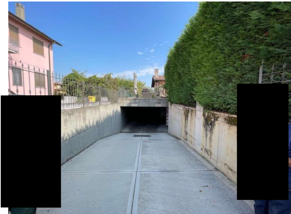
Rampa di Accesso al Piano Semi-interrato