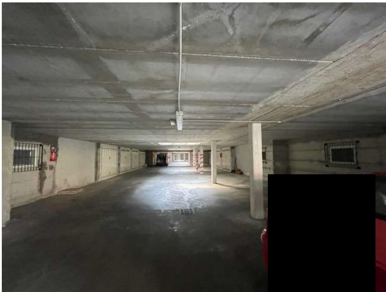
Vista di Insieme della zona manovra del locale autorimessa