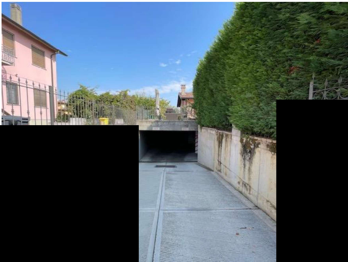
Accesso al Piano Semi-interrato