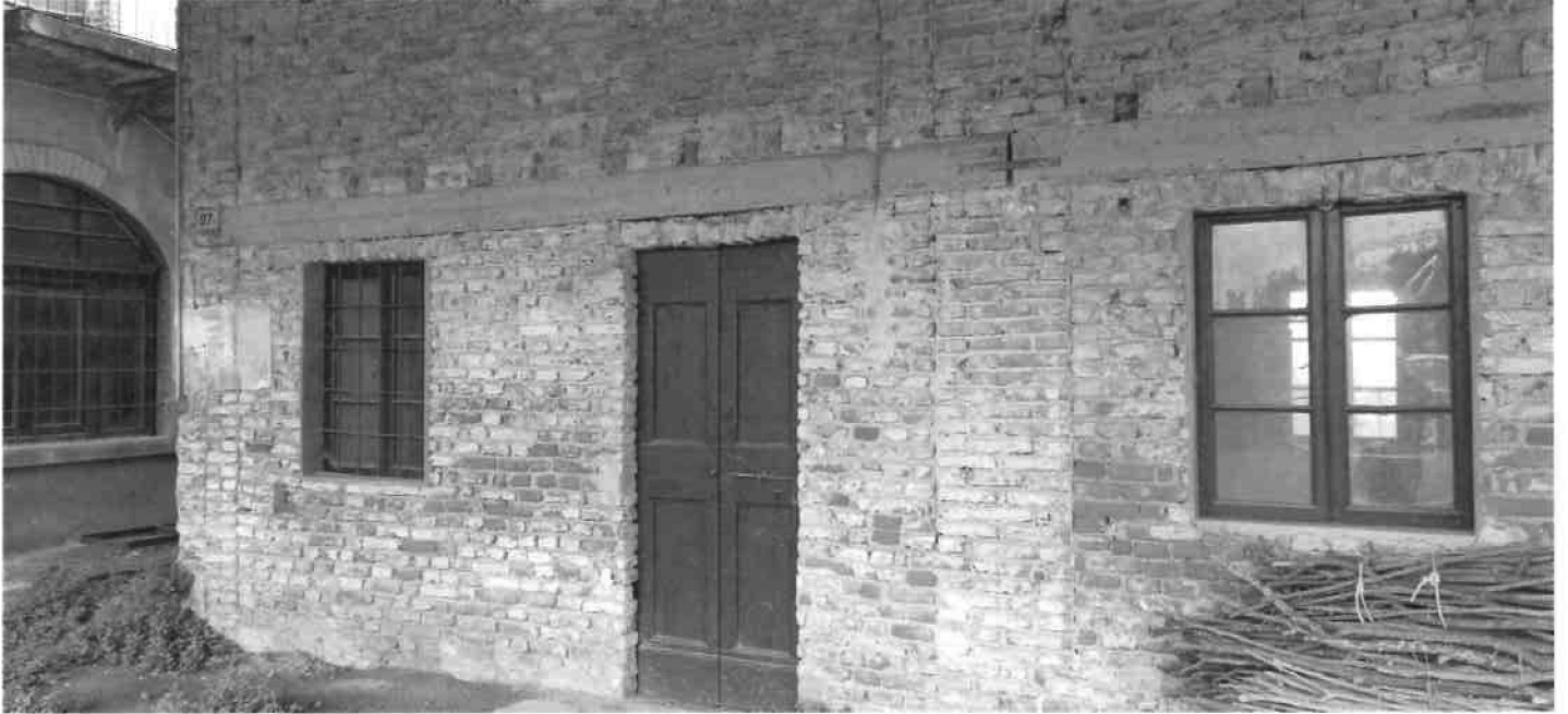
VISTA FACCIATA DA PORTICO COMUNE SUB. 21