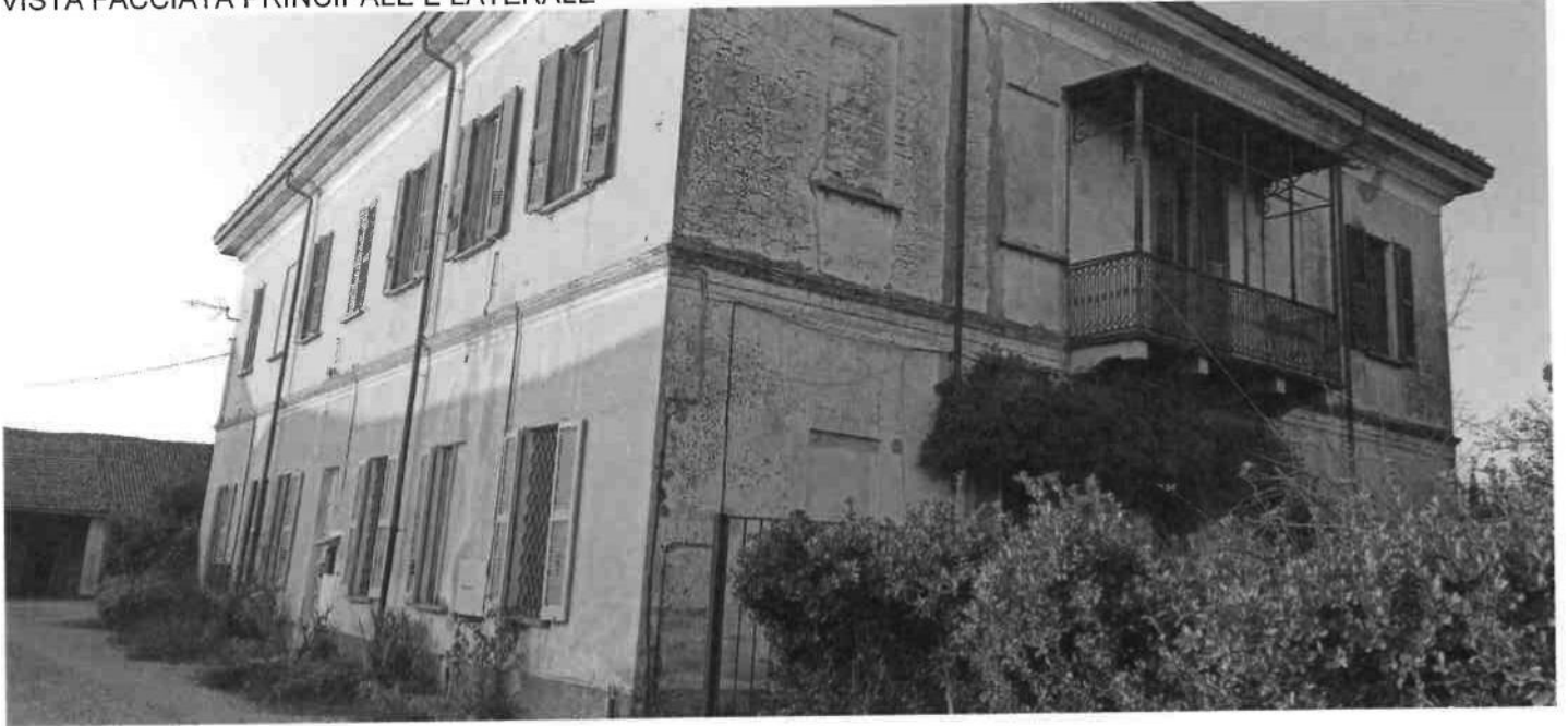
VISTA FACCIATA PRINCIPALE