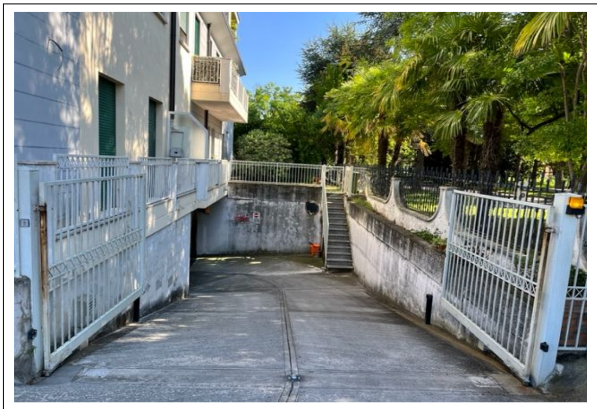
Fotogramma 2/5– Particolare dell'accesso carroia e della rampa.