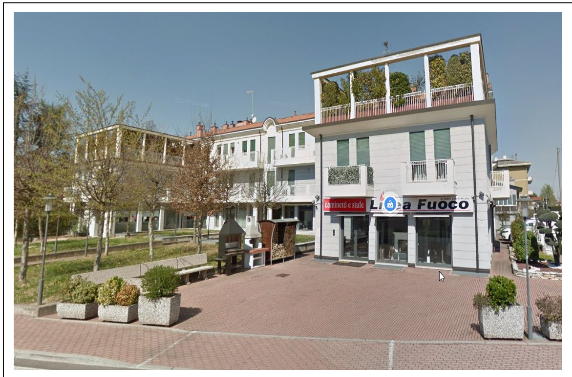
Fotogramma 1/5 – Particolare prospetto sud-est dell'intero edificio.