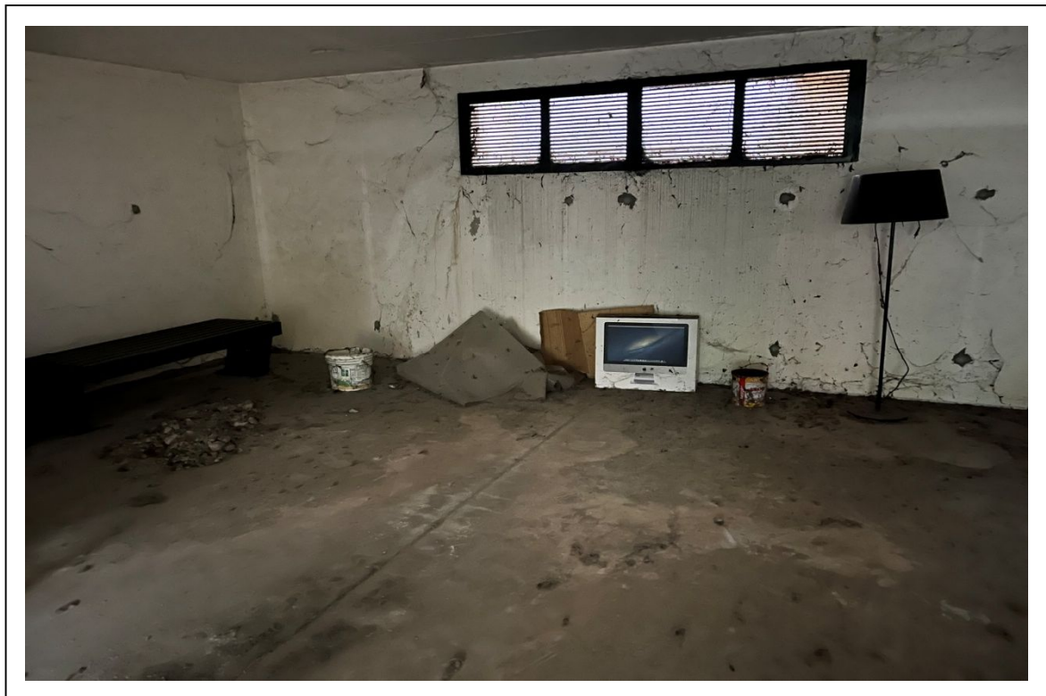
Fotogramma 5/5 – Particolare del garage.