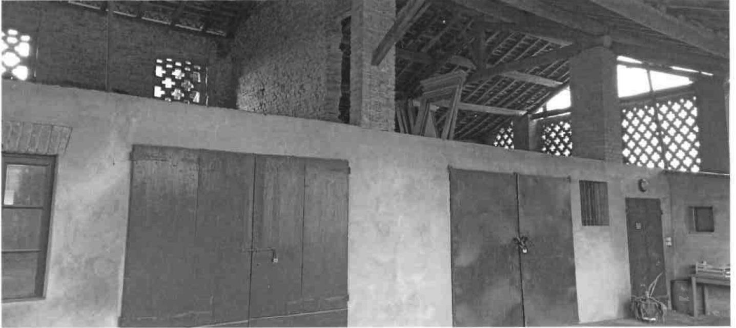
VISTA FACCIATA PRINCIPALE DA PORTICO COMUNE SUB 21