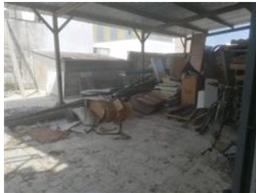
PIANO PRIMO VERANDA SCOPERTA CON TETTOIA METALLICA DA RIMUOVERE