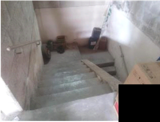
PIANO PRIMO - VANO SCALA