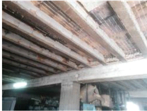
PIANO PRIMO - SOLAIO -