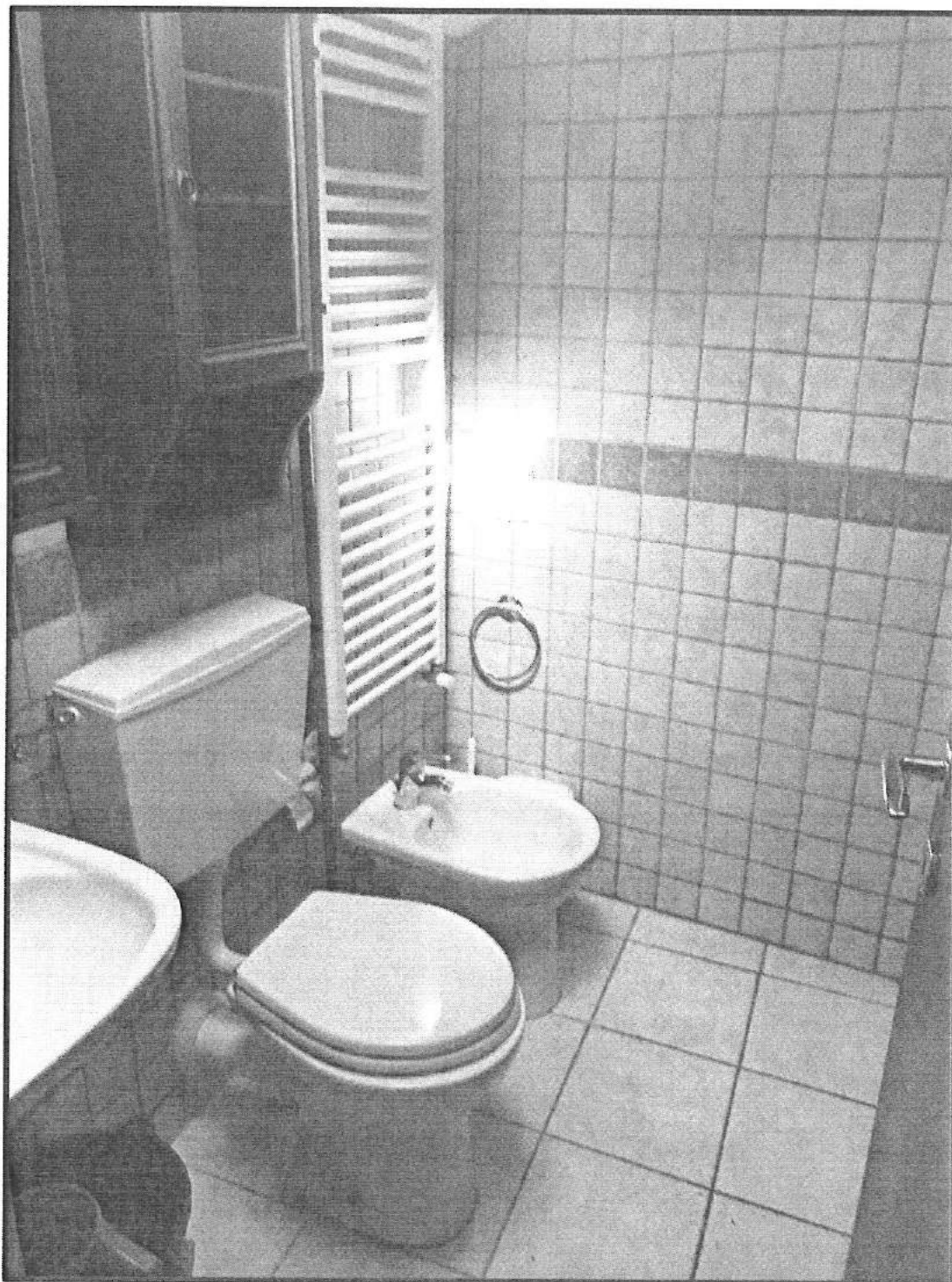
Piano Soppalco (primo) Bagno con doccia