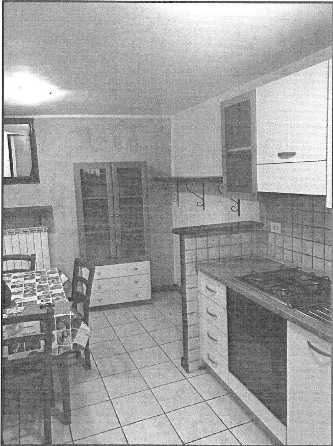
Piano Terra Angolo Cottura