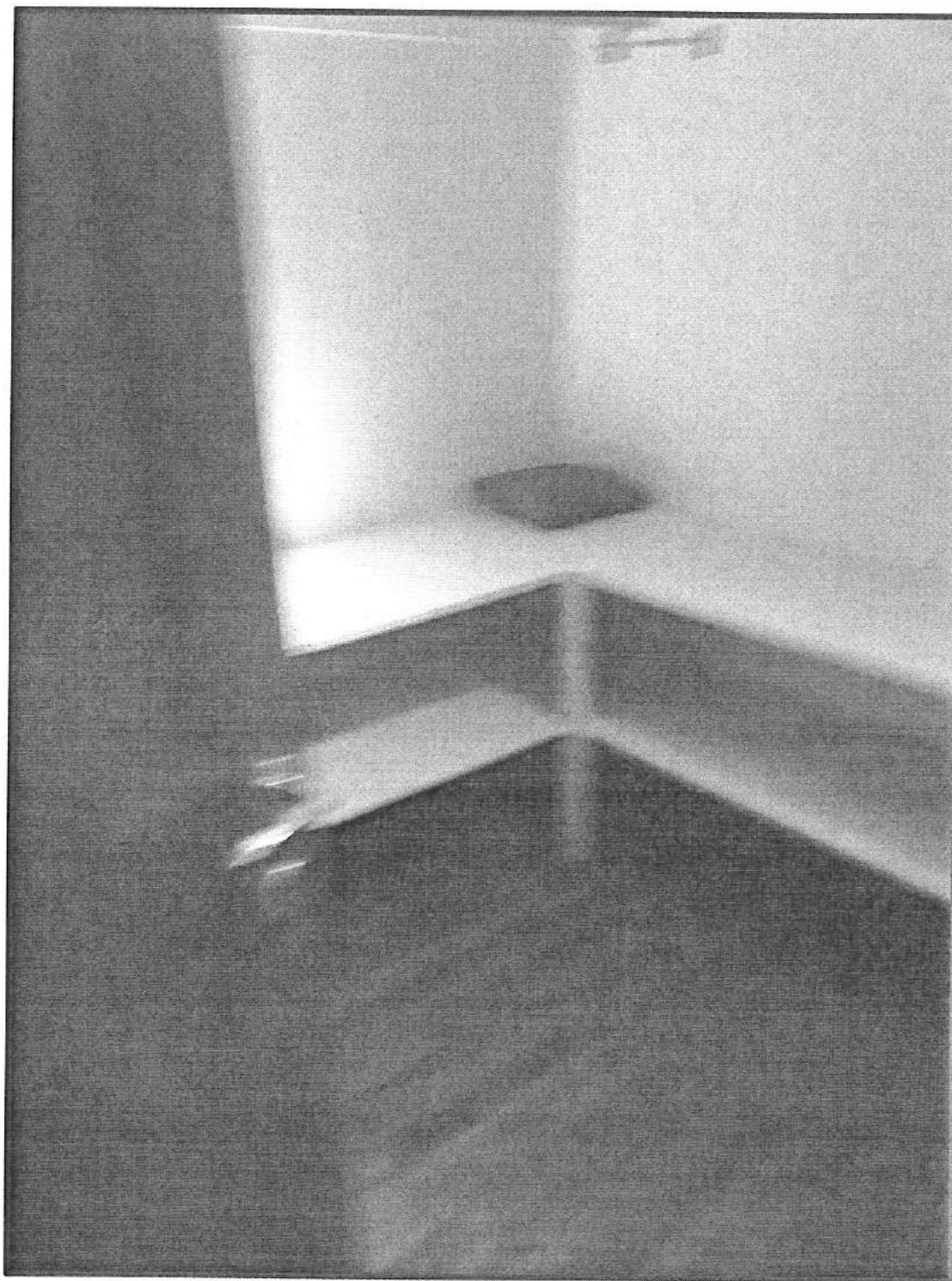
Piano Soppalco (primo) Camera singola (camera armadio)