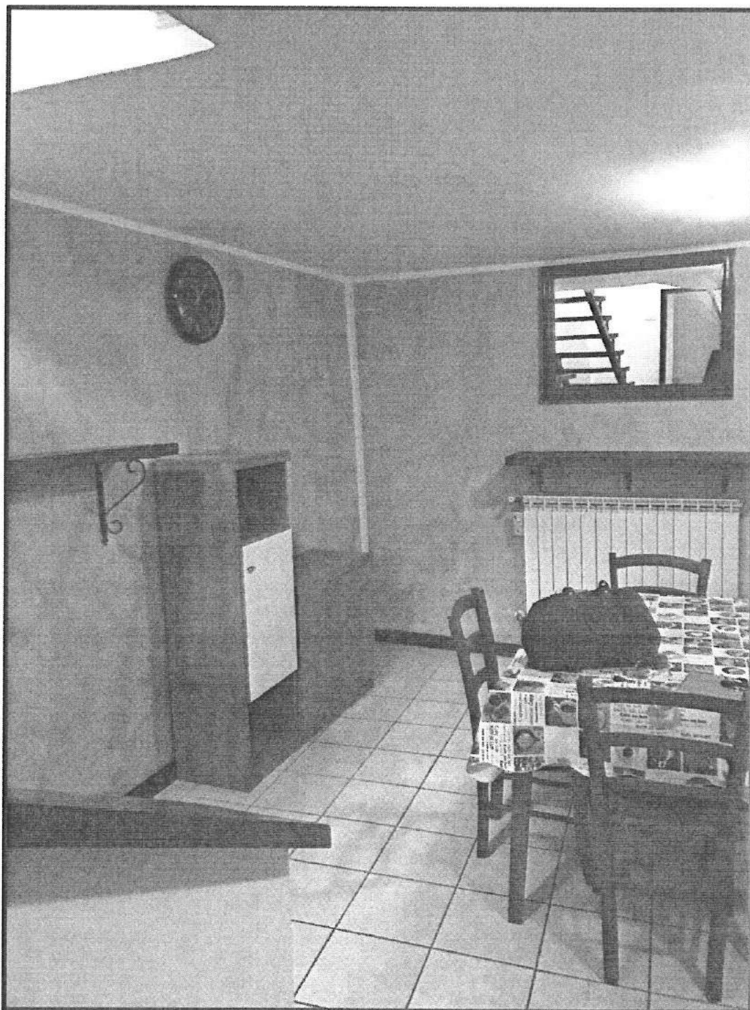
Piano Terra Angolo Soggiorno