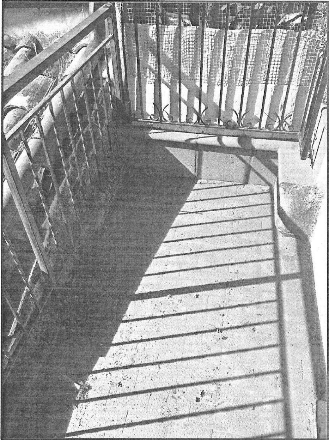
Piano Soppalco (primo) Balcone