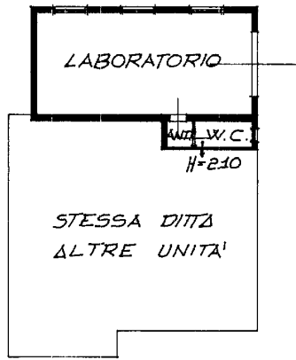
PIANTA PIANO TERRA H= 3.20