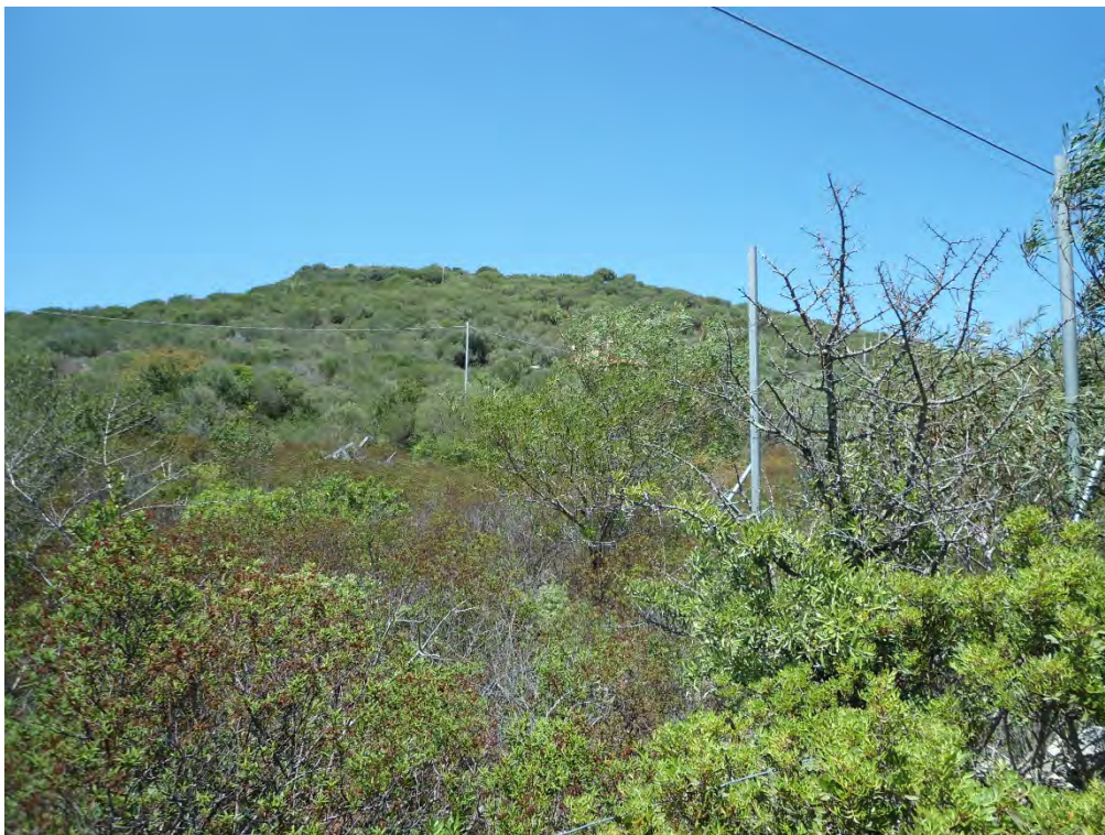
Foto n.30 – Scorcio dalla S.P. 73 del terreno di cui al foglio 18 particella 302