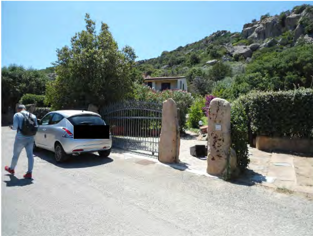
Foto n.1 – Ingresso all'interno n. 4 del corpo di fabbrica C1 (Lu Cumitoni)