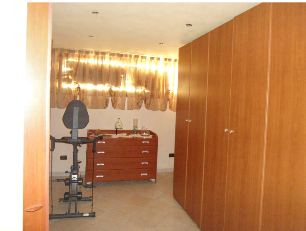
Foto n.24 – Camera guardaroba di pertinenza della camera padronale