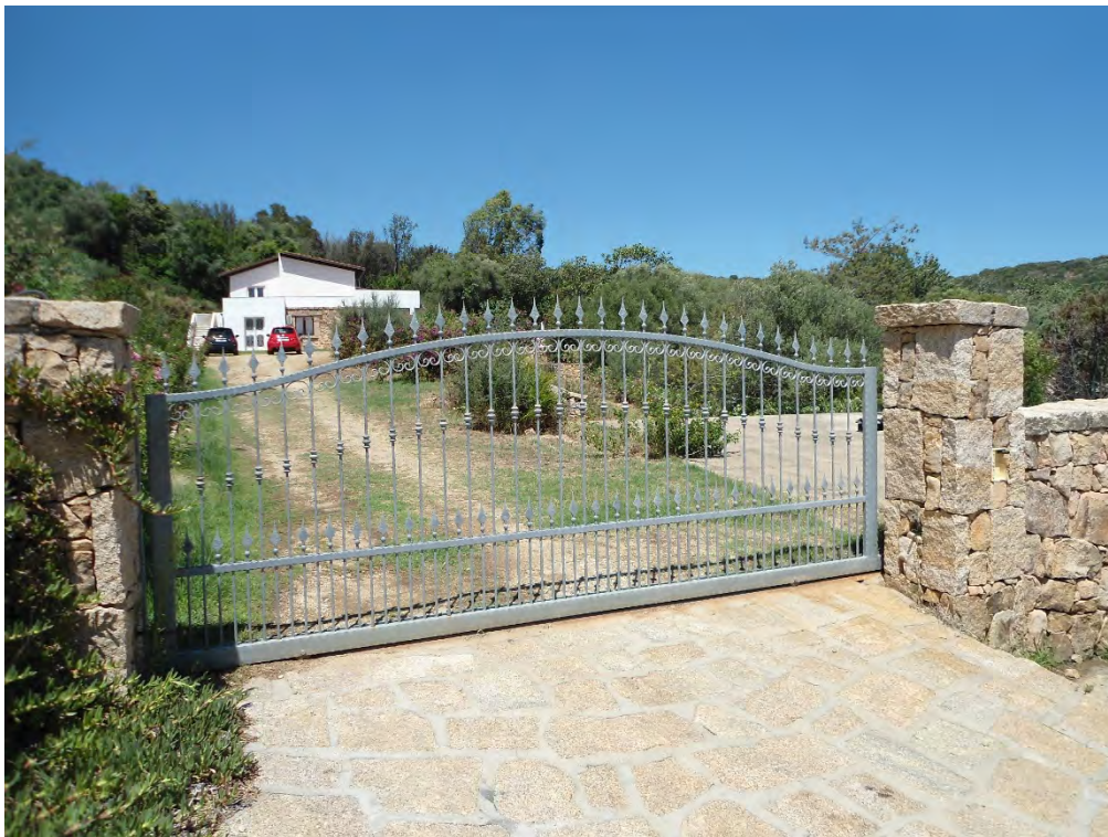
Foto n.31 – Scorcio del terreno di cui al foglio 18 particella 164