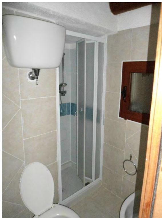
Foto n.16 – Bagno con doccia di pertinenza della camera al piano Primo