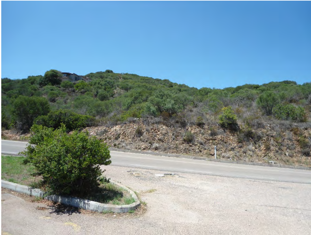
Foto n.29 – Scorcio dalla S.P. 73 del terreno di cui al foglio 18 particella 287