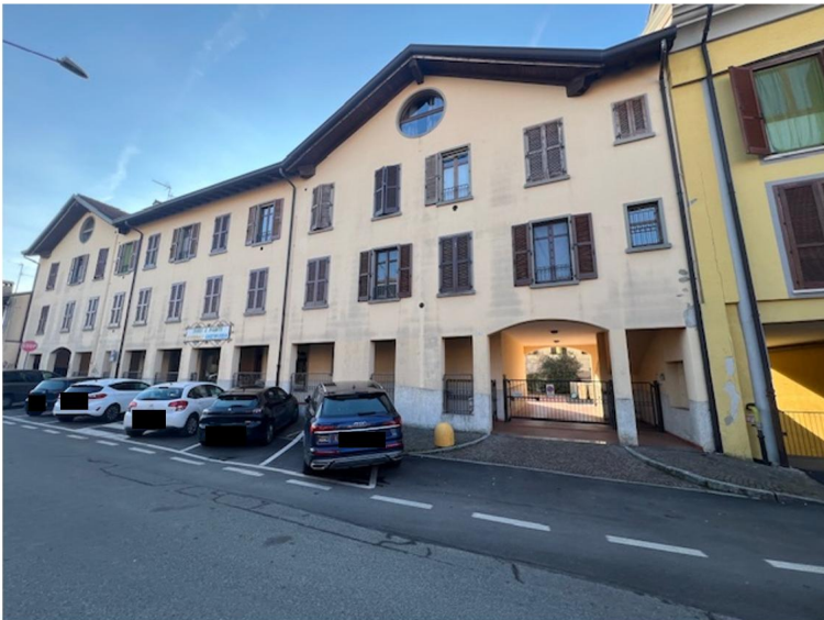
Condominio via Marconi 4