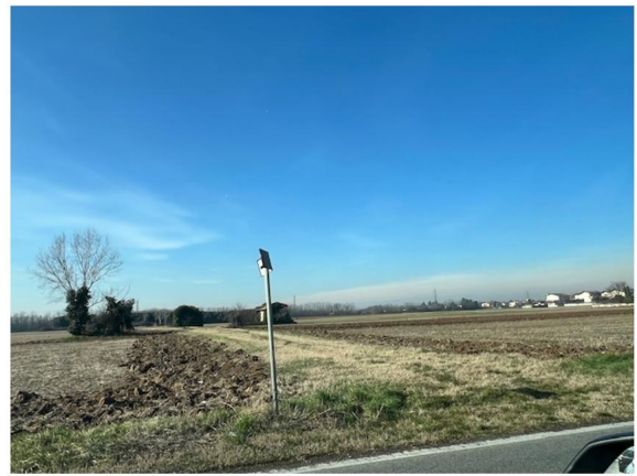
Strada campestre di accesso