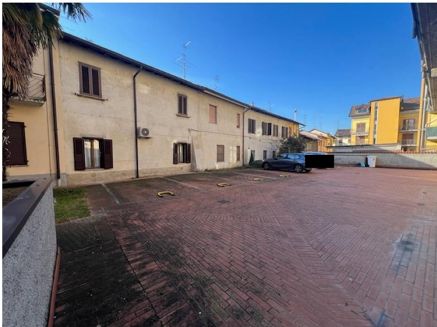
Posto auto scoperto Sub 6: primo a sinistra