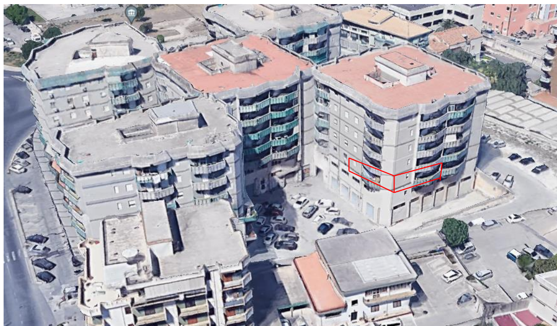
Foto_02 individuazione dell'unità immobiliare al piano primo- pal.E