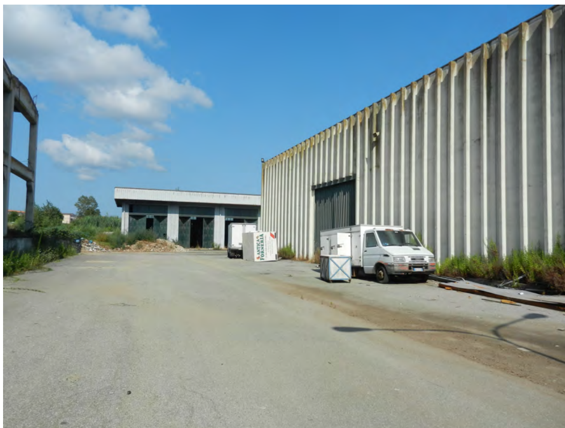
Foto 4 area interna-capannone-deposito fg. 18 p.lla 201 NCT Fg. 7 p.lla 1121