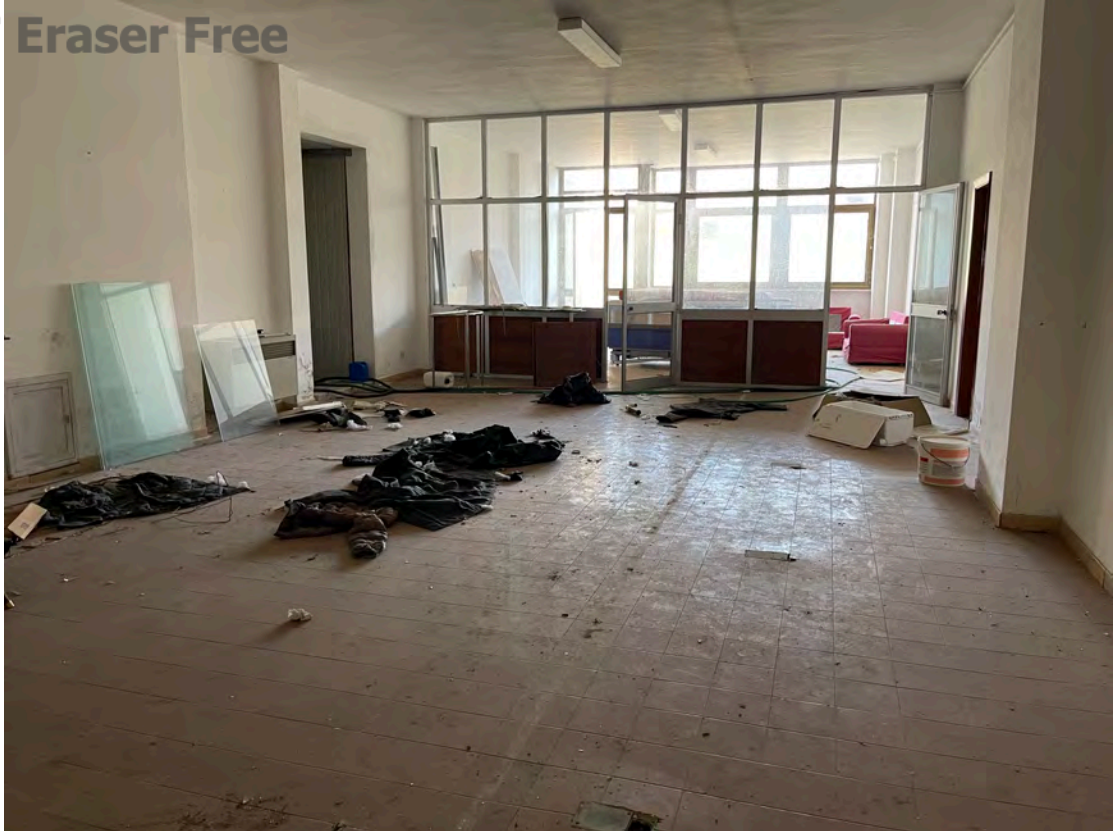
Foto 15 uffici piano terra fg. 18 - p.lla 201 NTC Fg. 7 p.lla 1121