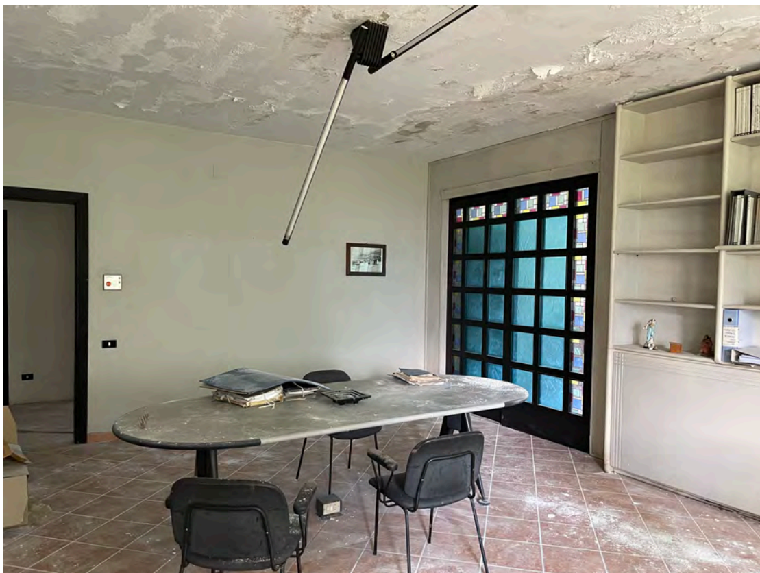
Foto 22 uffici P.T.-rialzato fg. 18 - p.lla 201 NTC Fg. 7 p.lla 1121