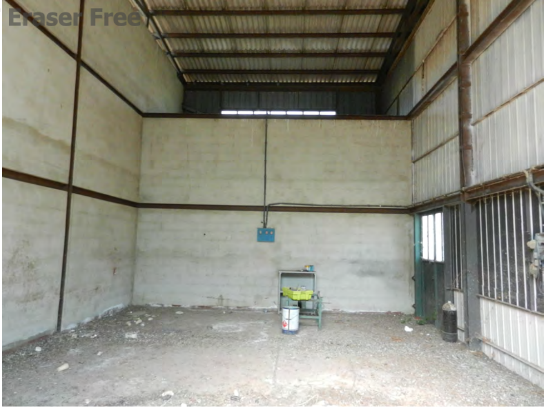
Foto 13 deposito fg. 18 - p.lla 201 NTC Fg. 7 p.lla 1121