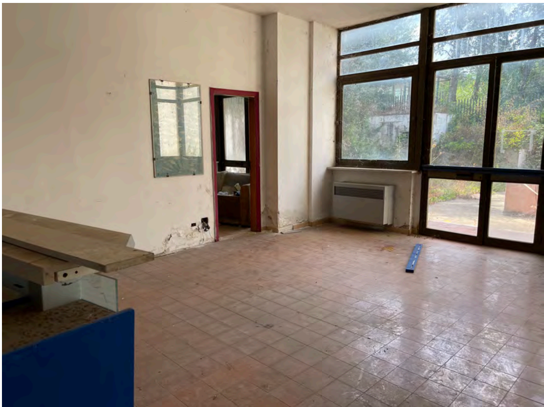
Foto 16 uffici piano terra fg. 18 - p.lla 201 NTC Fg. 7 p.lla 1121