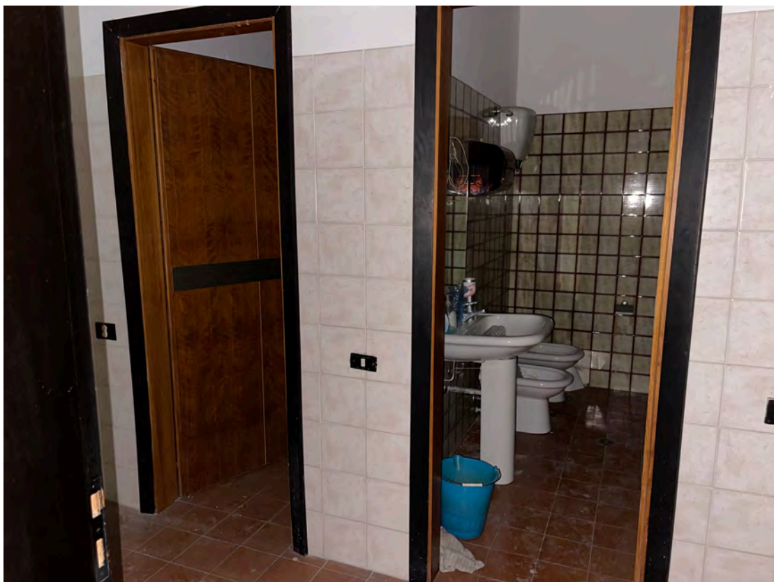
Foto 26 WC P.T.-rialzato fg. 18 - p.lla 201 NTC Fg. 7 p.lla 1121