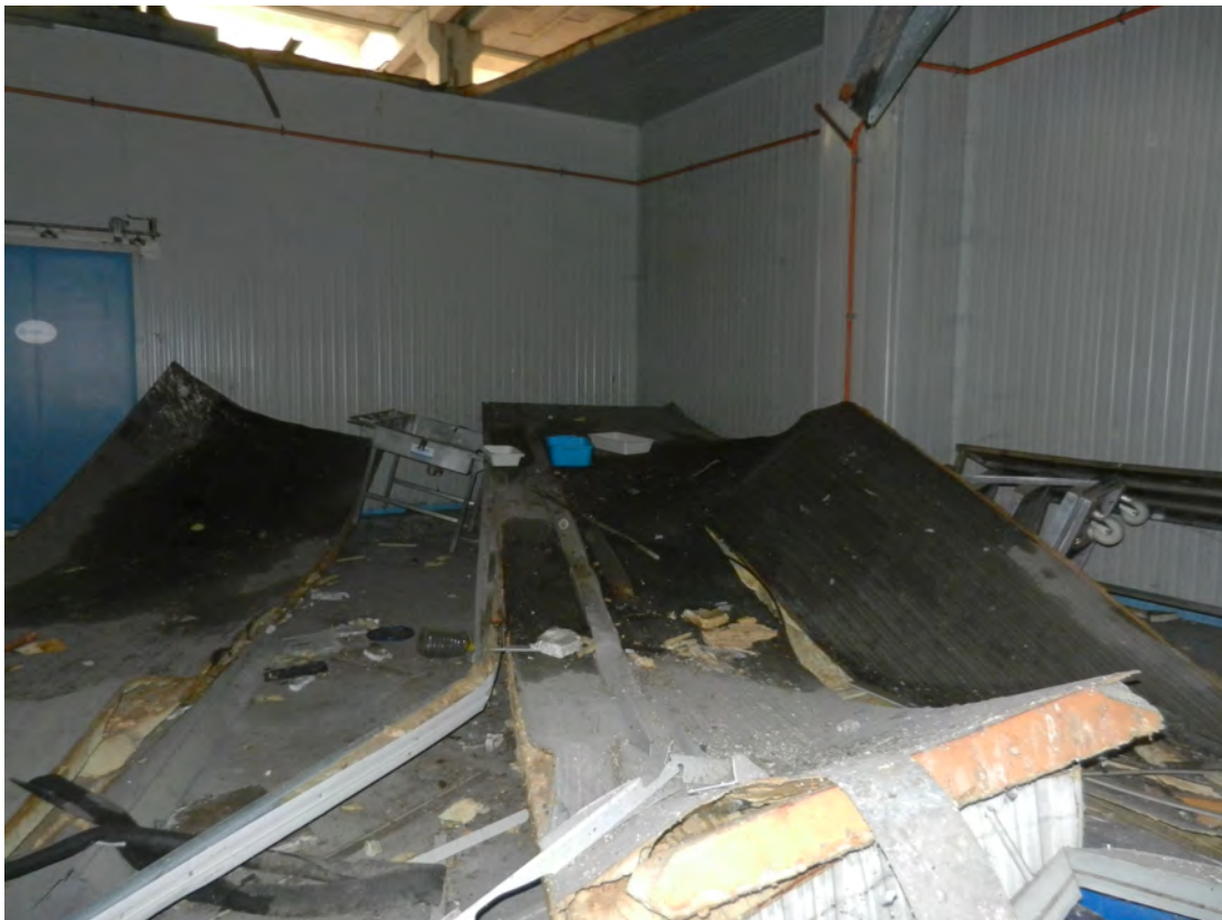
Foto 10 detriti copertura crollata fg. 18 - p.lla 201 NTC Fg. 7 p.lla 1121