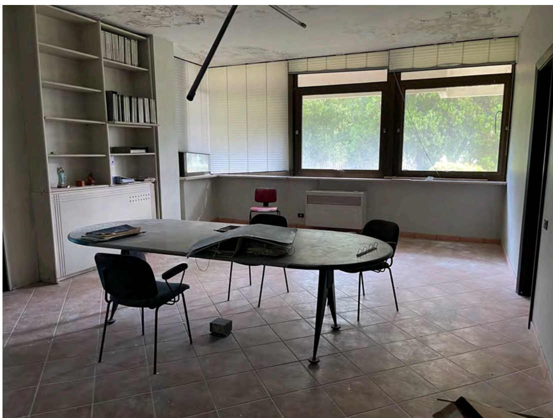
Foto 20 uffici P.T.-rialzato fg. 18 - p.lla 201 NTC Fg. 7 p.lla 1121