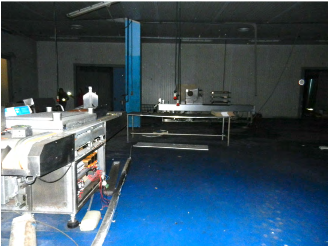
Foto 8 zona lavorazione fg. 18 - p.lla 201 NTC Fg. 7 p.lla 1121