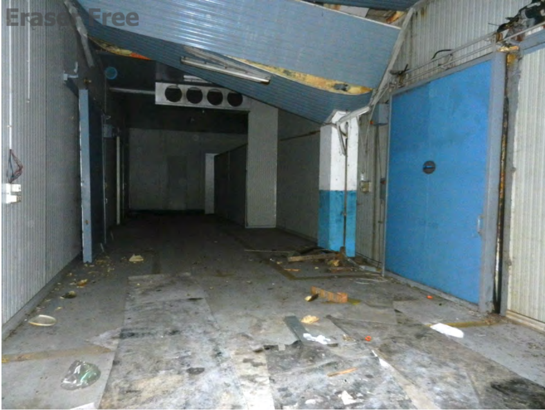
Foto 9 celle frigorifere fg. 18 - p.lla 201 NTC Fg. 7 p.lla 1121