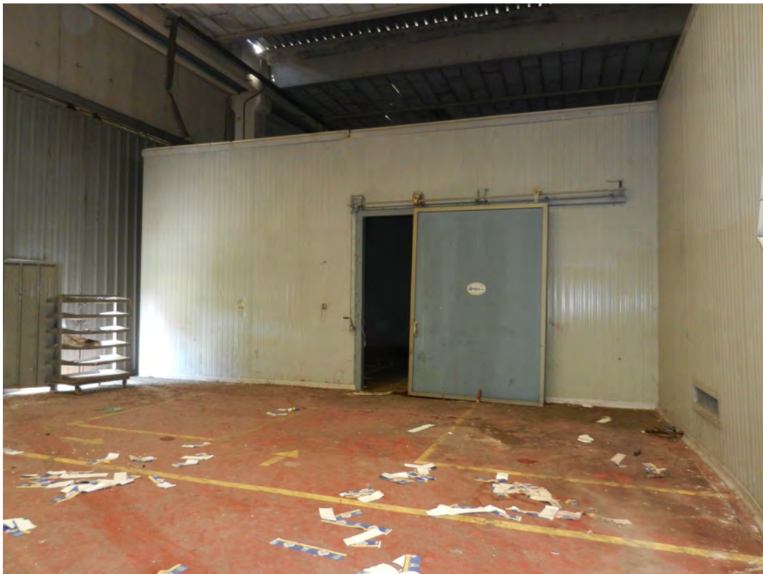
Foto 12 celle di conservazione prodotti fg. 18 - p.lla 201 NTC Fg. 7 p.lla 1121