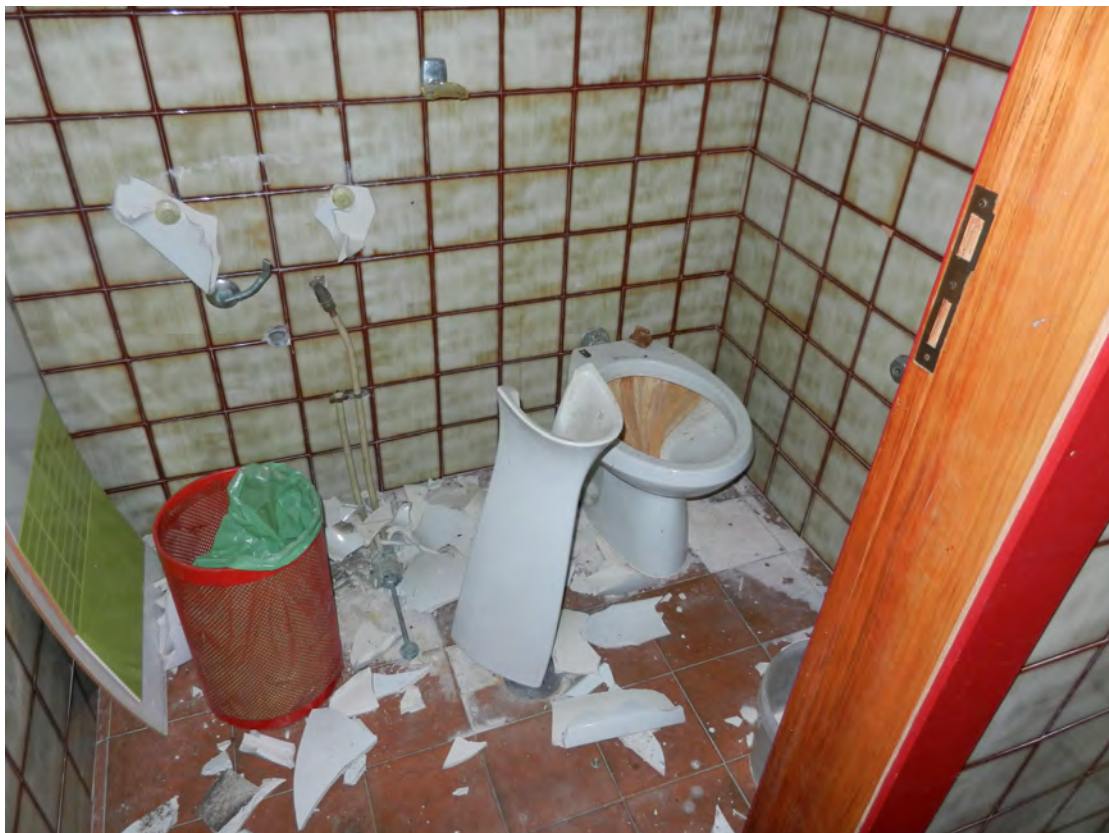
Foto 18 bagni piano terra fg. 18 - p.lla 201 NTC Fg. 7 p.lla 1121