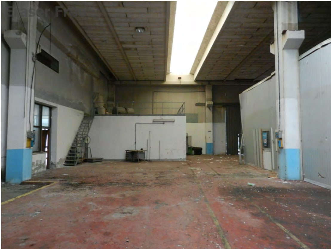
Foto 11 zona carico e scarico merci fg. 18 - p.lla 201 NTC Fg. 7 p.lla 1121