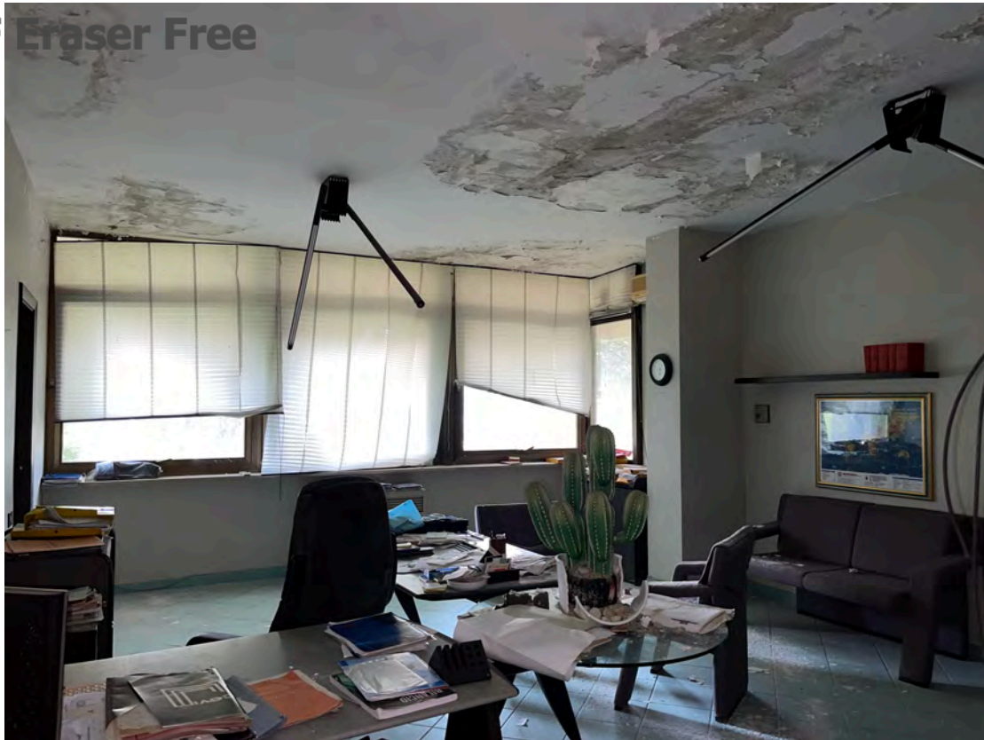
Foto 25 uffici fg. 18 - p.lla 201 NTC Fg. 7 p.lla 1121