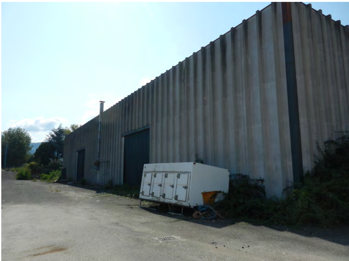
Foto 6 capannone fg. 18 - p.lla 201 NTC Fg. 7 p.lla 1121