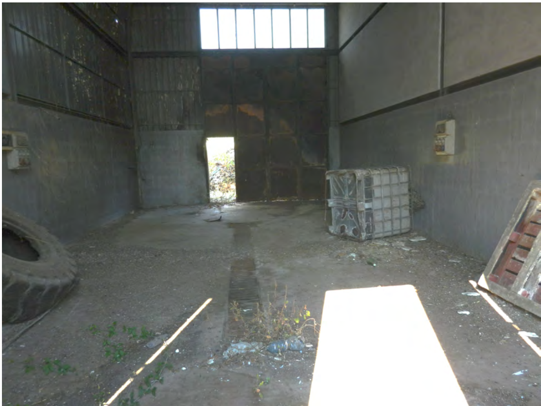
Foto 14 deposito fg. 18 - p.lla 201 NTC Fg. 7 p.lla 1121