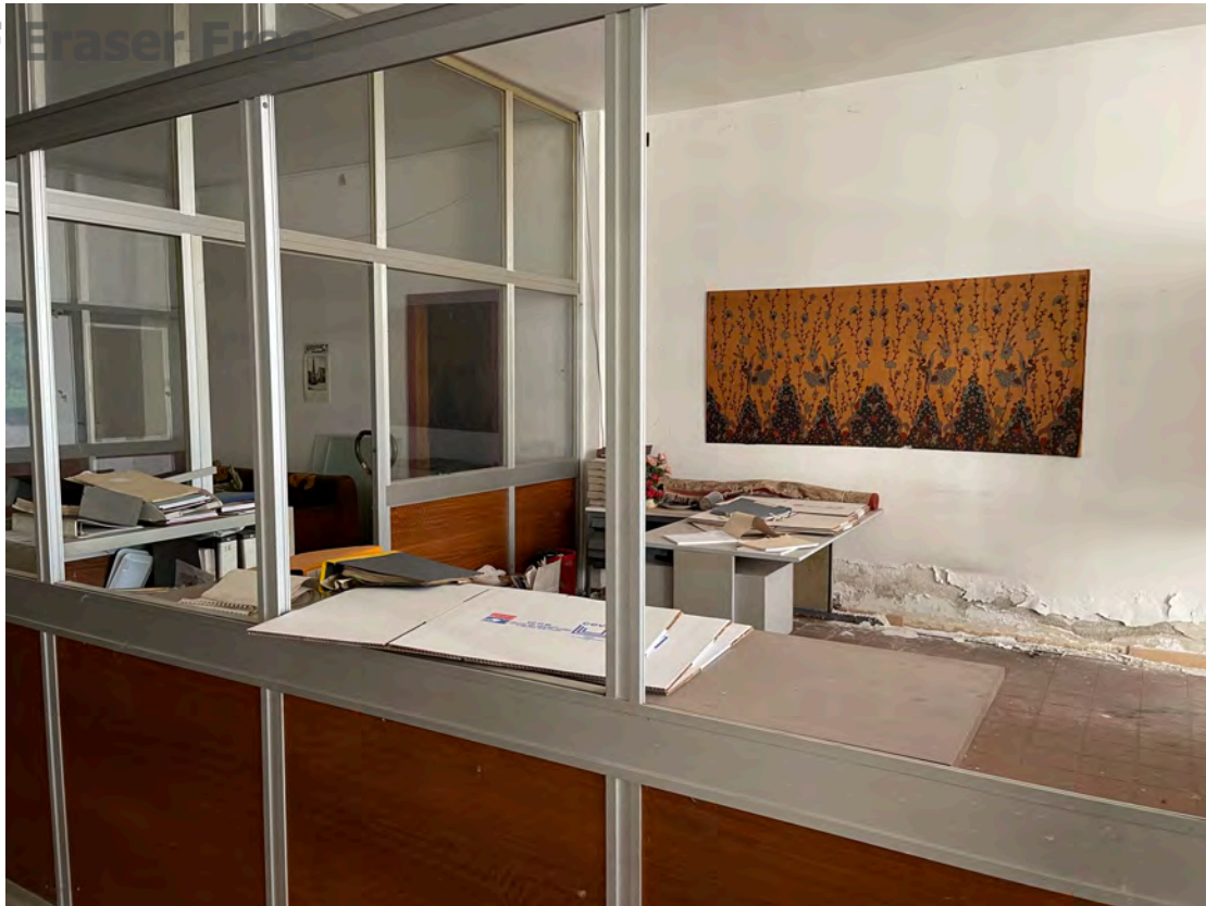
Foto 17 uffici piano terra fg. 18 - p.lla 201 NTC Fg. 7 p.lla 1121