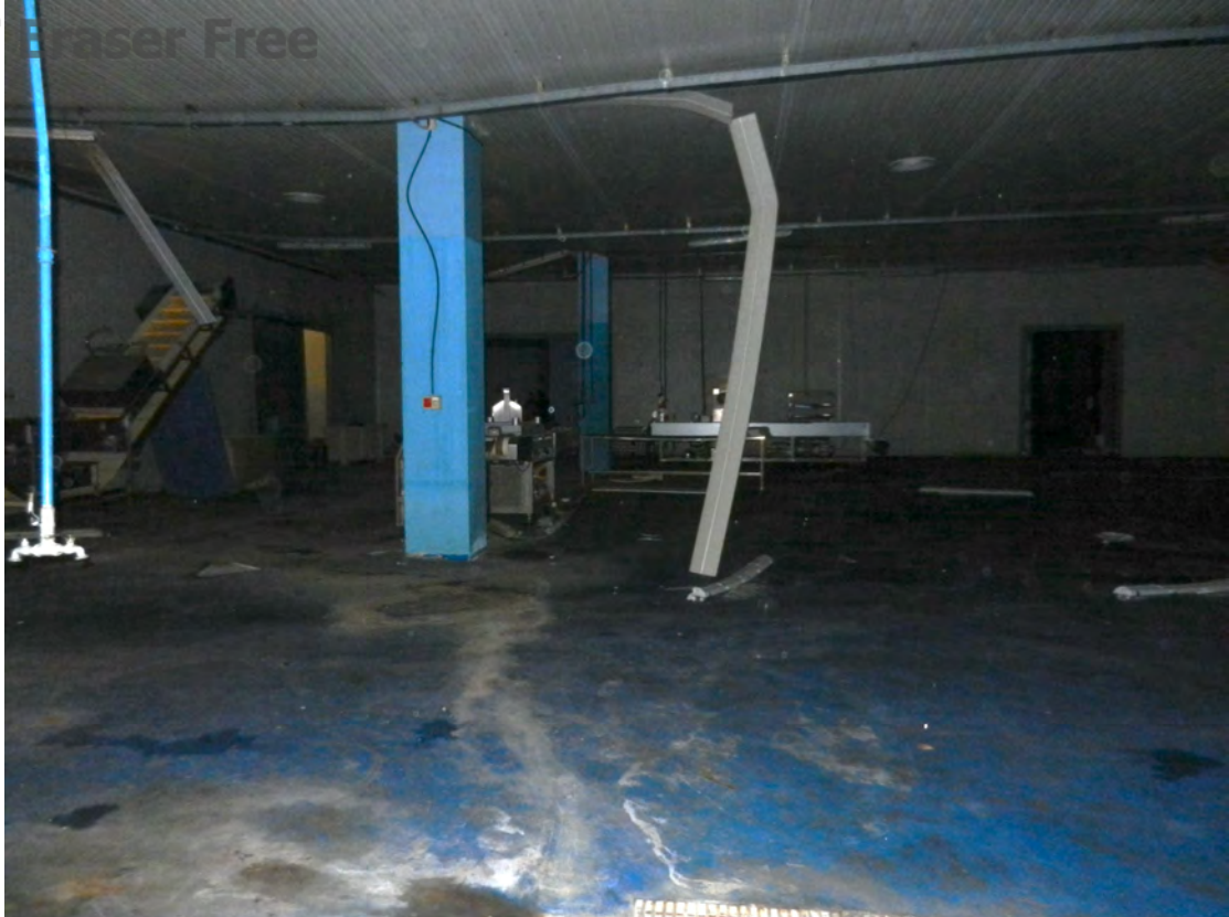
Foto 7 zona lavorazione fg. 18 - p.lla 201 NTC Fg. 7 p.lla 1121