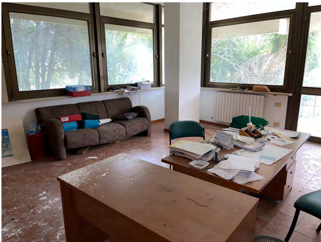
Foto 24 uffici P.T.-rialzato fg. 18 - p.lla 201 NTC Fg. 7 p.lla 1121