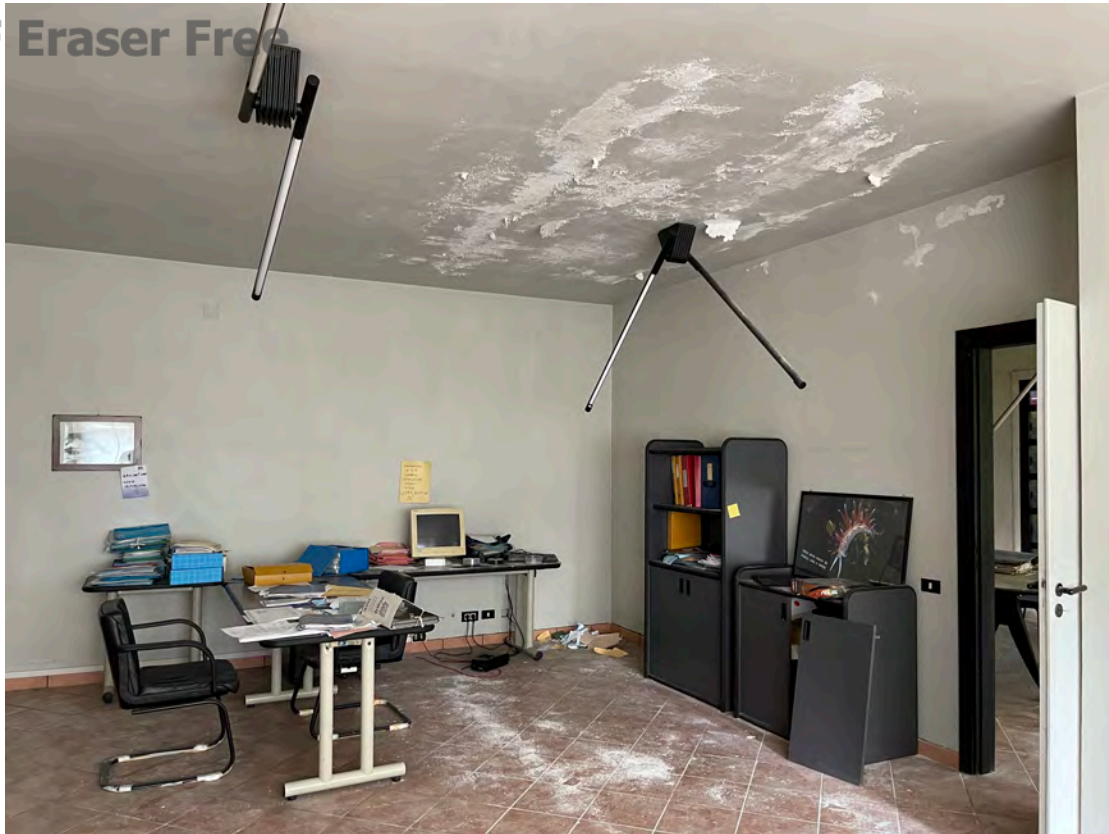
Foto 21 uffici P.T.-rialzato fg. 18 - p.lla 201 NTC Fg. 7 p.lla 1121