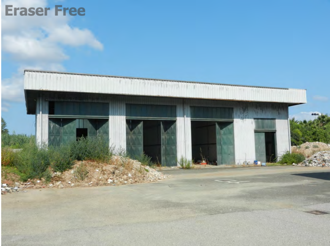
Foto 5 deposito fg. 18 - p.lla 201 NTC Fg. 7 p.lla 1121