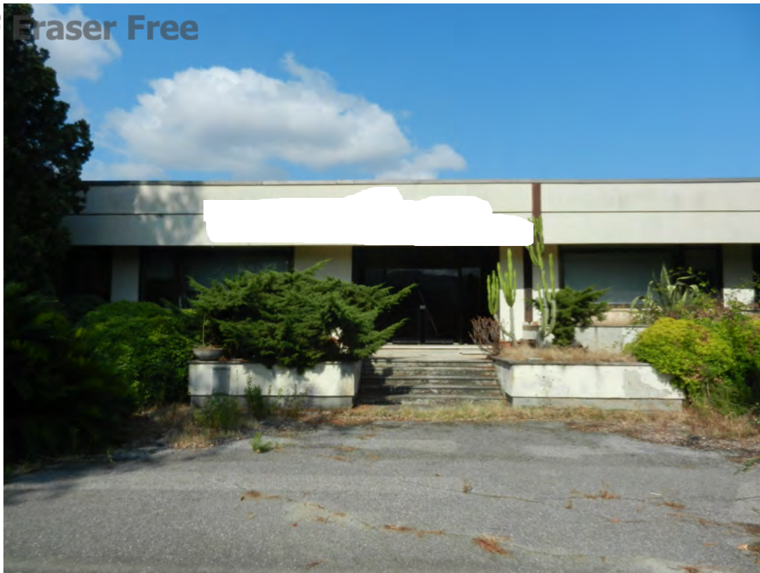
Foto 3 ingresso uffici - fg. 18 - p.lla 201 NTC Fg. 7 p.lla 1121