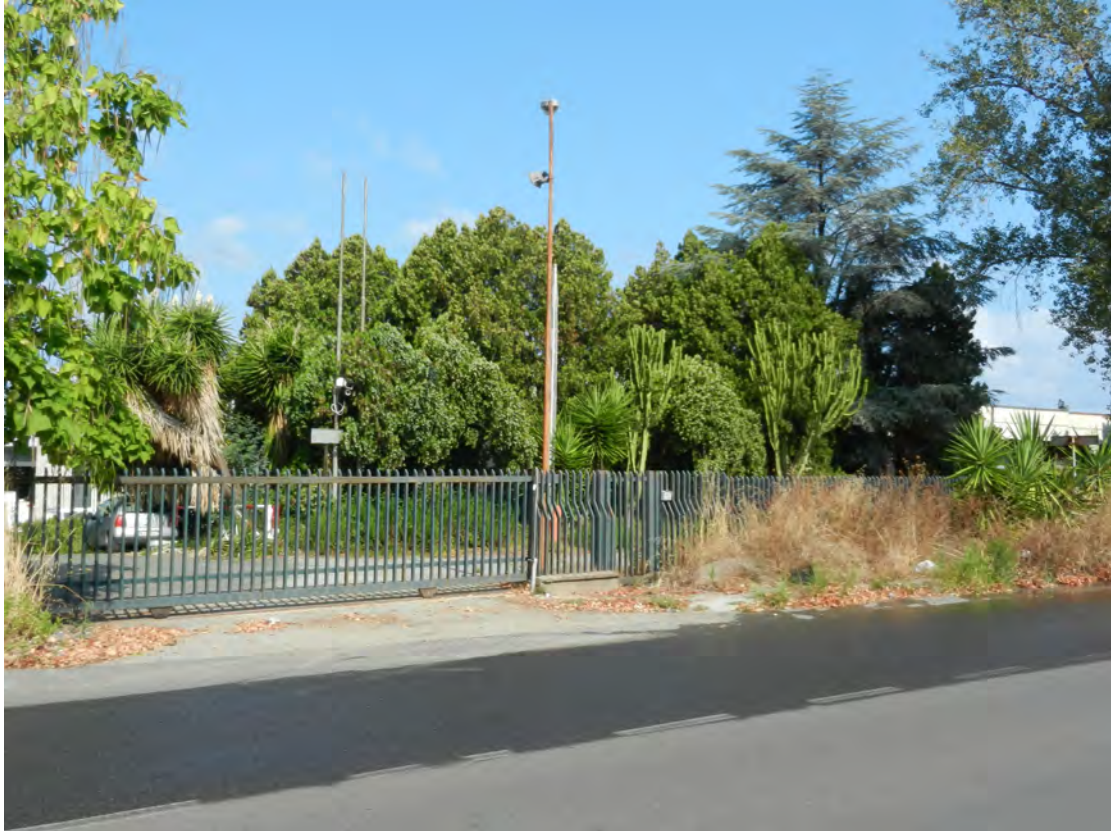
Foto 1 corte – ingresso area fg. 18 - p.lla 201 NTC Fg. 7 p.lla 1121