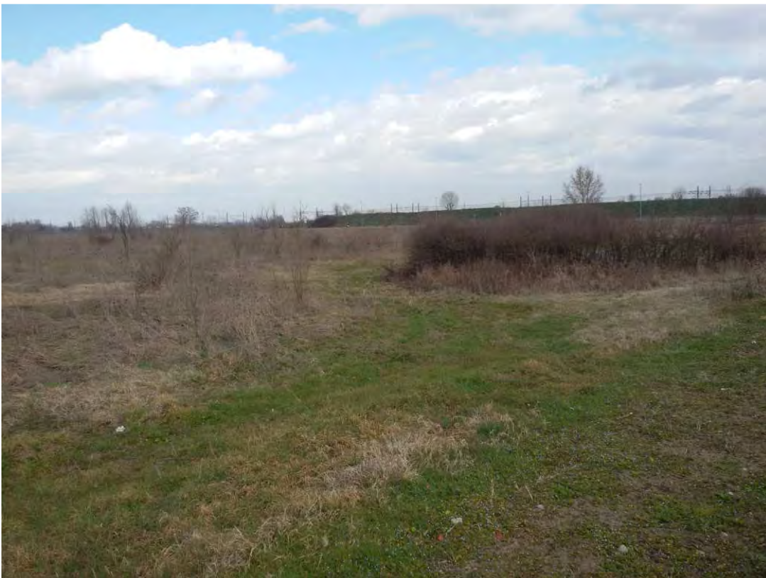
4. Area Fabbricabile.