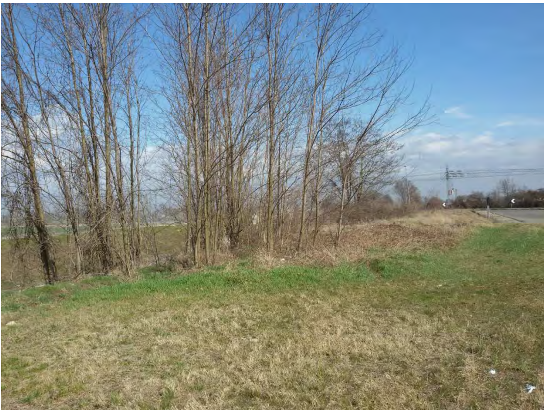
8. Area a verde pubblico.