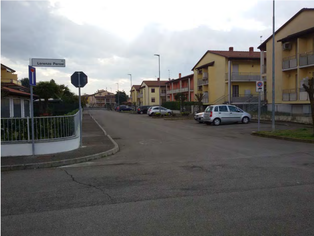
21. Area convenzionata – strada.