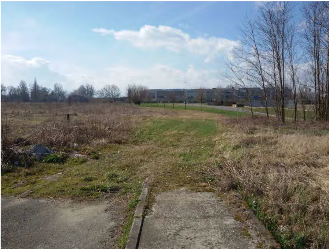
6. Area fabbricabile.