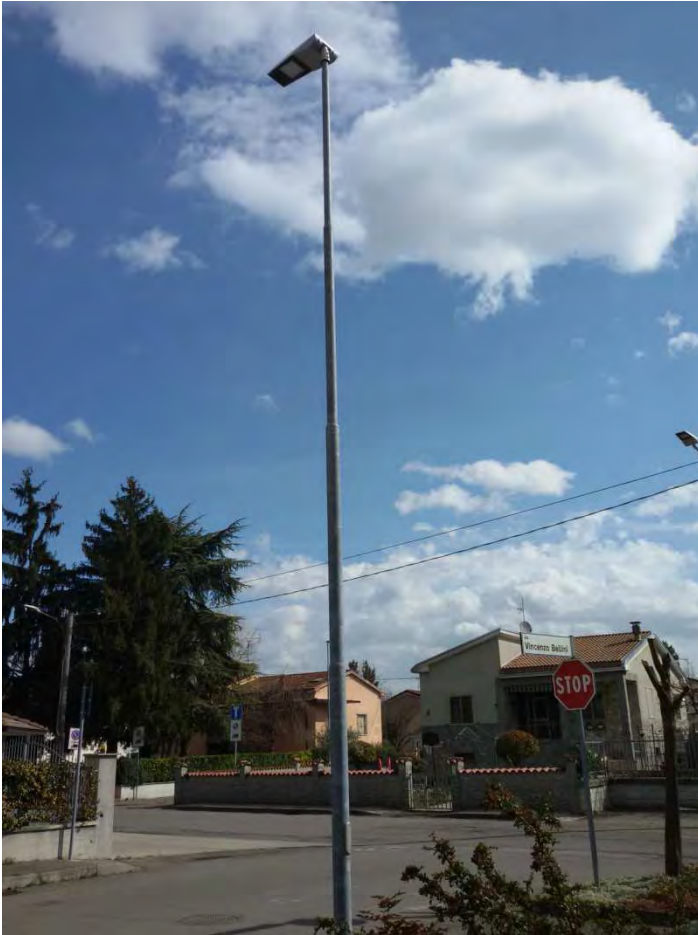
23. Particolare lampione illuminazione pubblica su area convenzionata