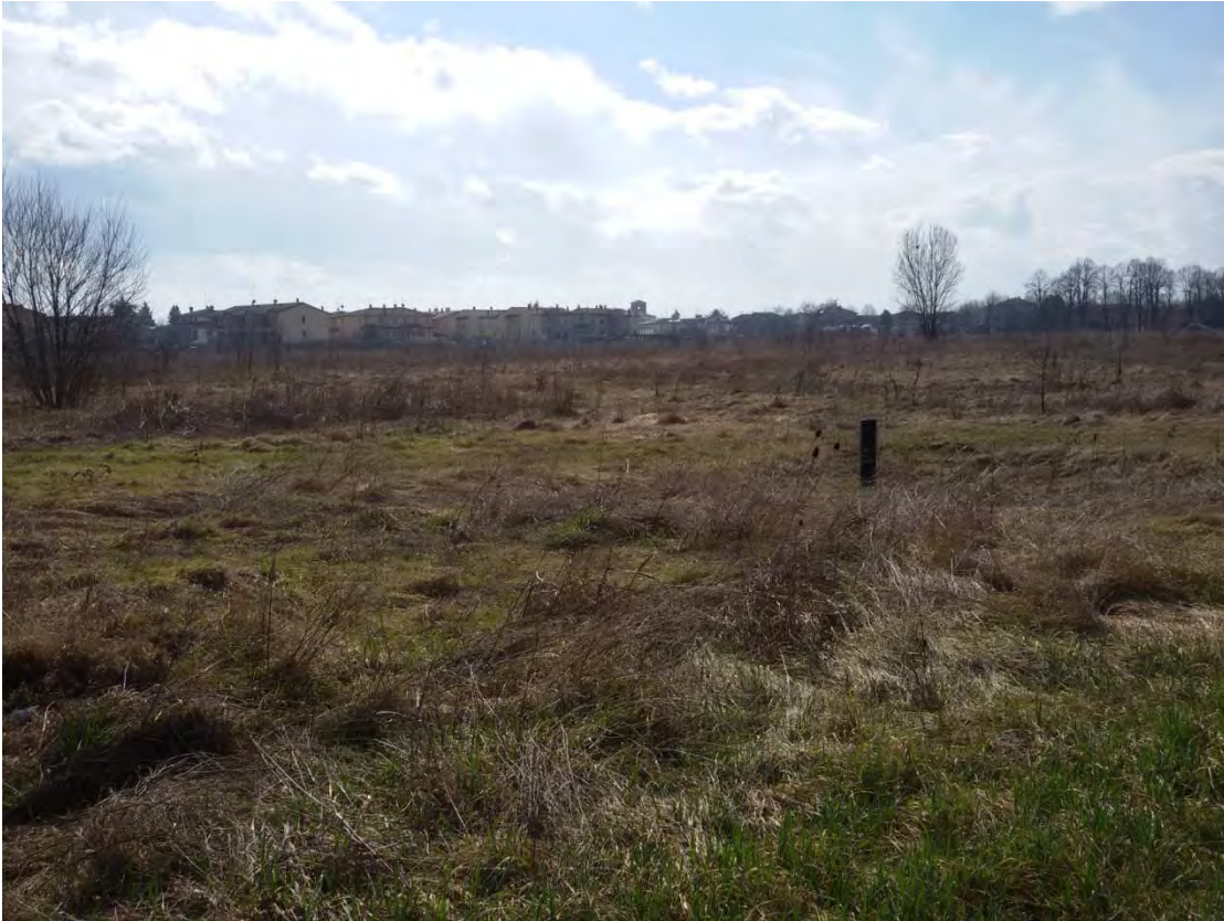
7. Area fabbricabile.