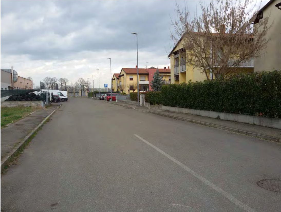
17. Area convenzionata – strada.