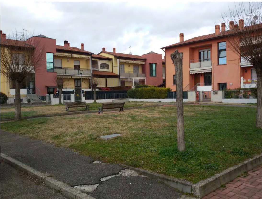
18. Area convenzionata – aiuola.