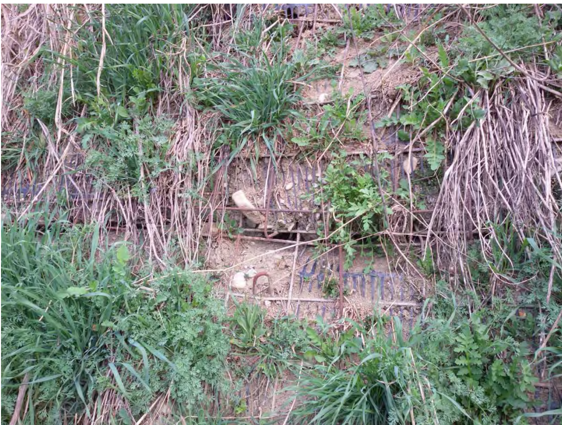
14. Particolare barriera antirumore.