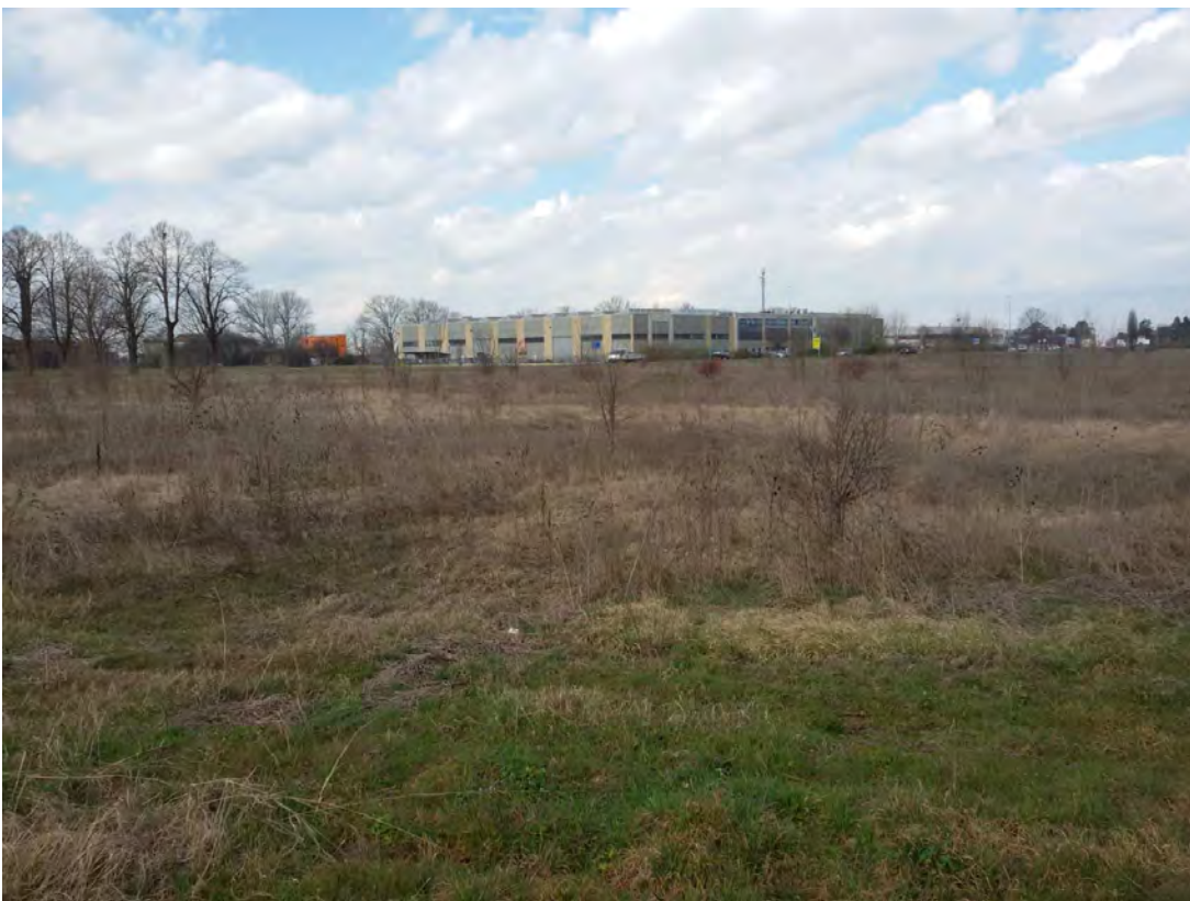
2. Area Fabbricabile.