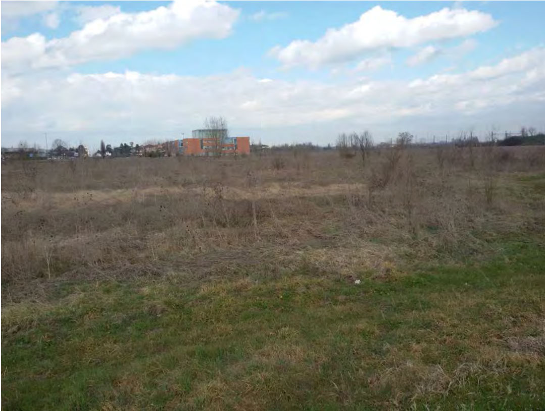
3. Area fabbricabile.