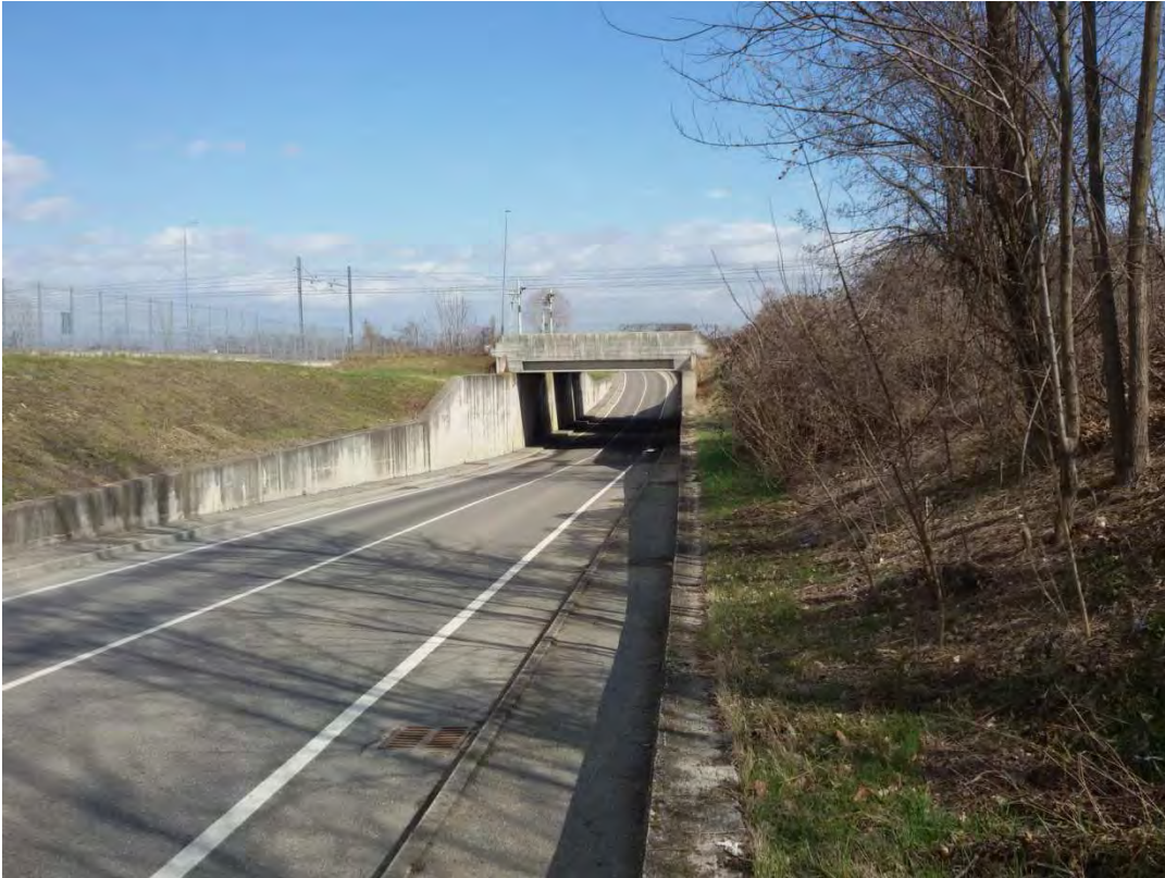
9. Area a verde pubblico – mapp. 712 occupato da strada provinciale.