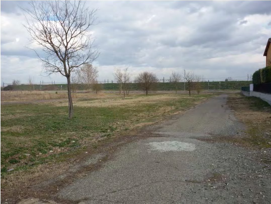
5. Area fabbricabile – mapp. 947 e 948 occupati da ex pista ciclismo.