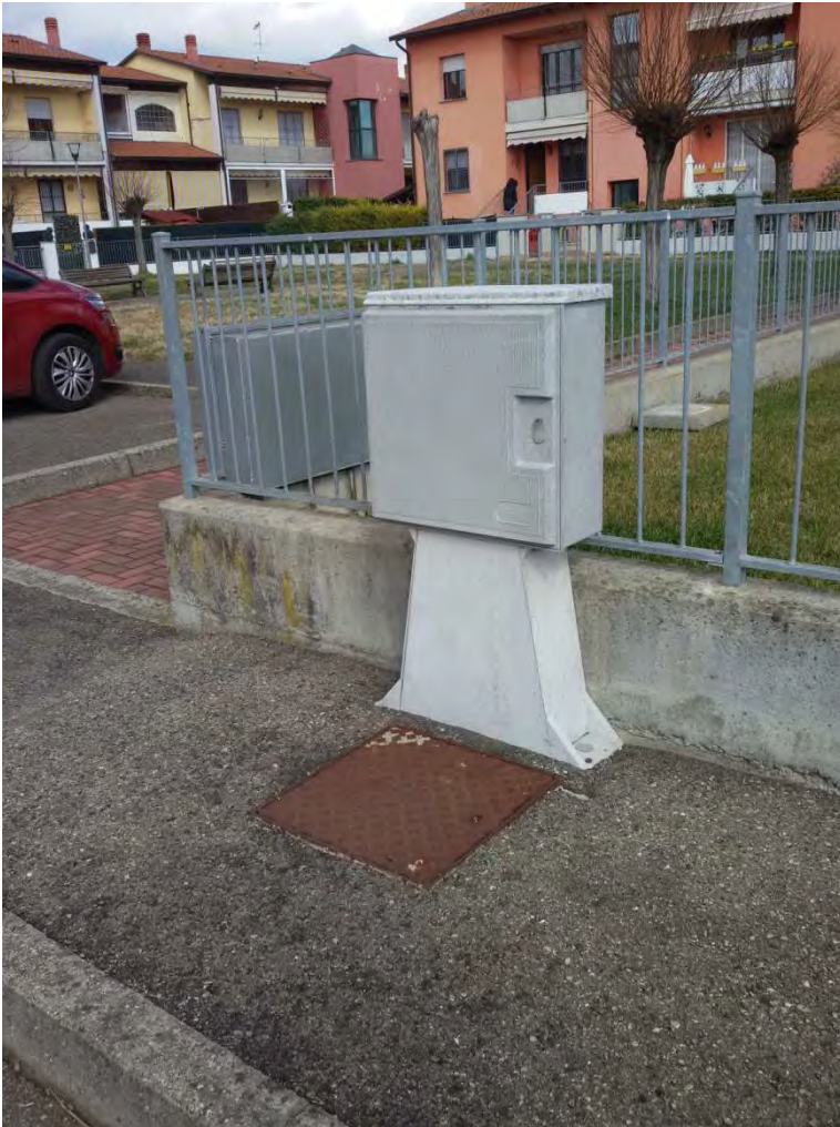
25. Particolare reti tecnologiche pubbliche su area convenzionata