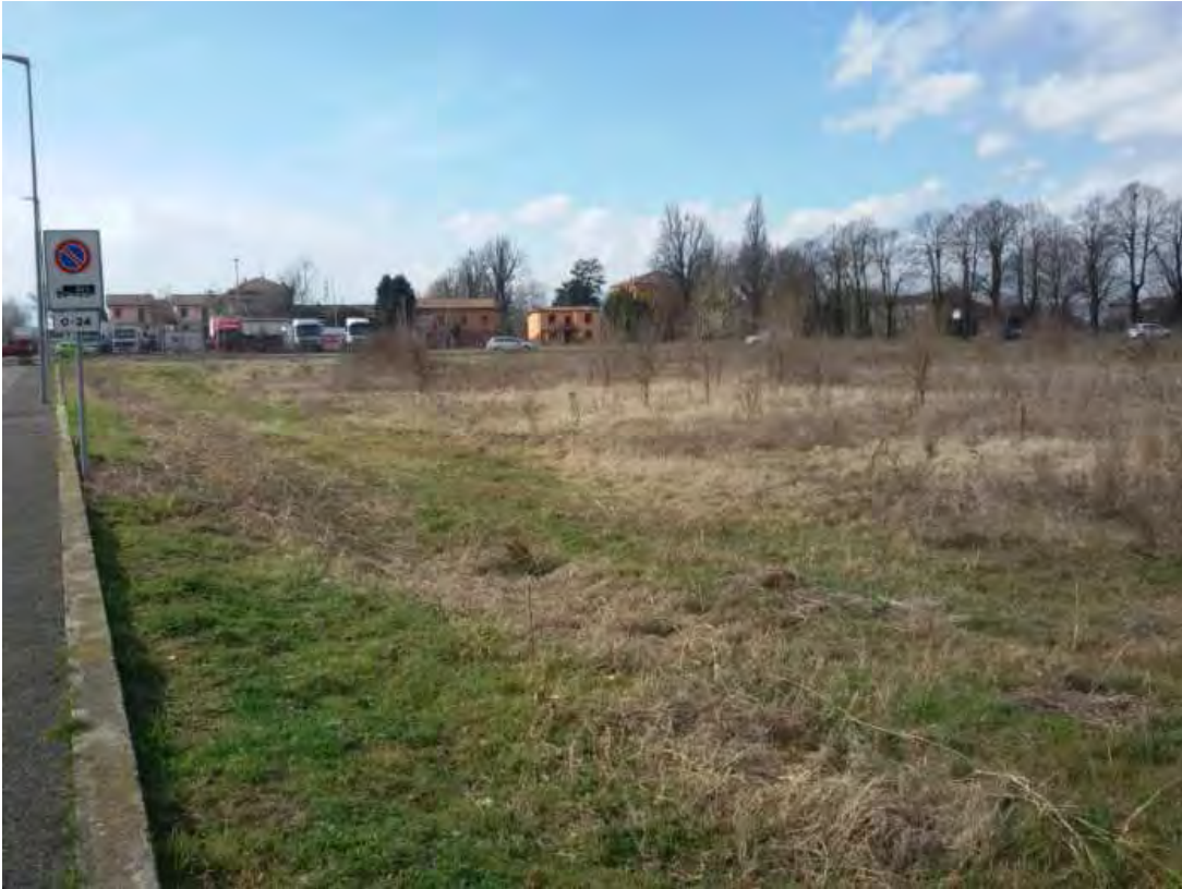
1. Area fabbricabile.