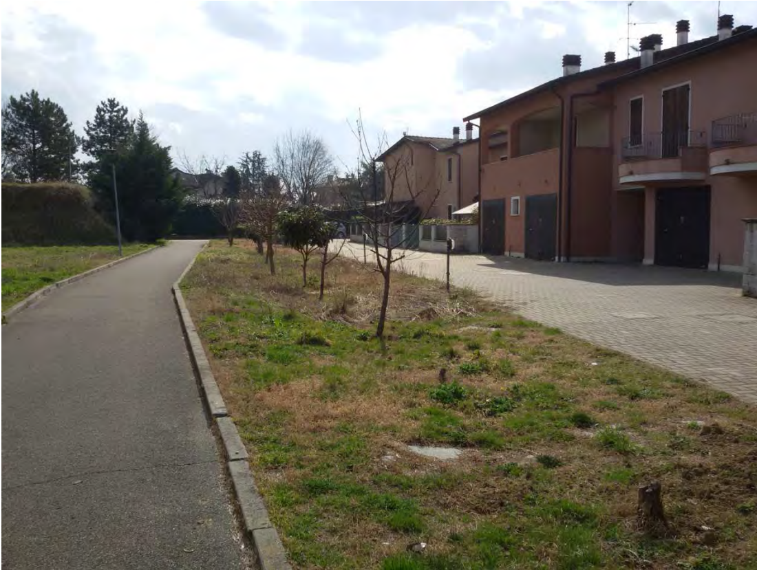
15. Area convenzionata – aiuola.