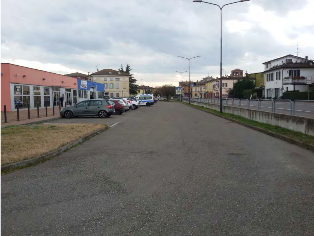
19. Area convenzionata – strada.