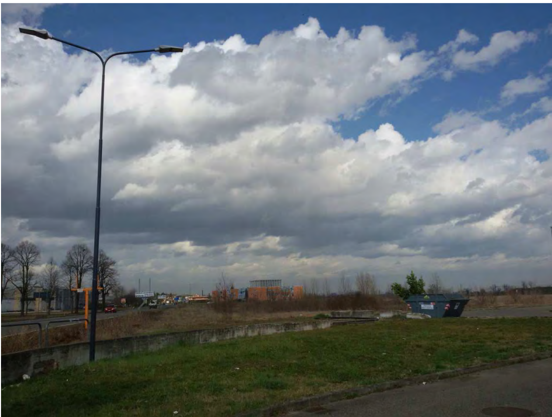
20. Area convenzionata - aiuola