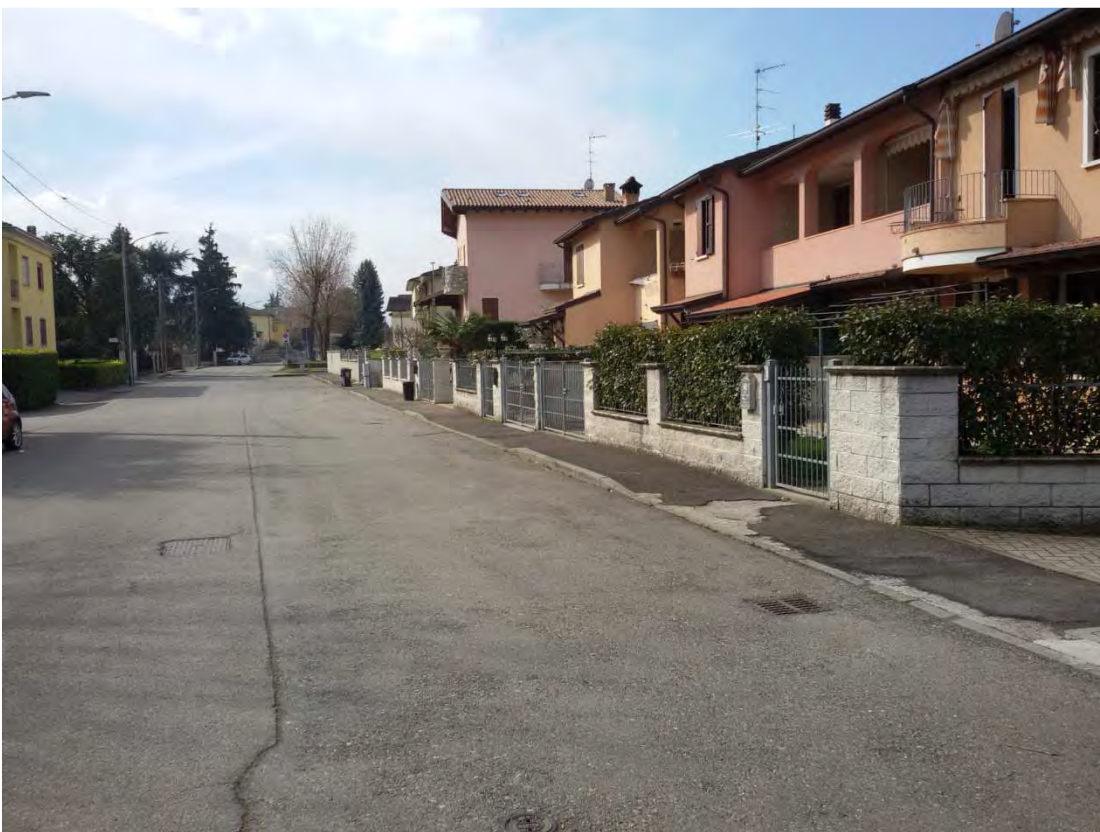
16. Area convenzionata – parcheggi e marciapiede.