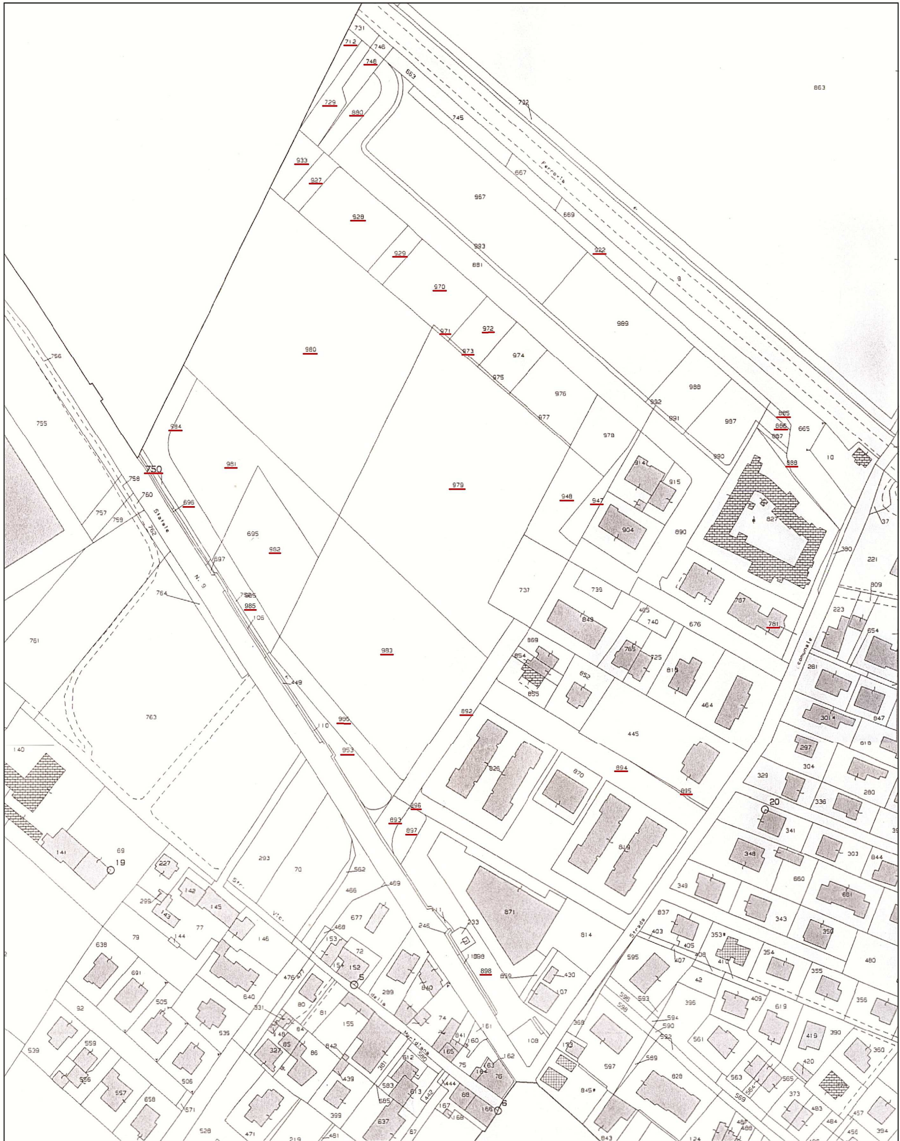
Estratto da foglio catastale n.30 Scala 1:2000