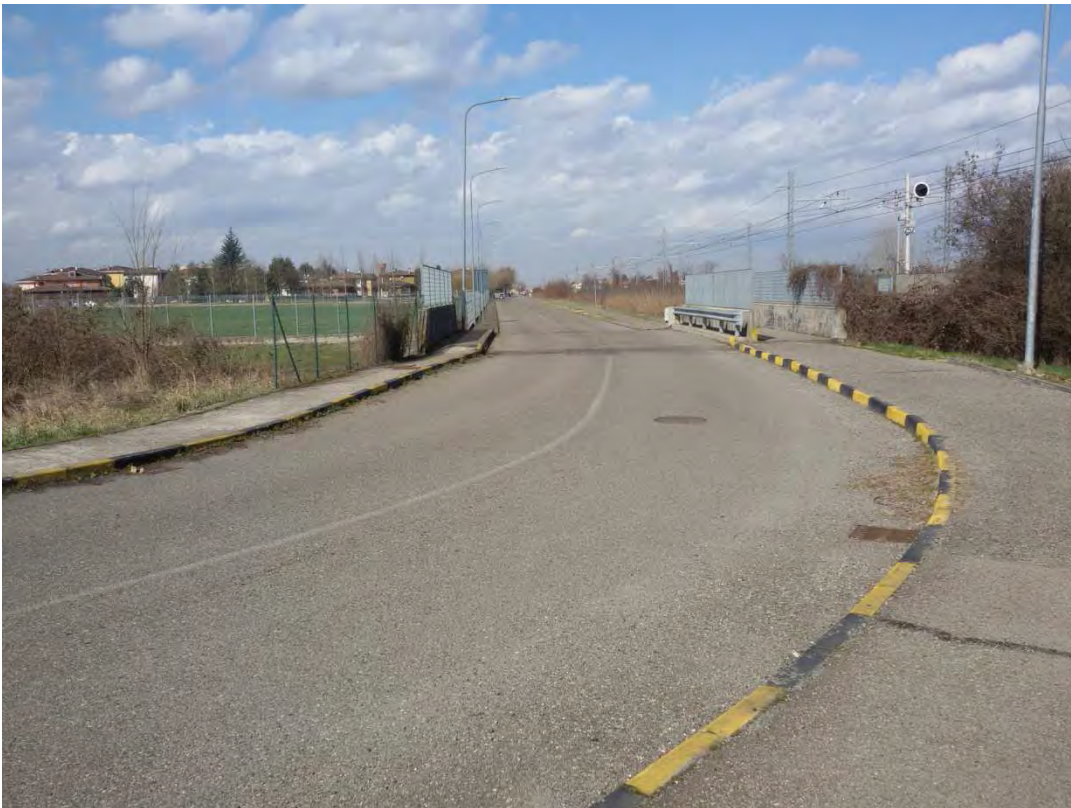
10. Area a verde pubblico – mapp. 729, 748, 880 occupati da via Paganini.