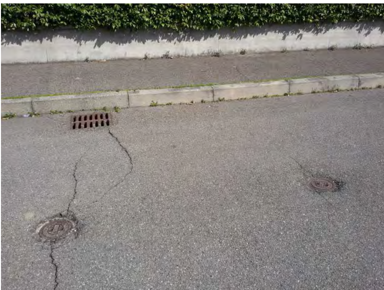
24. Particolare tombini reti tecnologiche pubbliche su area convenzionata