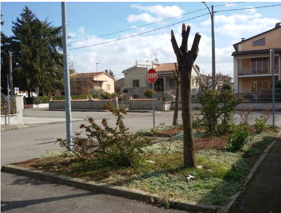
22. Area convenzionata - aiuola.