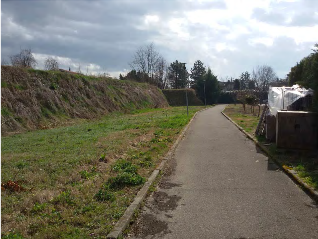
13. Area convenzionata – barriera antirumore.