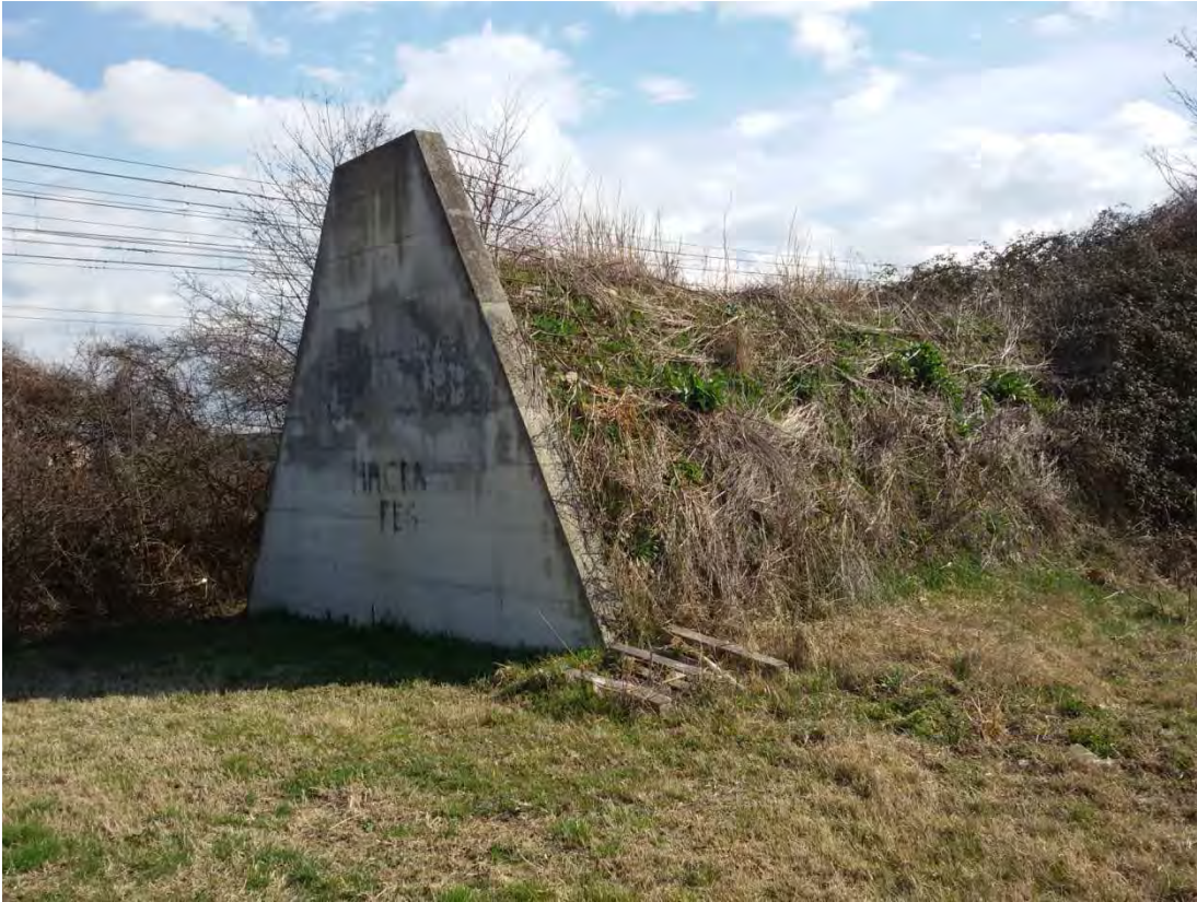
11. Area convenzionata – barriera antirumore.