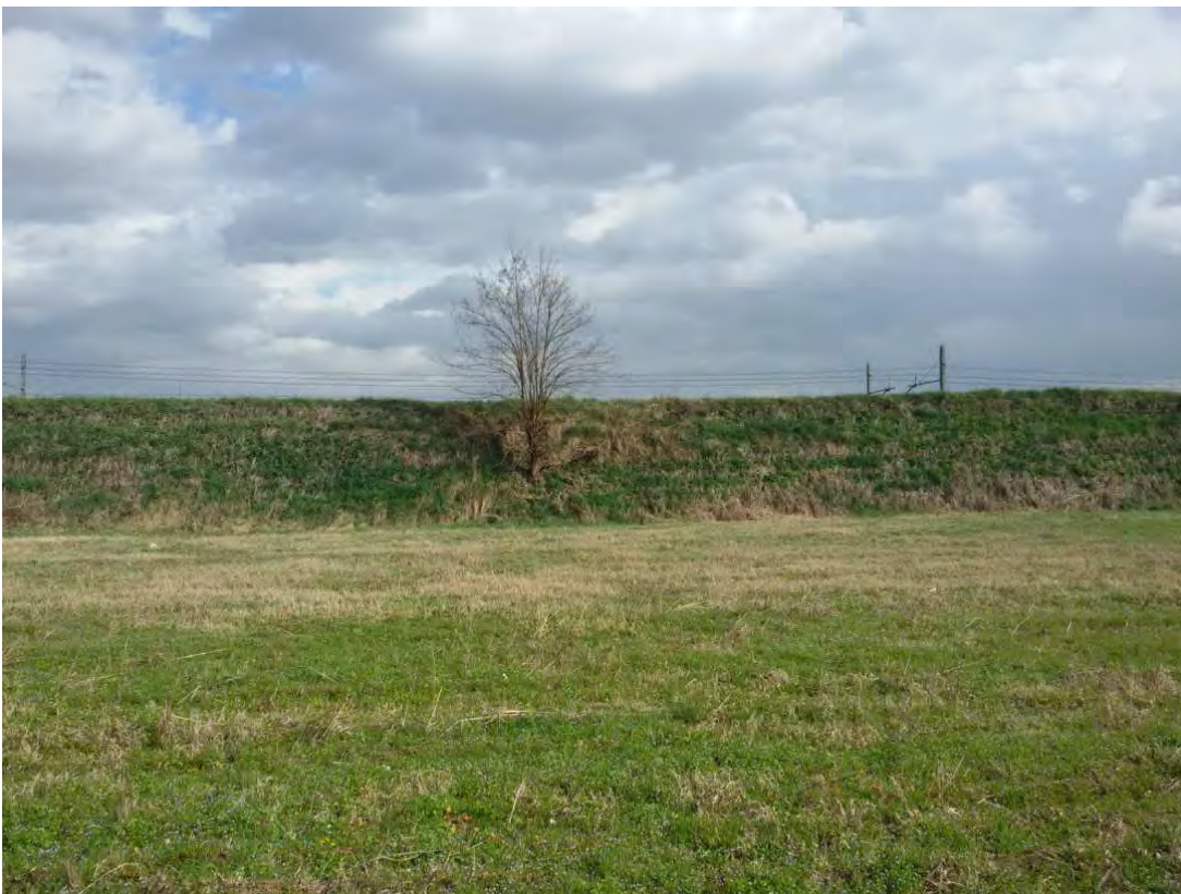
12. Area convenzionata – barriera antirumore.