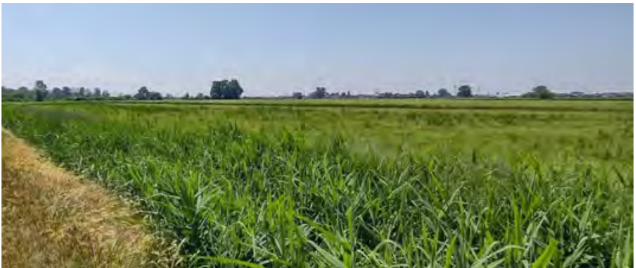
TERRENO 1 - Foglio 8 / Mappale 163