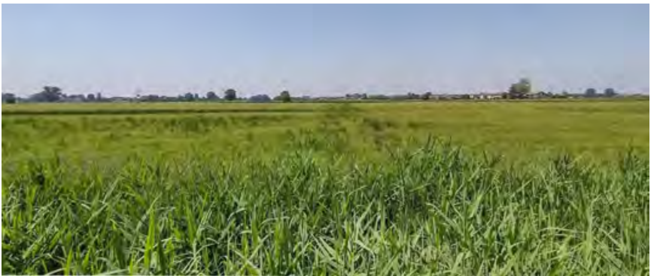
TERRENO 1 - Foglio 8 / Mappale 163