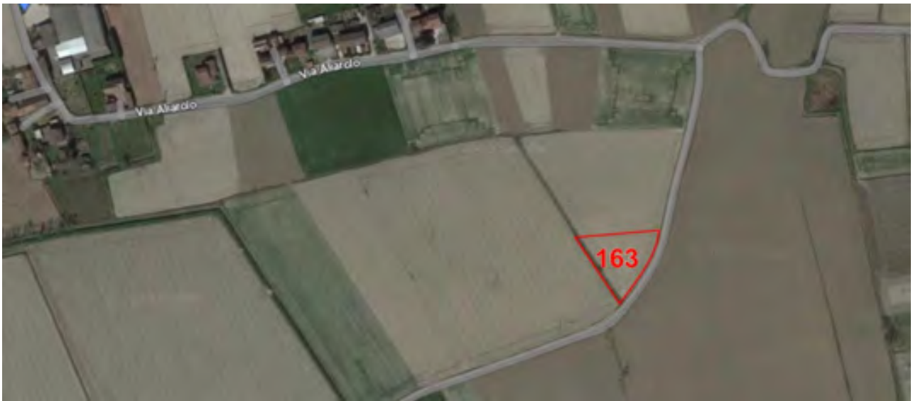
DETTAGLIO VISTA AEREA TERRENO 1/MAPPALE 163