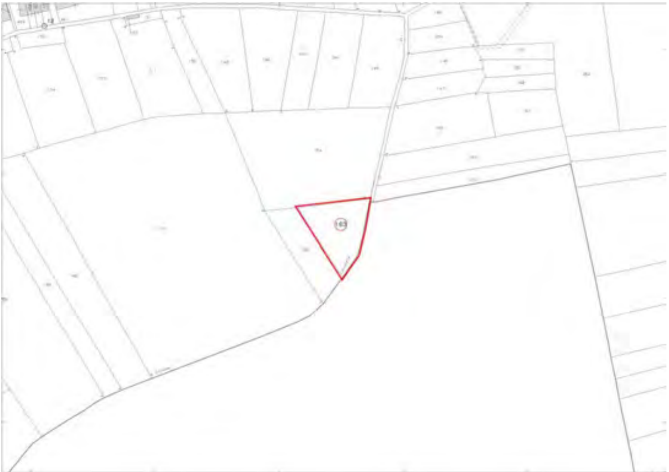
MAPPA CATASTALE DEI TERRENI - IN EVIDENZA IL MAPPALE COMPRESO IN QUESTO LOTTO