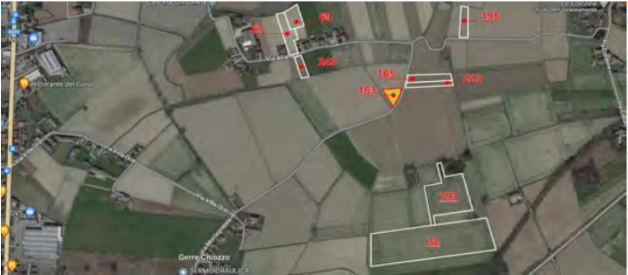
VISTA AEREA GENERALE DEI TERRENI - IN EVIDENZA IL MAPPALE COMPRESO IN QUESTO LOTTO