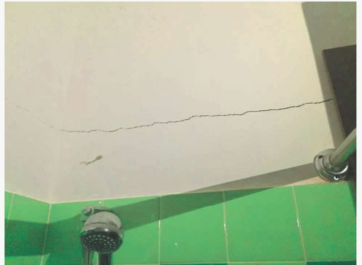
Abitazione p.lla 198 sub. 18 – lesione ai tramezzi in muratura (bagno)