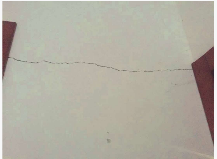
Abitazione p.la 198 sub. 18 – lesione ai tramezzi in muratura (disimpegno)