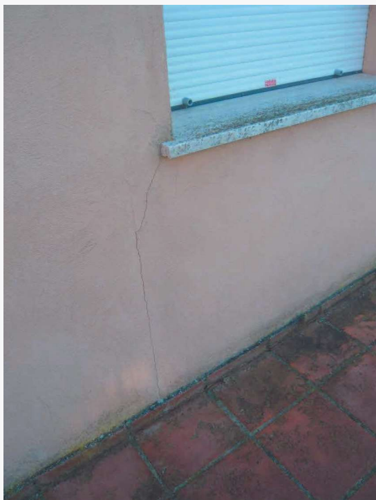
Abitazione p.la 198 sub. 18 – lesione alla tamponatura in muratura laterizia