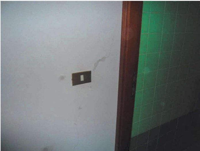
Abitazione p.la 198 sub. 18 – lesione ai tramezzi in muratura (disimpegno)