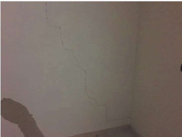
Abitazione p.lla 198 sub. 19 – lesione ai tramezzi in muratura (camera)