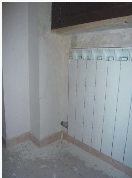
Abitazione p.la 198 sub. 19 – lesione alla tamponatura in muratura laterizia