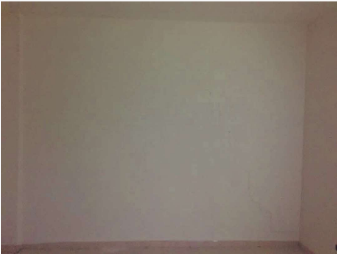
Abitazione p.lla 198 sub. 19 – lesione ai tramezzi in muratura (camera)