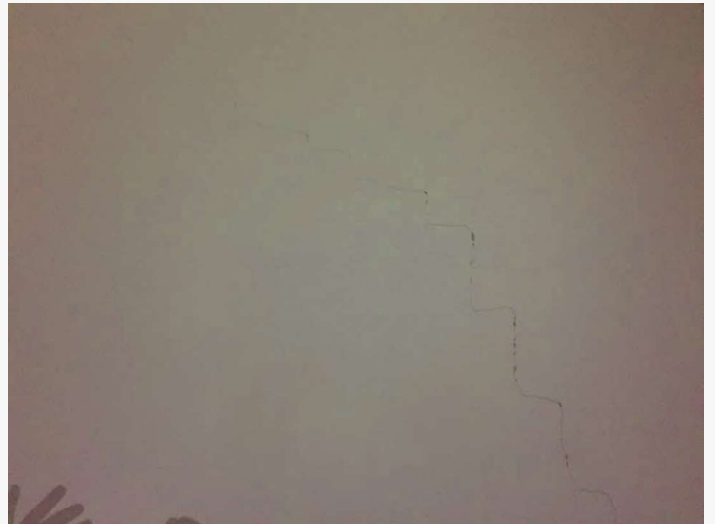
Abitazione p.lla 198 sub. 19 – lesione ai tramezzi in muratura (camera)