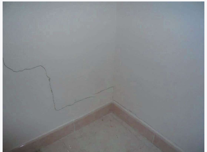
Abitazione p.lla 198 sub. 19 – lesione ai tramezzi in muratura (camera)