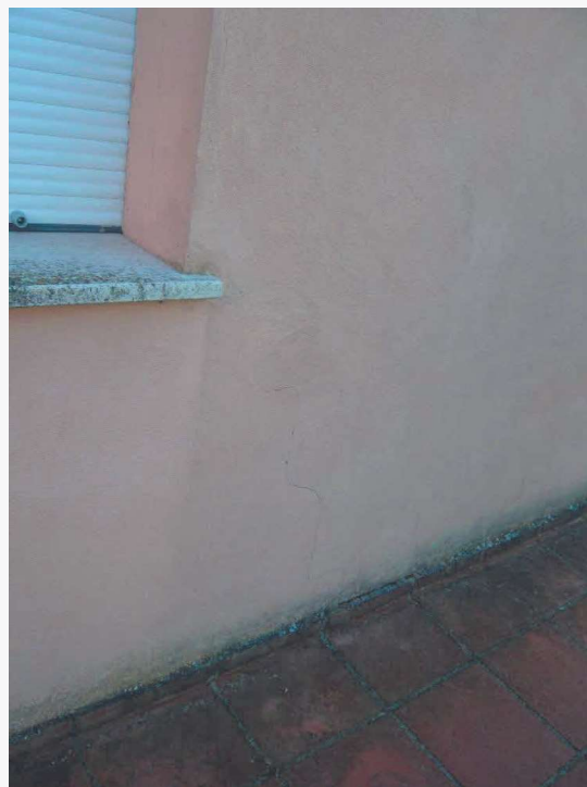
Abitazione p.la 198 sub. 18 – lesione alla tamponatura in muratura laterizia