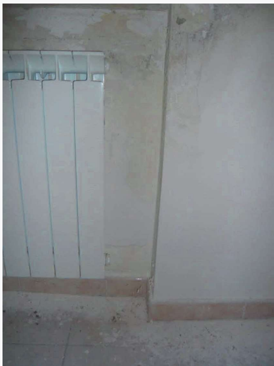
Abitazione p.la 198 sub. 19 – lesione alla tamponatura in muratura laterizia