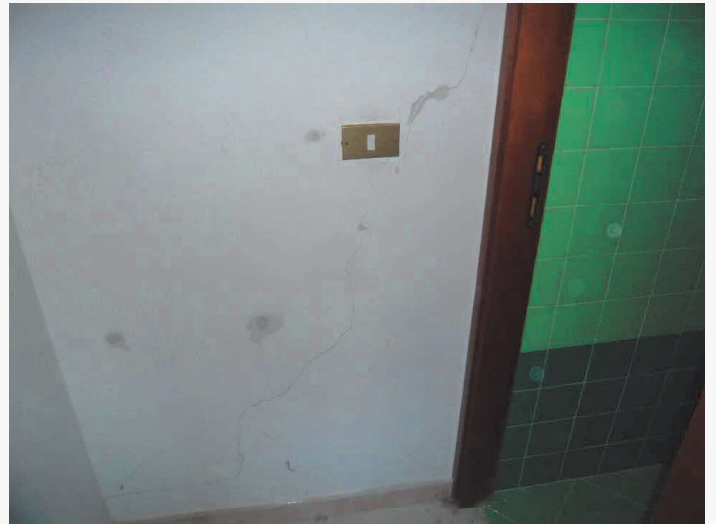
Abitazione p.la 198 sub. 18 – lesione ai tramezzi in muratura (disimpegno)