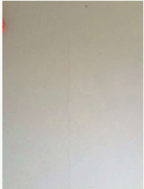
Abitazione p.la 198 sub. 18 – lesione ai tramezzi in muratura (soggiorno/cucina)