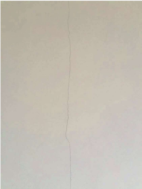
Abitazione p.la 198 sub. 18 – lesione ai tramezzi in muratura (soggiorno/cucina)