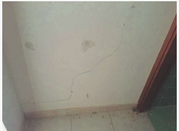
Abitazione p.la 198 sub. 18 – lesione ai tramezzi in muratura (disimpegno)