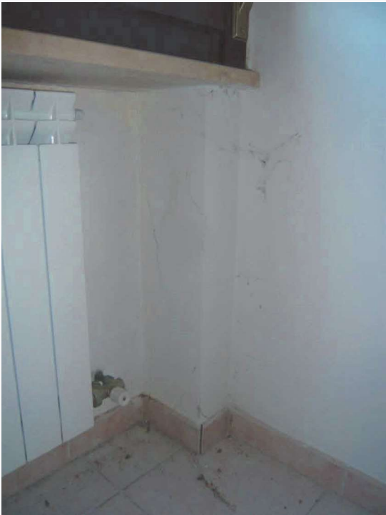
Abitazione p.la 198 sub. 18 – lesione alla tamponatura in muratura laterizia (camera)