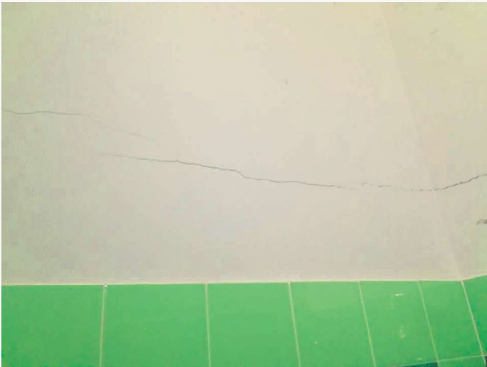
Abitazione p.la 198 sub. 18 – lesione ai tramezzi in muratura (bagno)