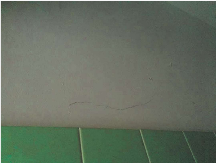
Abitazione p.lla 198 sub. 18 – lesione ai tramezzi in muratura (bagno)