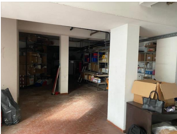
9- il laboratorio