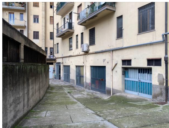
2- Il percorso condominiale