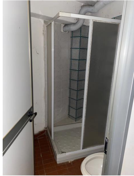
14- Il servizio igienico