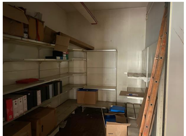
12- Il vano buio nel laboratorio