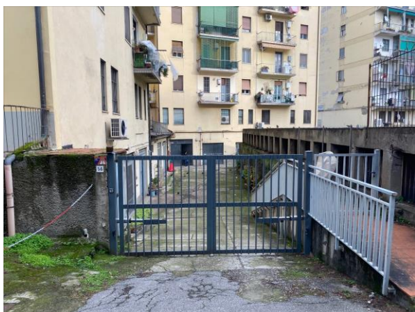
3- Accesso carrabile da Via Vallombrosa n. 14