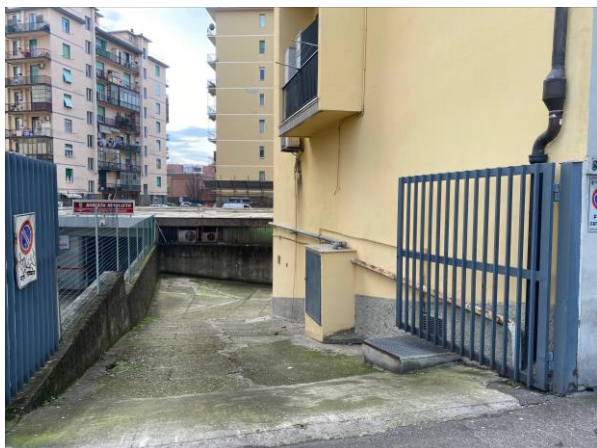
1- Accesso carrabile da Via R. Giuliani n. 83