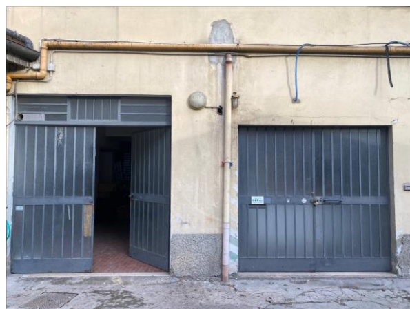
4- Gli accessi dall'esterno