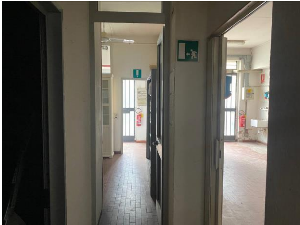
7- il disbrigo