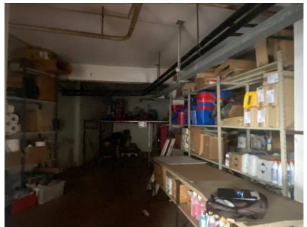
10- il laboratorio