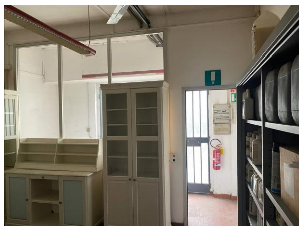
6- L'ingresso con la reception