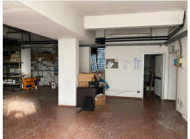
8- il laboratorio