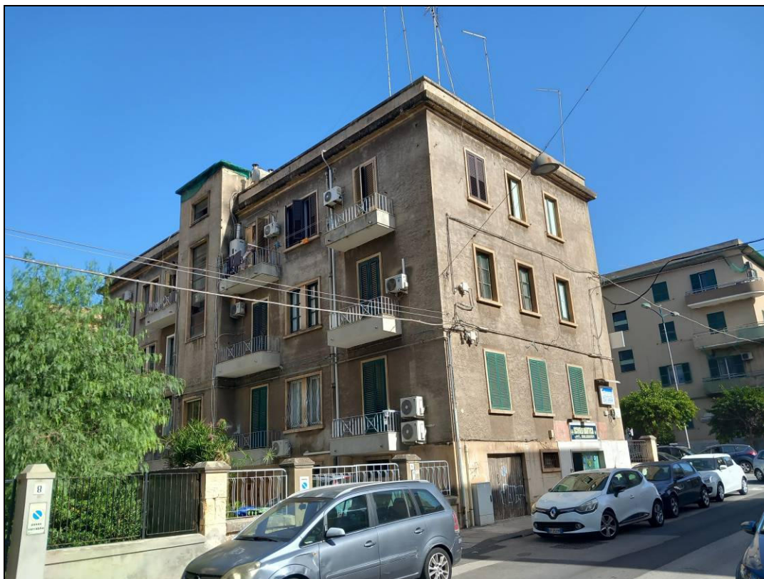
Foto 1: Vista dello stabile nel quale ricade l'immobile oggetto della presente procedura (lato Via Adige)