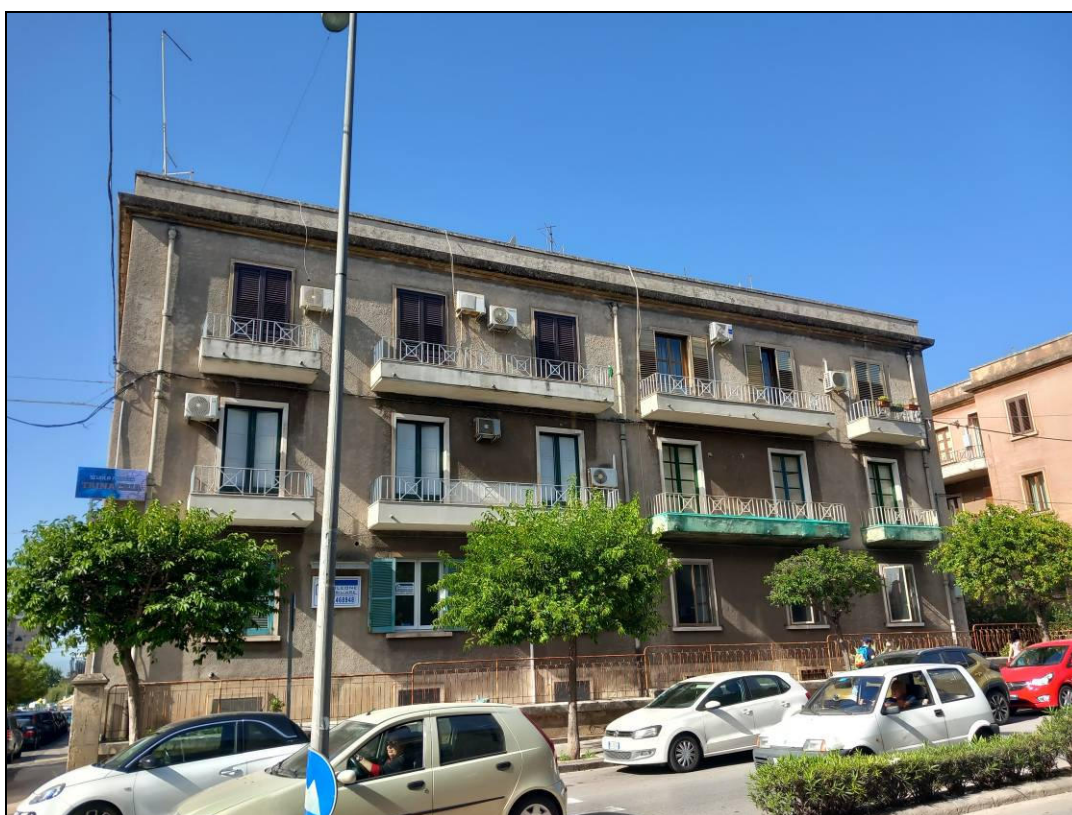
Foto 2: Vista dello stabile nel quale ricade l'immobile oggetto della presente procedura (lato Corso Gelone)