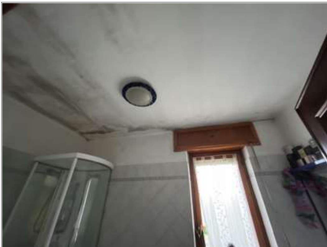
FOTO 7: vista del soffitto del bagno dove sono visibili le tracce di umidità