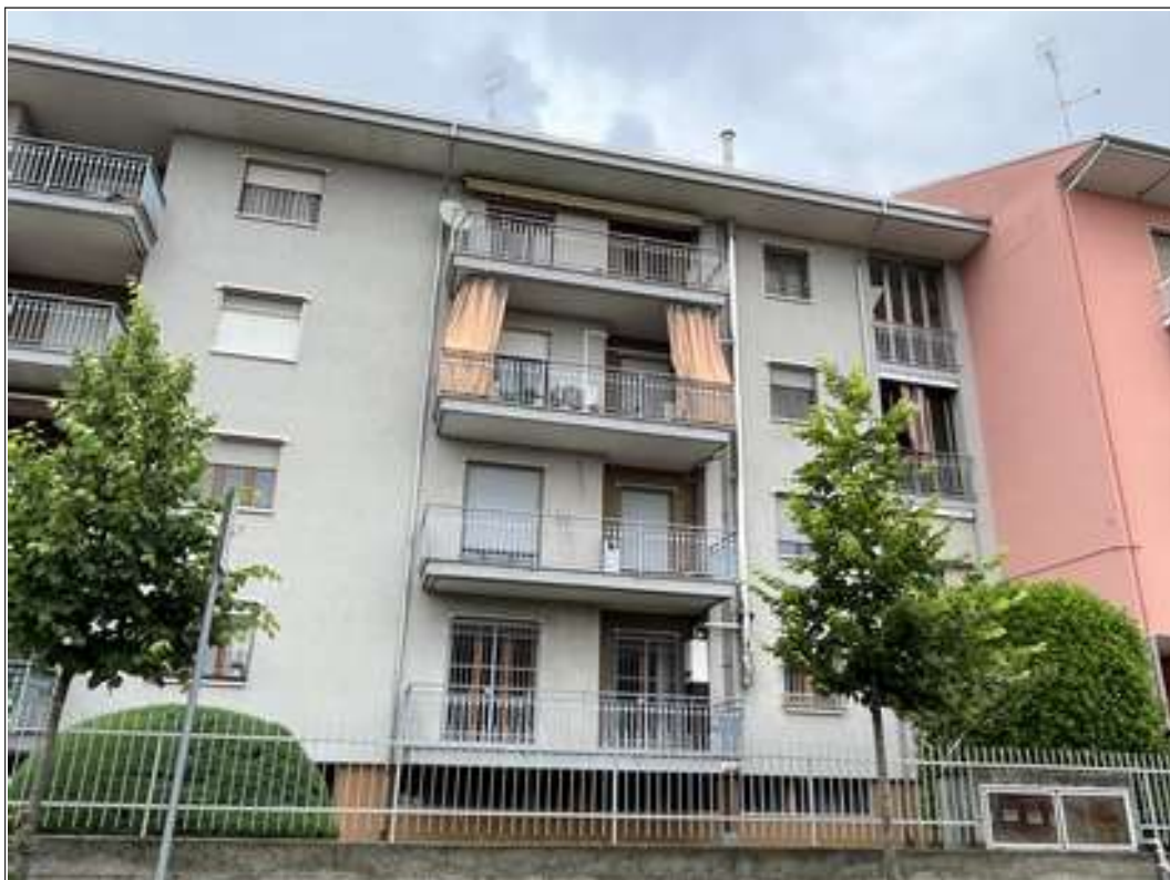
FOTO 15: vista della facciata Sud del Condominio Livio su via Cristoforo Colombo