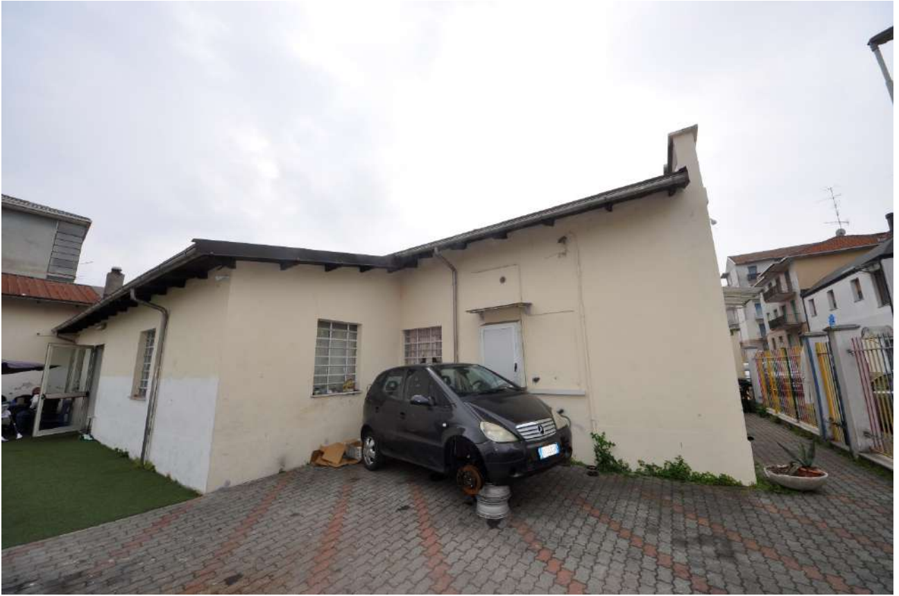
Vista del fronte nord sul cortile.