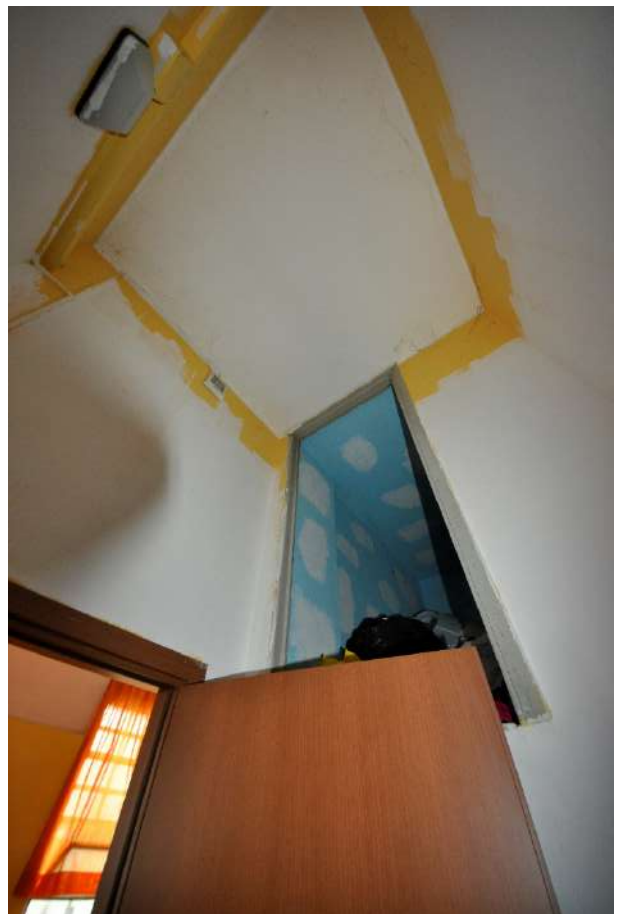
Antibagno (a destra, vista della porta del ripostiglio 3 del piano primo, raggiungibile con scala a pioli).