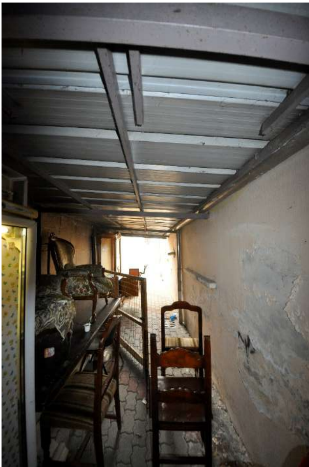
Tettoia lungo il fronte est.