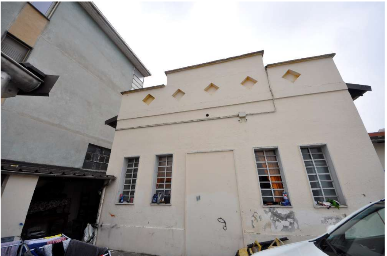
Vista del fronte nord sul cortile.