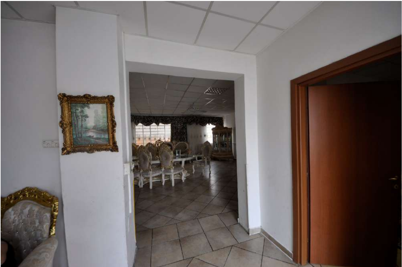
Cucina (vista verso soggiorno).