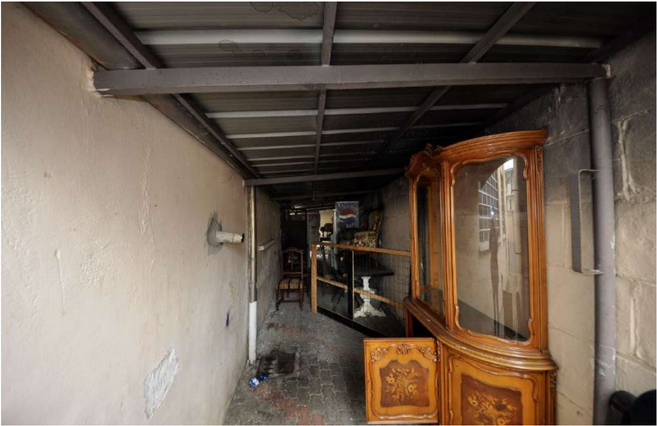
Tettoia lungo il fronte est.