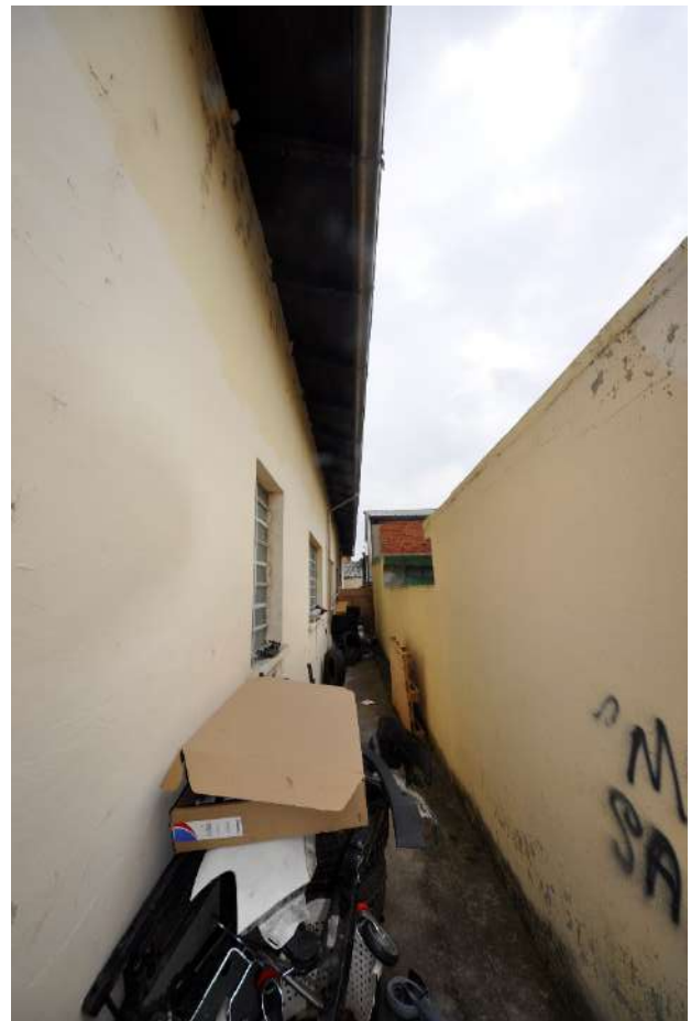
Vista del fronte sud.