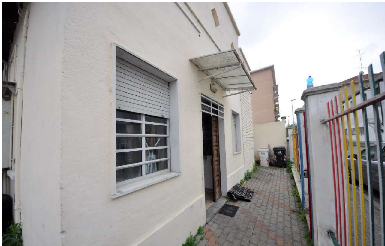
Vista del fronte ovest su via Pistoia.