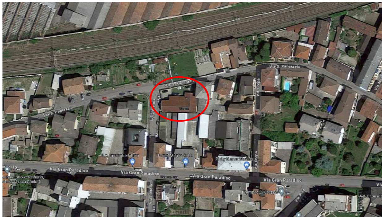
Vista satellitare