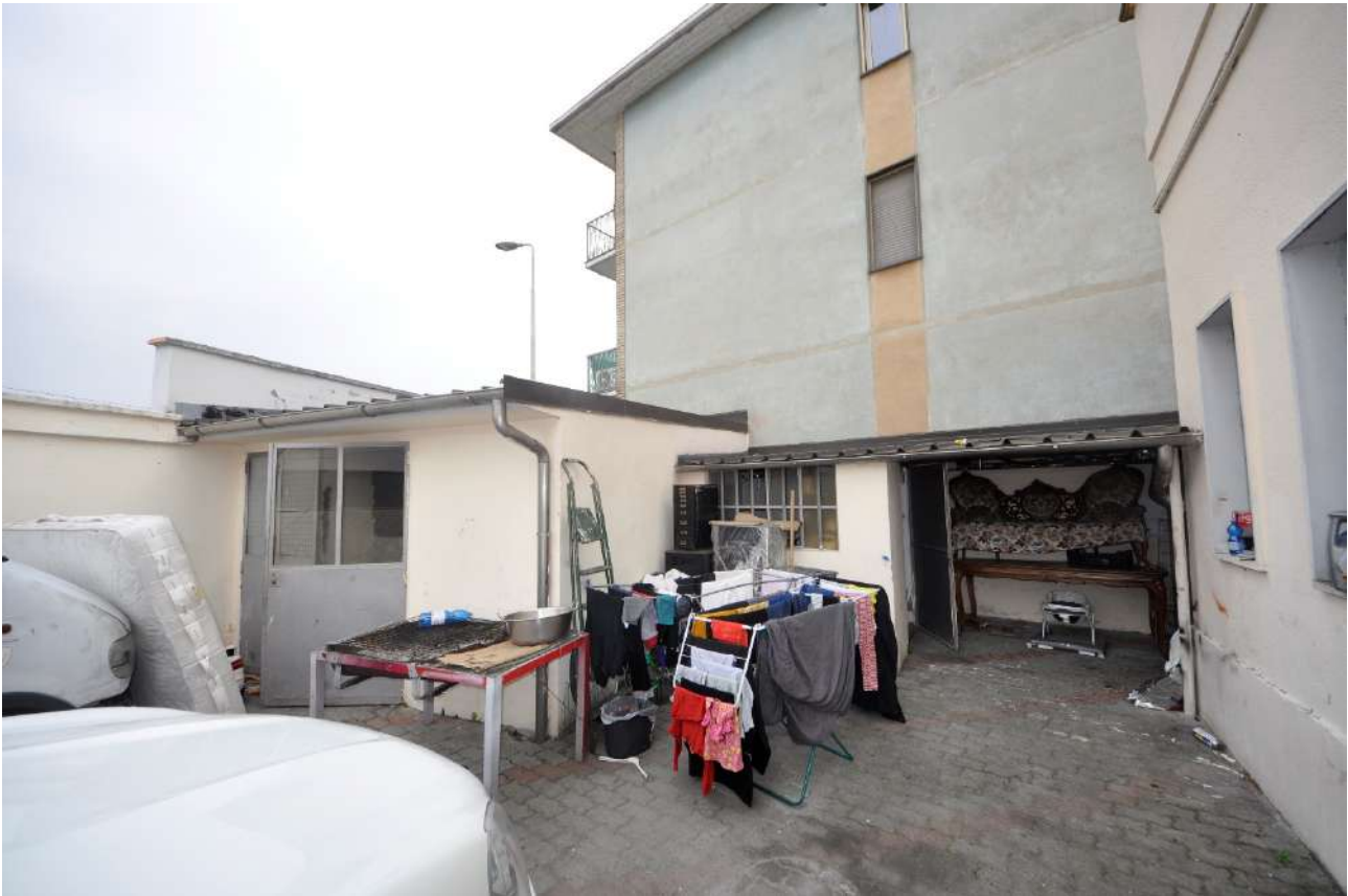
Vista dei ripostigli esterni.