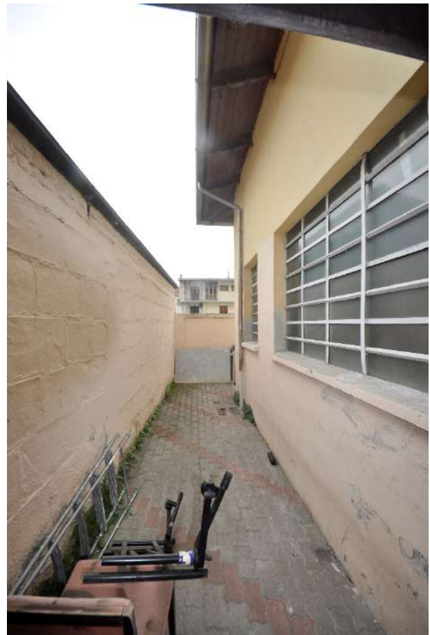
Porzione del fronte est non occupata da tettoia.