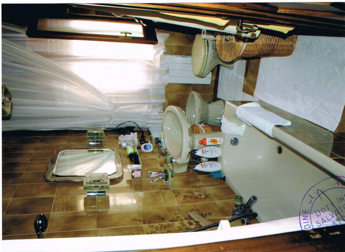
Foto n° 26 – Immobile sito in Gela, via Vittorio Emanuele Orlando n° 15 – Terzo piano appartamento ad ovest – Panoramica del servizio igienico completo di lavabo, bidet, vaso igienico, vasca da bagno e con pavimentazione e piastrelle alle pareti in ceramica.