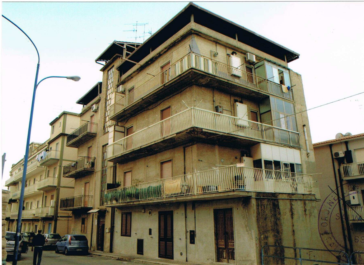
Foto n° 1 – Fabbricato sito in Gela, via Vittorio Emanuele Orlando n° 15 – Panoramica dei prospetti su via Vittorio Emanuele Orlando e sul lato ovest.