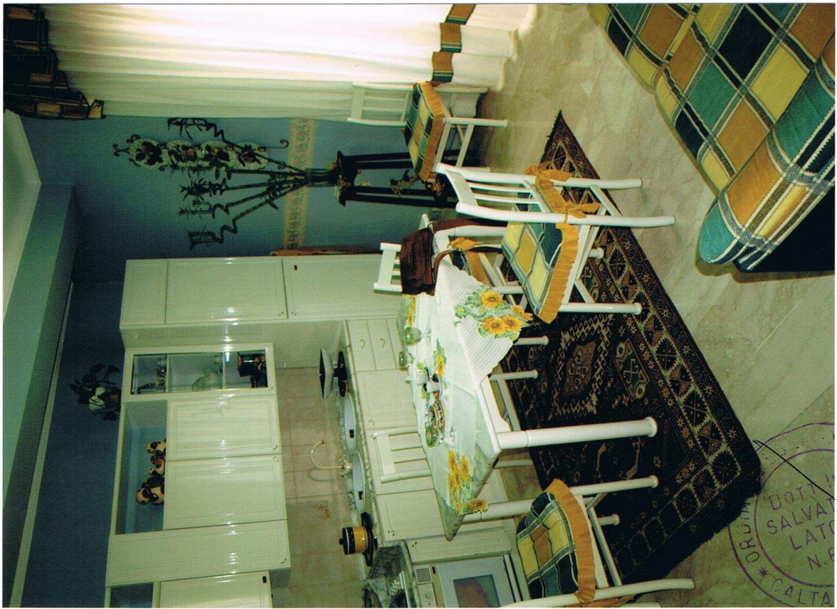
Foto n° 23 – Immobile sito in Gela, via Vittorio Emanuele Orlando n° 15 – Terzo piano appartamento ad ovest – Panoramica della cucina con pavimentazione in marmo, carta da parati alle pareti, infissi esterni in legno e vetro con avvolgibili in plastica.