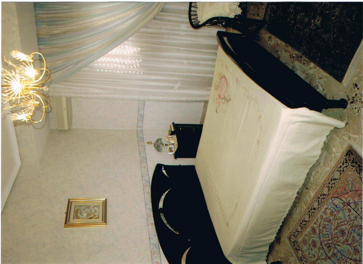
Foto n° 24 – Immobile sito in Gela, via Vittorio Emanuele Orlando n° 15 – Terzo piano appartamento ad ovest – Panoramica della camera da letto matrimoniale con pavimentazione in marmo, carta da parati alle pareti, infissi esterni in legno e vetro con avvolgibili in plastica.