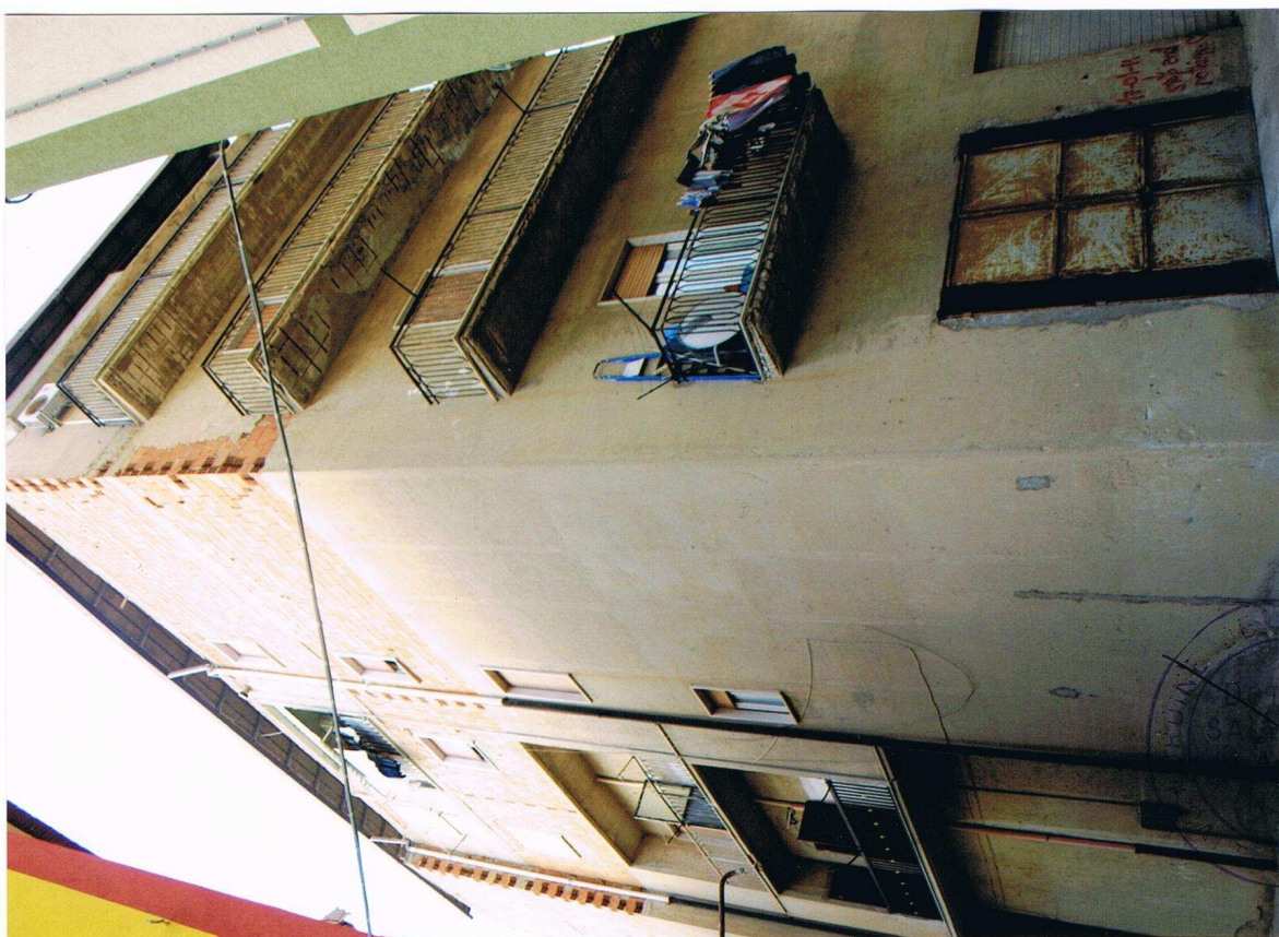
Foto n° 2 – Fabbricato sito in Gela, via Vittorio Emanuele Orlando n° 15 – Panoramica dei prospetti su via Pietro Mascagni e su via Pirandello.