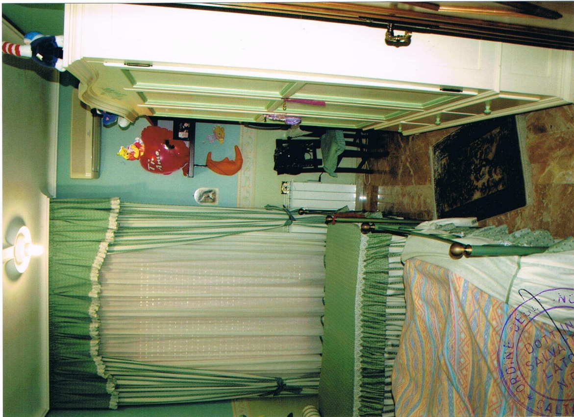
Foto n° 25 – Immobile sito in Gela, via Vittorio Emanuele Orlando n° 15 – Terzo piano appartamento ad ovest – Panoramica della seconda camera da letto con pavimentazione in marmo, carta da parati alle pareti, infissi esterni in legno e vetro con avvolgibili in plastica.