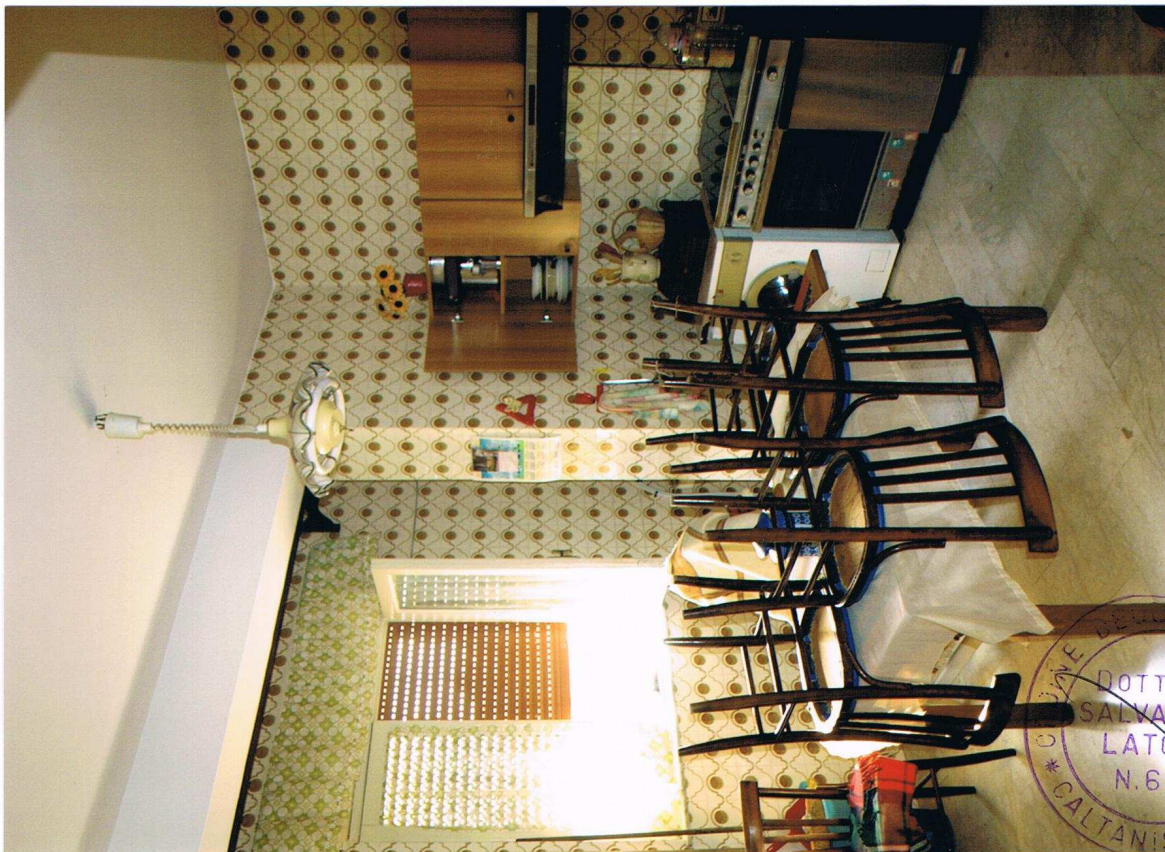
Foto n° 5 – Immobile sito in Gela, via Vittorio Emanuele Orlando n° 15 – Secondo piano appartamento ad est – Panoramica della cucina con pavimentazione in marmo, piastrelle alle pareti in ceramica ed infissi esterni in legno e vetro con avvolgibili in plastica.