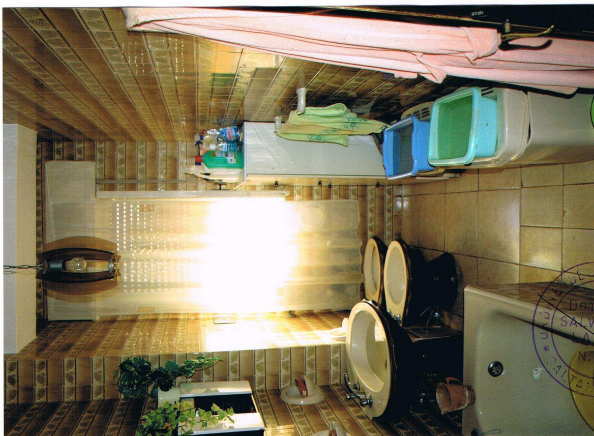
Foto n° 6 – Immobile sito in Gela, via Vittorio Emanuele Orlando n° 15 – Secondo piano appartamento ad est – Panoramica del servizio igienico completo di lavabo, bidet, vaso igienico, vasca da bagno e con pavimentazione e piastrelle alle pareti in ceramica.