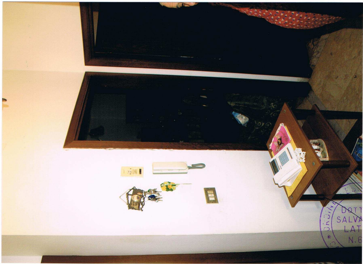
Foto n° 7 – Immobile sito in Gela, via Vittorio Emanuele Orlando n° 15 – Secondo piano appartamento ad est – Panoramica del disimpegno con pavimentazione in marmo ed infissi interni in legno.