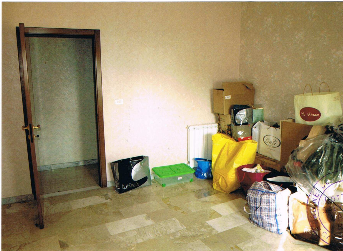
Foto n° 13 – Immobile sito in Gela, via Vittorio Emanuele Orlando n° 15 – Secondo piano appartamento ad ovest – Panoramica di uno dei vani con pavimentazione in marmo, carta da parati alle pareti, infissi esterni in legno e vetro con avvolgibili in plastica.