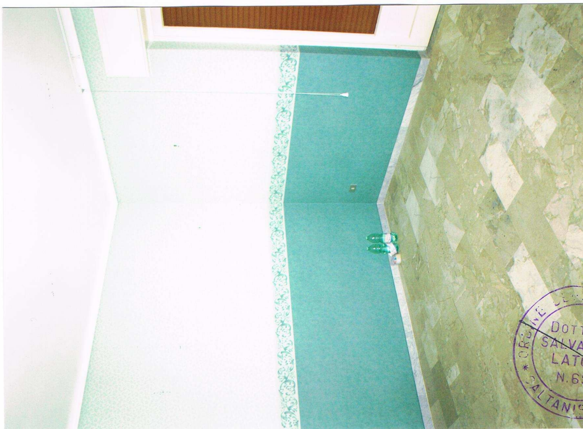
Foto n° 10 – Immobile sito in Gela, via Vittorio Emanuele Orlando n° 15 – Secondo piano appartamento ad ovest – Panoramica di uno dei vani con pavimentazione in marmo, carta da parati alle pareti, infissi esterni in legno e vetro con avvolgibili in plastica.