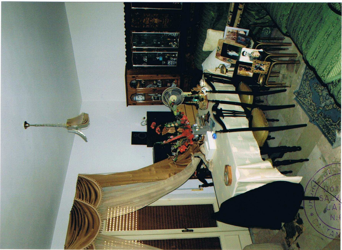
Foto n° 3 – Immobile sito in Gela, via Vittorio Emanuele Orlando n° 15 – Secondo piano appartamento ad est – Panoramica del soggiorno pranzo con pavimentazione in marmo ed infissi esterni in legno e vetro con avvolgibili in plastica.