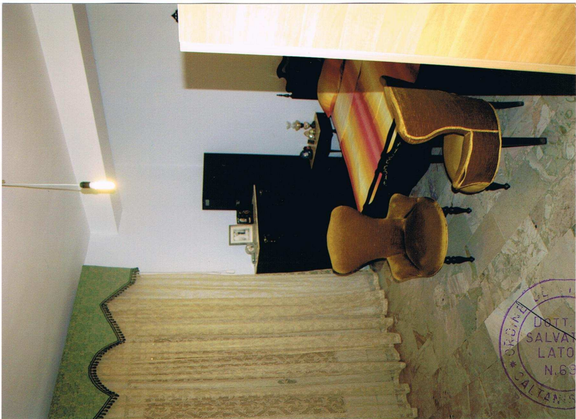
Foto n° 4 – Immobile sito in Gela, via Vittorio Emanuele Orlando n° 15 – Secondo piano appartamento ad est – Panoramica della camera da letto con pavimentazione in marmo ed infissi esterni in legno e vetro con avvolgibili in plastica.