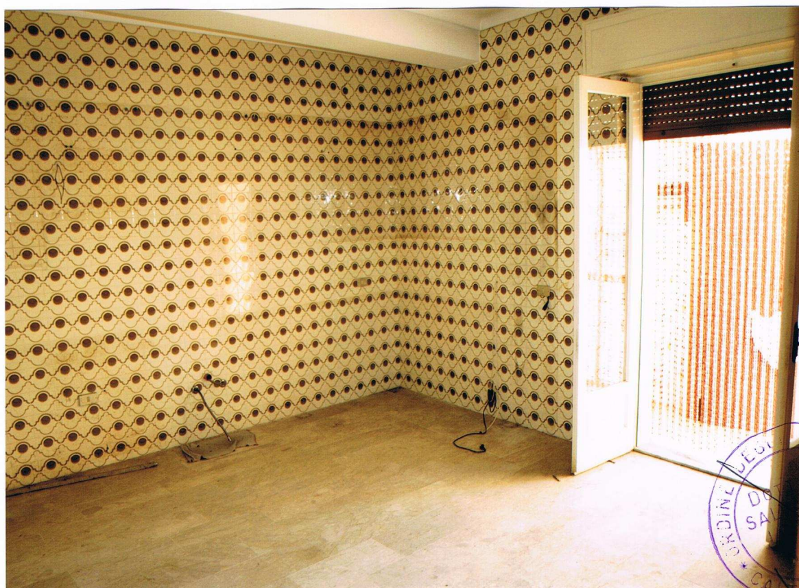
Foto n° 14 – Immobile sito in Gela, via Vittorio Emanuele Orlando n° 15 – Secondo piano appartamento ad ovest – Panoramica della cucina con pavimentazione in marmo e piastrelle alle pareti in ceramica, infissi esterni in legno e vetro con avvolgibili in plastica.