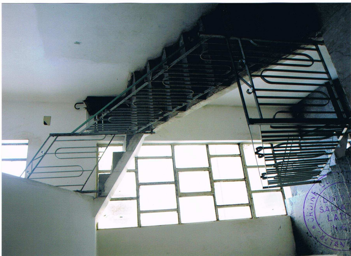
Foto n° 8 – Fabbricato sito in Gela, via Vittorio Emanuele Orlando n° 15 – Panoramica della scala comune agli altri piani, in parte con pavimentazione in marmo e in parte allo stato grezzo e con pareti e soffitti trattati con intonaco civile per interni con gesso scagliola.