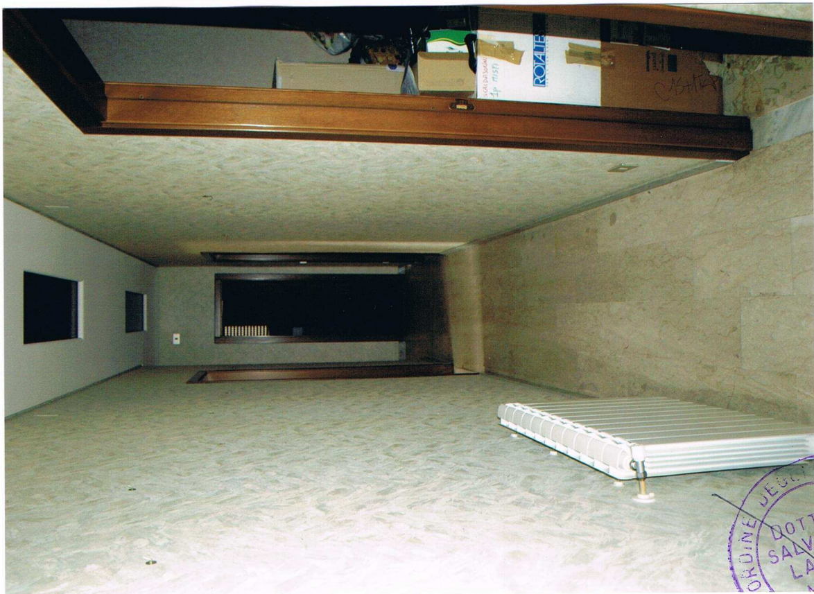
Foto n° 16 – Immobile sito in Gela, via Vittorio Emanuele Orlando n° 15 – Secondo piano appartamento ad ovest – Panoramica del disimpegno con pavimentazione in marmo, carta da parati alle pareti, infissi interni in legno.