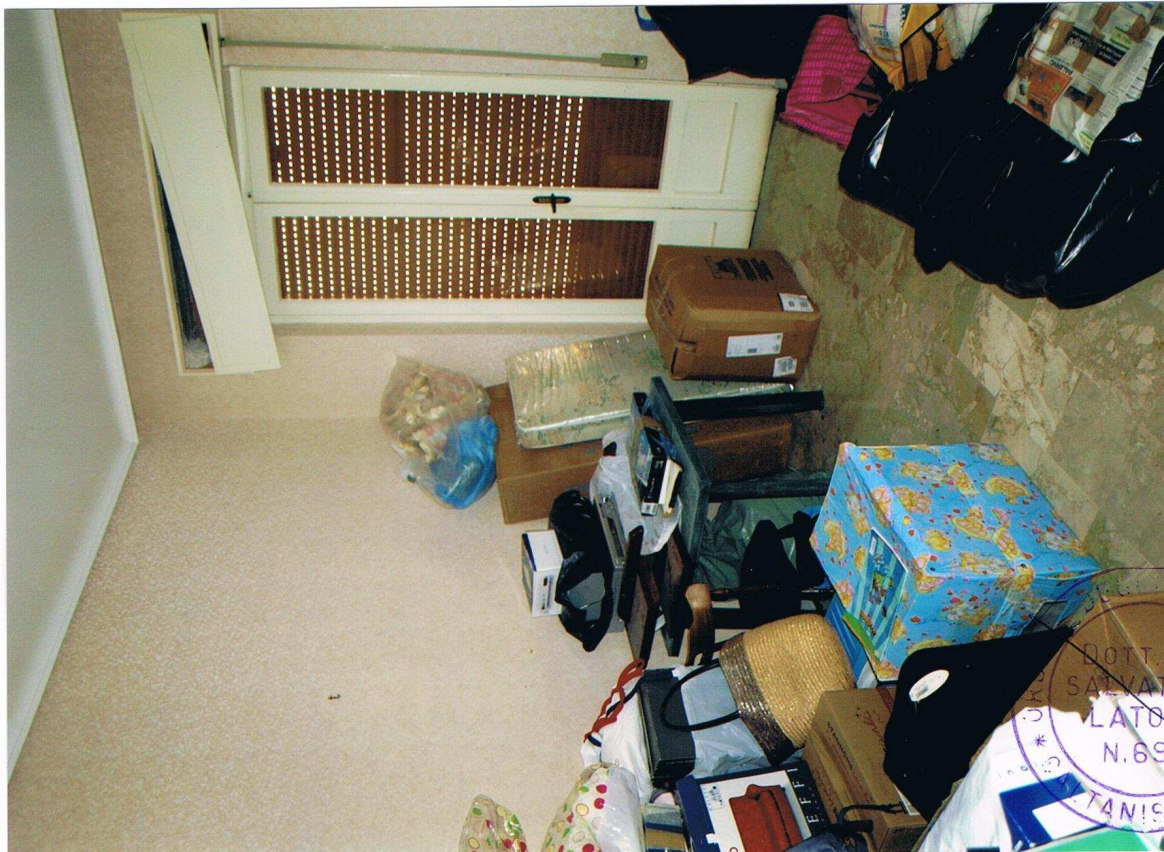
Foto n° 9 – Immobile sito in Gela, via Vittorio Emanuele Orlando n° 15 – Secondo piano appartamento ad ovest – Panoramica di uno dei vani con pavimentazione in marmo, carta da parati alle pareti, infissi esterni in legno e vetro con avvolgibili in plastica.