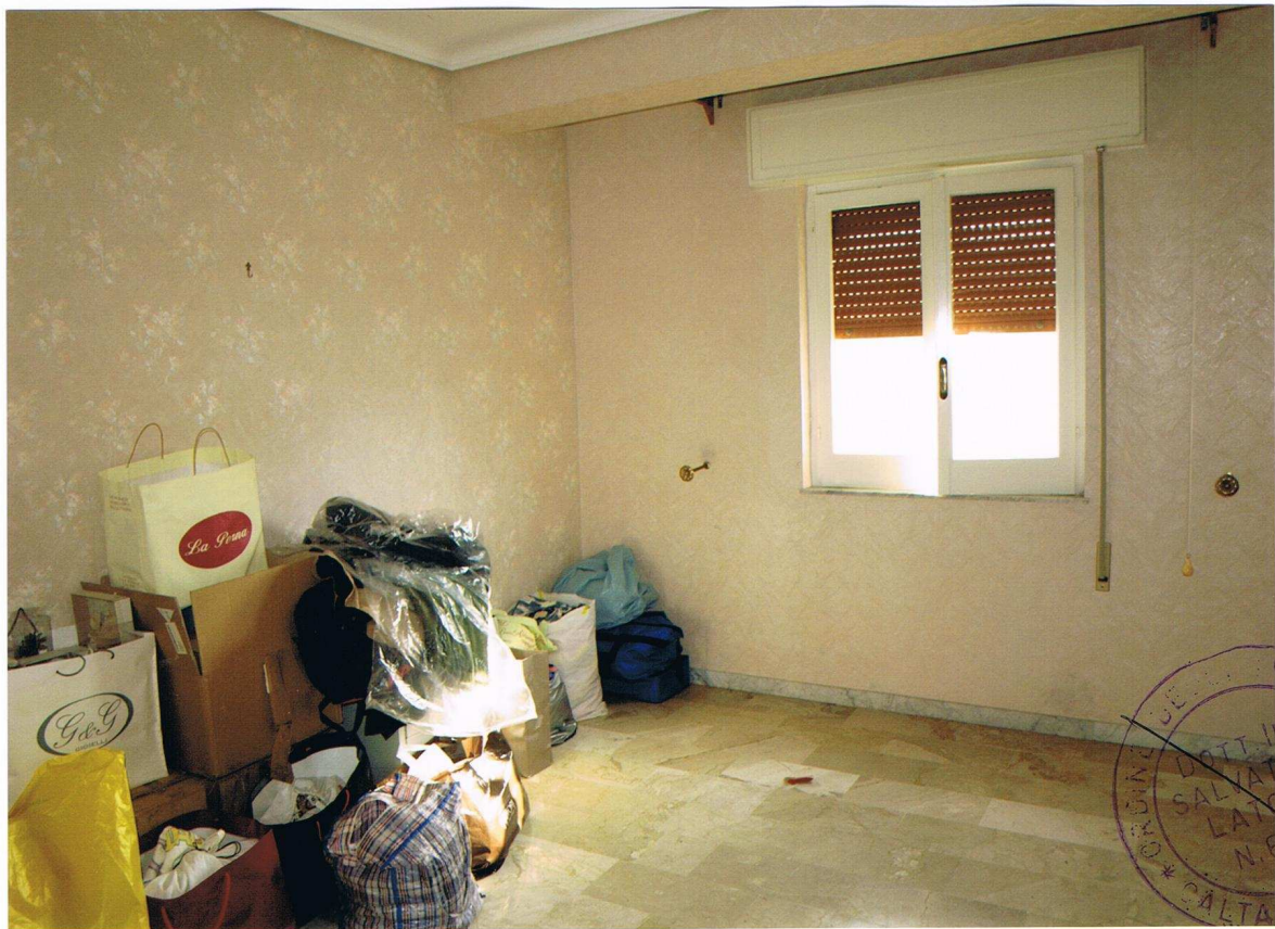
Foto n° 12 – Immobile sito in Gela, via Vittorio Emanuele Orlando n° 15 – Secondo piano appartamento ad ovest – Panoramica di uno dei vani con pavimentazione in marmo, carta da parati alle pareti, infissi esterni in legno e vetro con avvolgibili in plastica.