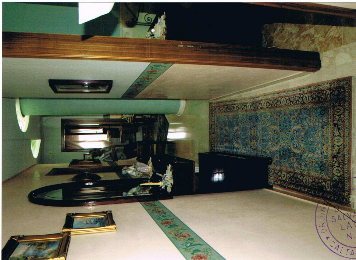
Foto n° 27 – Immobile sito in Gela, via Vittorio Emanuele Orlando n° 15 – Secondo piano appartamento ad ovest – Panoramica del corridoio/disimpegno con pavimentazione in marmo, infissi interni in legno e carta da parati alle pareti.