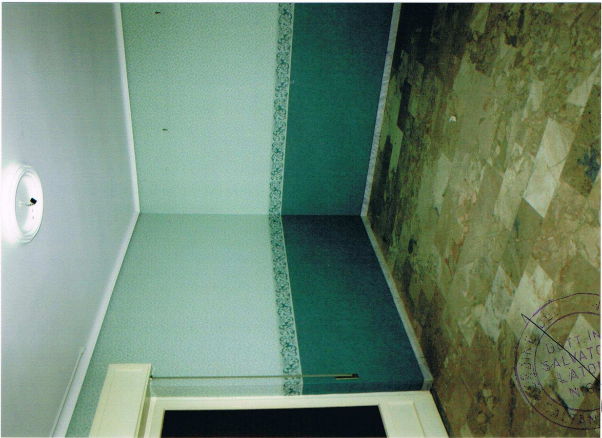
Foto n° 11 – Immobile sito in Gela, via Vittorio Emanuele Orlando n° 15 – Secondo piano appartamento ad ovest – Panoramica di uno dei vani con pavimentazione in marmo, carta da parati alle pareti, infissi esterni in legno e vetro con avvolgibili in plastica.