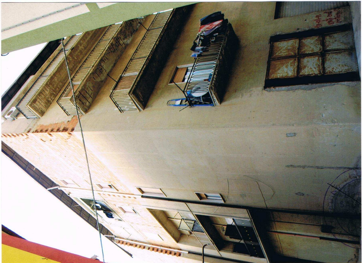
Foto n° 2 – Fabbricato sito in Gela, via Vittorio Emanuele Orlando n° 15 – Panoramica dei prospetti su via Pietro Mascagni e su via Pirandello.