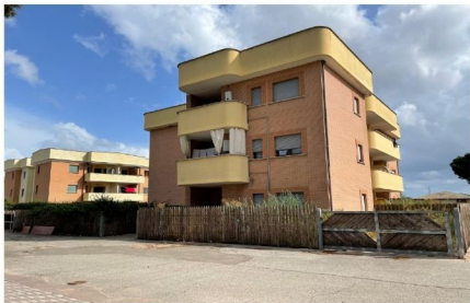
ESTERNO PALAZZINA A