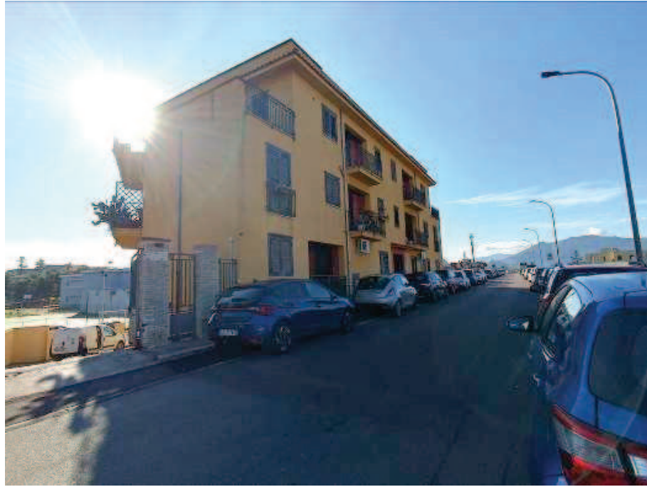
Fig. 1 Individuazione del fabbricato, Via Cotogni Bagheria (PA).