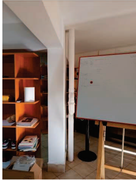
Fig. 12, 13 Scarichi condominiali.