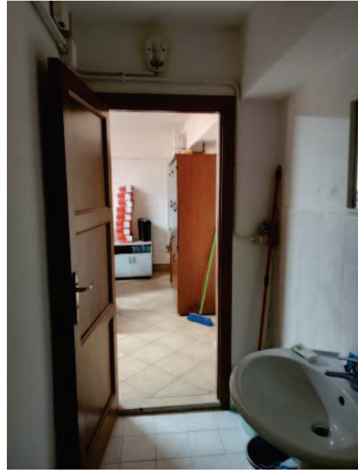
Fig. 10 Servizio igienico.