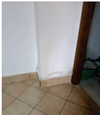
Fig. 14 Parete ingresso wc.