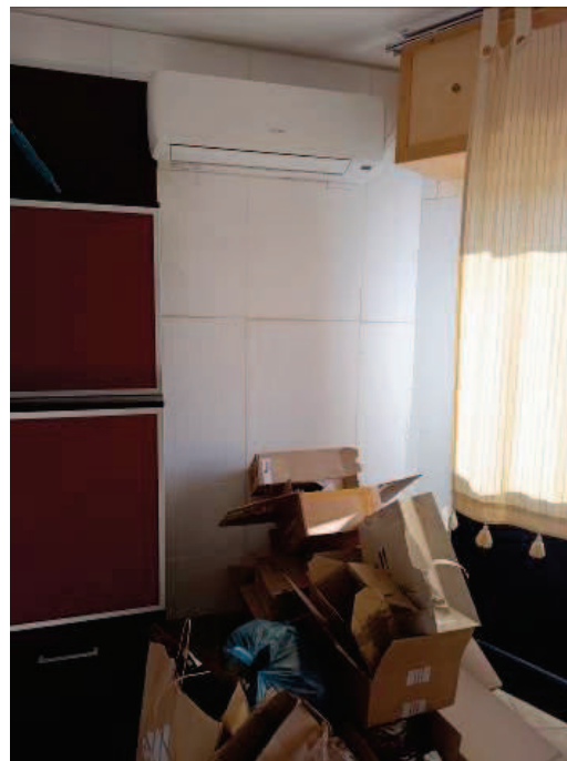
Fig. 11 Pompa di calore.