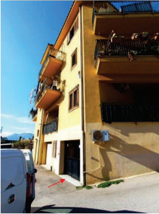
Fig. 4 Individuazione magazzino.