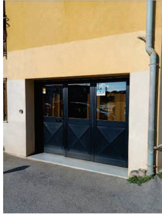
Fig. 5 Porta d'ingresso.