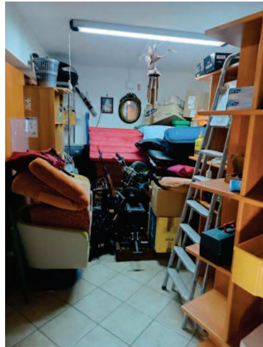
Figg. 7, 8, 9 Locale deposito.