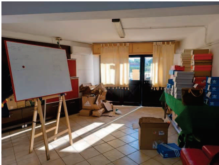
Fig. 6 Locale deposito.