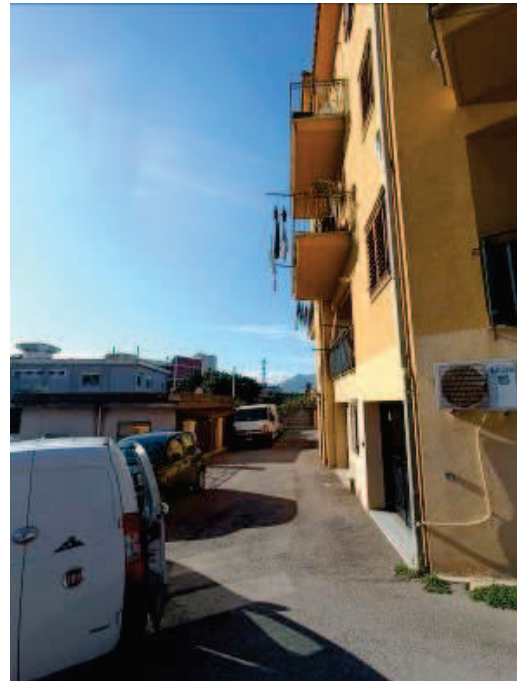
Figg. 2, 3 Rampa carrabile e area parcheggio.