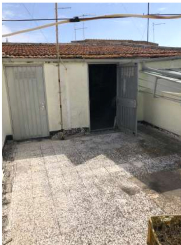
Foto 16: ingresso al locale di sgombero in 3° P. identificato con il n. 2