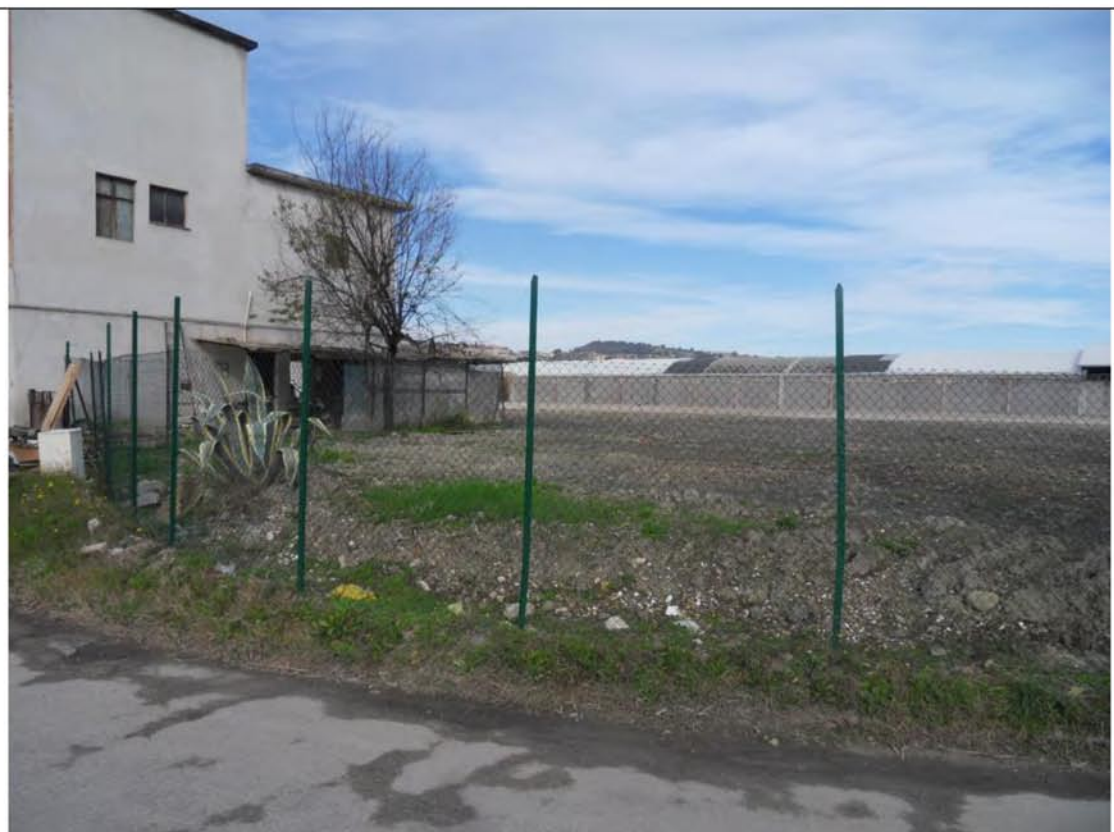
Foto n° 16 – Particolare della recinzione dell'area vista da Via Acquaviva