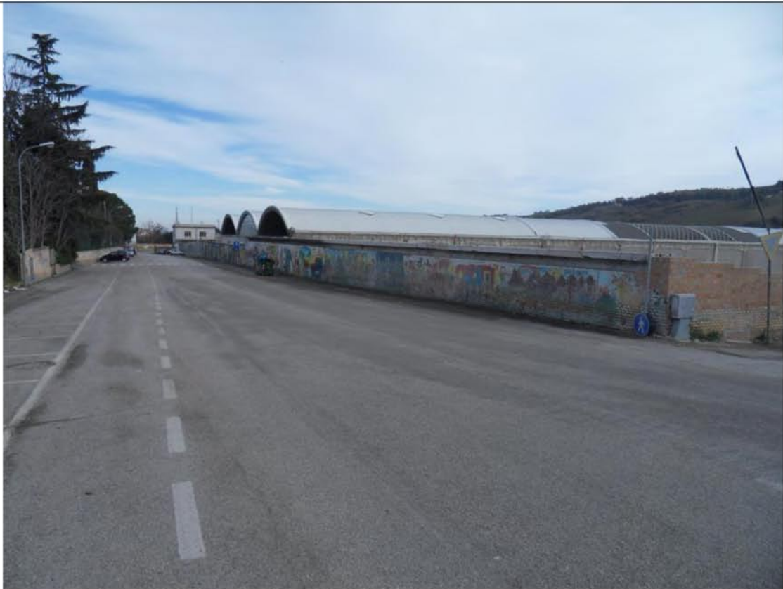
Foto n° 15 – Particolare della recinzione dell'area vista da Via Gammarana