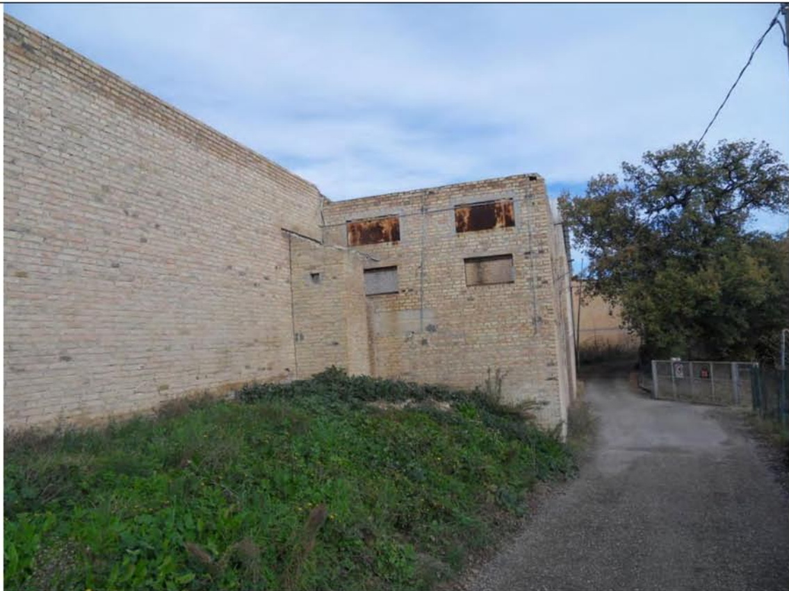
Foto n° 18 – Particolare della recinzione dell'area vista da Via Acquaviva

Il Coadiutore Cav. Geom. Osvaldo Reginelli