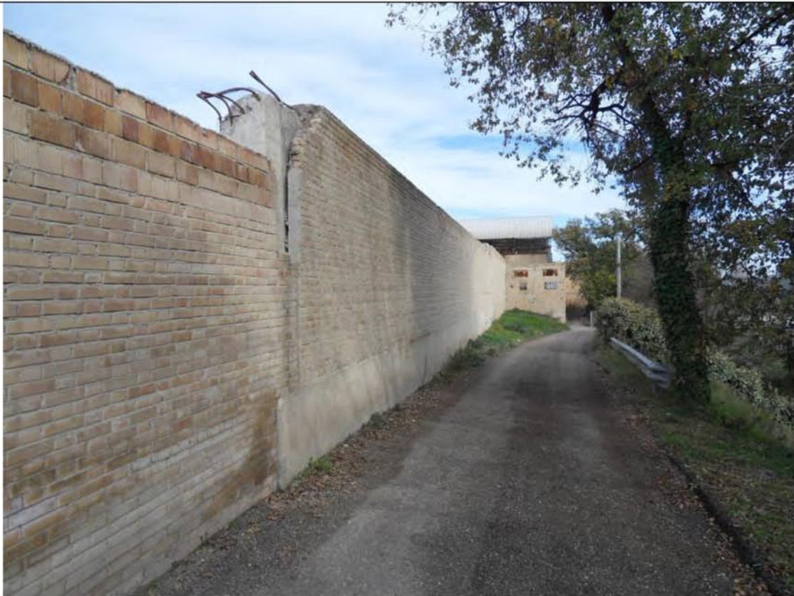
Foto n° 17 – Particolare della recinzione dell'area vista da Via Acquaviva