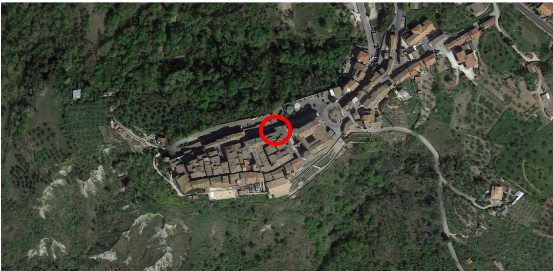
Figura 2 - Inquadramento territoriale

Nel comune di Alviano gli elementi identificativi più rilevanti sono il borgo e la Rocca. Quest'ultima fu fatta edificare nel 1495 dal condottiero Bartolomeo D'Alviano e nel 1654 passò alla famiglia Doria Pamphili, i cui discendenti nel 1920 donarono la Rocca al Comune. Il borgo domina la vallata sottostante nella quale è situata anche la rilevanza ambientale costituita dall'oasi naturalistica del WWF, un'area protetta che copre circa 900 ettari, gestita dal WWF Italia.