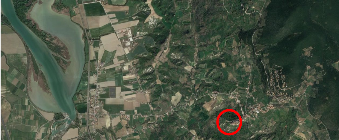
Figura 1 - Inquadramento territoriale

Nel comune di Alviano gli elementi identificativi più rilevanti sono il borgo e la Rocca. Quest'ultima fu fatta edificare nel 1495 dal condottiero Bartolomeo D'Alviano e nel 1654 passò alla famiglia Doria Pamphili, i cui discendenti nel 1920 donarono la Rocca al Comune. Il borgo domina la vallata sottostante nella quale è situata anche la rilevanza ambientale costituita dall'oasi naturalistica del WWF, un'area protetta che copre circa 900 ettari, gestita dal WWF Italia.