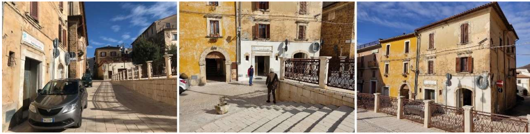
1) Vista dell'edificio da via Duca Roberto 2-3) Vista dell'edificio da Piazza del Popolo (sopralluogo del 28/01/21)

Sul fronte piazza presenta n.3 piani (PT, P1, P2), due aperture al piano terra (a cui corrispondono due unità immobiliari distinte, di cui quella di sinistra è l'U.I. di nostro interesse), altrettante aperture finestrate per ogni piano, senza presenza di balconi o terrazze. La copertura è a falda. L'estetica dell'edificio è in parte disomogenea, con presenza di intonaco non in perfette condizioni ed in parte mancante, presenta elementi decorativi in pietra in corrispondenza dei varchi e delle aperture finestrate, oltre ad una semplice modanatura lungo il bordo inferiore della copertura. Si evidenzia la presenza di alcuni cavi elettrici in facciata tra il Piano 1 ed il Piano 2, oltre a due discendenti per le acque piovane sul lato sinistro. Lungo il bordo destro troviamo la presenza di n.3 capochiavi (di cui solo uno sul fronte piazza).