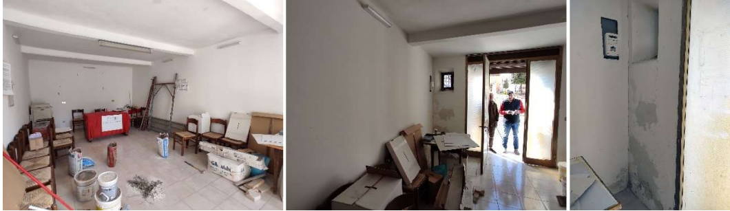
1) Vista interna dell'U.I. (civico 82); 2) Vista verso l'esterno; 3) vista angolo interno in cui si nota la presenza di una fodera di rivestimento per le murature interne (sopralluogo del 30/04/21)

Come precedentemente accennato si riscontrano fenomeni legati all'umidità sia dal piano di sopra che dalle fondazioni. La realizzazione della fodera interna, e dei lavori di rifacimento delle tinteggiature, si è probabilmente resa necessaria a seguito degli ampi fenomeni legati all'umidità di risalita in questo ambiente.