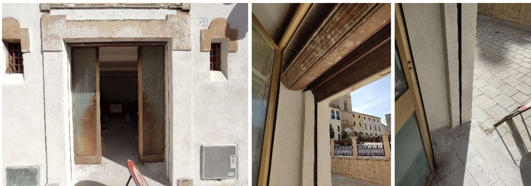
1) Prospetto dell'U.I. (civico 82); 2-3) Viste di dettaglio dello spazio ingresso (sopralluogo del 30/04/21)

Sul fronte piazza presenta n.3 piani (PT, P1, P2), due aperture al piano terra (a cui corrispondono due unità immobiliari distinte, di cui quella di sinistra è l'U.I. di nostro interesse), altrettante aperture finestrate per ogni piano, senza presenza di balconi o terrazze. La copertura è a falda. L'estetica dell'edificio è in parte disomogenea, con presenza di intonaco non in perfette condizioni ed in parte mancante, presenta elementi decorativi in pietra in corrispondenza dei varchi e delle aperture finestrate, oltre ad una semplice modanatura lungo il bordo inferiore della copertura. Si evidenzia la presenza di alcuni cavi elettrici in facciata tra il Piano 1 ed il Piano 2, oltre a due discendenti per le acque piovane sul lato sinistro. Lungo il bordo destro troviamo la presenza di n.3 capochiavi (di cui solo uno sul fronte piazza).