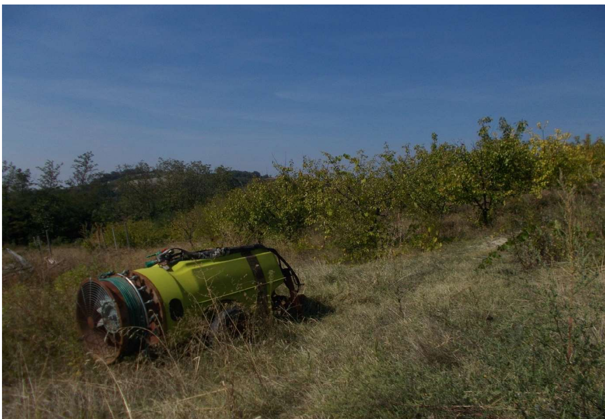
12. Particolare appezzamento di terreno descritto al mapp. 162 del foglio 9 - Comune di Monleale