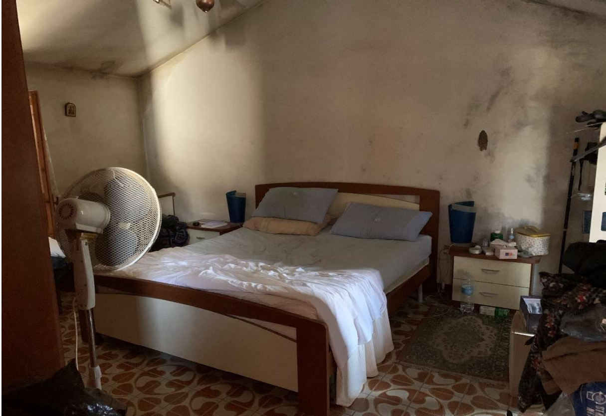
7. Particolare interno camera al piano primo