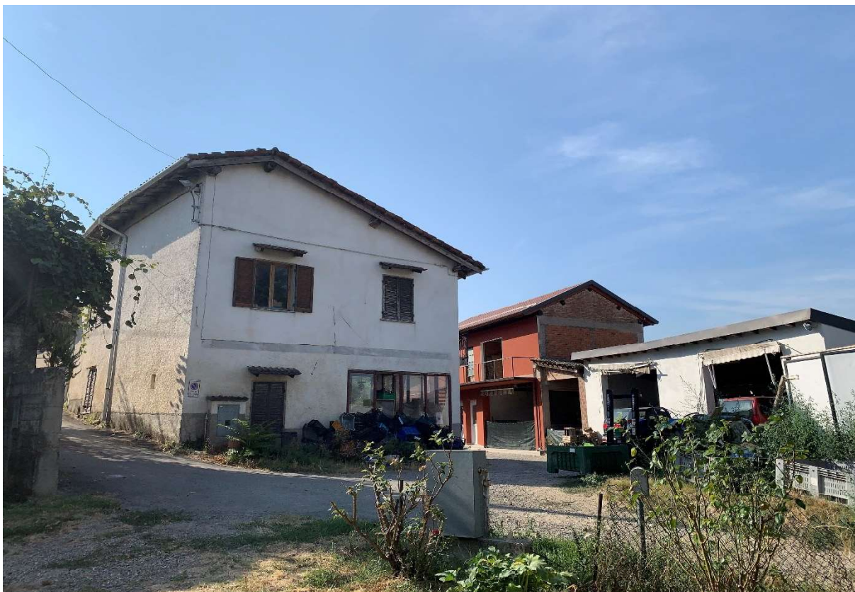
1. Fabbricato ad uso civile abitazione con locale magazzino di pertinenza oggetto della presente Esecuzione Immobiliare - particolare lato nord