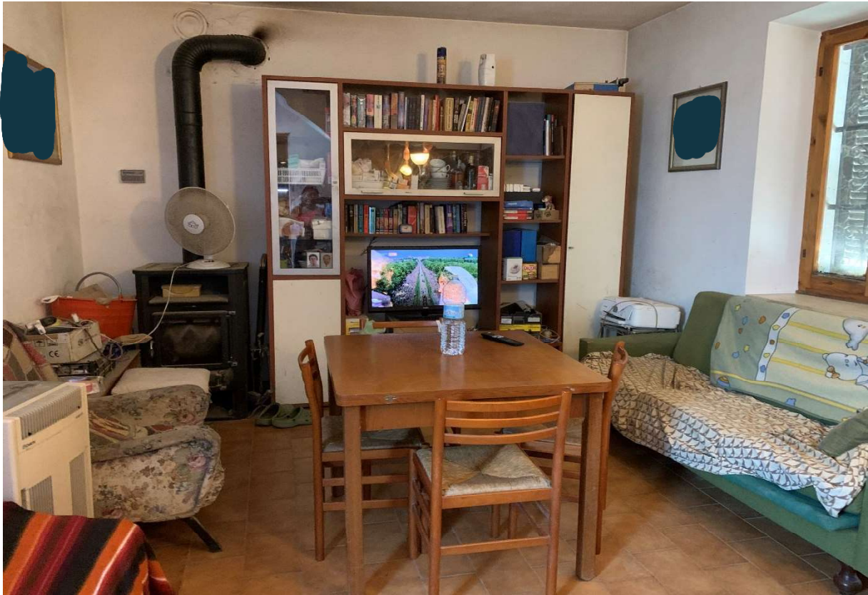
6. Particolare interno soggiorno al piano terra