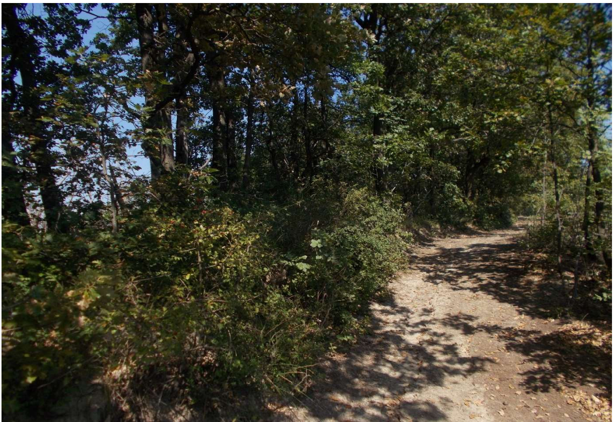
10. Particolare appezzamenti di terreno descritti ai mapp. 62 e 76 del foglio 9 - Comune di Monleale