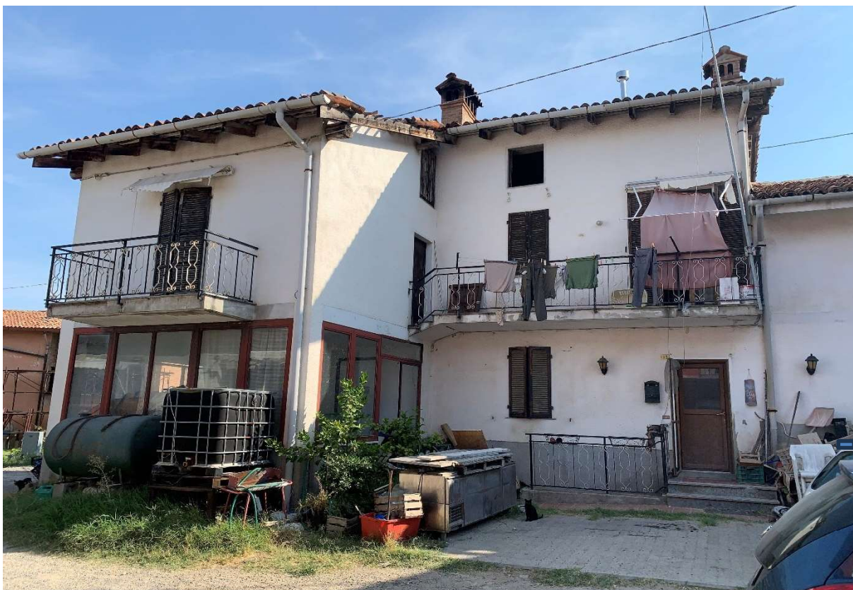
2. Prospetto principale immobile ad uso civile abitazione con antistante porzione di sedime cortilizio - particolare lato ovest