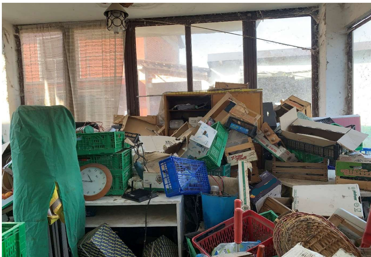
4. Particolare interno veranda