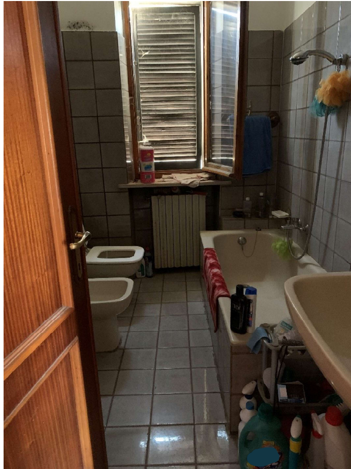
9. Particolare interno bagno al piano primo