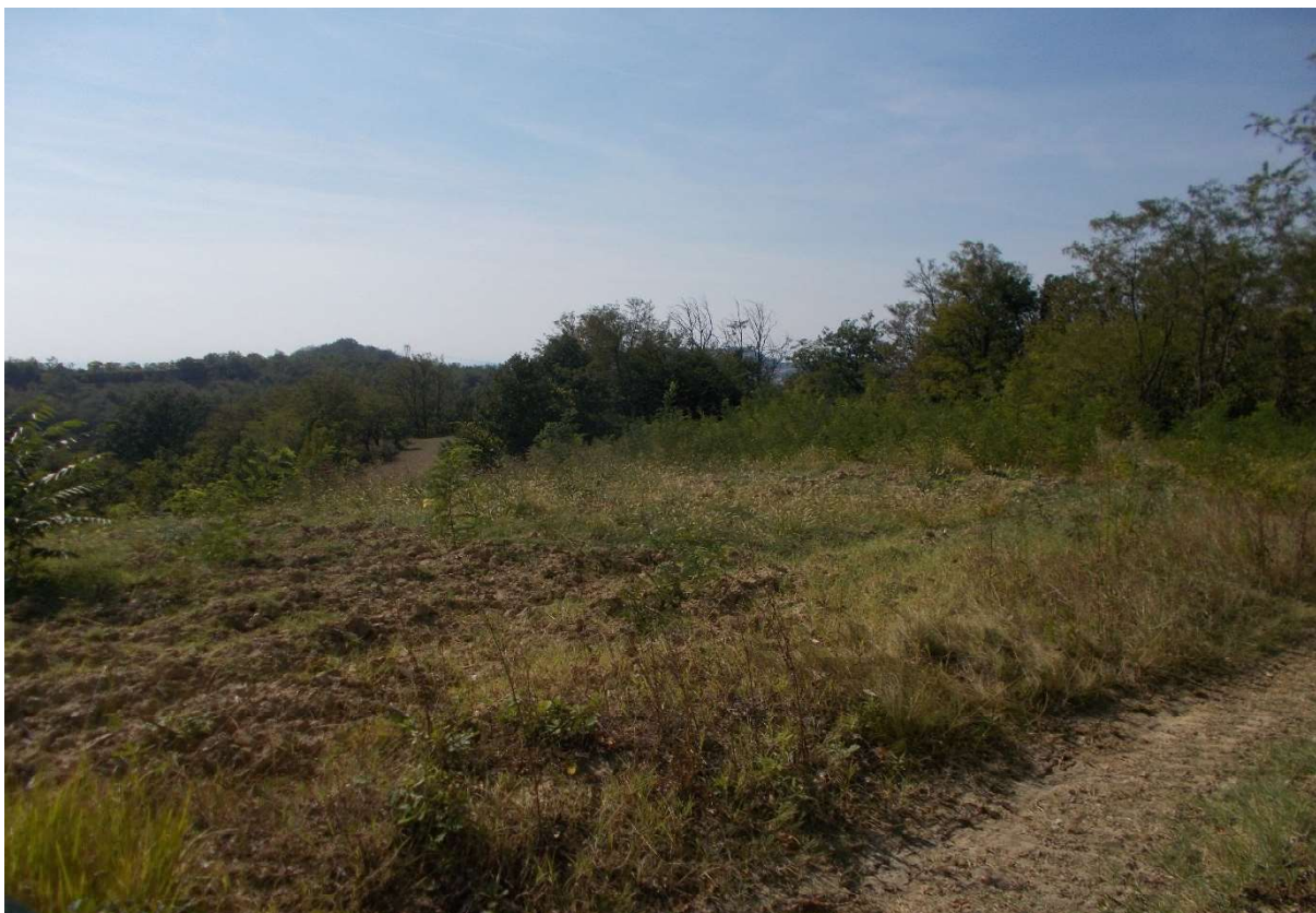
11. Particolare appezzamento di terreno descritto al mapp. 136 del foglio 9 - Comune di Monleale