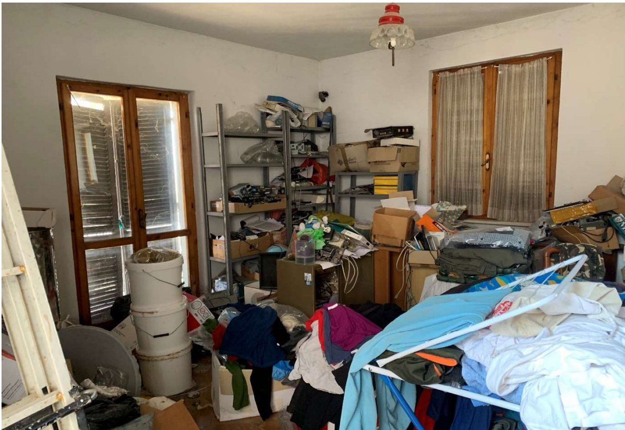
8. Particolare interno camera al piano primo