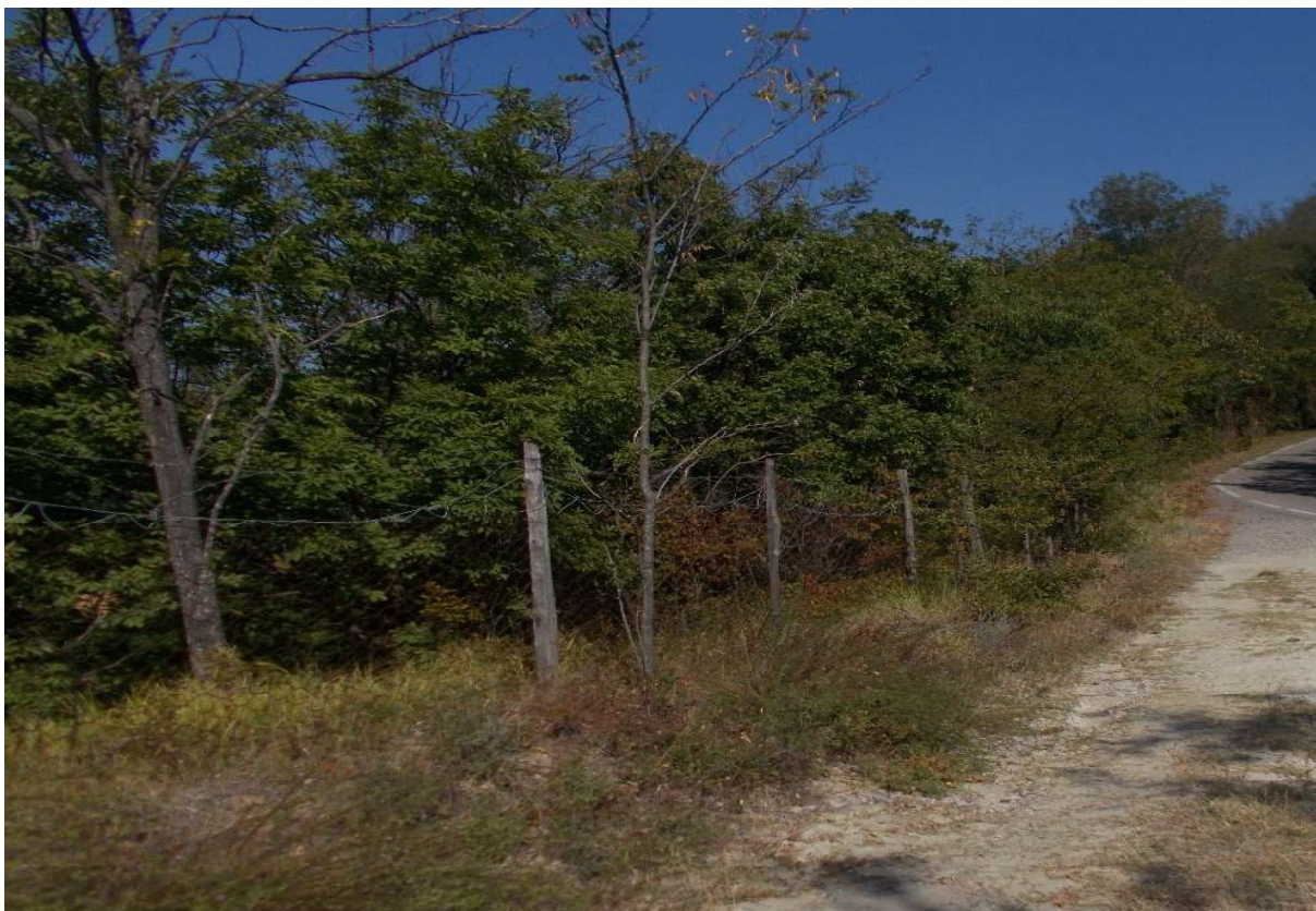
15. Particolare appezzamento di terreno descritto al mapp. 353 del foglio 9 - Comune di Monleale