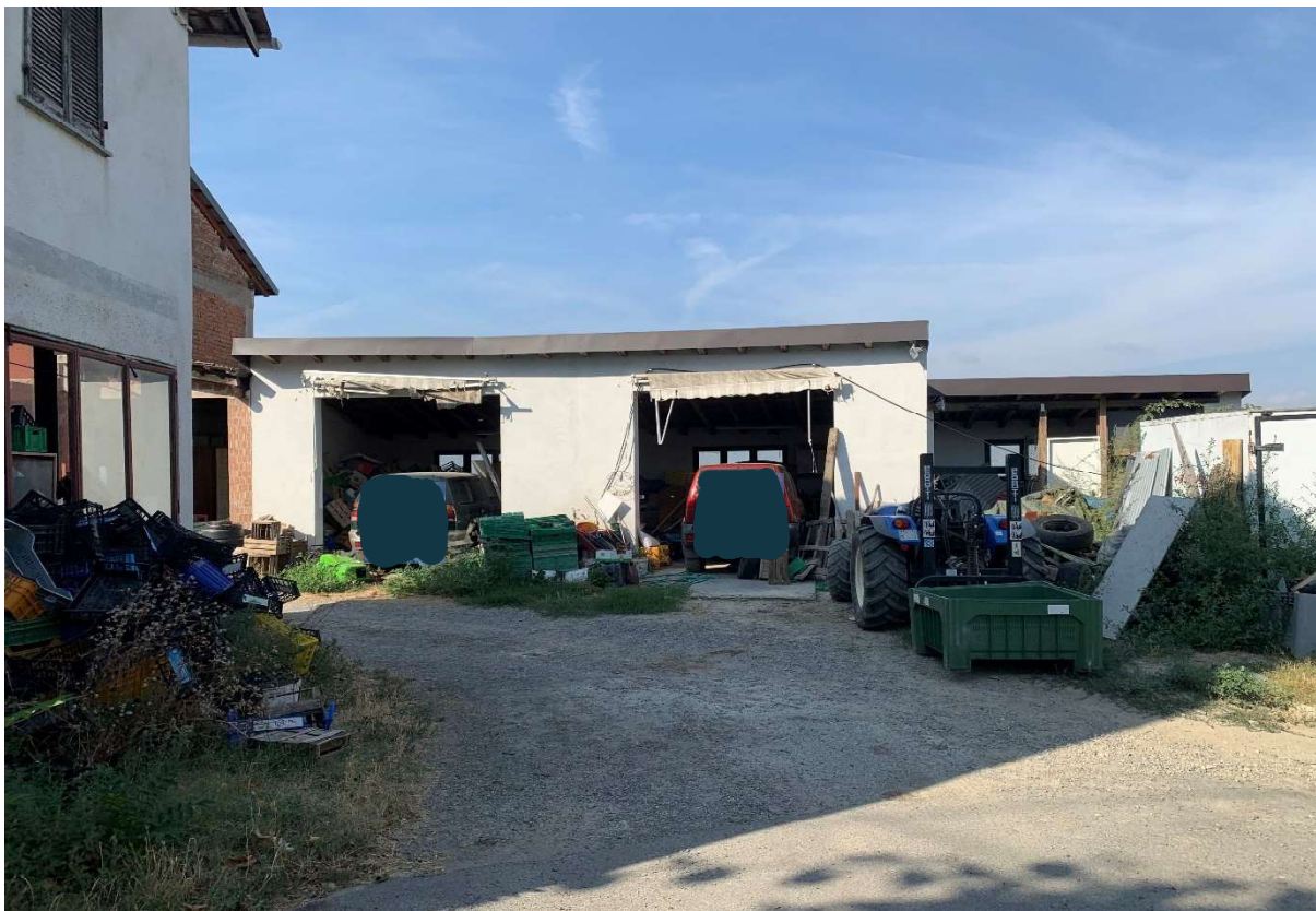
3. Locale magazzino antistante l'abitazione