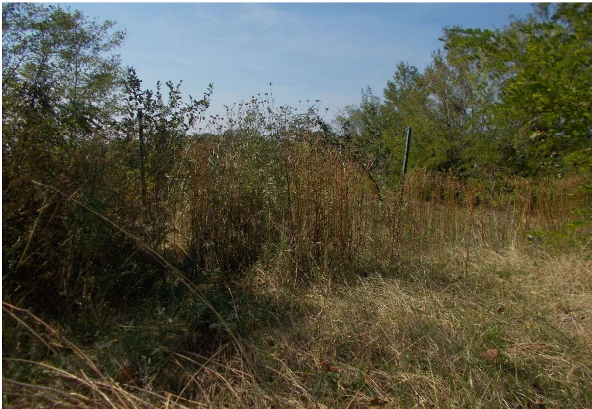
16. Particolare appezzamenti di terreno descritti ai mapp. 350 e 351 del foglio 9 - Comune di Sarezzano