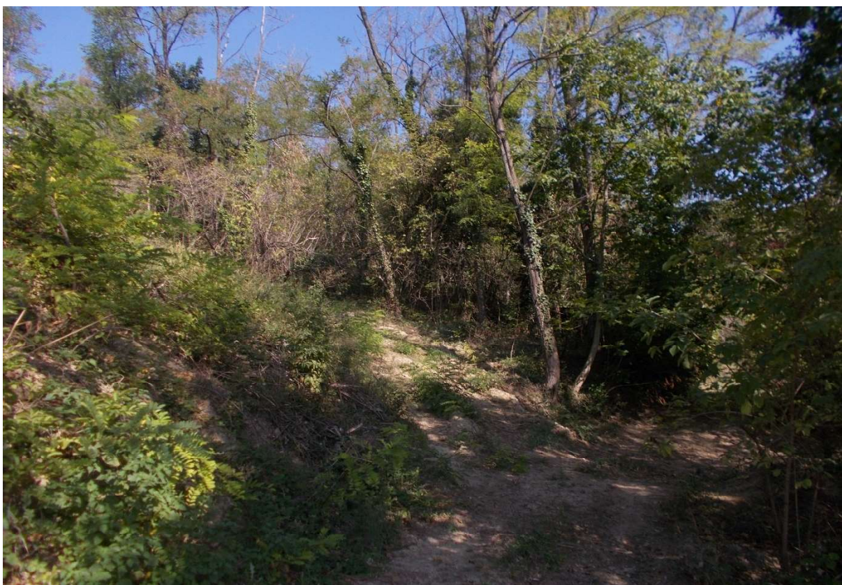
14. Particolare appezzamenti di terreno descritti ai mapp. 282 e 283 del foglio 9 - Comune di Monleale