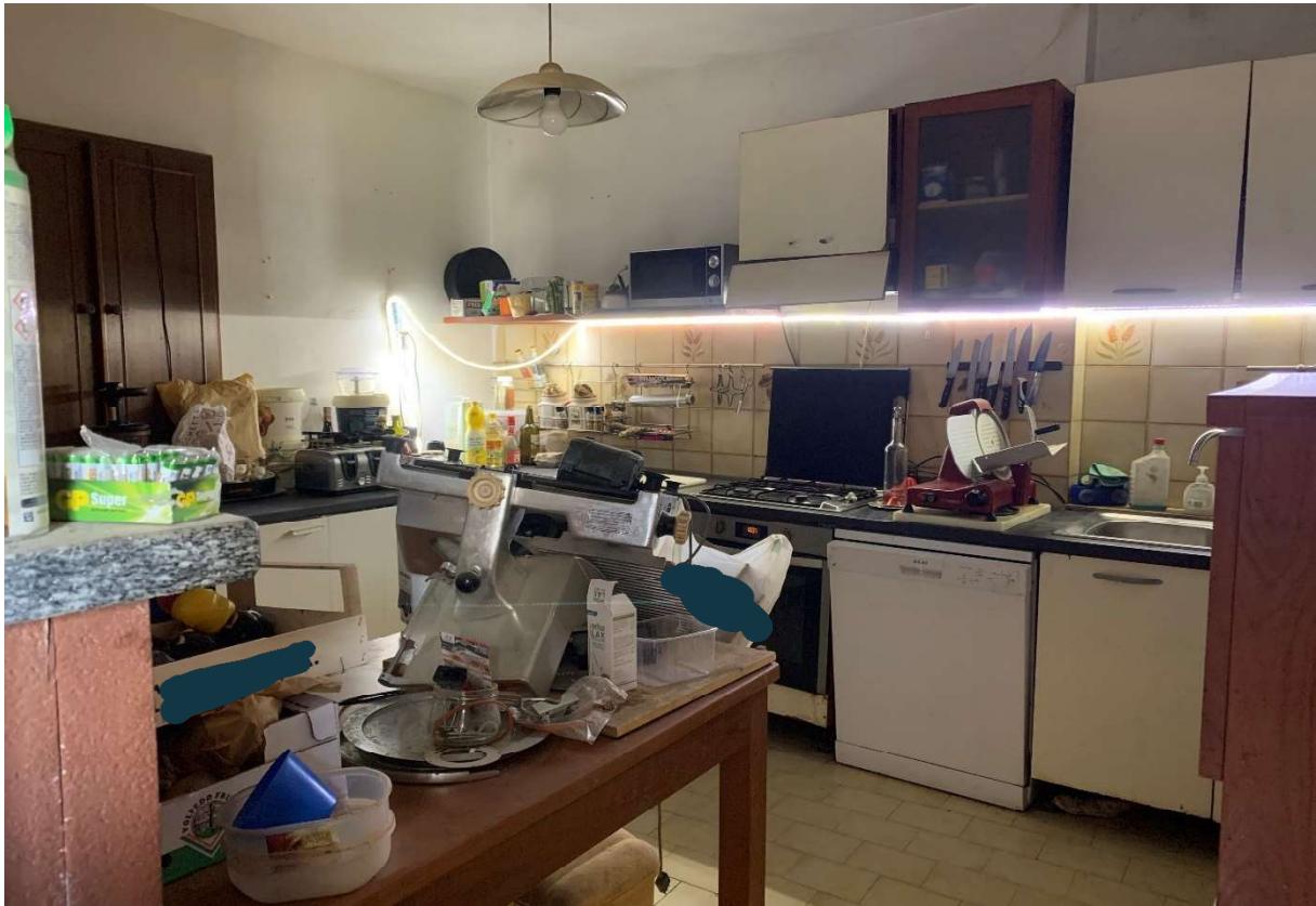
5. Particolare interno cucina al piano terra