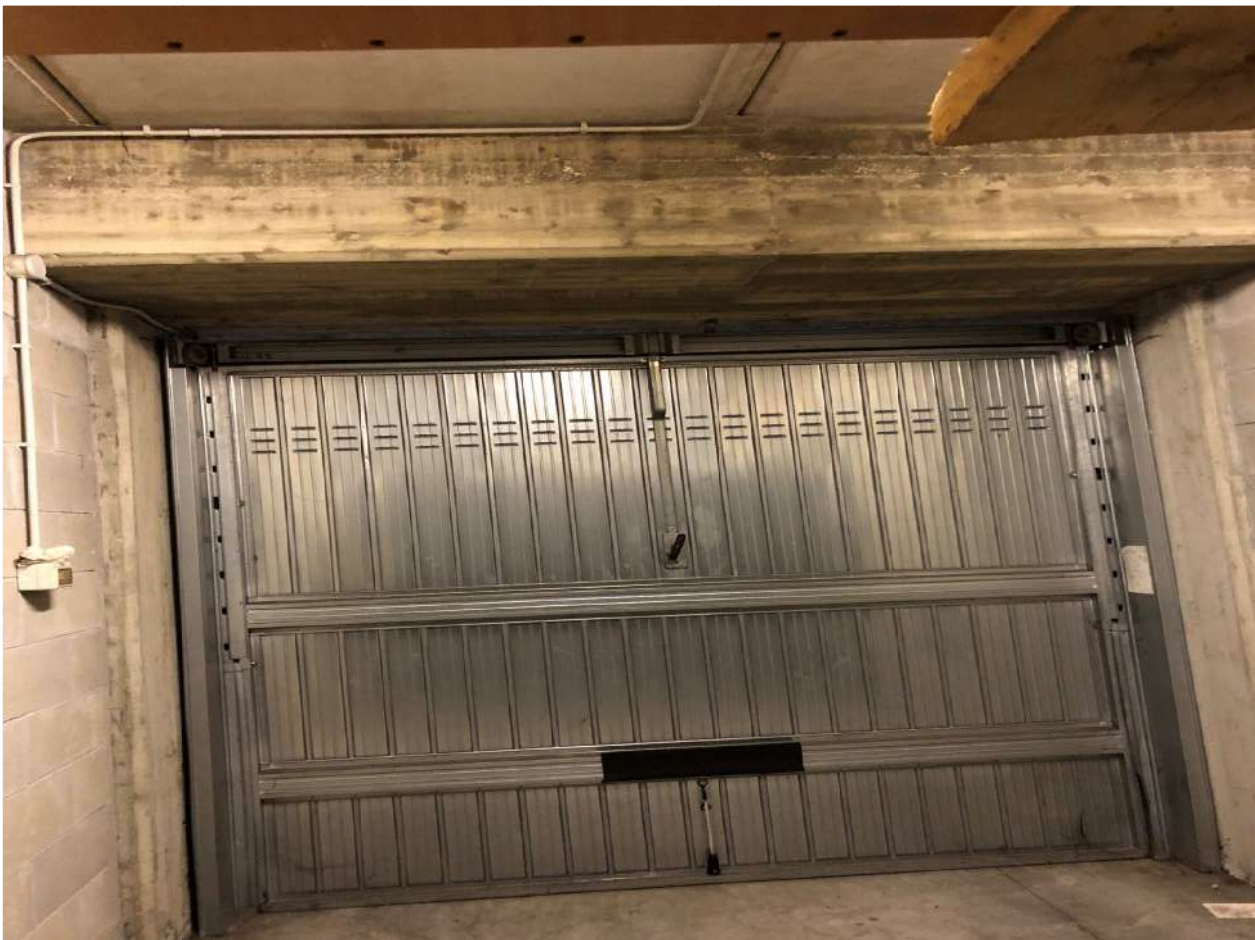
Vista interno box