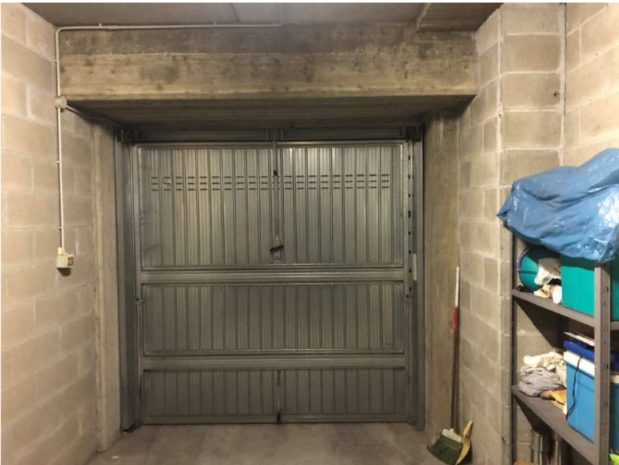
Vista ingresso box