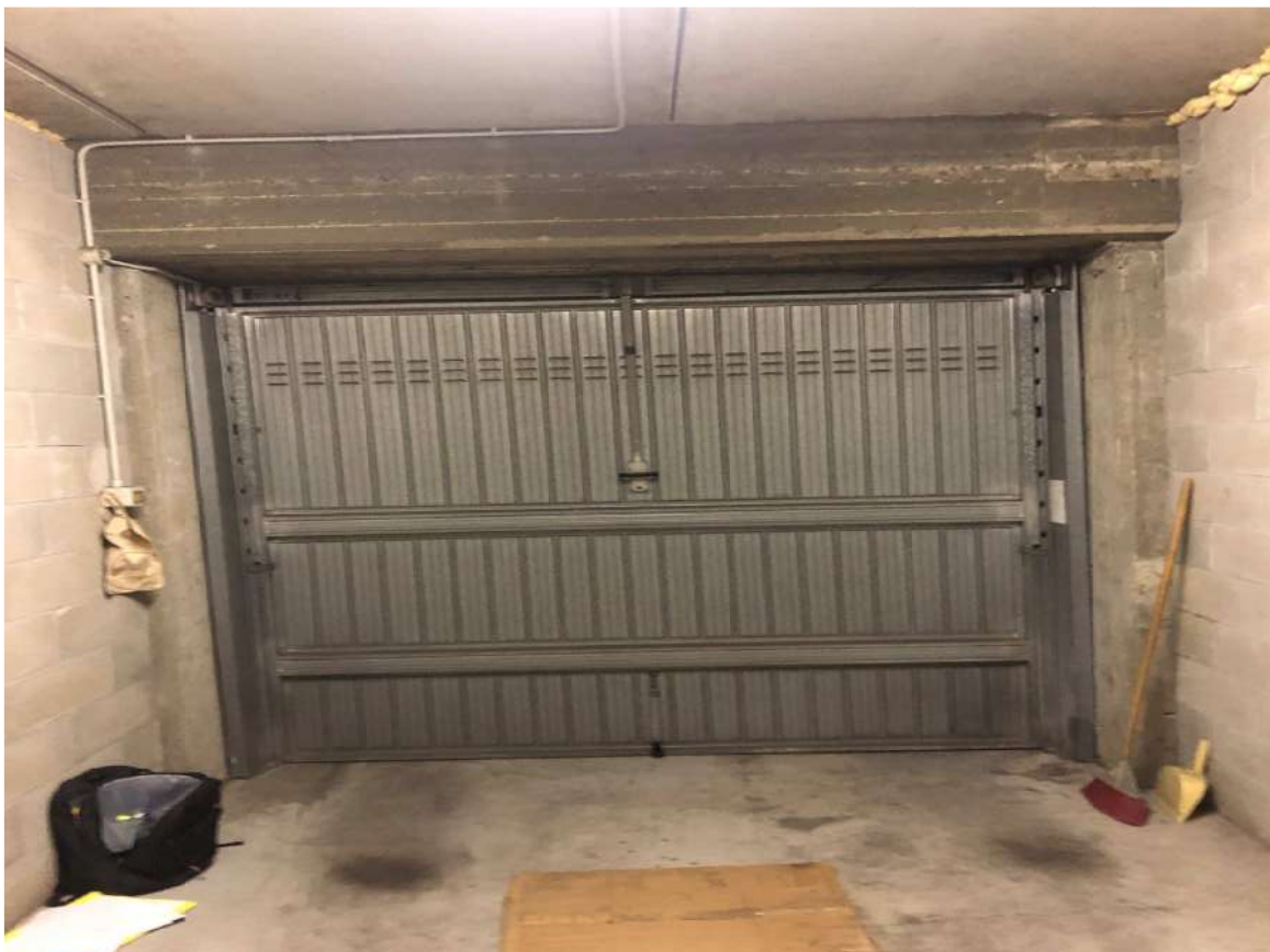
Vista interno box