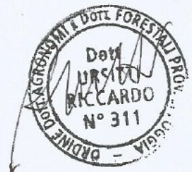
Foto m. 9