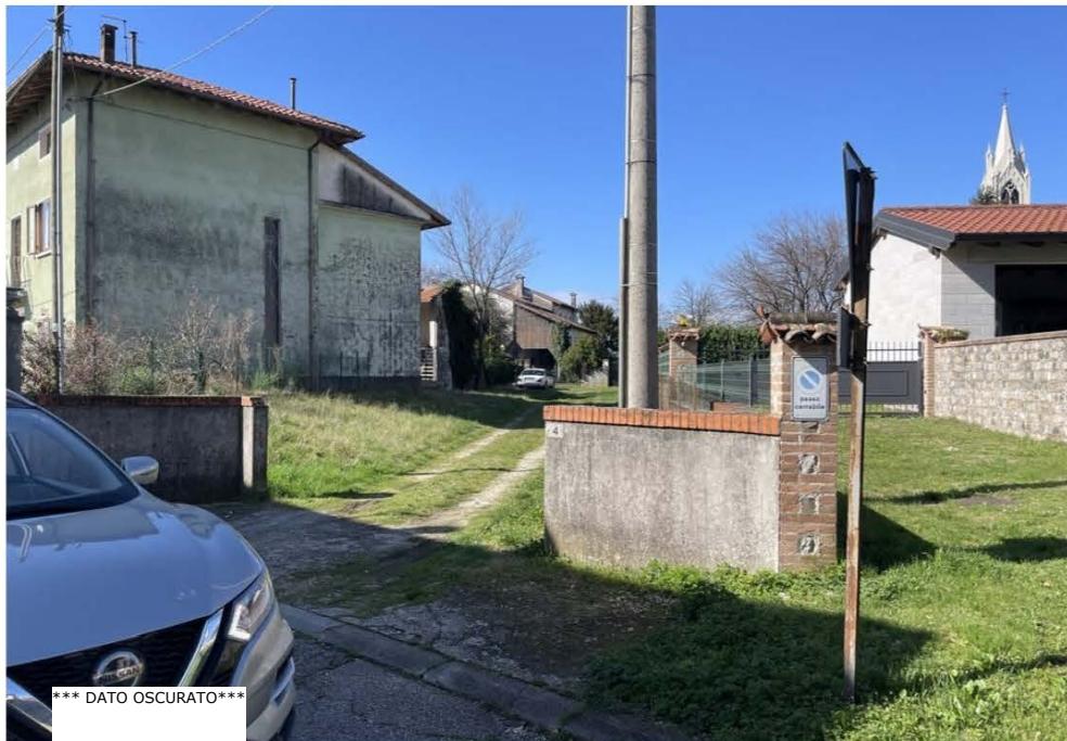
Accesso da via Piave