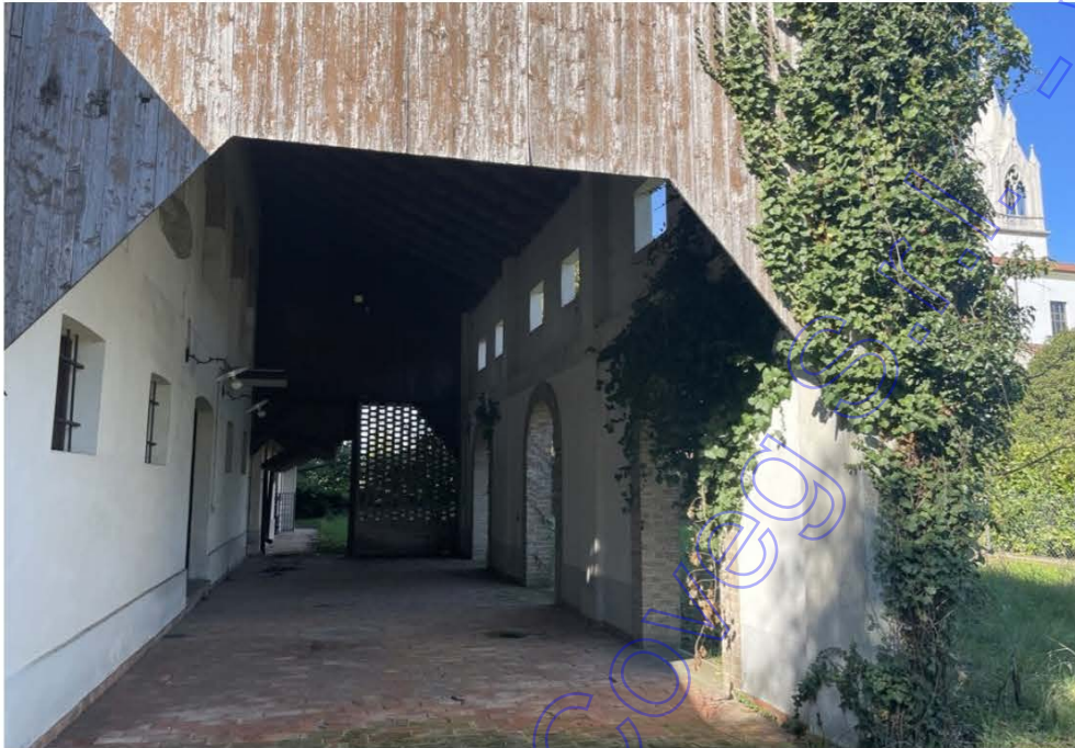
Portico di fronte casa