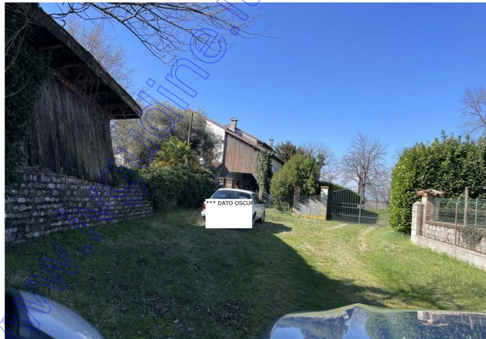
ALLEGATO 1 - Foto