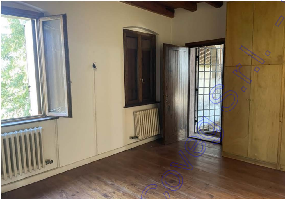
Guardaroba piano primo