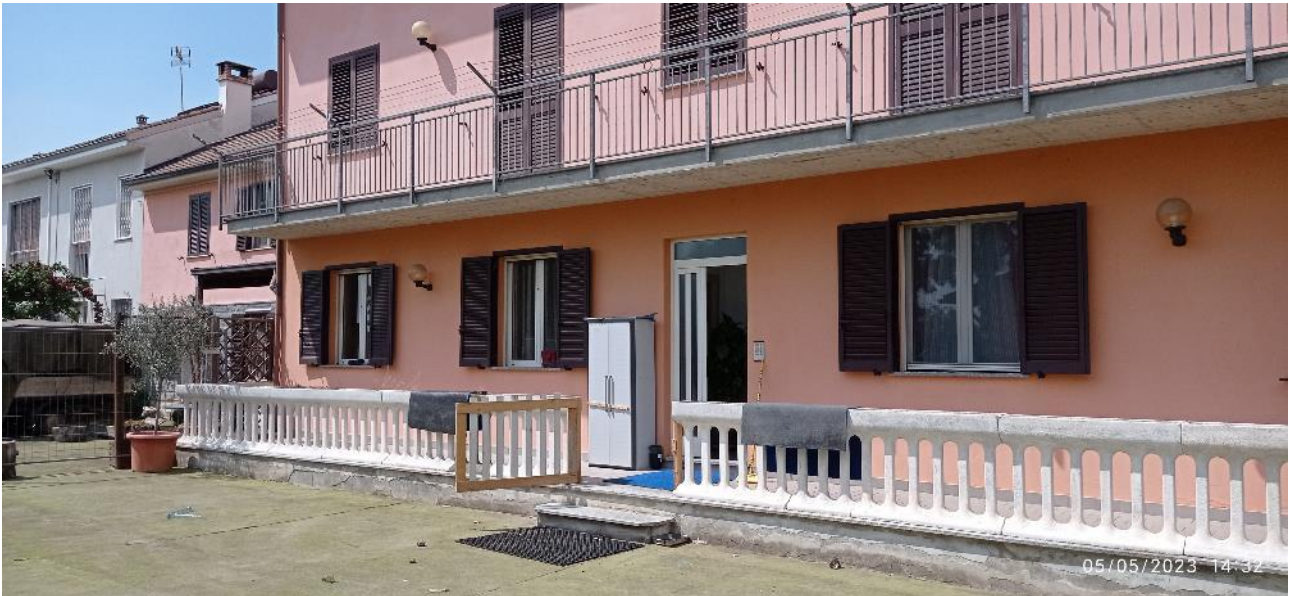
7. Ingresso secondario fabbricato