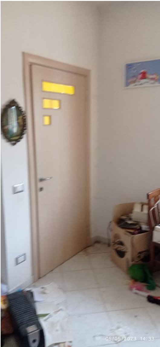
13. Ingresso secondario unità immobiliare (camera)