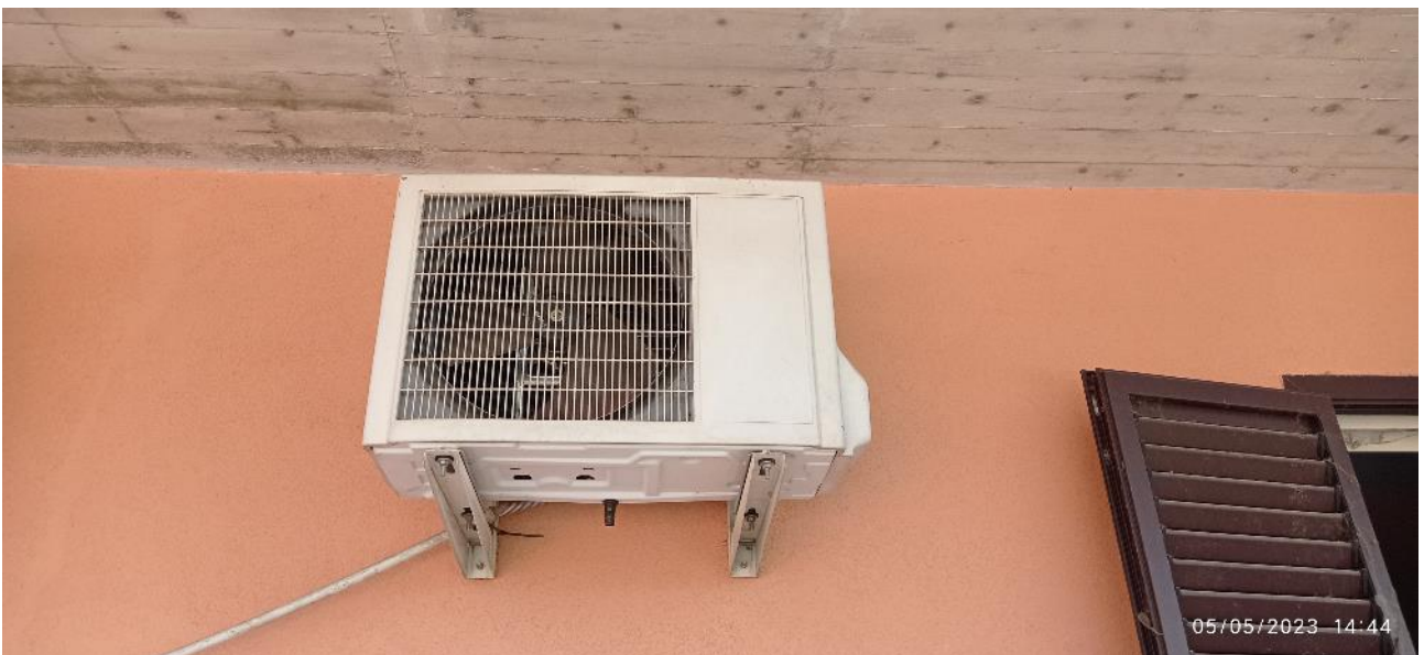
28. Motore esterno pompa di calore esistente