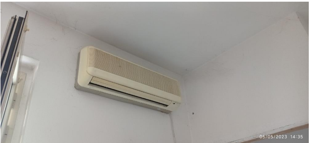
25. Unità interna pompa di calore