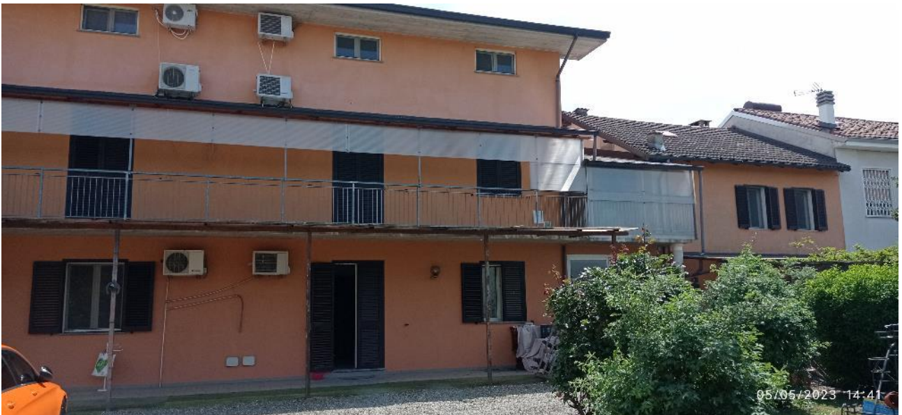
4. Prospetto principale fabbricato – accesso all'unità immobiliare