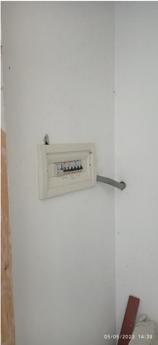
26. Dettaglio quadro elettrico