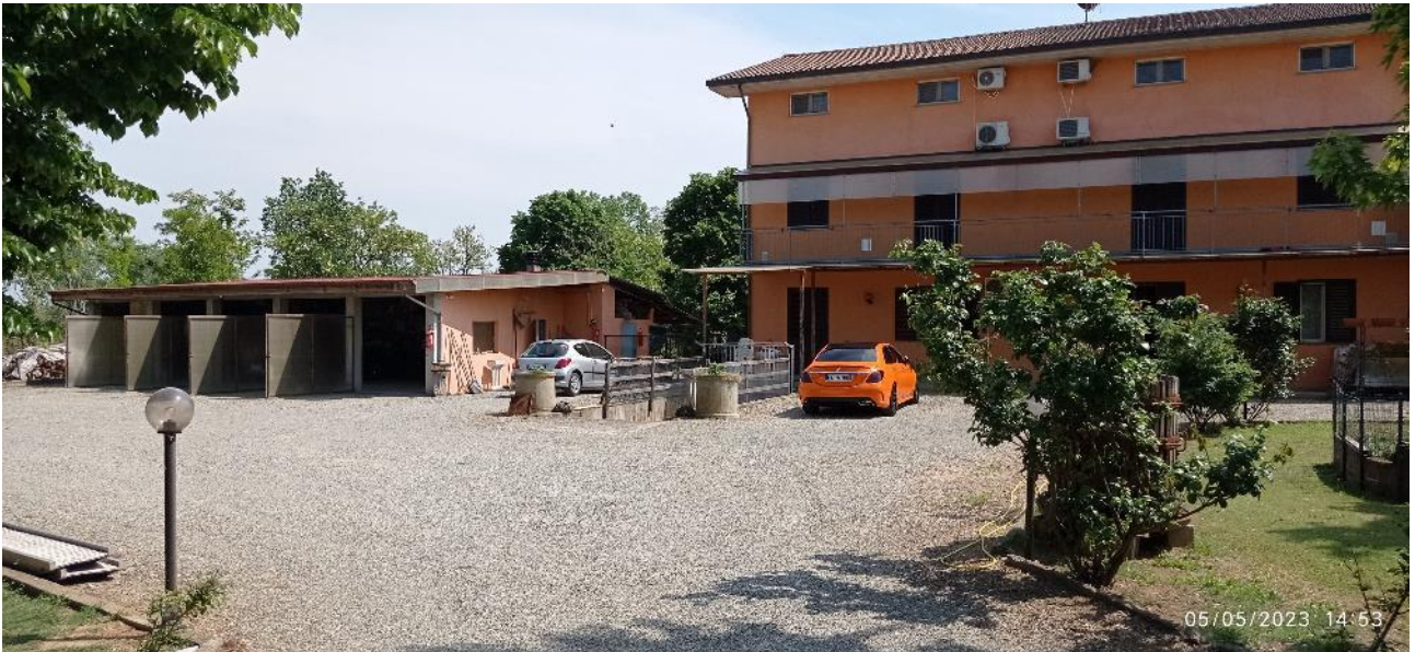
3. Prospetto principale fabbricato