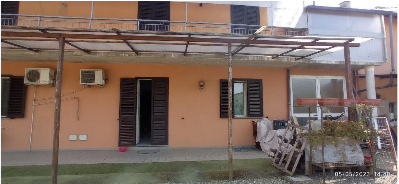
5. Prospetto principale fabbricato – accesso all'unità immobiliare