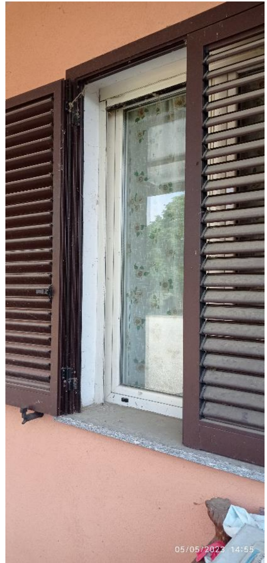
10. Dettaglio serramenti esterni