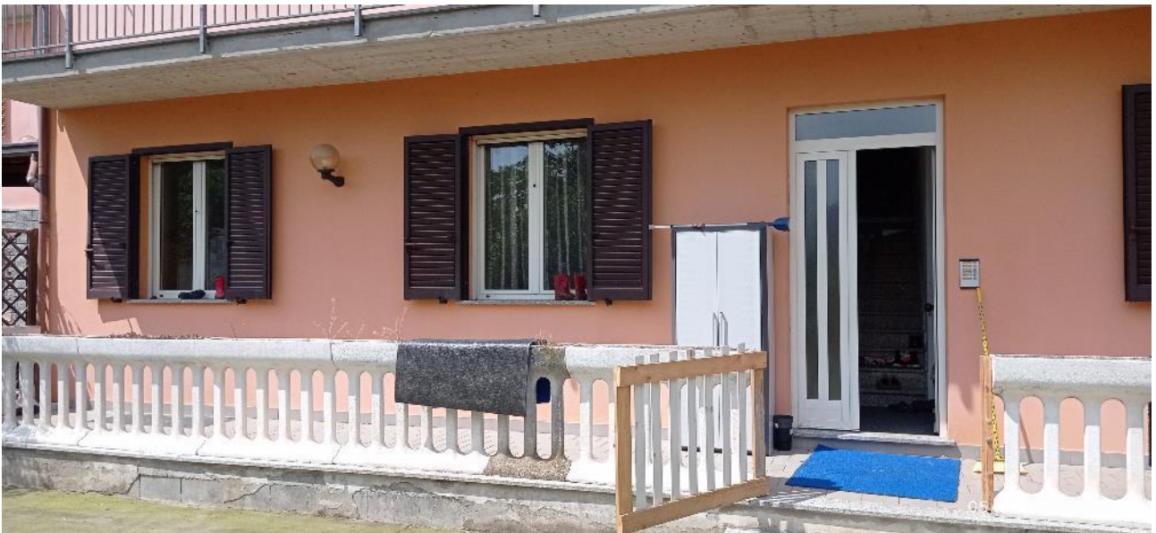
8. Ingresso secondario fabbricato