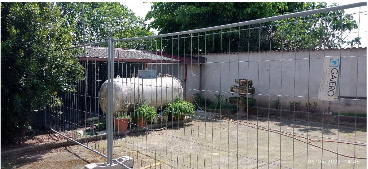
31. Cisterna GPL