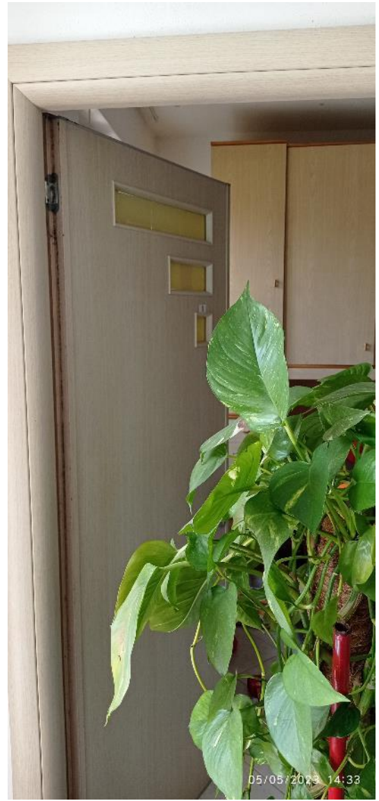
12. Ingresso secondario unità immobiliare