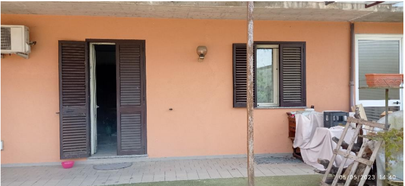
6. Prospetto principale fabbricato – accesso all'unità immobiliare