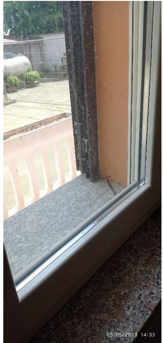
14. Dettaglio serramenti esterni