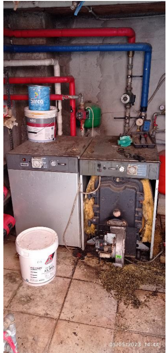
30. Caldaia centralizzata