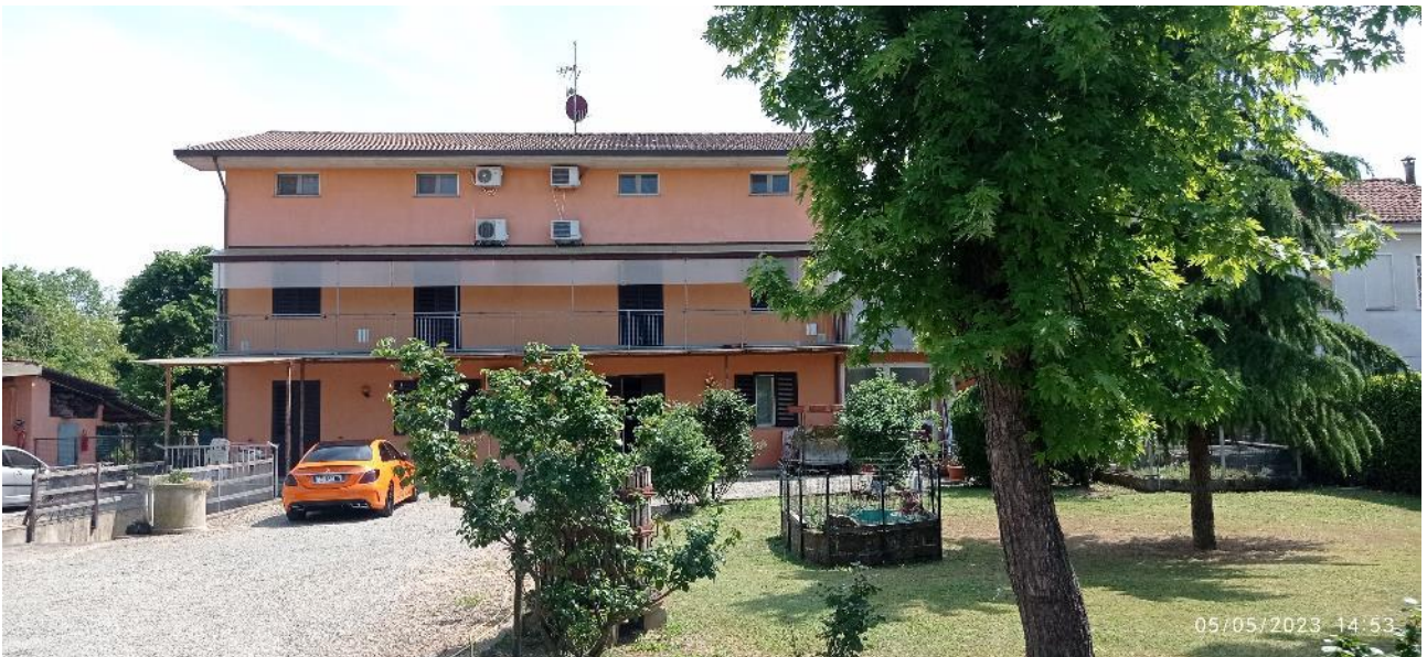
2. Prospetto principale fabbricato