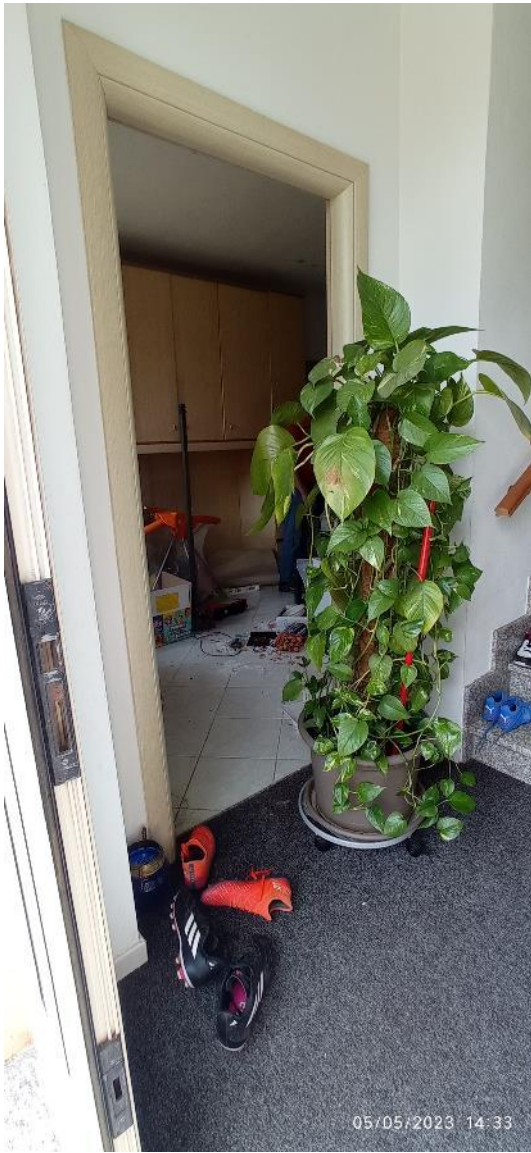
11. Ingresso secondario unità immobiliare