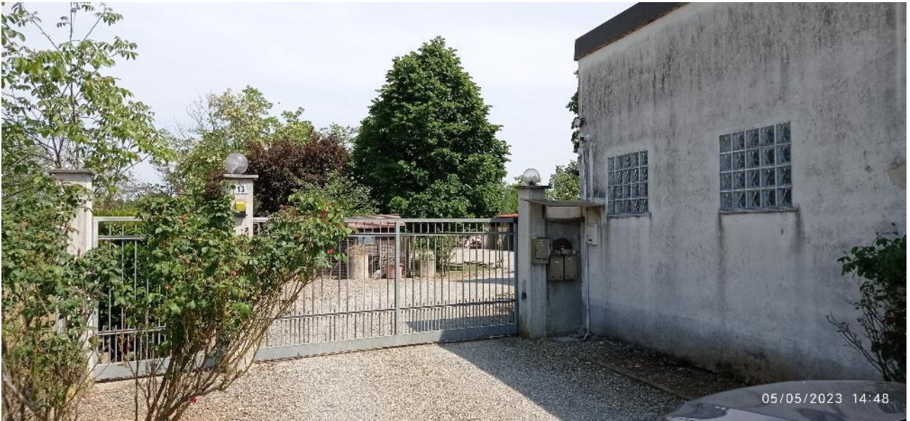
1. Accesso alla proprietà