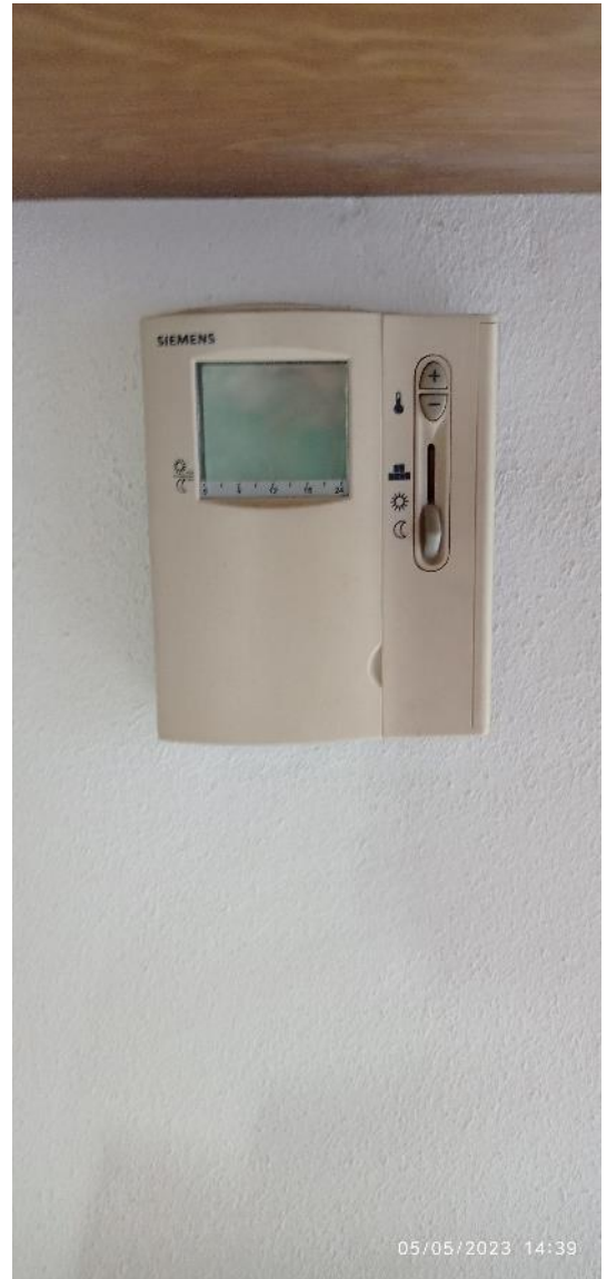
27. Dettaglio videocitofono