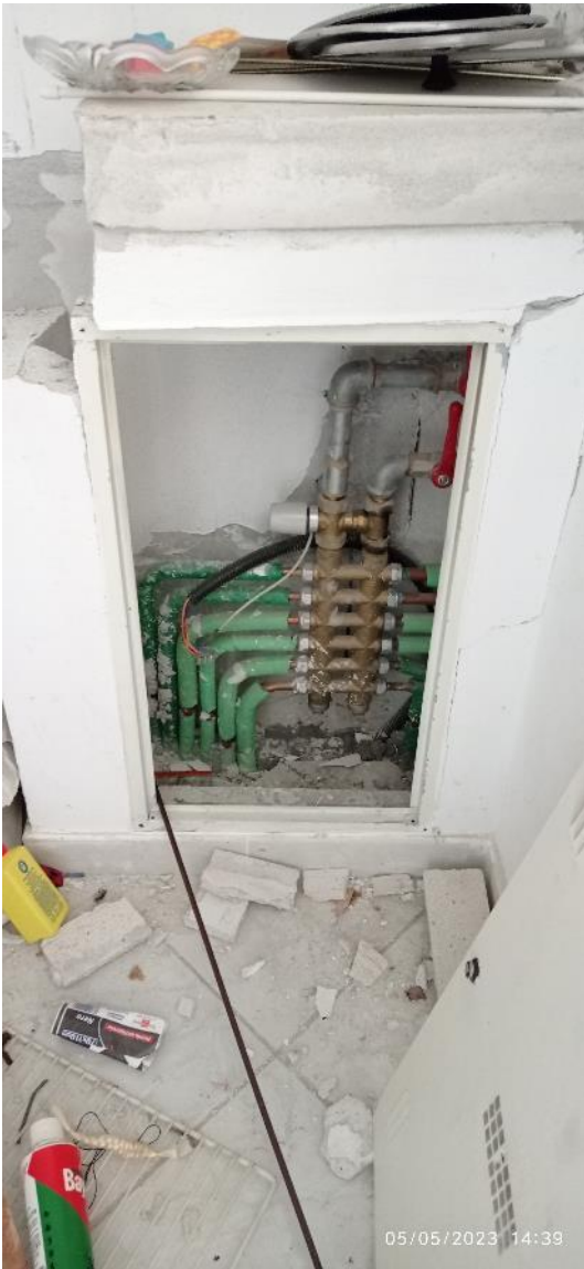
29. Dettaglio collettore di distribuzione riscaldamento