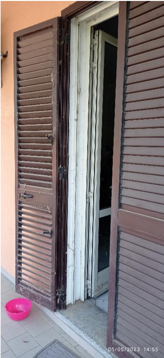
9. Serramento ingresso principale fabbricato