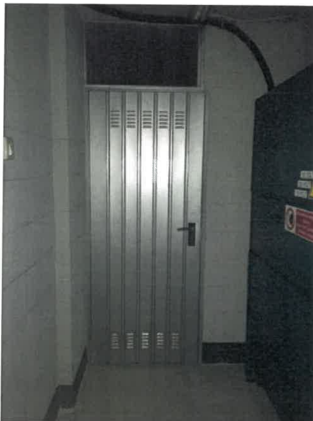
Foto 21 - Cantina