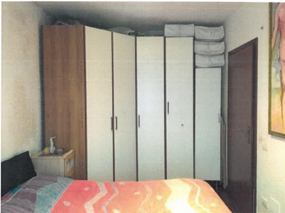
Foto 18 - Camera