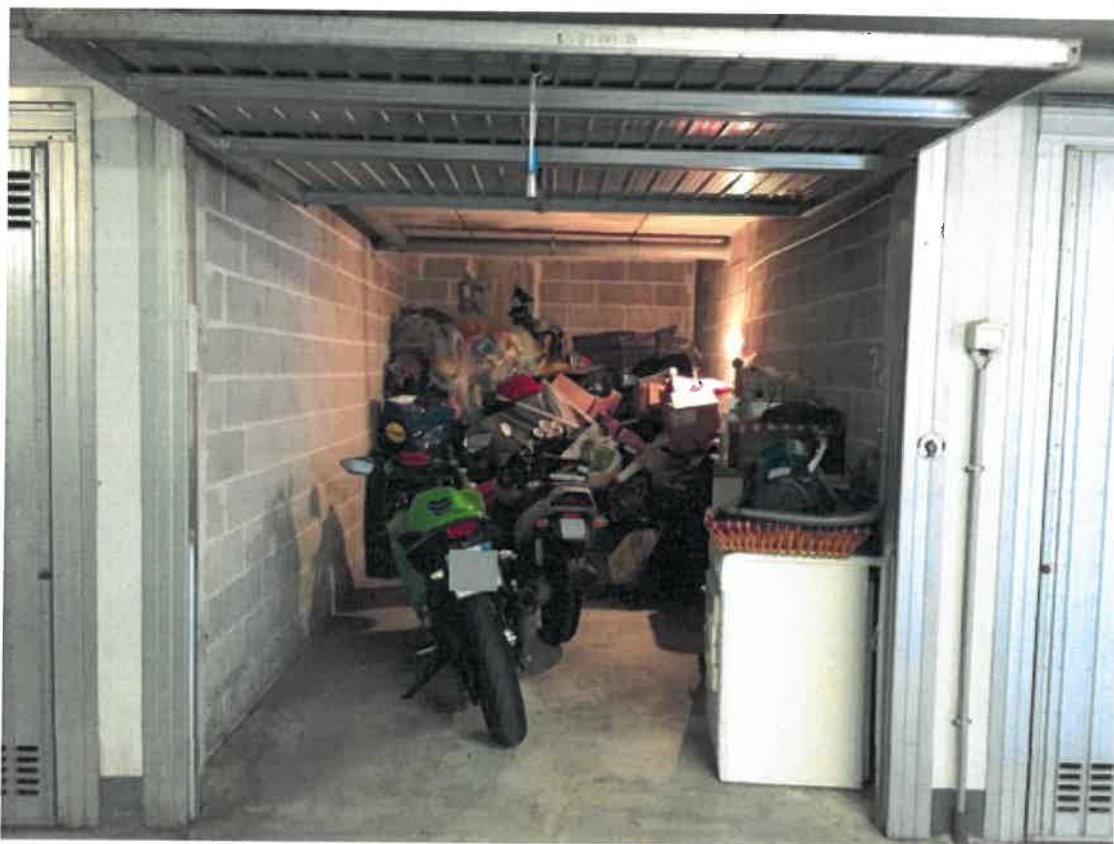
Foto 24 - Box