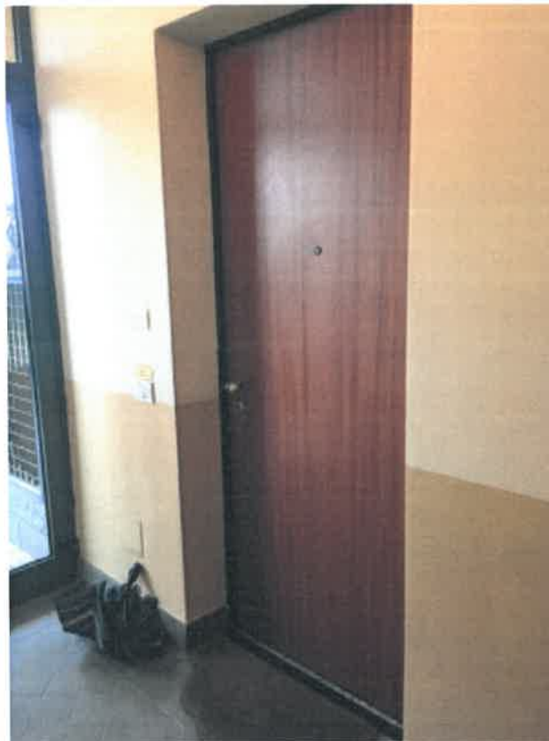
Foto 08 - Ingresso all'unità dal pianerottolo