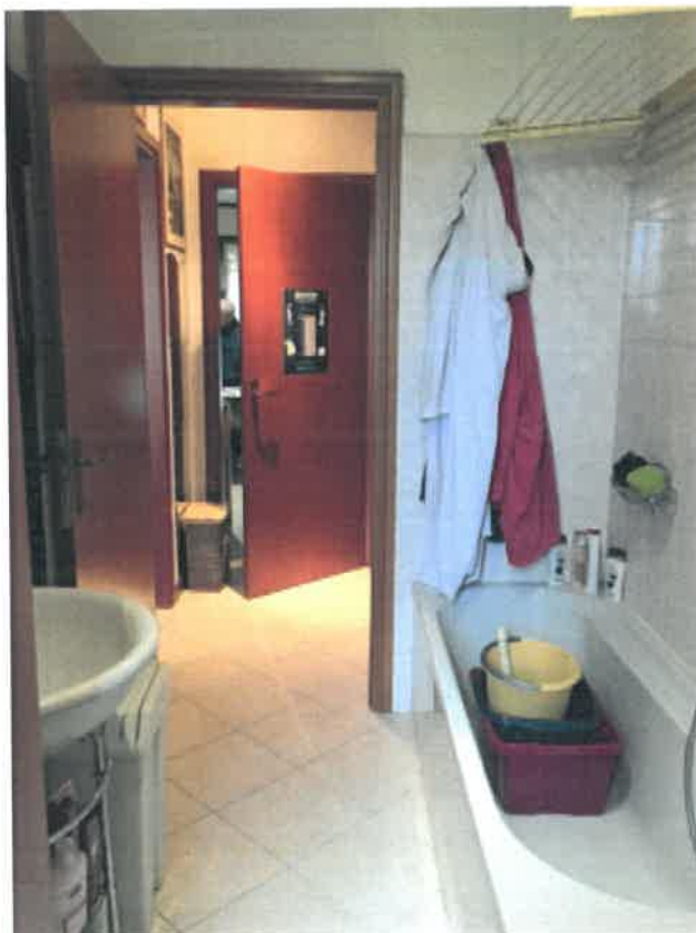
Foto 16 - Bagno