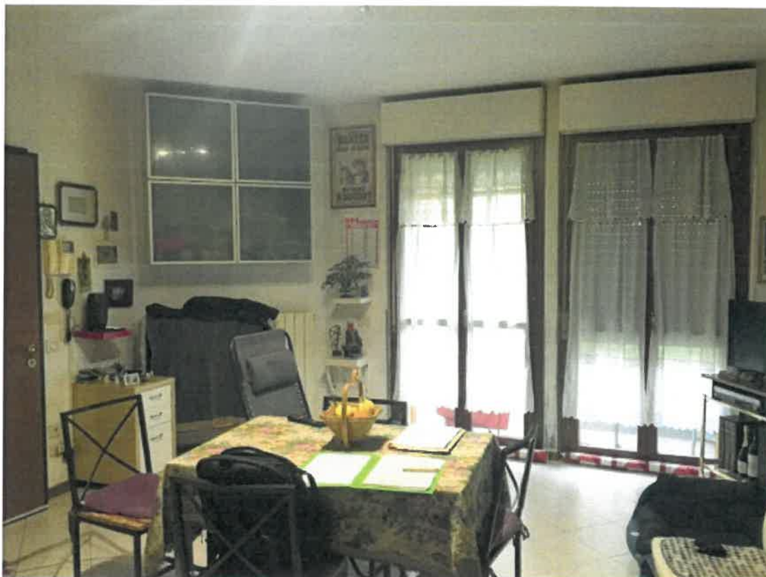
Foto 10 - Soggiorno