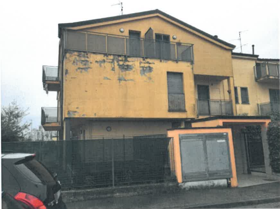
Foto 04 - Il fabbricato su via Sondrio 12