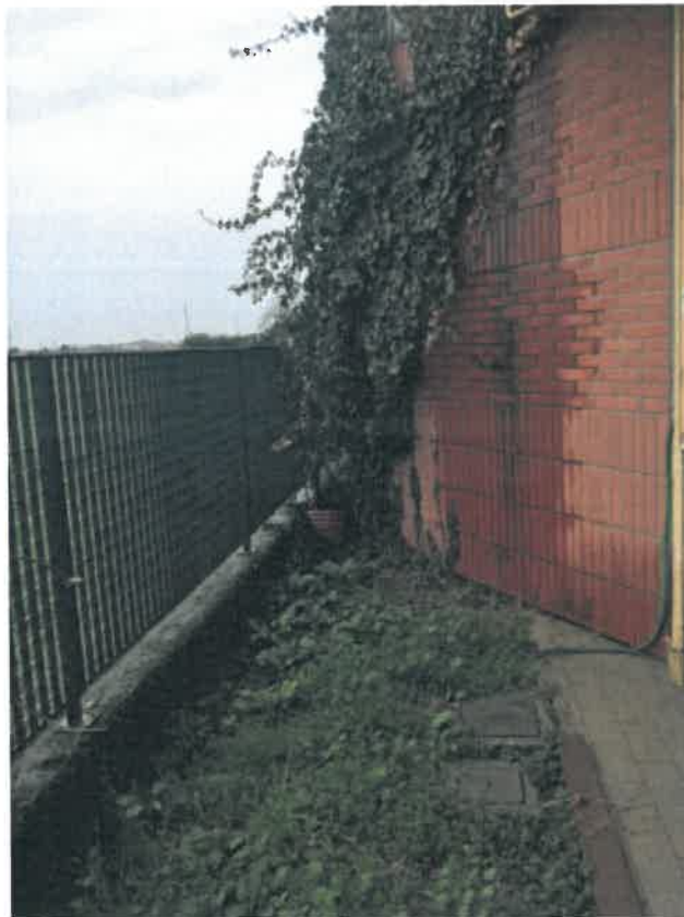
Foto 20 - Giardino di pertinenza sul retro