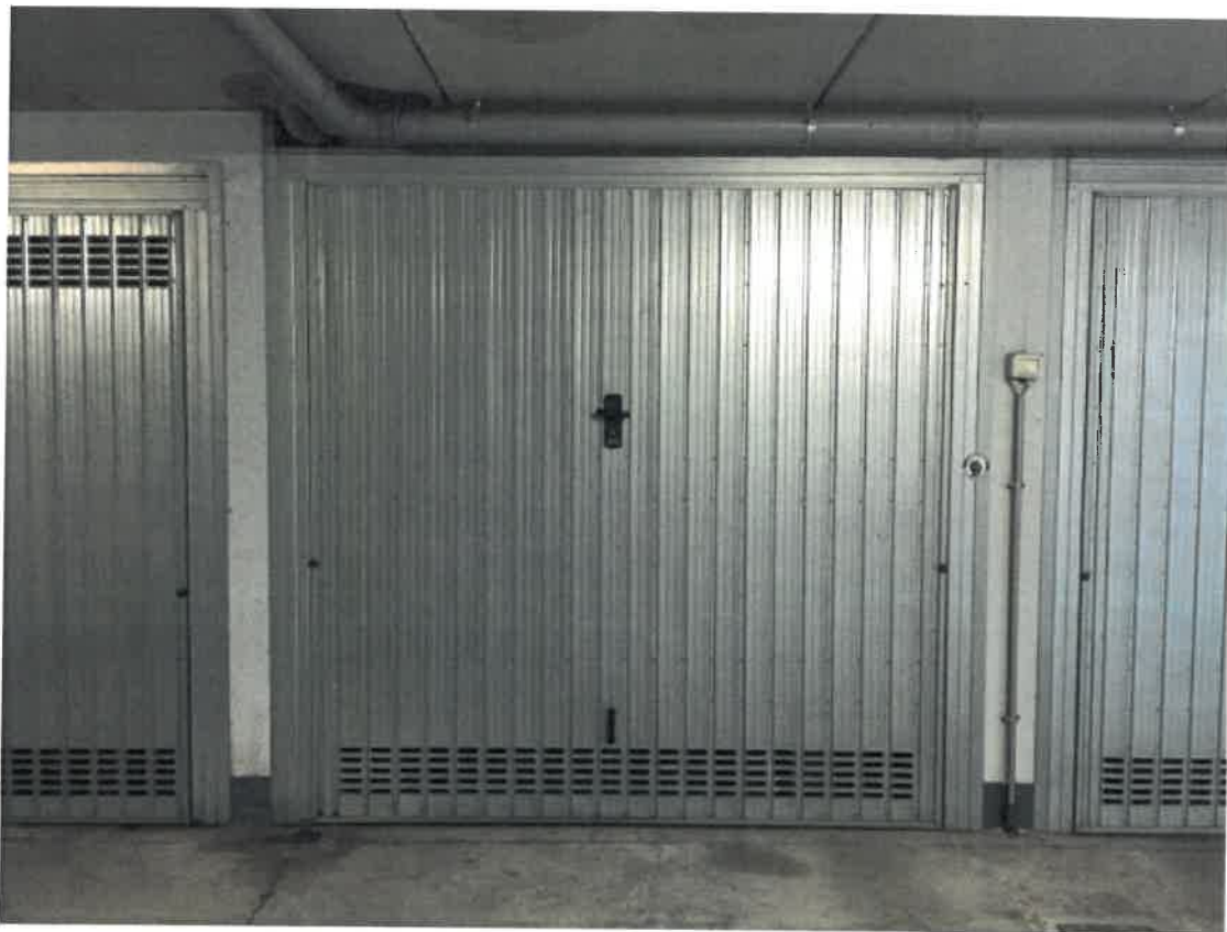
Foto 23 - Box