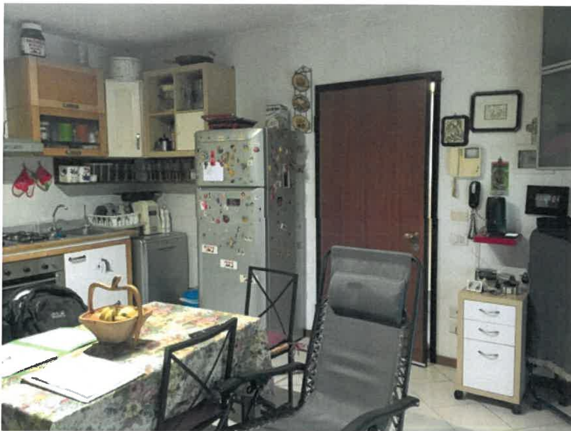
Foto 09 - Soggiorno con cucina a vista