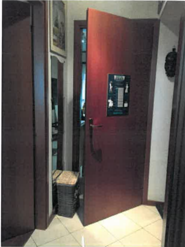
Foto 13 - Disimpegno