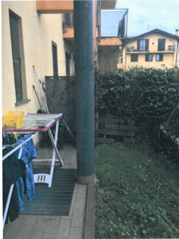
Foto 19 - Giardino di pertinenza sul retro