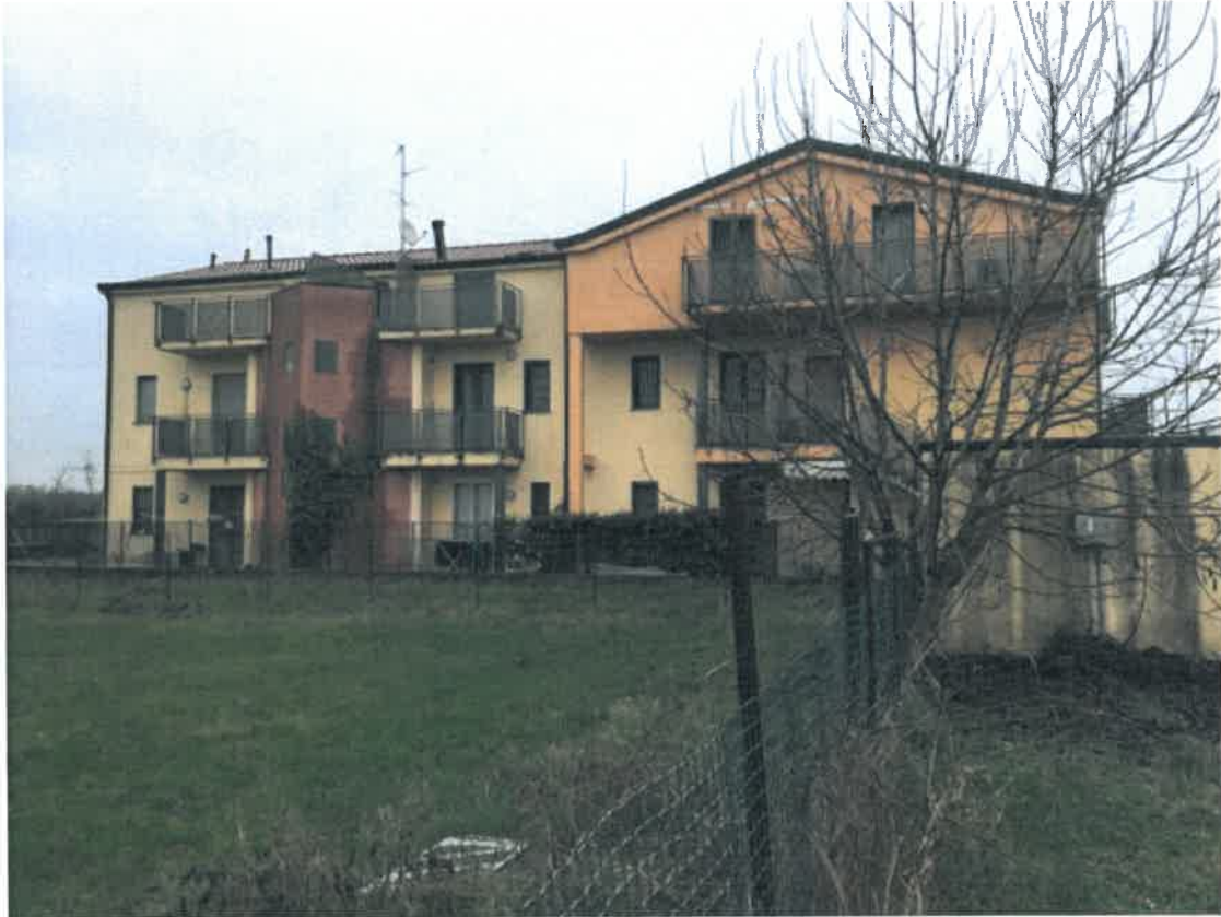
Foto 03 - Il fabbricato sul retro