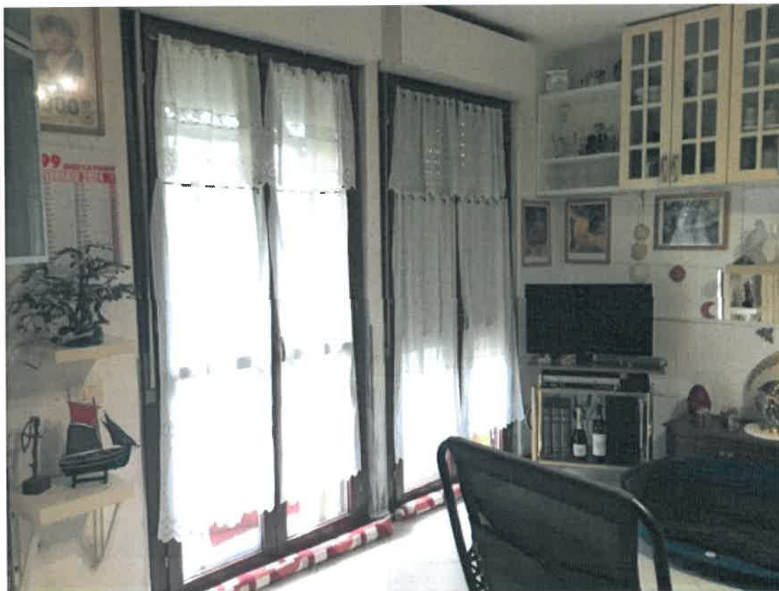
Foto 11 - Soggiorno