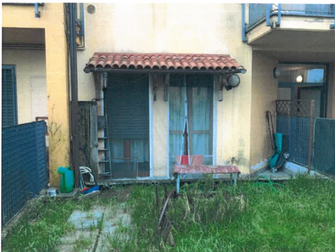
Foto 06 - Giardino di pertinenza sul fronte