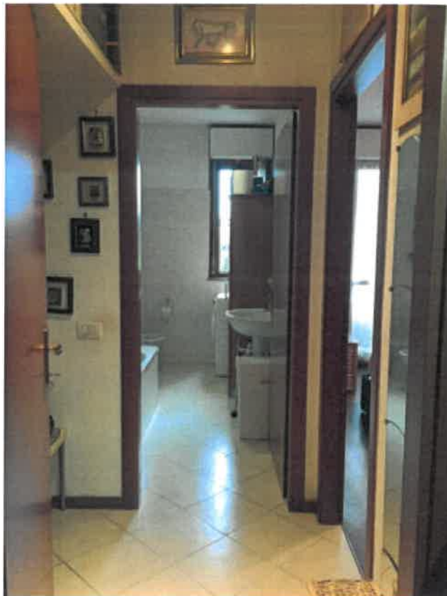
Foto 14 - Disimpegno