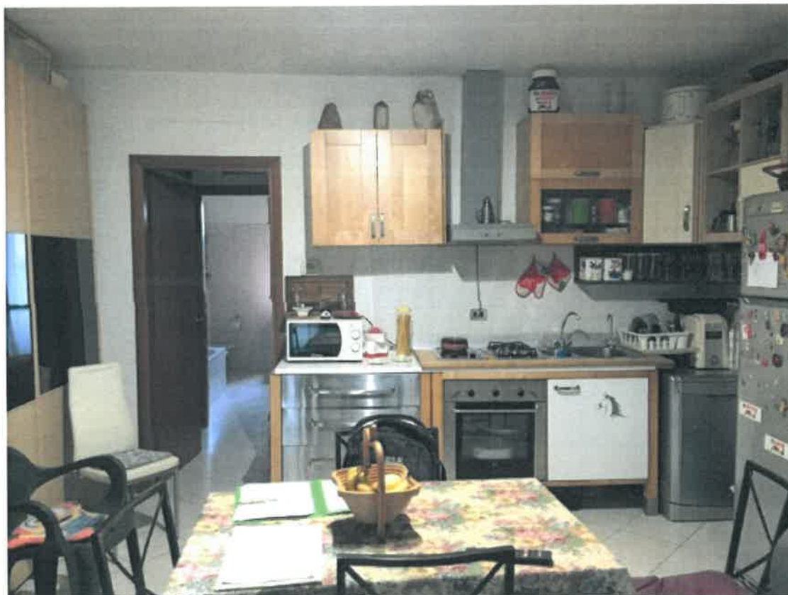
Foto 12 - Soggiorno con cucina a vista