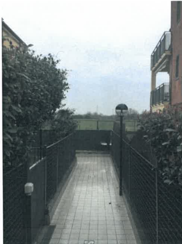
Foto 07 - Vialeto d'ingresso condominiale