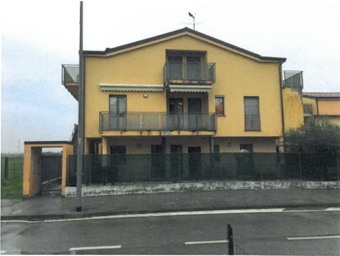
Foto 01 - Il fabbricato su via Sondrio