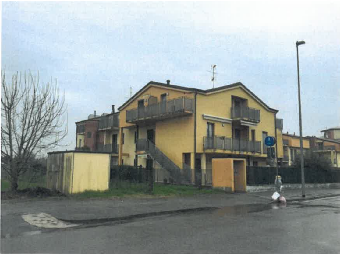
Foto 02 - Il fabbricato su via Sondrio