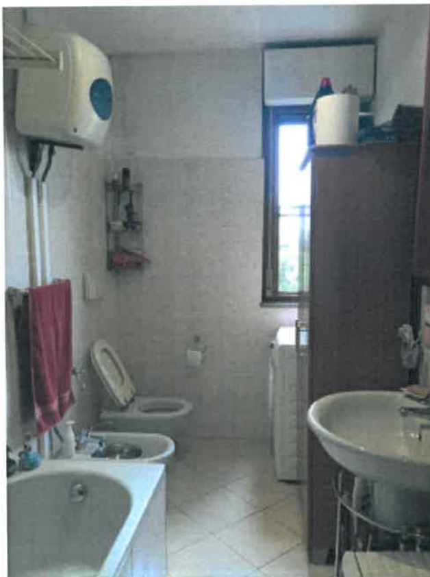
Foto 15 - Bagno