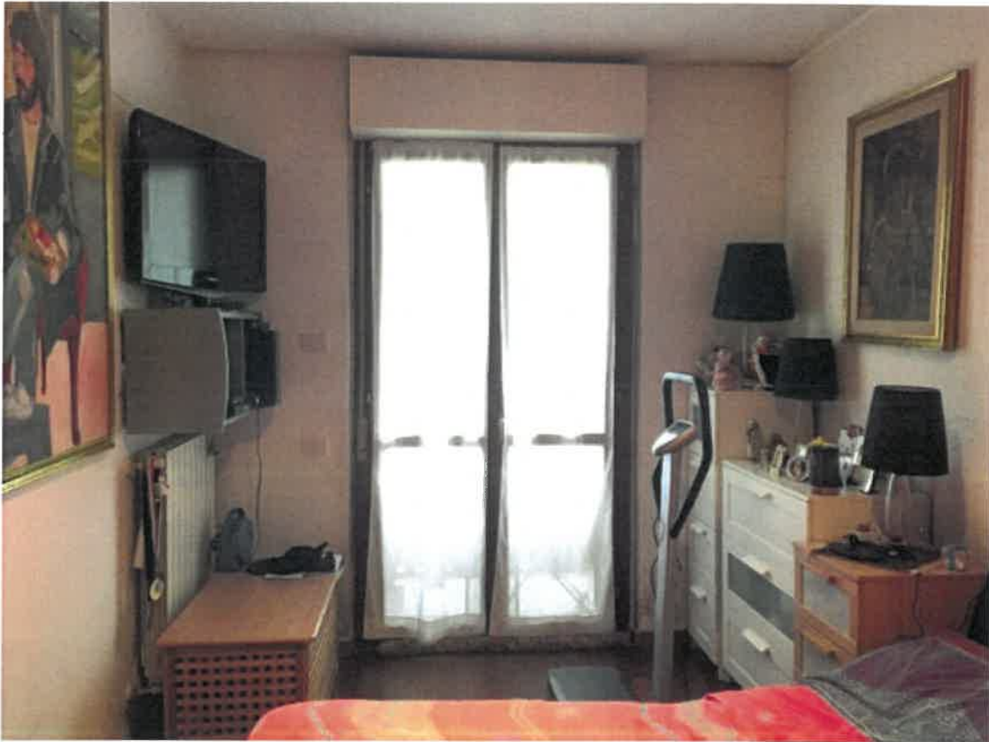
Foto 17 - Camera