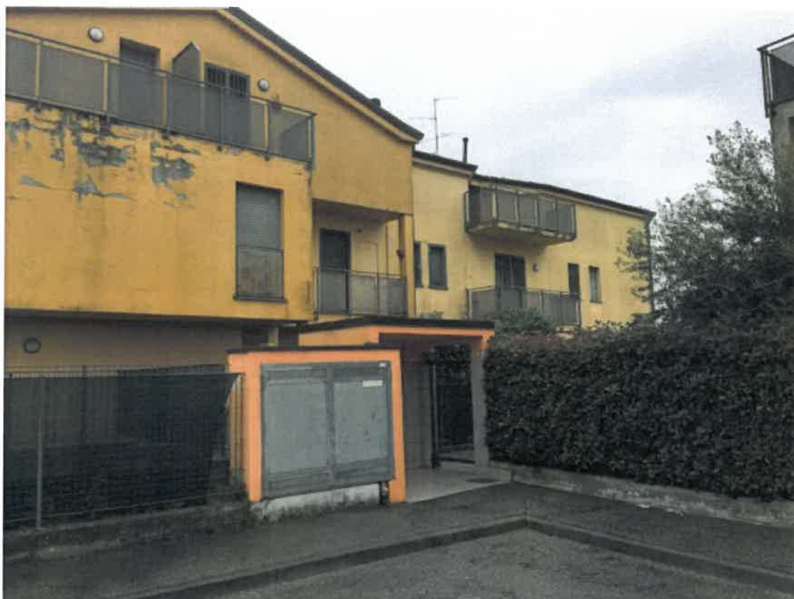
Foto 05 - Accesso al fabbricato dal civico 12 di via Sondrio