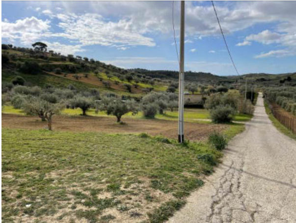
Foto 8 – Strada interpoderale che consente di raggiungere i fondi

L'appezzamento di terreno ha giacitura leggermente declive verso nord est, non è recintato ed è piantumato ad alberi di ulivo.