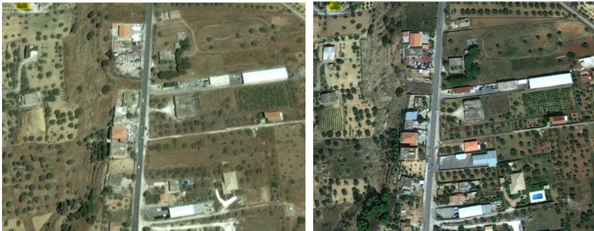
Aerofotografie di Niscemi datate rispettivamente in data luglio 2005 e settembre 2010 Si evince che il bene è stato edificato dal 2005 al 2010

La stima operata nel proseguo terrà conto di tali incertezze.