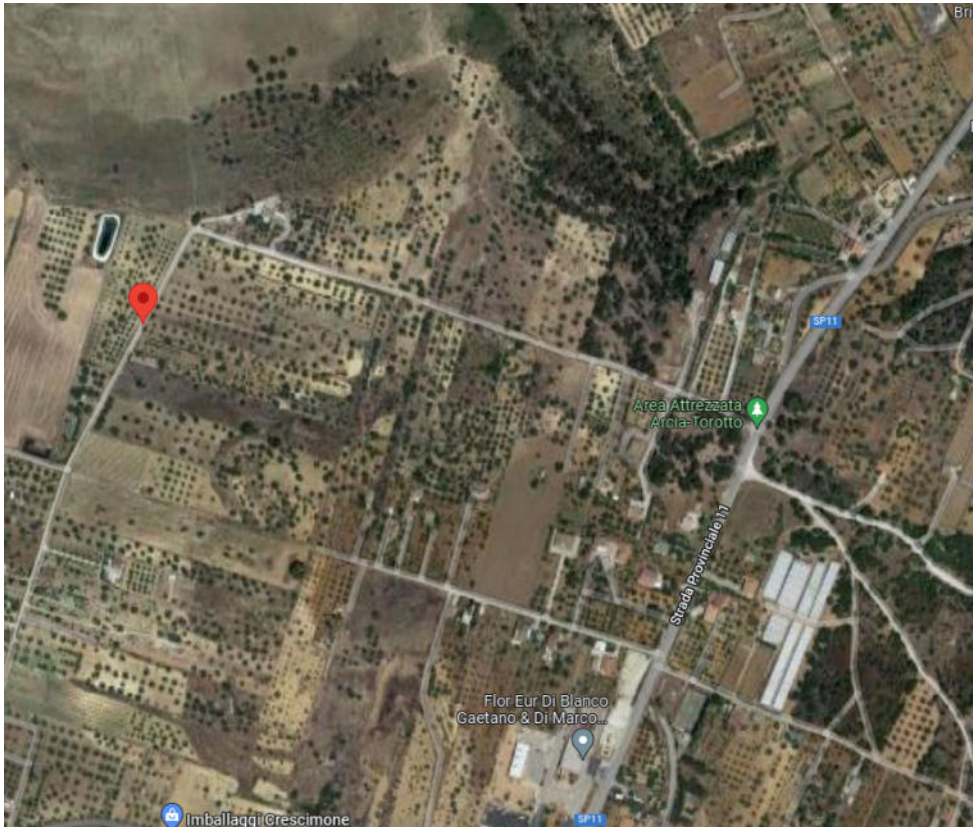
Aerofotografia con indicata la posizione dei beni (Coordinate GPS 37.11265014809139, 14.378469005627002)

L'appezzamento è a pochi chilometri (circa quattro) dal centro abitato del comune nisseno ed è facilmente raggiungibile attraverso stradelle interpoderali a fondo battuto che si dipartono dalla SP11. Le coordinate GPS per la puntuale individuazione sono: 37.11265014809139, 14.378469005627002.