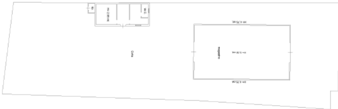
Fig. 1 – Planimetria catastale del bene

L'eventuale vendita sub asta non prevede il pagamento dell'IVA né è previsto nel caso in specie la redazione dell'attestato di prestazione energetica.