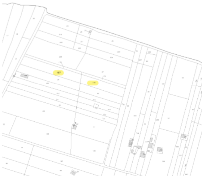
Stralcio catastale foglio 75, CT Comune di Niscemi con segnate le particelle 187 e 188