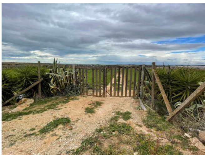
Foto 6 – Cancelli che delimita la strada di accesso ai fondi in oggetto

Sui terreni sono impiantati delle piante di vite (di due anni circa).