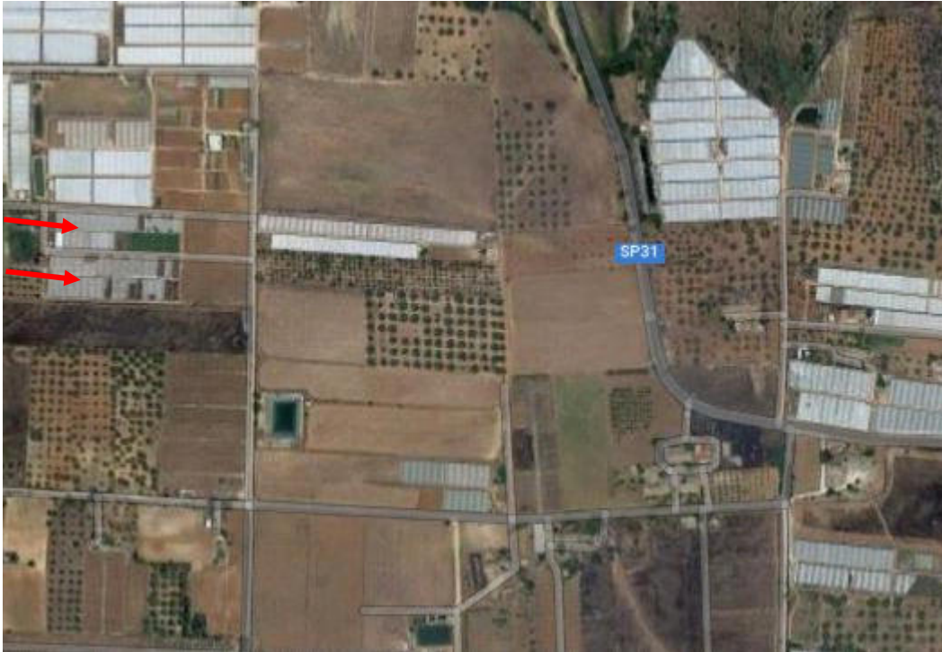
Aerofotografia con indicata la posizione dei beni (Coordinate GPS 37.07809635920542, 14.406625616839676)

I beni sono raggiungibili attraverso stradelle interpoderali che si dipartono dalla S.P. 31. Le coordinate GPS per la puntuale individuazione sono: 37.07809635920542, 14.406625616839676.