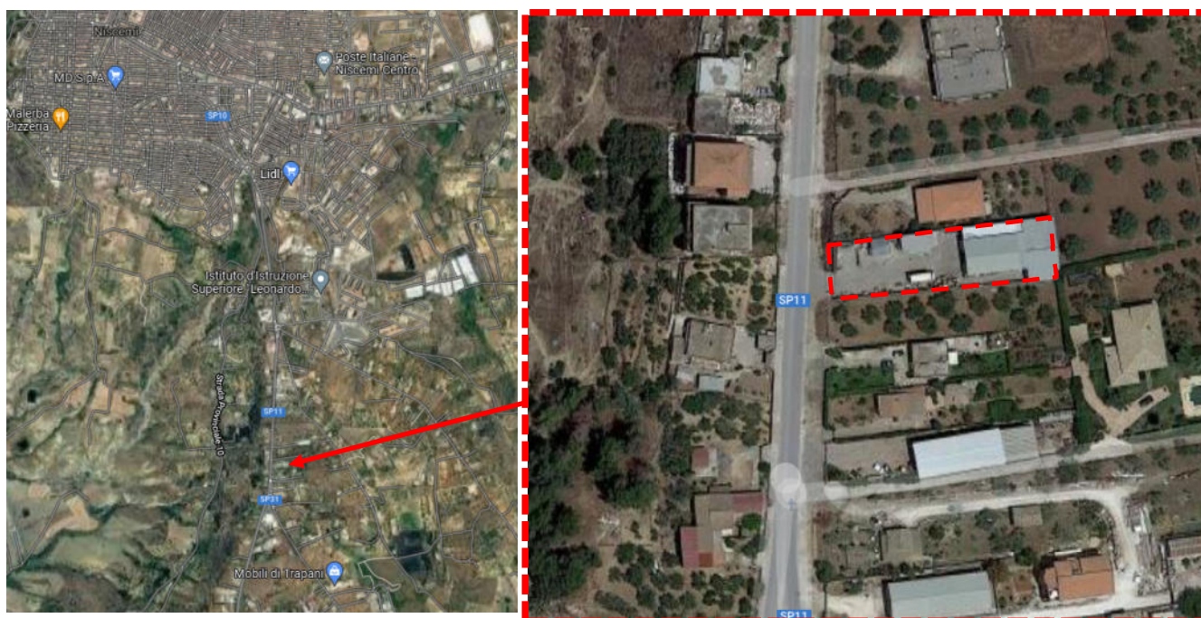
Aerofotografie di Niscemi con indicazione dell'immobile (Cespite 1) nel contesto cittadino