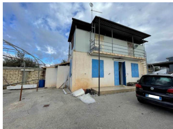
Foto 5 – Edificio adibito ad uffici al piano terra e a residenza del custode a primo piano

Il bene si compone inoltre di un piccolo edificio in muratura a due elevazioni fuori terra collegate da una scala esterna a chiocciola, adibito al piano terra ad ufficio, a primo piano a residenza del custode.