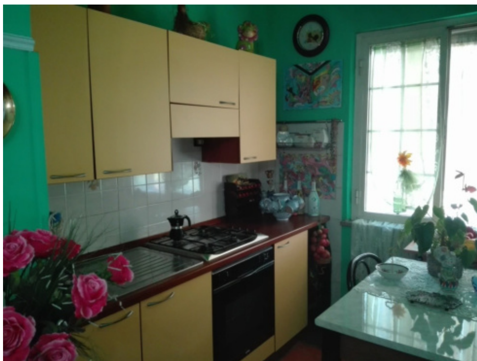
FOTO N°21 - Foto interna al fabbricato (abitazione) piano 1 - fg. 37 part. 410 sub.2 – LOTTO N°2 - bene n°6