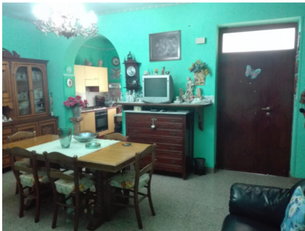
FOTO N°20 - Foto interna al fabbricato (abitazione) piano 1 - fg. 37 part. 410 sub.2 – LOTTO N°2 - bene n°6