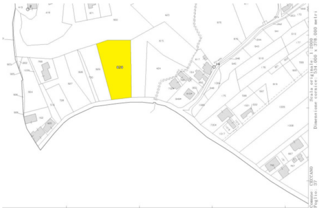
FOTO N°14 - Terreno agricolo part. 828 fg. 37 – LOTTO N°1 - bene n°4