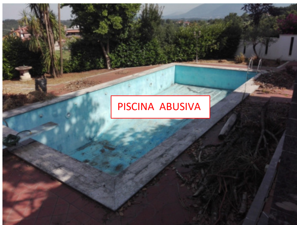
FOTO N°11 - Foto esterna – piscina posta su corte esclusiva abusiva in quanto non a distanza regolamentare da via Colle Pirolò. - LOTTO N°1 - bene n°1