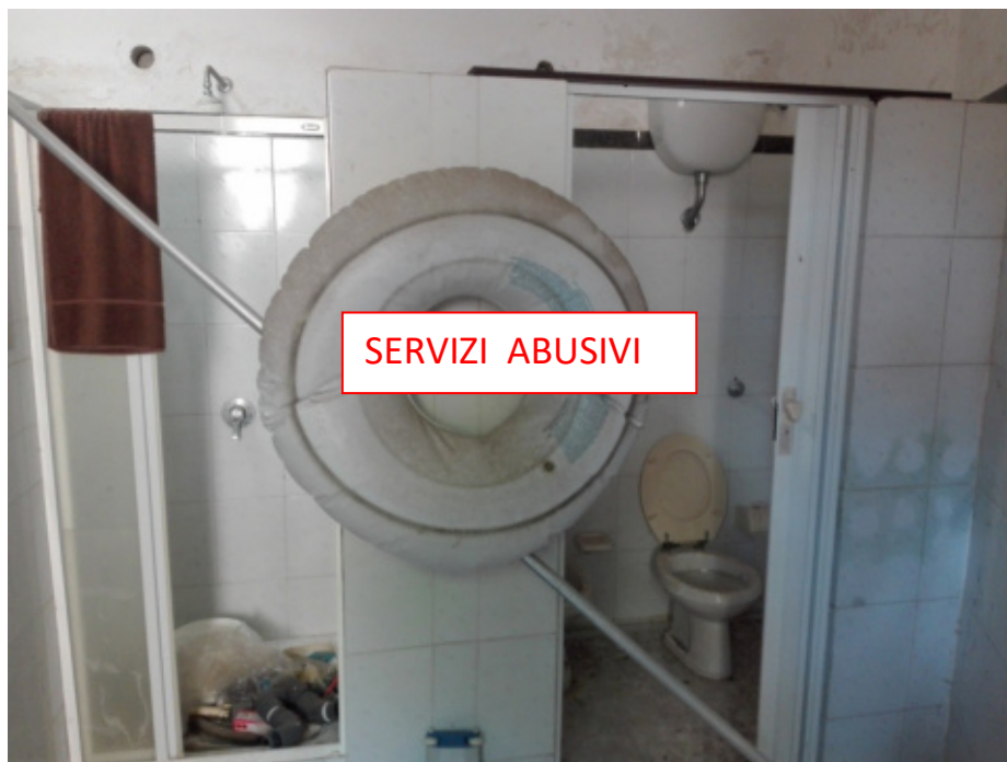
FOTO N°11 - Foto esterna – Servizi igienici e locali tecnici (ABUSIVI) posti al di sotto del gazebo (piano S1) posto su corte esclusiva abusivo. - LOTTO N°1 - bene n°1