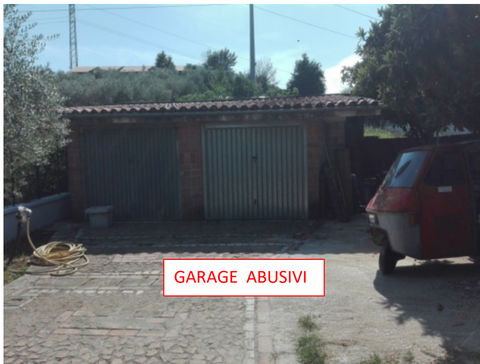
FOTO N°11 - Foto esterna – Garage posti su corte esclusiva abusivi i - LOTTO N°1 - bene n°1