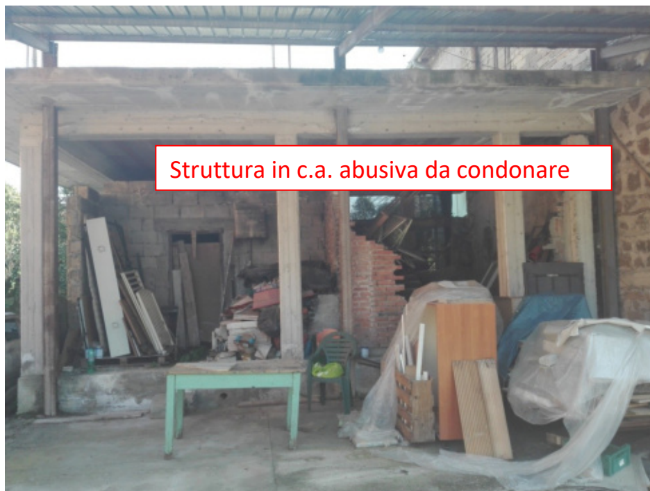
FOTO N°26 - Struttura in c.a. in corso di costruzione su corte comune (ABUSIVA) - fig. 37 part. 949 – LOTTO N°2 - bene n°7