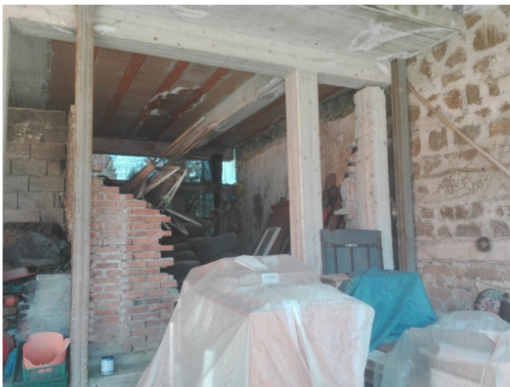
FOTO N°27 - Struttura in c.a. in corso di costruzione su corte comune (ABUSIVA) - fig. 37 part. 949 – LOTTO N°2 - bene n°7