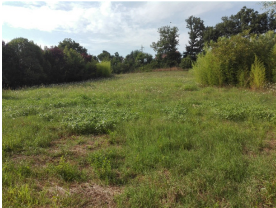
FOTO N°13 - Terreno agricolo part. 828 fg. 37 – LOTTO N°1 - bene n°4