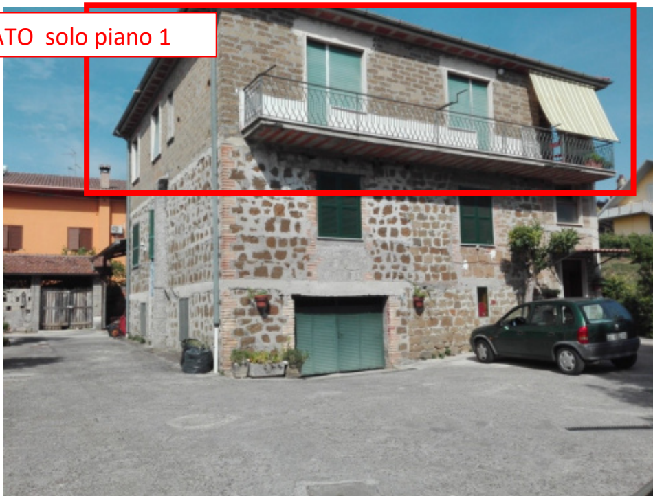
FOTO N°18 - Vista esterna al fabbricato (abitazione) fg. 37 part. 410 sub.2 – LOTTO N°2 - bene n°6