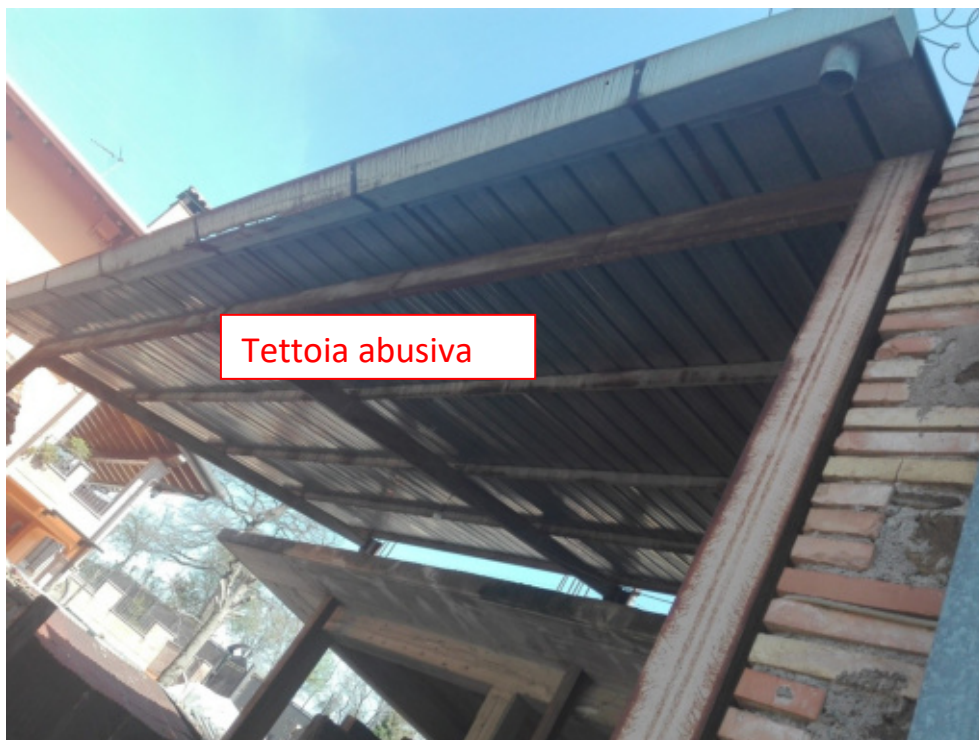
FOTO N°27 - Tettoia in acciaio e lamiera su corte comune (ABUSIVA) - fig. 37 part. 949 – LOTTO N°2 - bene n°7