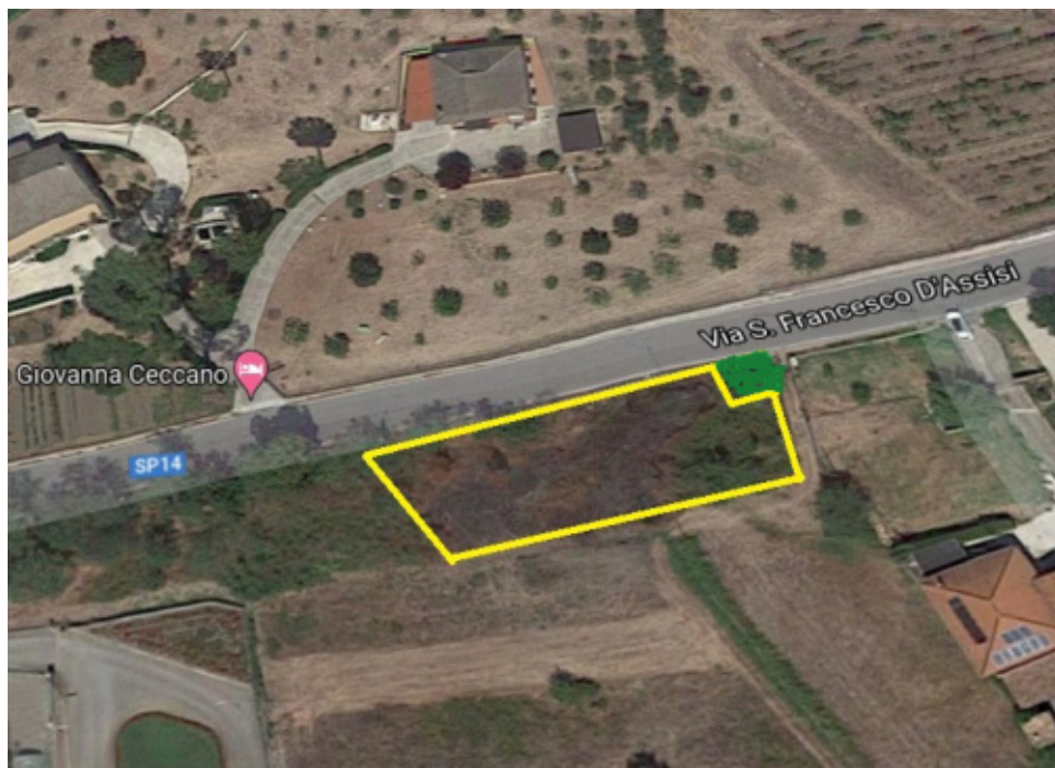
FOTO N°17 - Terreno agricolo fg. 40 part. 850 – LOTTO N°1 - bene n°5