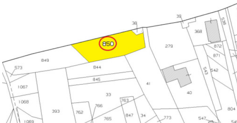
FOTO N°16 - Terreno agricolo fg. 40 part. 850 – LOTTO N°1 - bene n°5