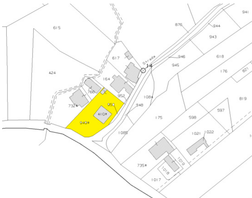
FOTO N°28 - Identificazione del lotto n°2 costituito dalla part. 949 (area urbana) e fabbricato part. 410 - fig. 37 part. 949 – LOTTO N°2