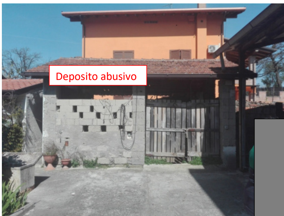
FOTO N°25 - Locale deposito su corte comune (ABUSIVO) - fg. 37 part. 949 – LOTTO N°2 - bene n°7