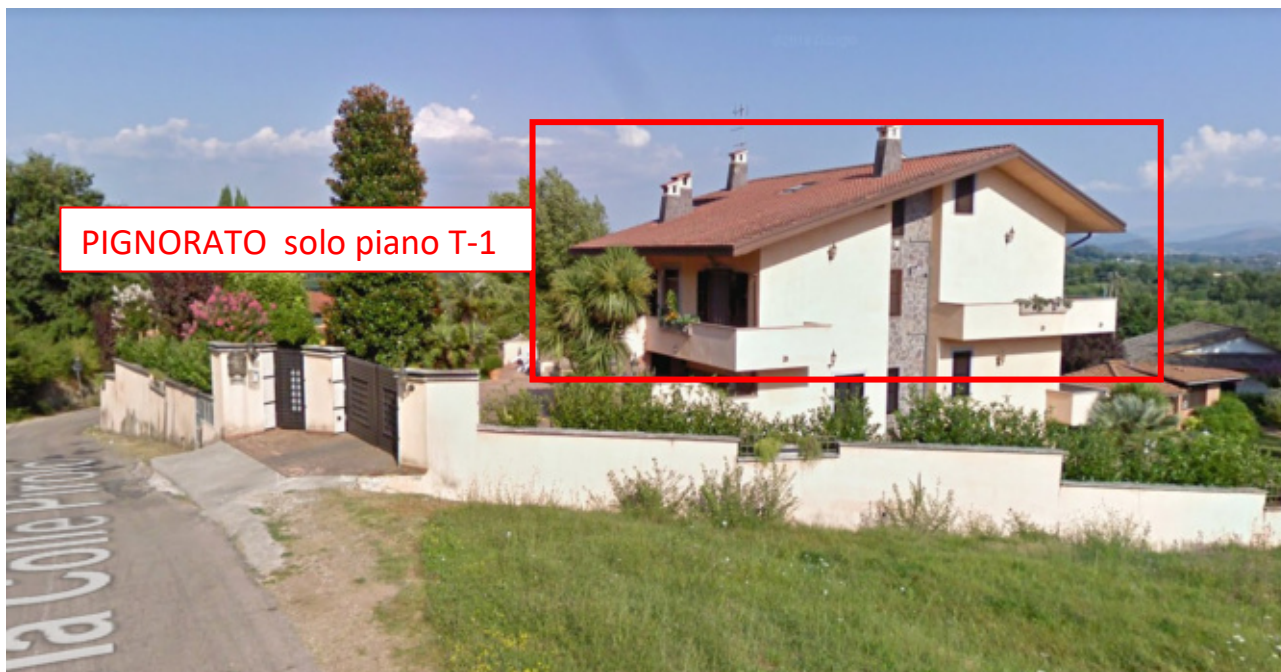
FOTO N°1 – Vista esterna del fabbricato, via Colle Pirolo, 6. – LOTTO N°1 – bene n°1 – part. 746 sub.5 - fg. 37