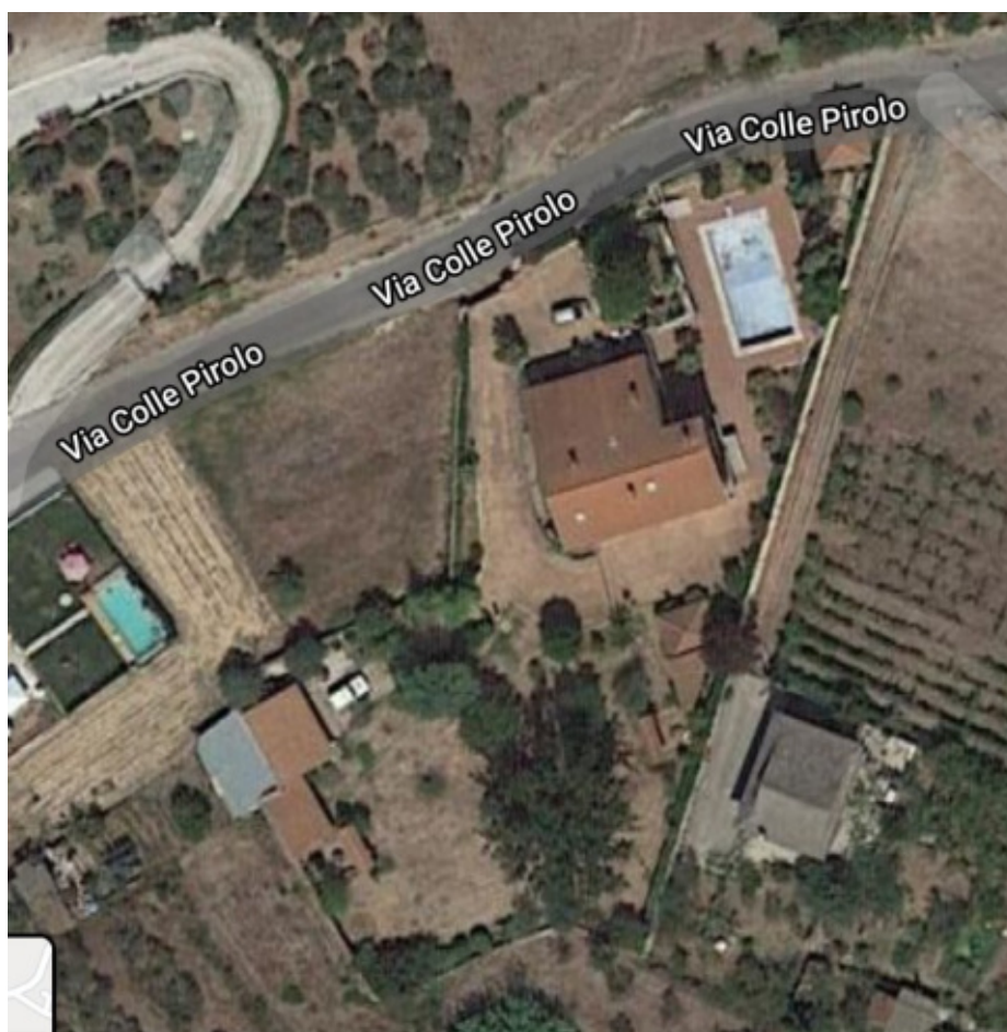
FOTO N°2 – Vista dall'alto del fabbricato , via Colle Pirolo, 6. - LOTTO N°1 - bene n°1