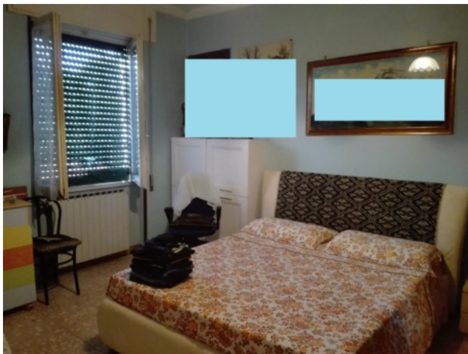
FOTO N°22 - Foto interna al fabbricato (abitazione) piano 1 - fg. 37 part. 410 sub.2 – LOTTO N°2 - bene n°6