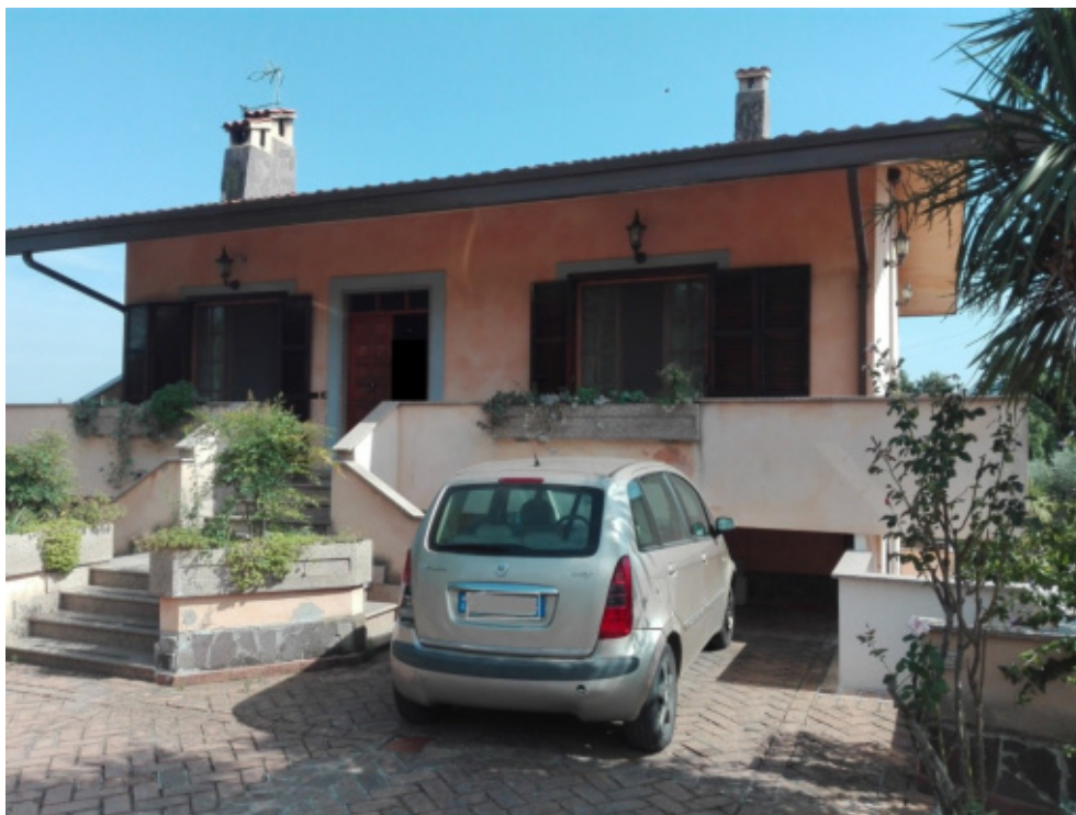
FOTO N°3 – Vista esterna del fabbricato piano terra e 1, via Colle Pirolo, 6. LOTTO N°1 - bene n°1