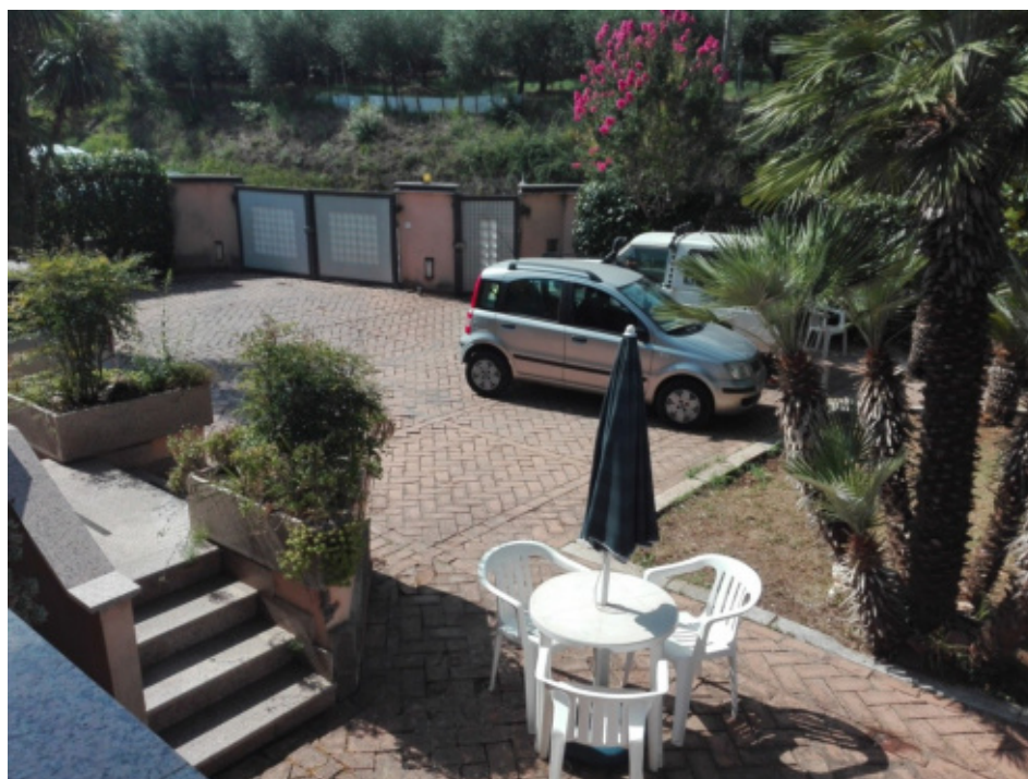
FOTO N°4 – Porzione della corte esclusiva al fabbricato pignorato. LOTTO N°1 - bene n°1