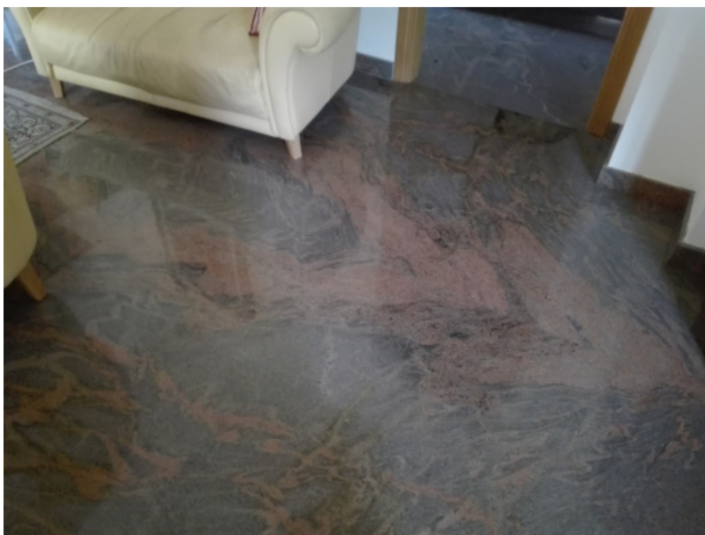
FOTO N°8 - Foto interna abitazione – particolare pavimentazione zona giorno realizzata in granito indiano. - LOTTO N°1 - bene n°1