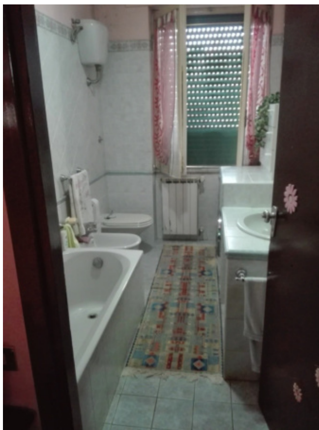
FOTO N°23 - Foto interna al fabbricato (abitazione) piano 1 - fg. 37 part. 410 sub.2 – LOTTO N°2 - bene n°6