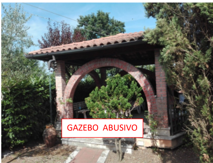
FOTO N°10 - Foto esterna – gazebo posto su corte esclusiva abusivo. - LOTTO N°1 - bene n°1