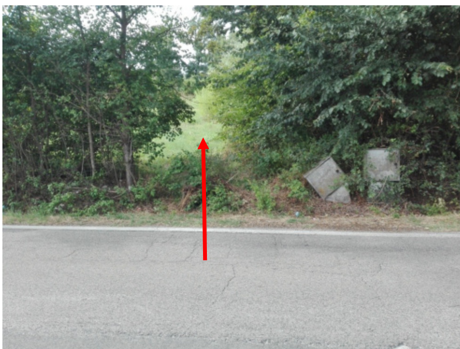
FOTO N°12 - Accesso al terreno part. 828 fg. 37 – LOTTO N°1 - bene n°4