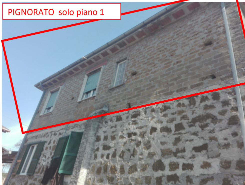
FOTO N°19 - Vista esterna al fabbricato (abitazione) fg. 37 part. 410 sub.2 – LOTTO N°2 - bene n°6