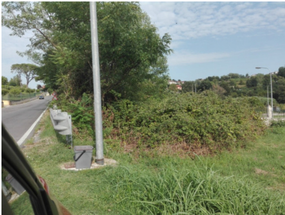
FOTO N°15 - Terreno agricolo fg. 40 part. 850 – LOTTO N°1 - bene n°5