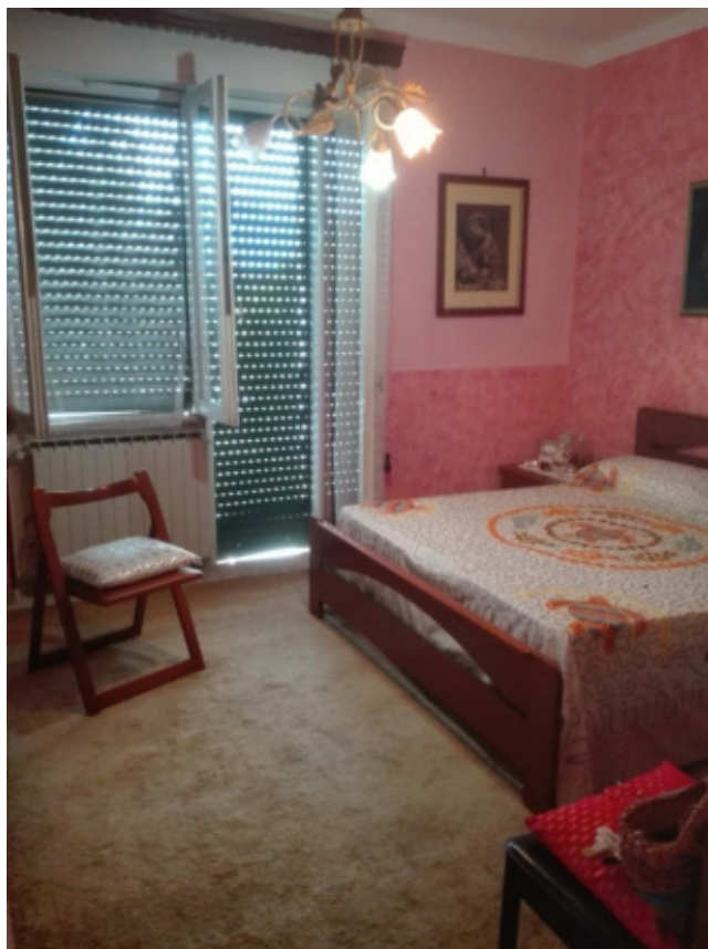
FOTO N°24 - Foto interna al fabbricato (abitazione) piano 1 - fg. 37 part. 410 sub.2 – LOTTO N°2 - bene n°6