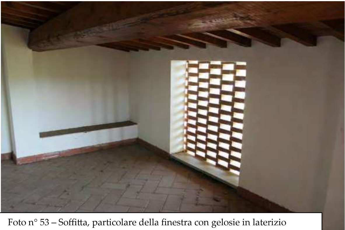
Foto n° 53 – Soffitta, particolare della finestra con gelosie in laterizio