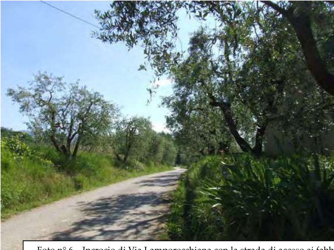
Foto n° 6 – Incrocio di Via Lamporecchiana con la strada di acceso ai fabbricati