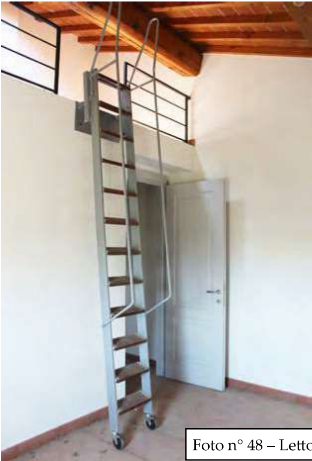
Foto n° 48 – Letto 1 con scaletta di accesso al soppalco (soffitta)