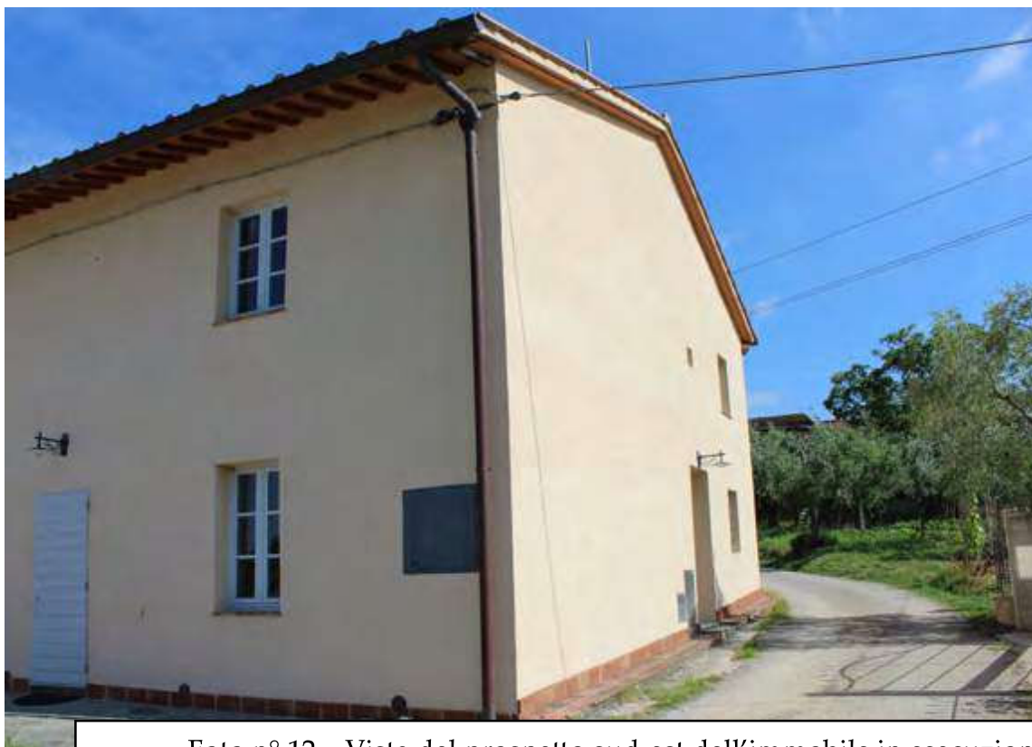
Foto n° 12 – Vista del prospetto sud-est dell'immobile in esecuzione