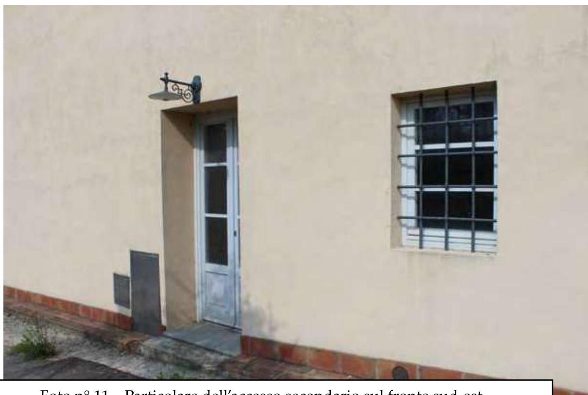
Foto n° 11 – Particolare dell'accesso secondario sul fronte sud-est