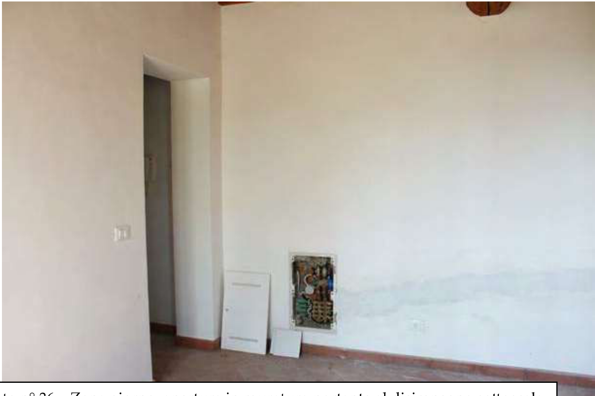
Foto n° 36 – Zona giorno, apertura in muratura portante al disimpegno sottoscala