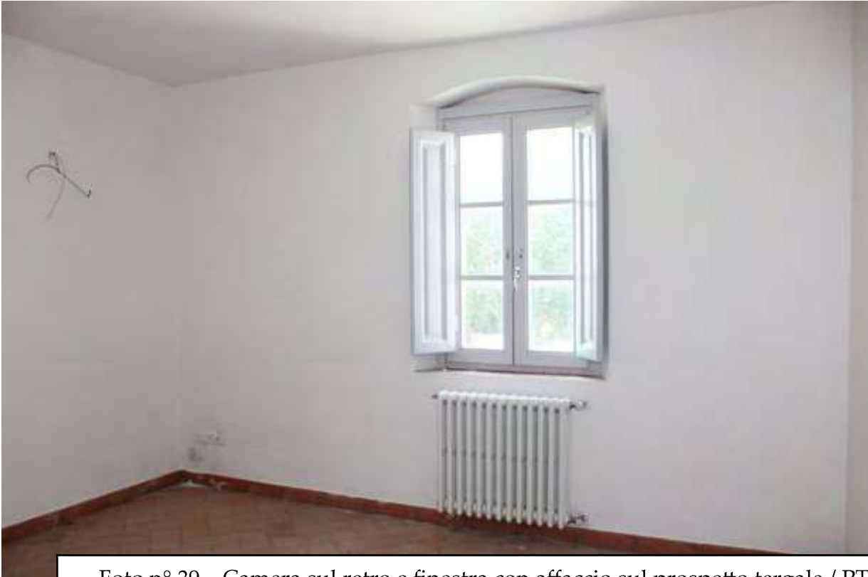
Foto n° 39 – Camera sul retro e finestra con affaccio sul prospetto tergale / PT