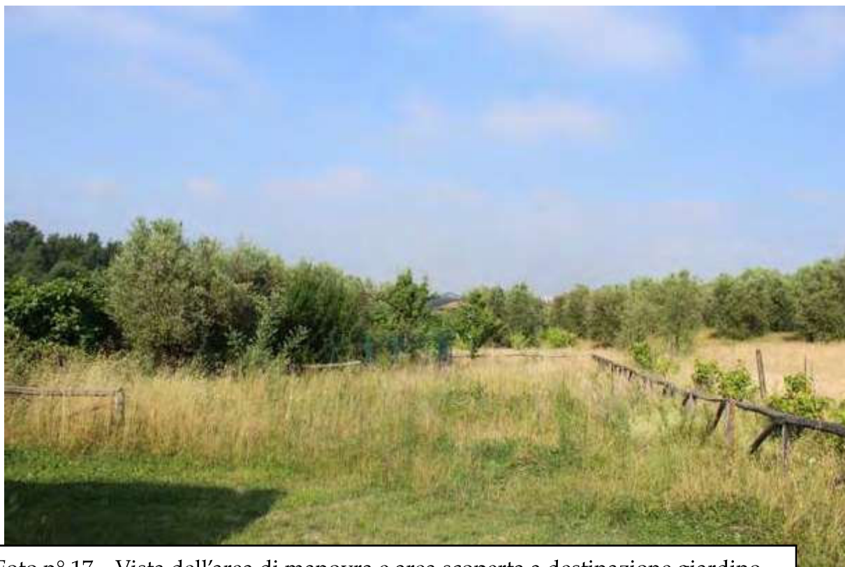
Foto n° 17 – Vista dell'area di manovra e area scoperta a destinazione giardino