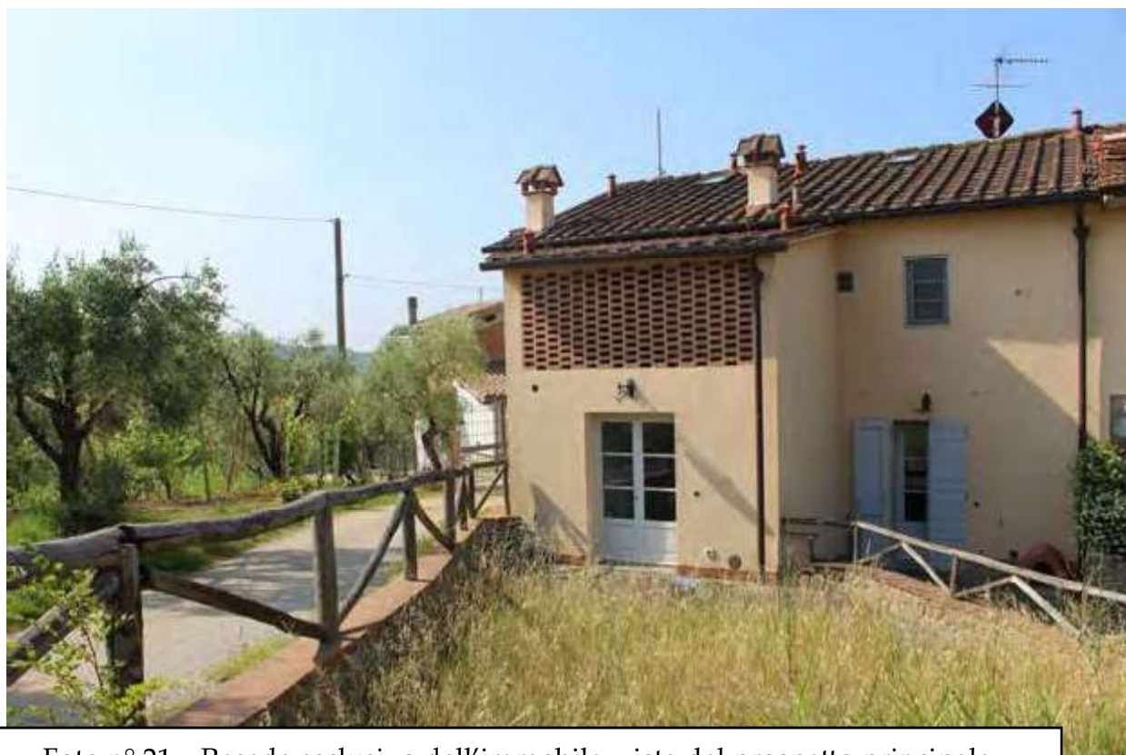
Foto n° 21 – Resede esclusivo dell'immobile, vista del prospetto principale