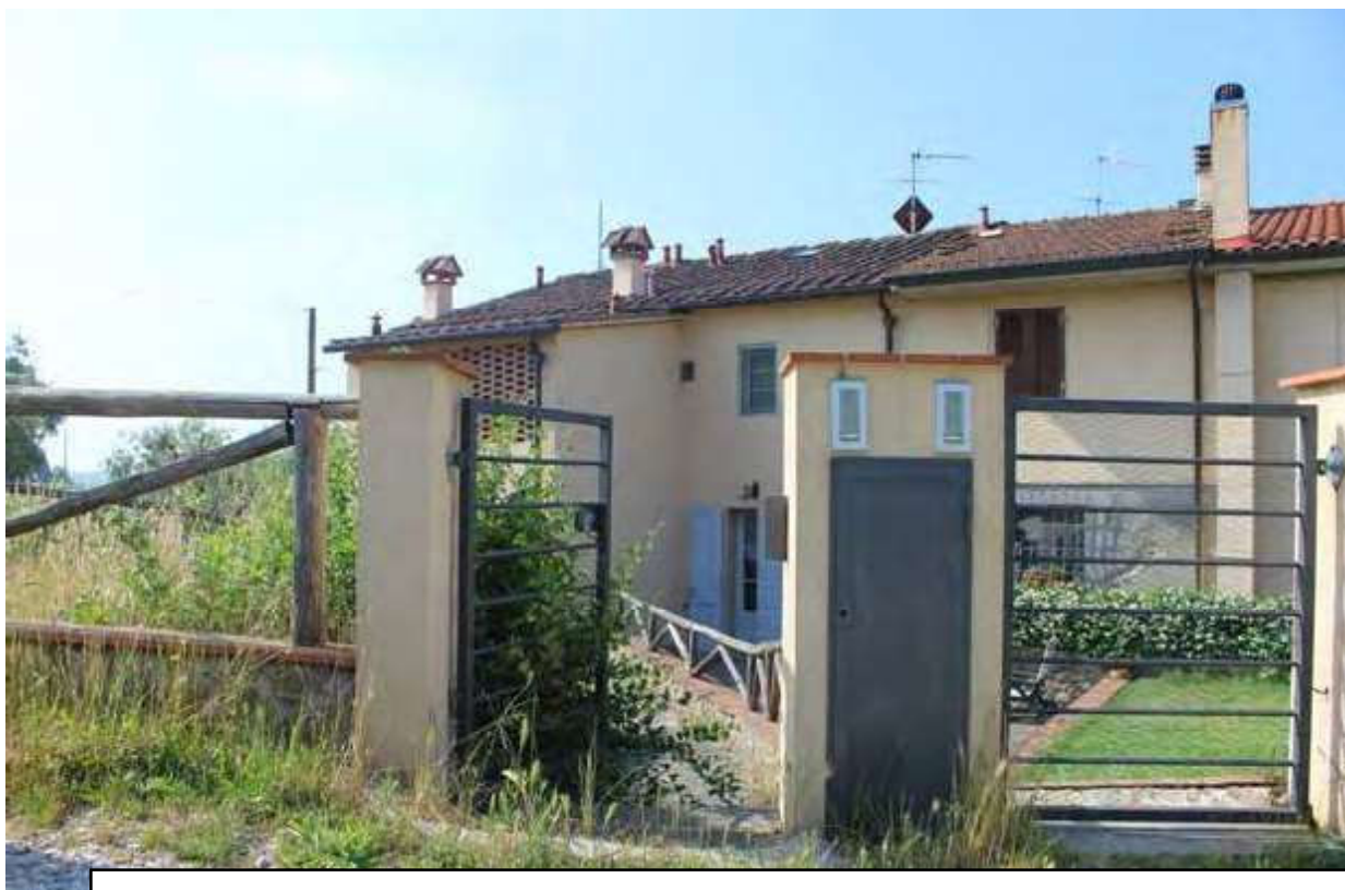
Foto n° 20 – Cancellotto di accesso alla proprietà (a sinistra nella foto)