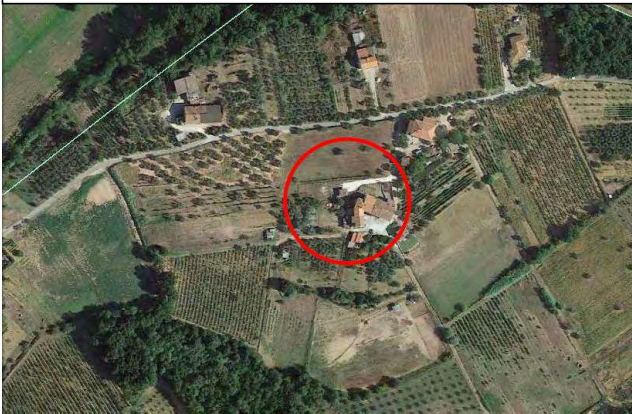
Foto n° 3 – Vista aerea del complesso edilizio di cui fa parte il fabbricato in esecuzione