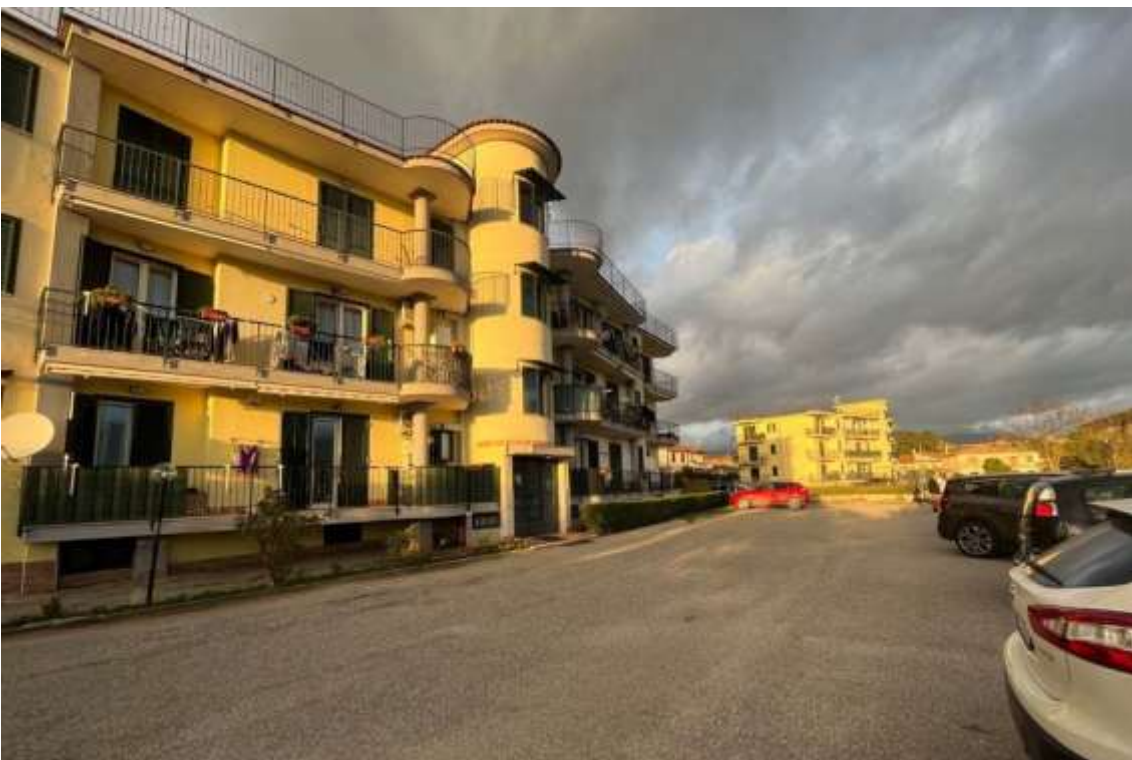
Fig.4 – Vista dell’edificio che ospita il bene al Fig.15 p.la 898 sub.27