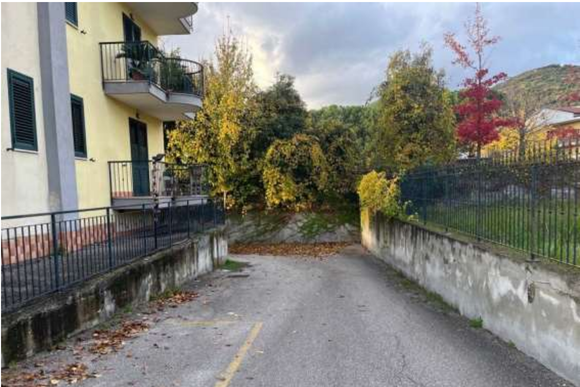
Fig.2 – Vista dell'accesso alla zona box