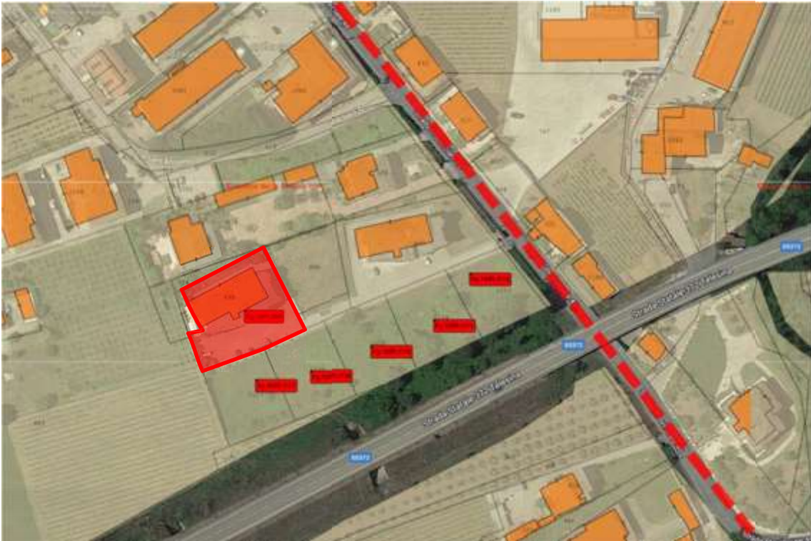
Fig.1 – Vista dell'edificio su ortofoto con individuazione dell'asse viario della SP46