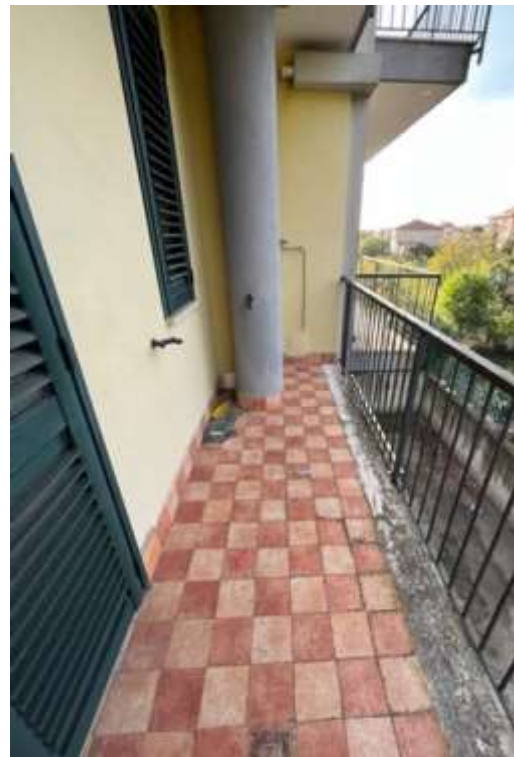
Figg.13-14 Bagno e balconi dell’abitazione civile A/2 al Fg.15 p.la 898 sub.27