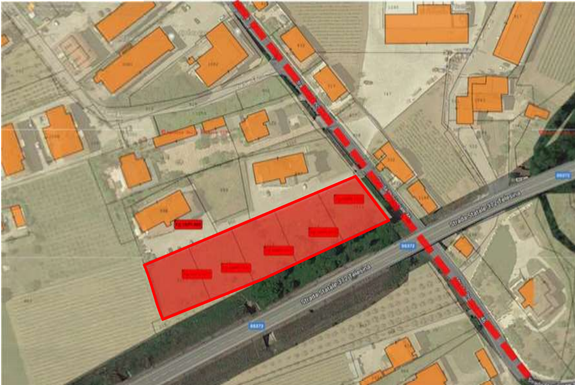
Fig.1 – Vista dei terreni su ortofoto con individuazione dell'asse viario della SP46