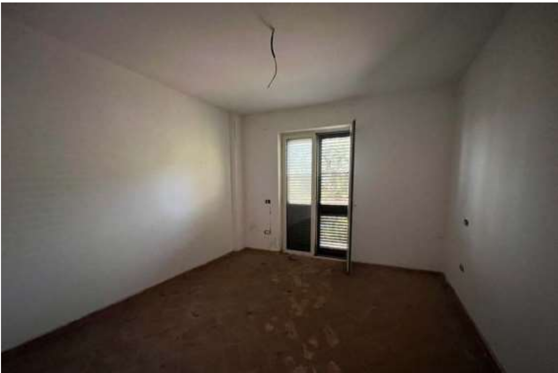
Fig.10 – Camera dell'abitazione civile A/2 al Fg.15 p.lla 898 sub.27