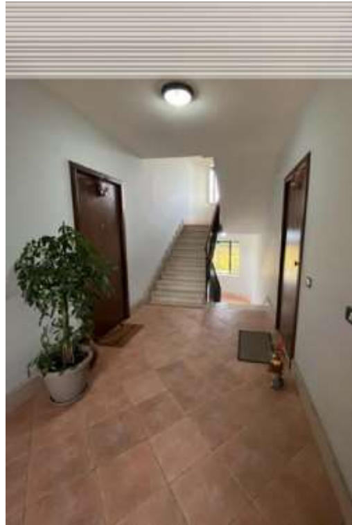
Figg.5-6 – Portone e pianerottolo di arrivo dell’immobile al Fg.15 p.Ila 898 sub.27