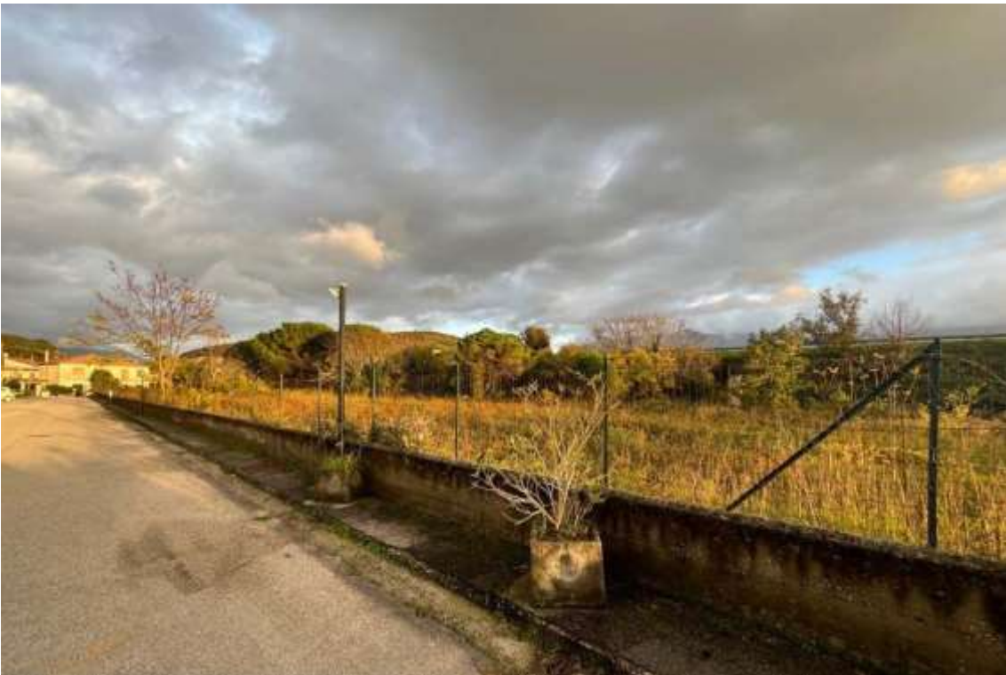
Fig.2 – Vista su p.lle 1113-1114-1115-1116-1117 del Fig.15 da nord verso est