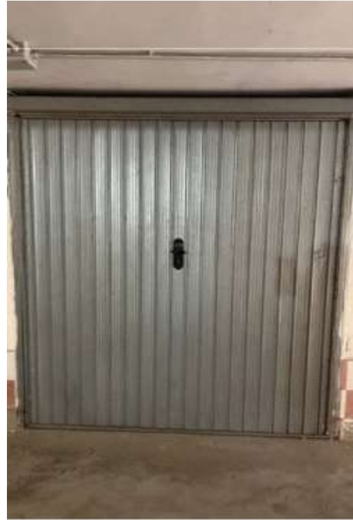
Figg.5-6 – Vista dell’accesso alla zona box interni ed ingresso al sub.29