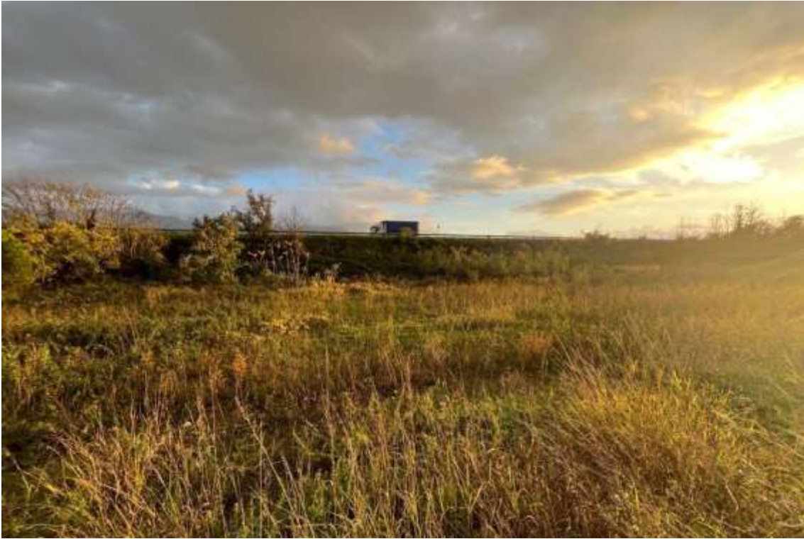
Fig.7 – Vista su p.lle 1113-1114-1115-1116-1117 del Fg.15 da nord verso ovest