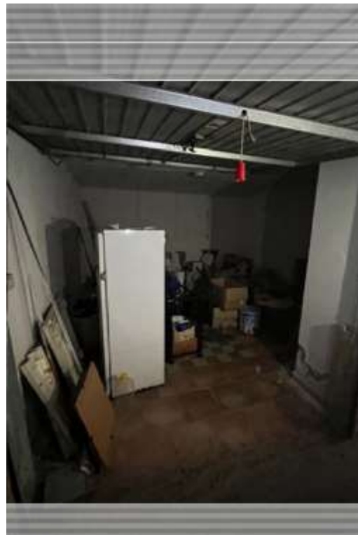
Figg.7-8 – Vista dell’accesso al box sub.29 della p.lla 898 e del suo interno