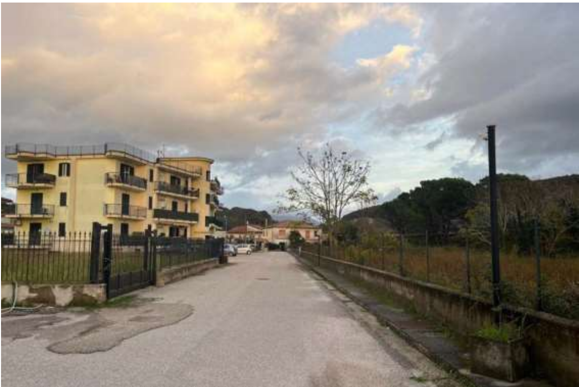
Fig.2 – Vista del l'accesso al Fabbricato da via Bagni/SP46