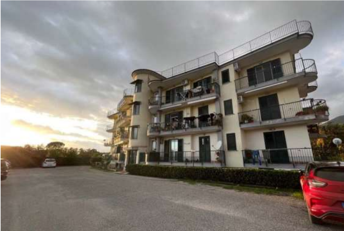
Fig.3 – Vista dell’edificio che ospita il bene al Fig.15 p.la 898 sub.27