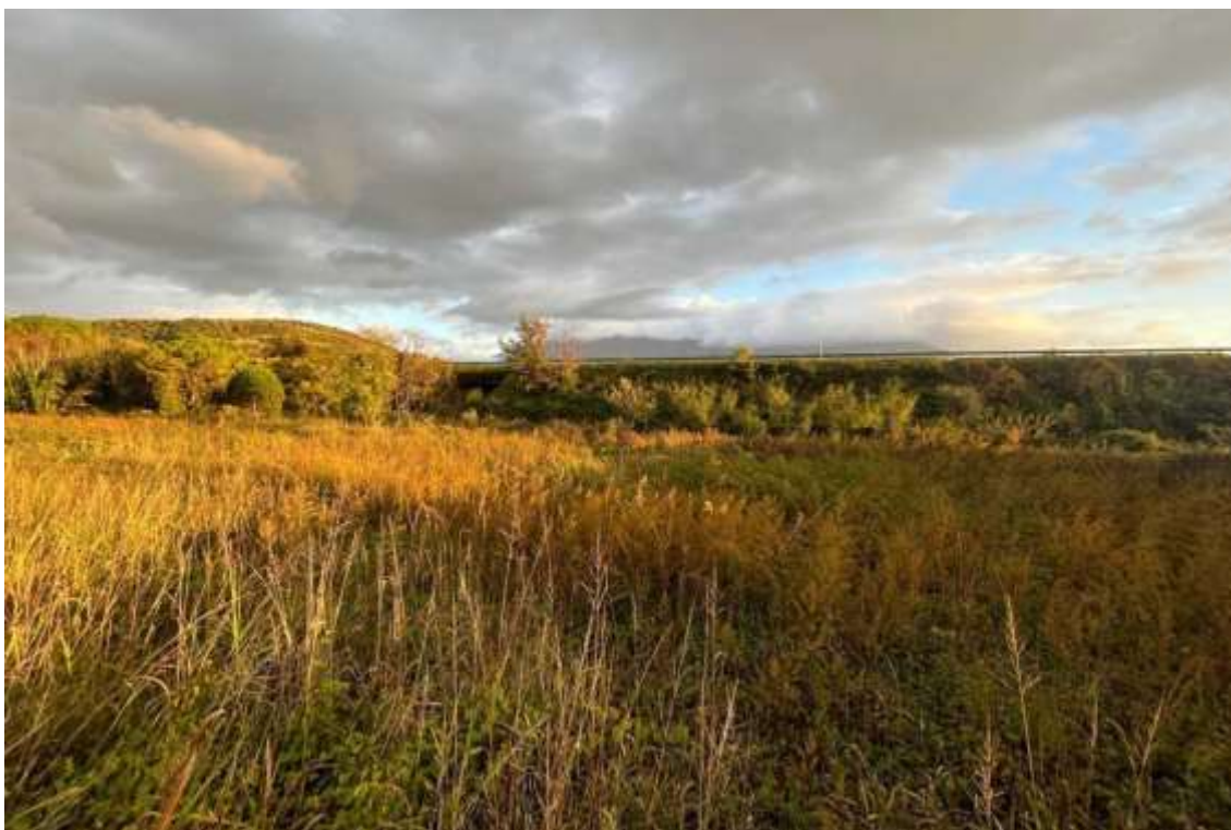
Fig.4 – Vista su p.lle 1113-1114-1115-1116-1117 del Fig.15 da nord verso est