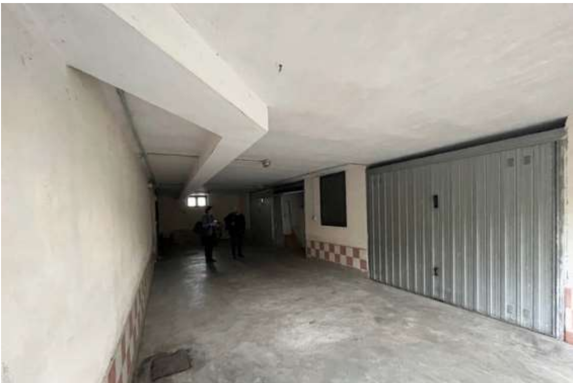
Fig.4 – Vista dell'accesso alla zona box interni