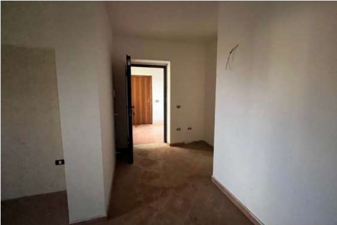
Fig.9 – Ingresso dell'abitazione civile A/2 al Fg.15 p.lla 898 sub.27