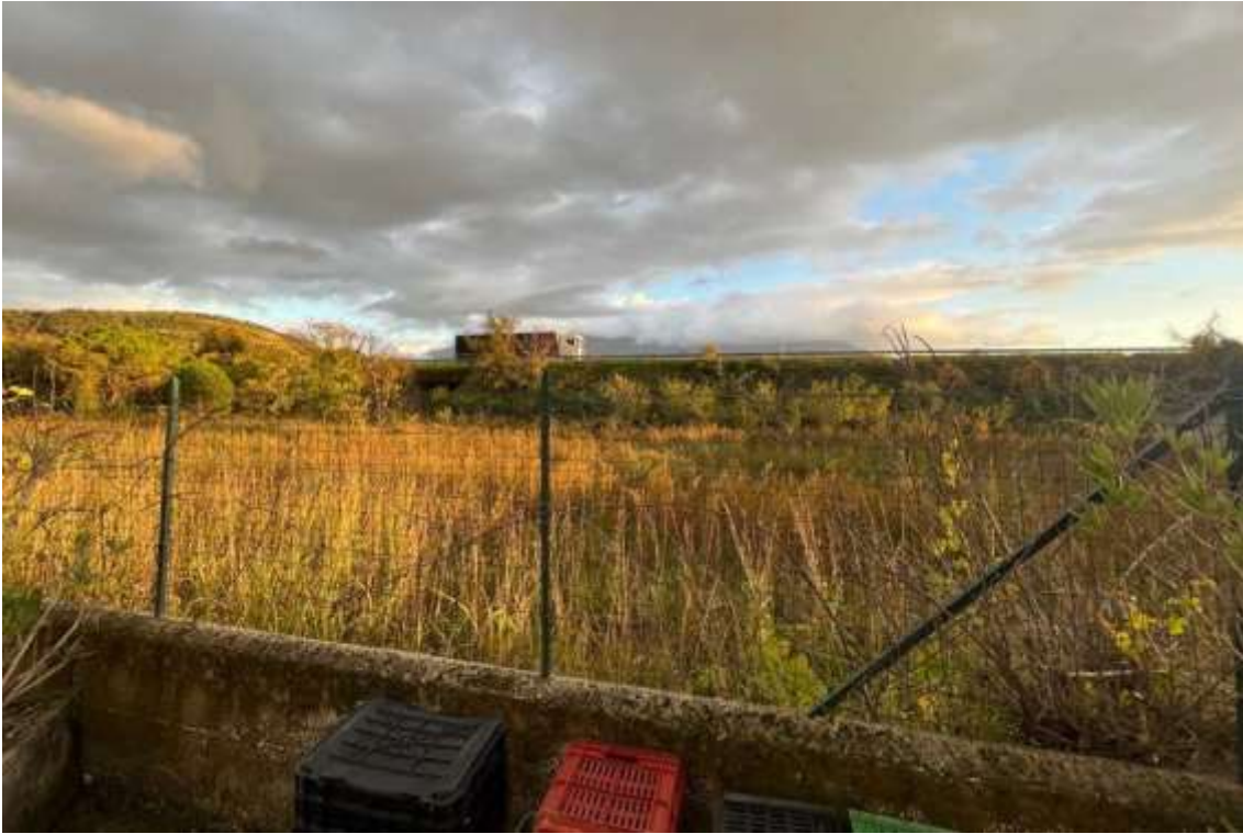
Fig.5 – Vista su p.lle 1113-1114-1115-1116-1117 del Fig.15 da nord verso est