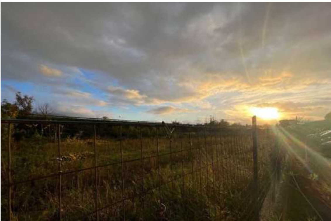
Fig.8 – Vista su p.lle 1113-1114-1115-1116-1117 del Fg.15 da nord verso ovest