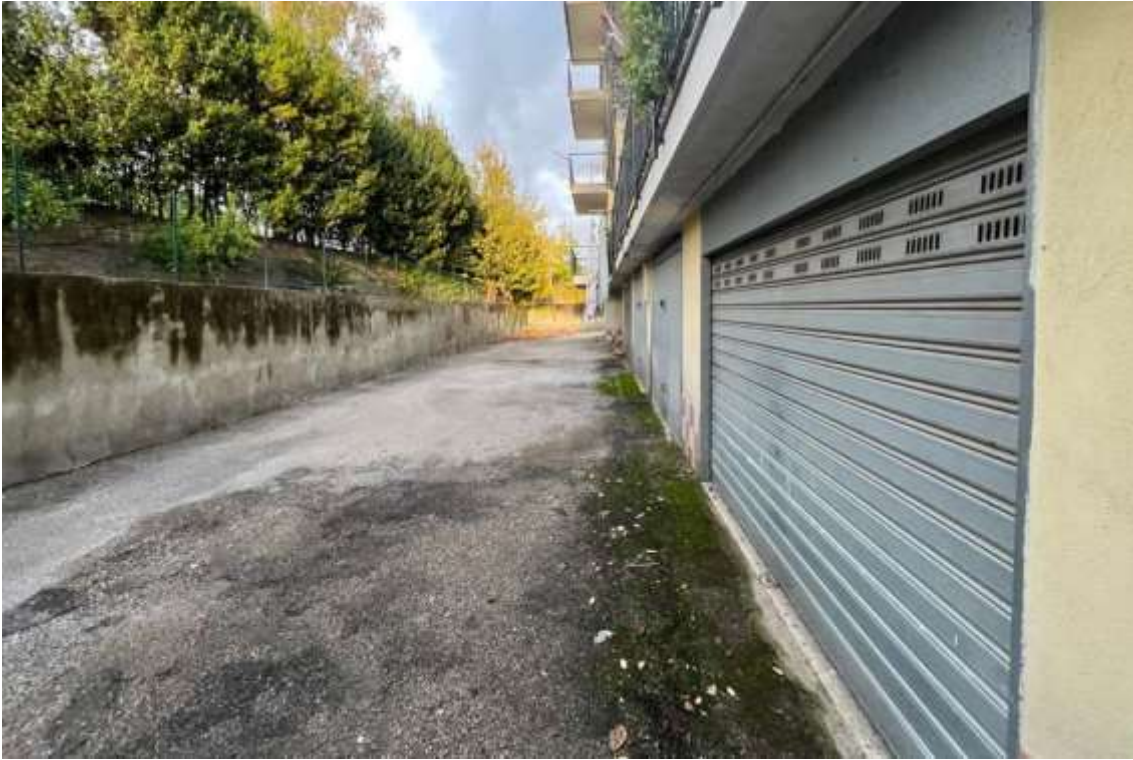
Fig.3 – Vista dell'accesso alla zona box esterni