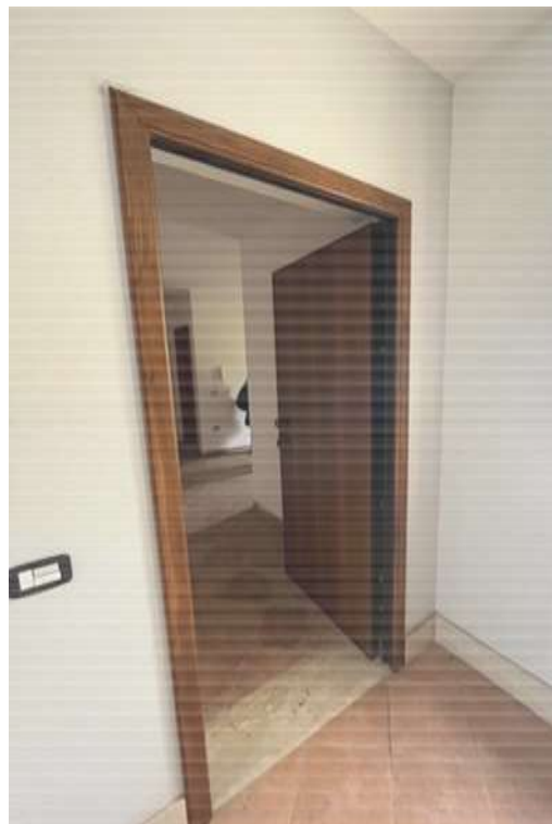
Figg.7-8 – Porta d’ingresso all’abitazione civile A/2 al Fg.15 p.Ila 898 sub.27