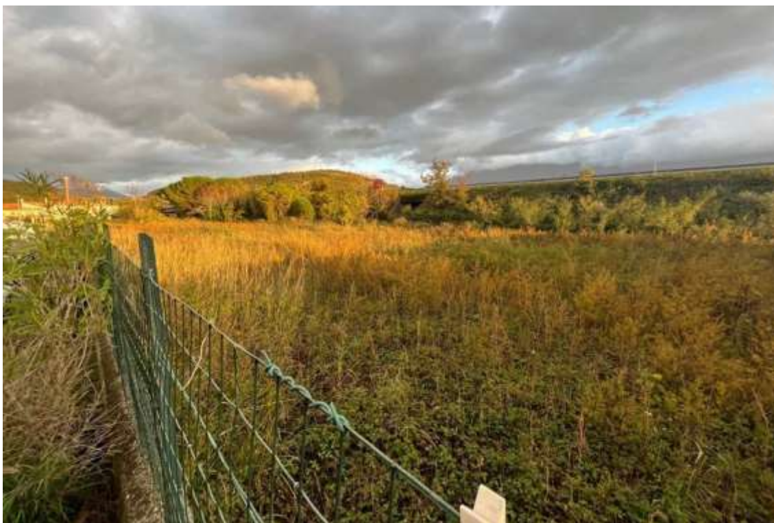
Fig.3 – Vista su p.lle 1113-1114-1115-1116-1117 del Fig.15 da nord verso est