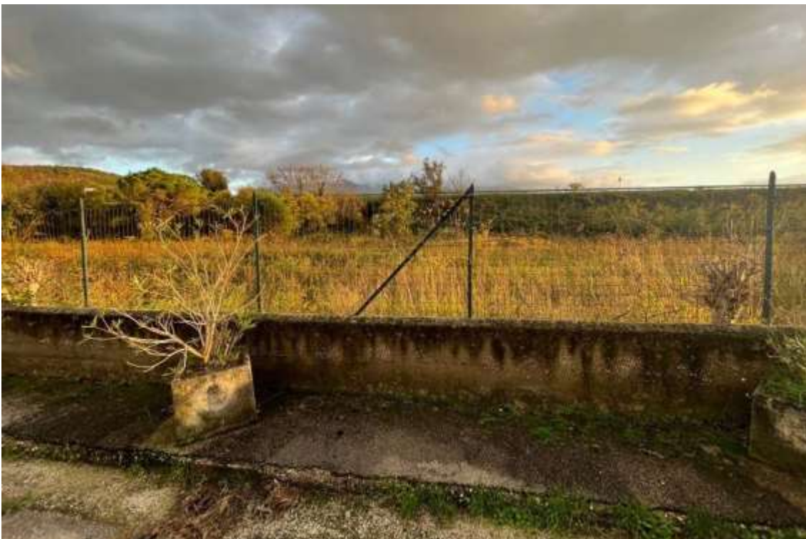
Fig.6 – Vista su p.lle 1113-1114-1115-1116-1117 del Fig.15 da nord verso sud