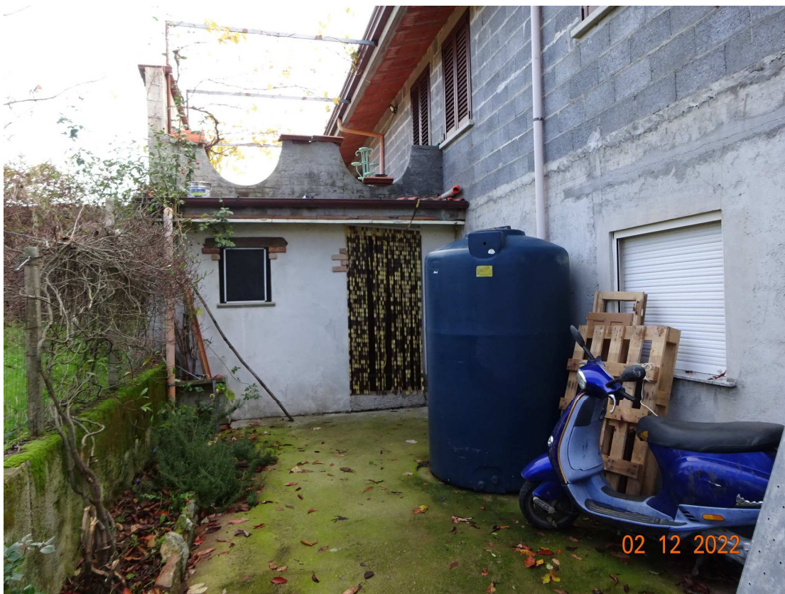
foto 24 – Deposito seminterrato sottostante alla veranda sul lato nord