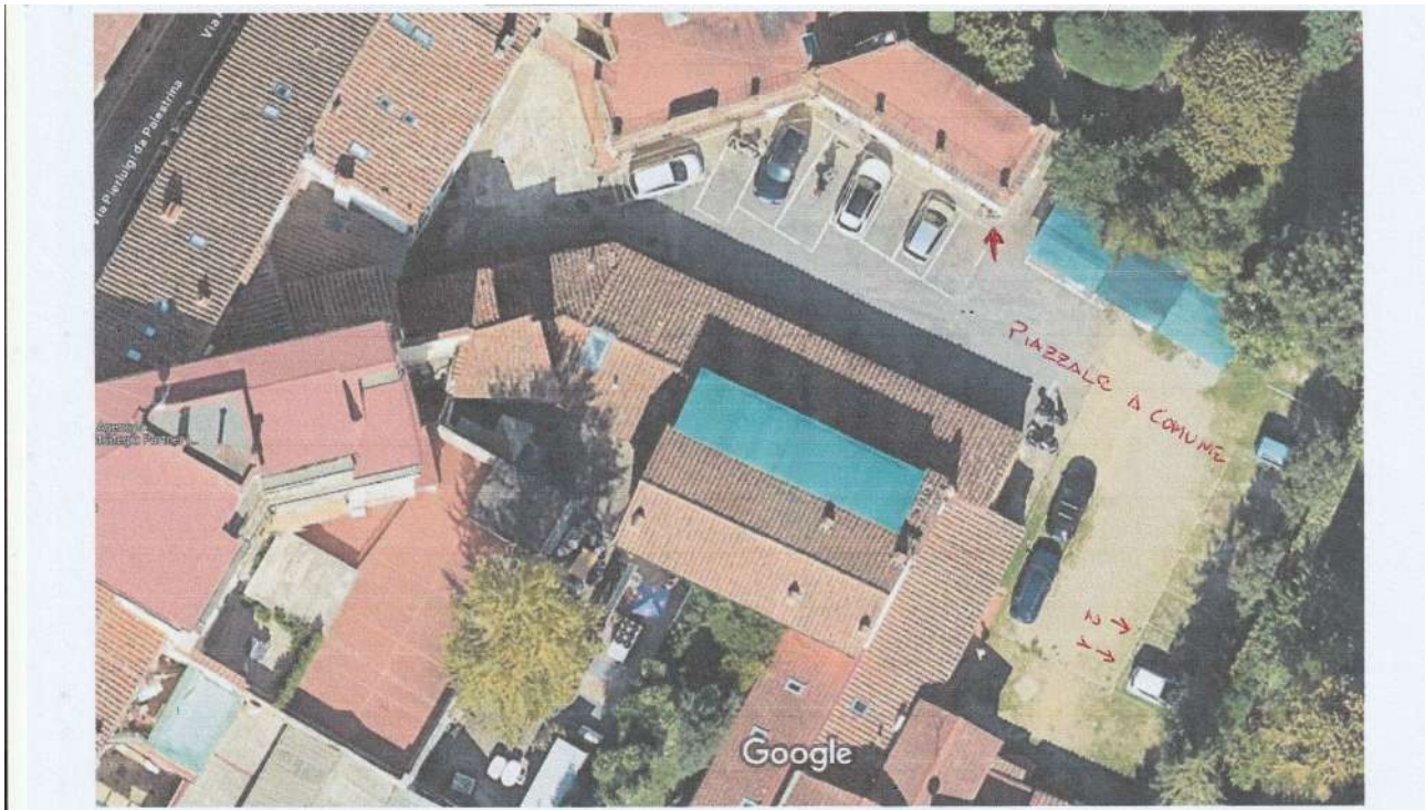
Foto aerea per inquadramento immobile , 2 posti auto ( solo uso) e piazzale o cortile condominiale