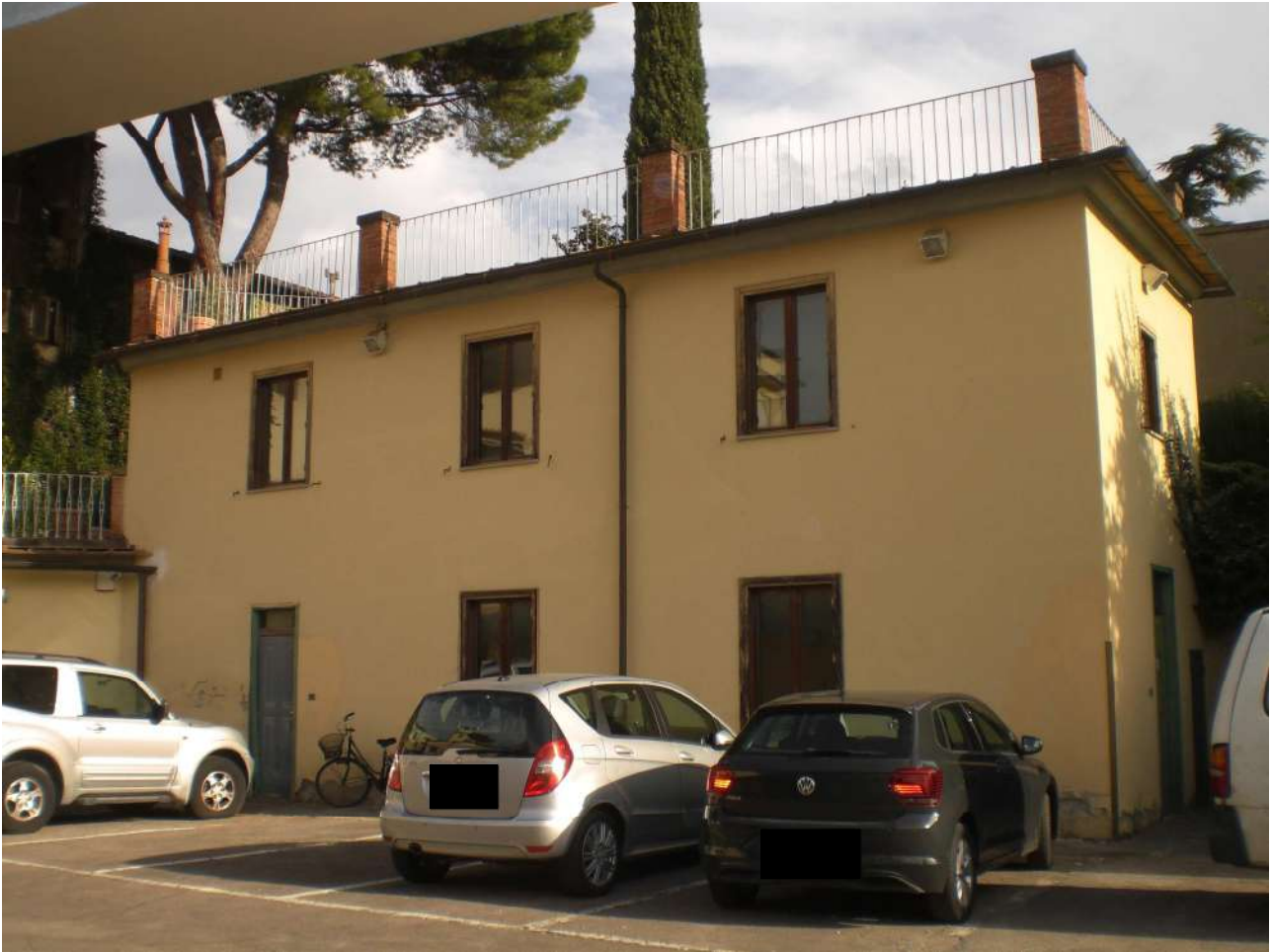
Foto 8 : facciata principale . Foto 9 : visione aerea delle facciate sul confine non finestrate tergali e particolare lastrico solare a terrazza di altra proprieta' confinante che vi accede tramite scaletta .