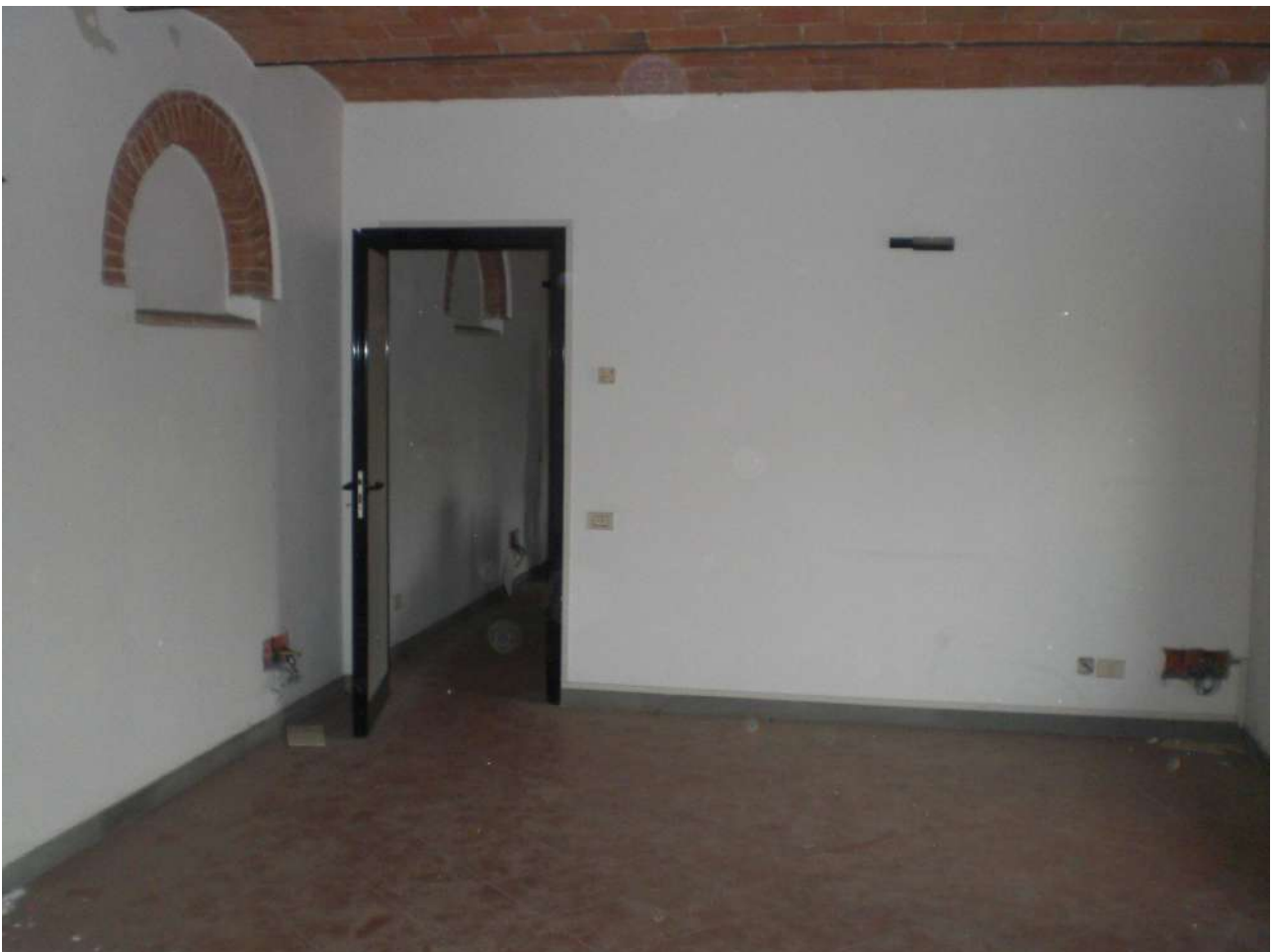
Foto 23 : particolare servizio igienico piano 1° - Foto 24 : particolare secondo vano al 1° piano