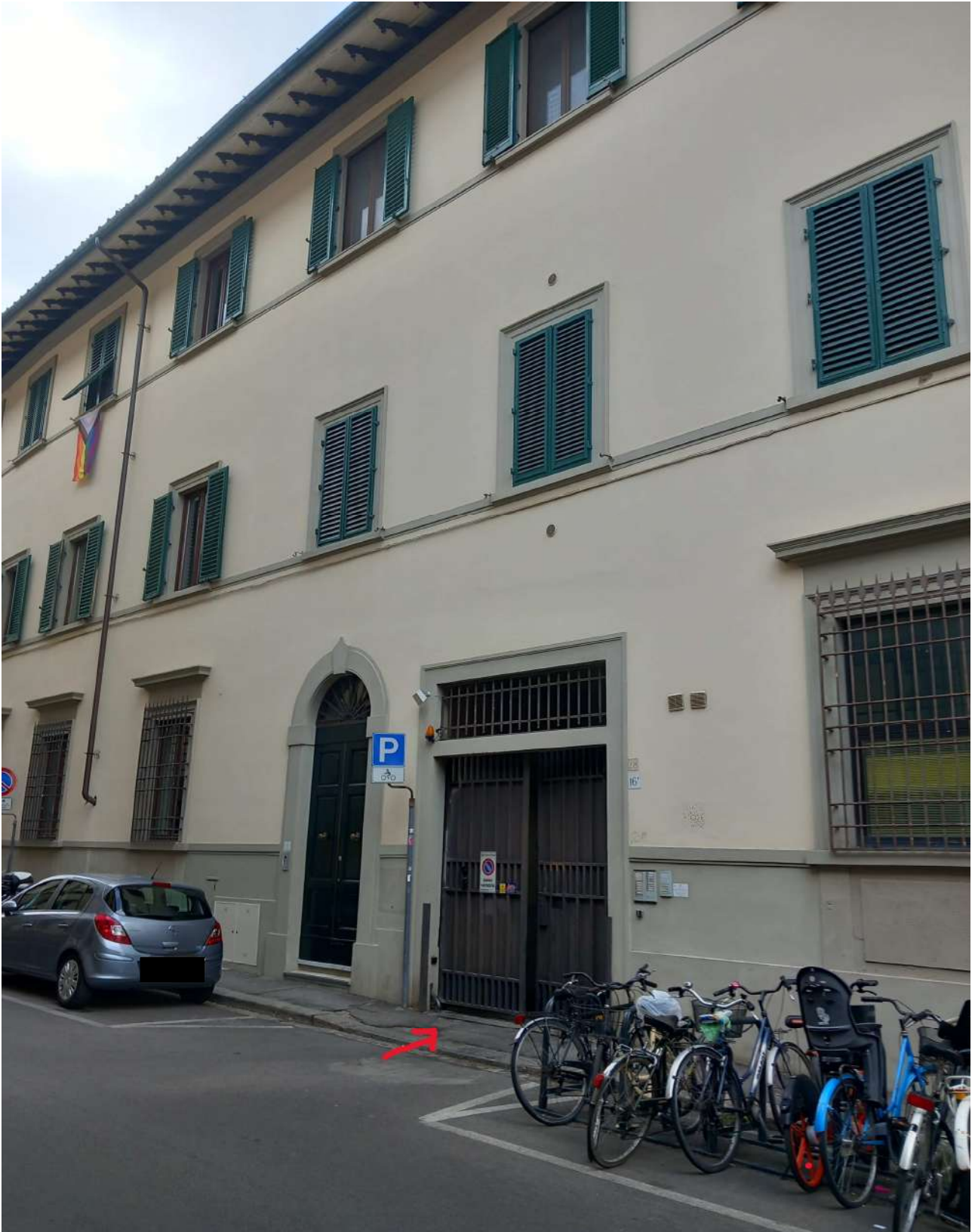
Foto 1 : ingresso condominiale carrabile e pedonale da via P.L. Da Palestrina 18