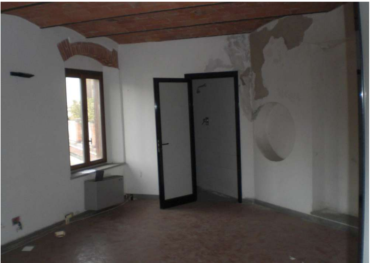
Foto 21 : primo locale d'ingresso ad uso laboratorio al 1° piano.