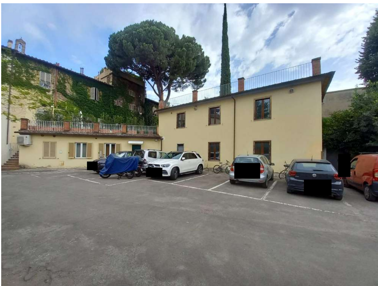
Foto 5 prospetto generale edificio( corpo a destra) e particolare piazzale a comune