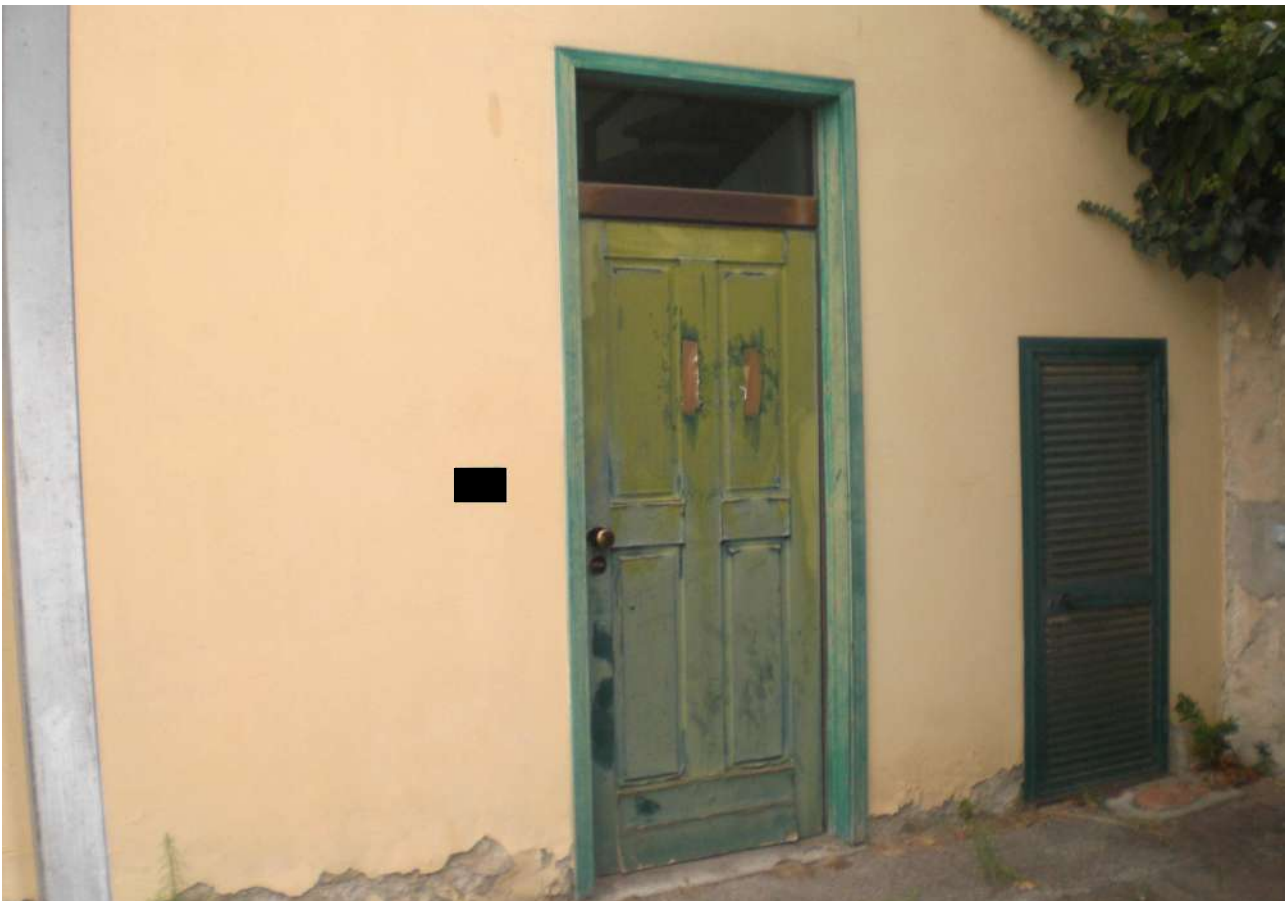
Foto 15 : particolare secondo locale al piano terra - Foto 16 : parta laterale d'ingresso al laboratorio e porticina d'ingresso alla centrale termica.