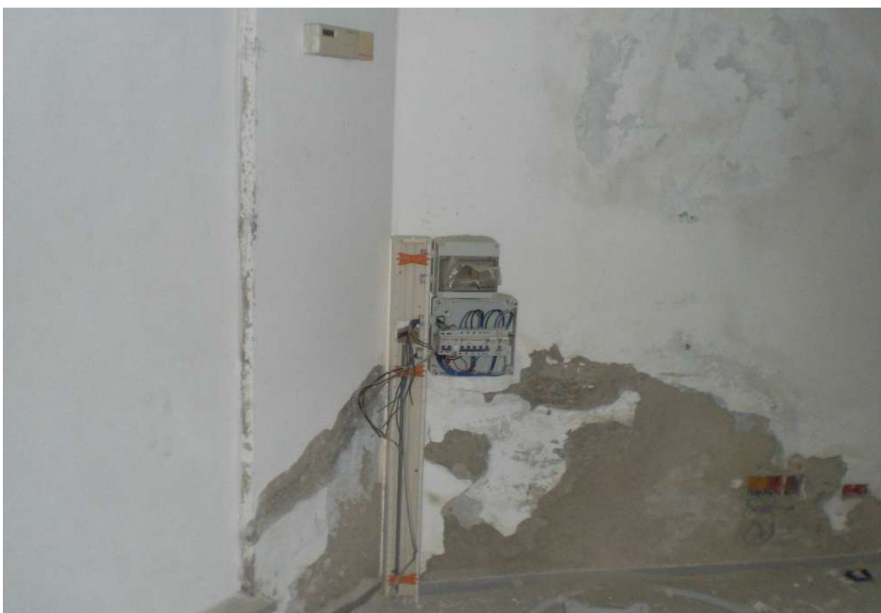
Foto 25 e 26 : particolari impianto elettrico e stato di umidità di risalita piano terra .