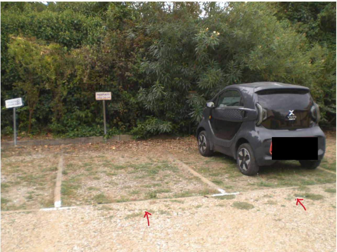
Foto 7 : i 2 posti auto destinati ad uso dalla proprieta' del bene( posti : n. 1 e n. 2 ).