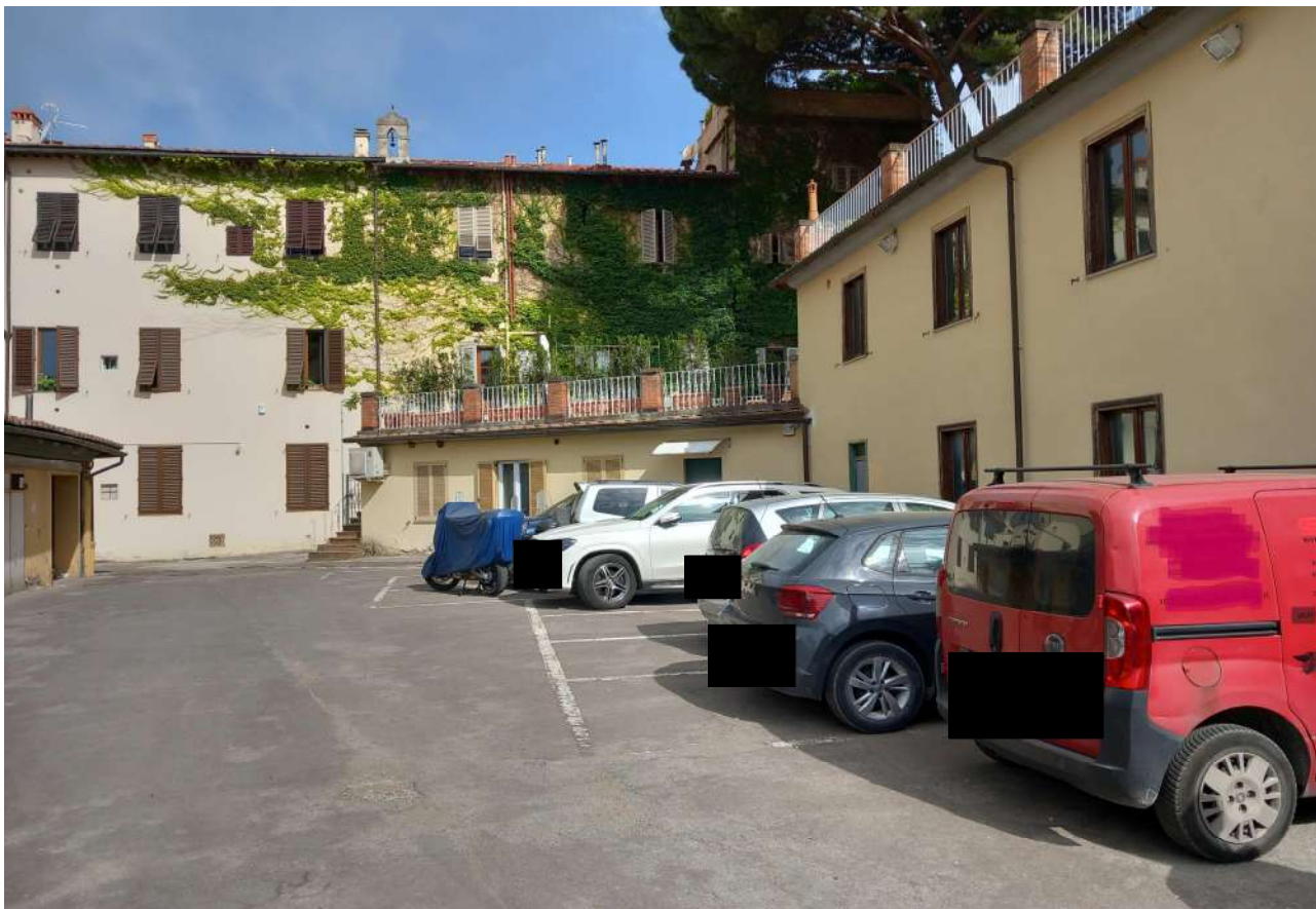
Foto 4 : visione particolare piazzale a comune e edificio in oggetto alla destra