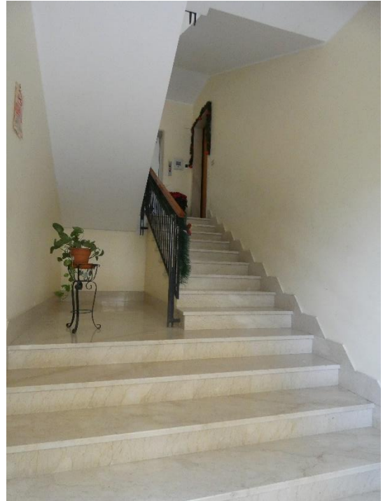
FOTO 7, 8 9 e 10: PROSPETTO LATO VIALE, SCALA CONDOMINIALE E PORTA DI INGRESSO DELL'APPARTAMENTO