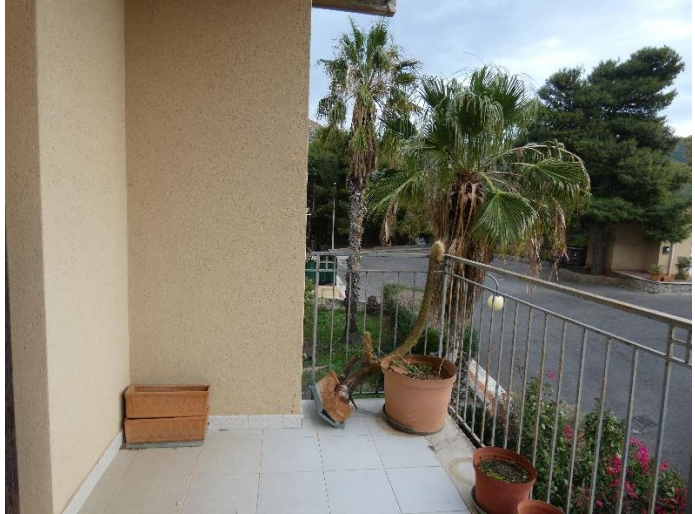
FOTO 22 23 24 e 25: BALCONE DEL VANO CUCINA E BALCONE VANO LATO NORD-EST