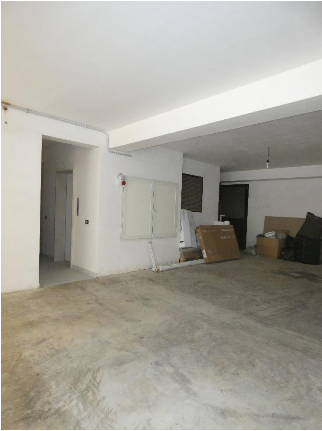
FOTO 32 e 33: LOCALE A PIANO TERRA ADIBITO A POSTI AUTO E INGRESSO