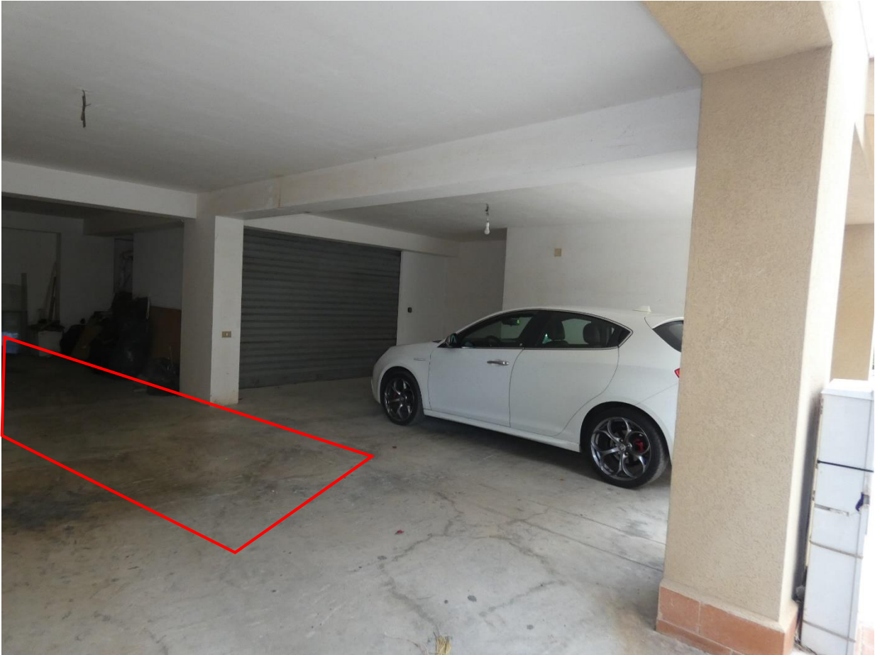
30 e 31: POSTO AUTO (LINEA ROSSA CHE DELIMITA LO SPAZIO CORRISPONDENTE IN MANIERA MERAMENTE INDICATIVA E NON IN SCALA)