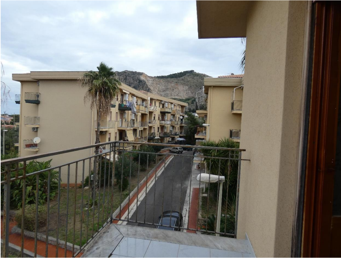
FOTO 26 e 27: BALCONE LATO SUD-OVEST E VISTA LATO NORD-EST DAL BALCONE LATO CUCINA