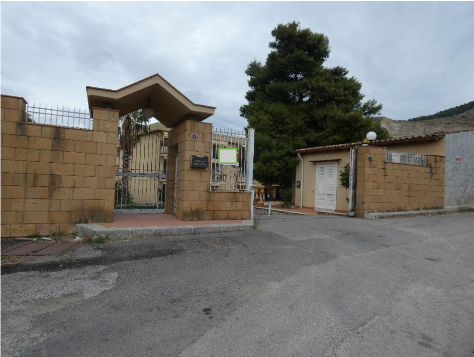
FOTO 1 e 2: CANCELLO D'INGRESSO AL COMPLESSO RESIDENZIALE, VIALE D'INGRESSO