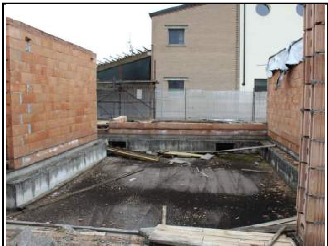
Foto 12 Vista interna