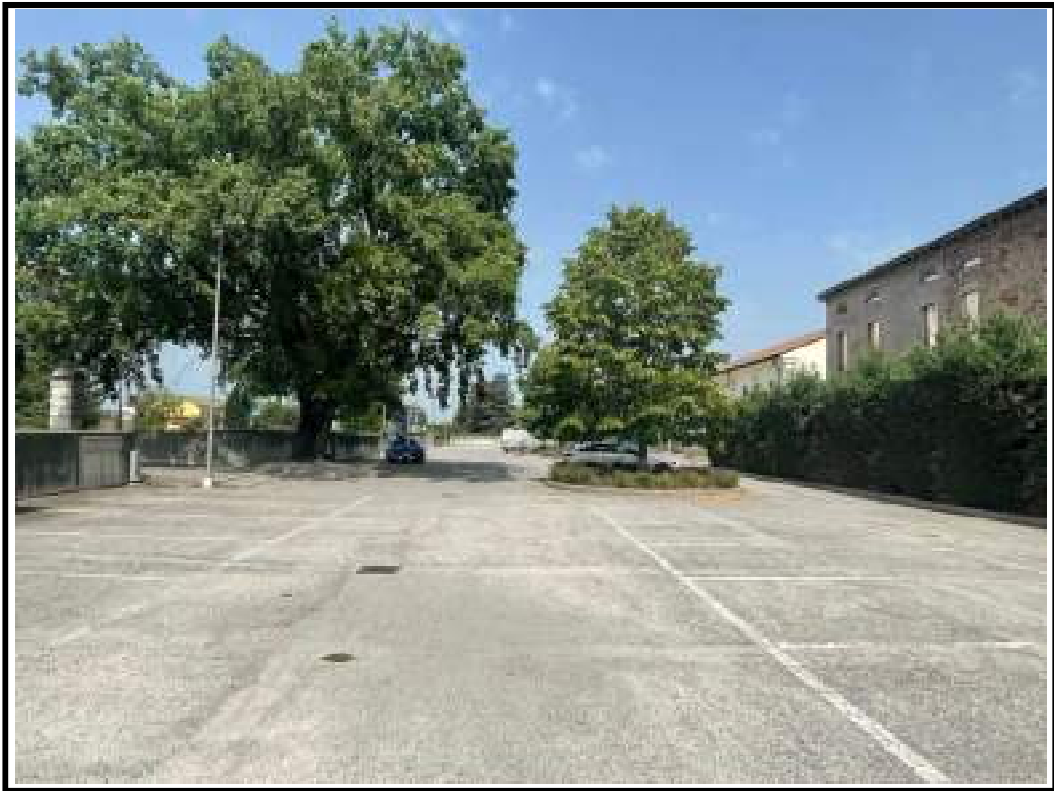
Foto 35 Area comune esterna