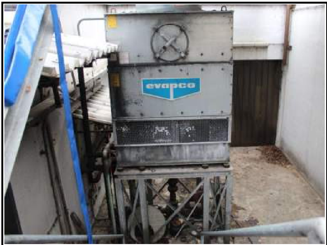
Foto 34 Accesso al locale di cogenerazione