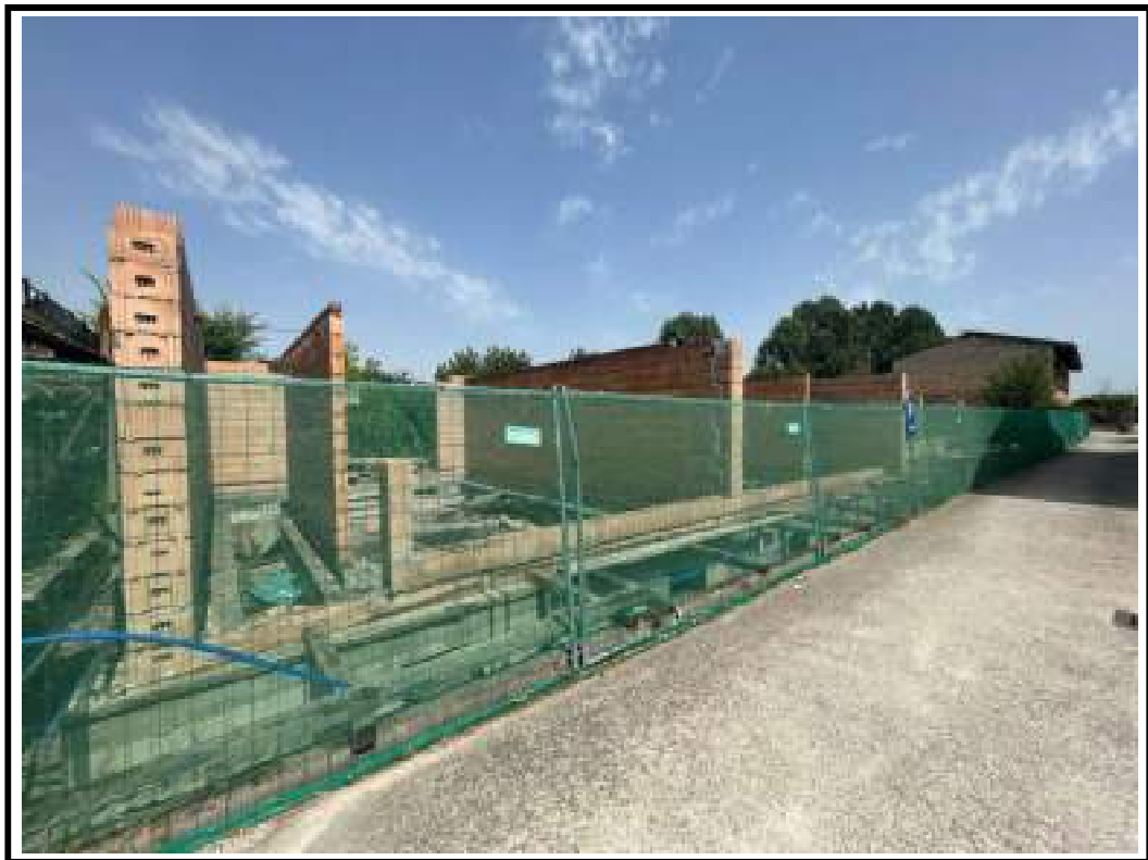
Foto 11 Prospetto Trattasi di fabbricato in corso di costruzione (Mapp. 127)