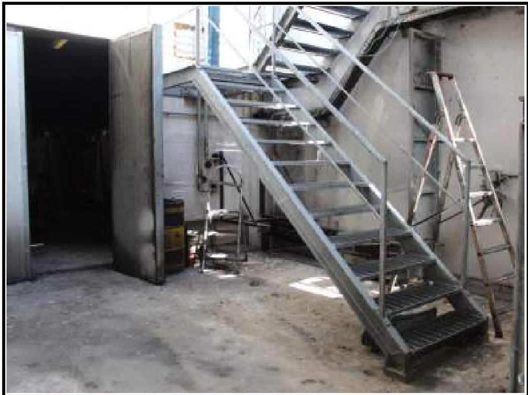
Foto 32 Scala di collegamento