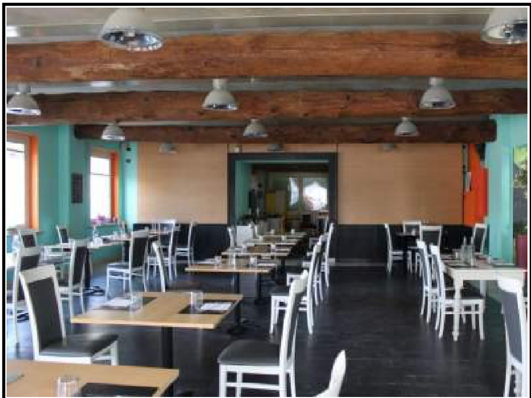
Foto 4 Zona ricezione clientela