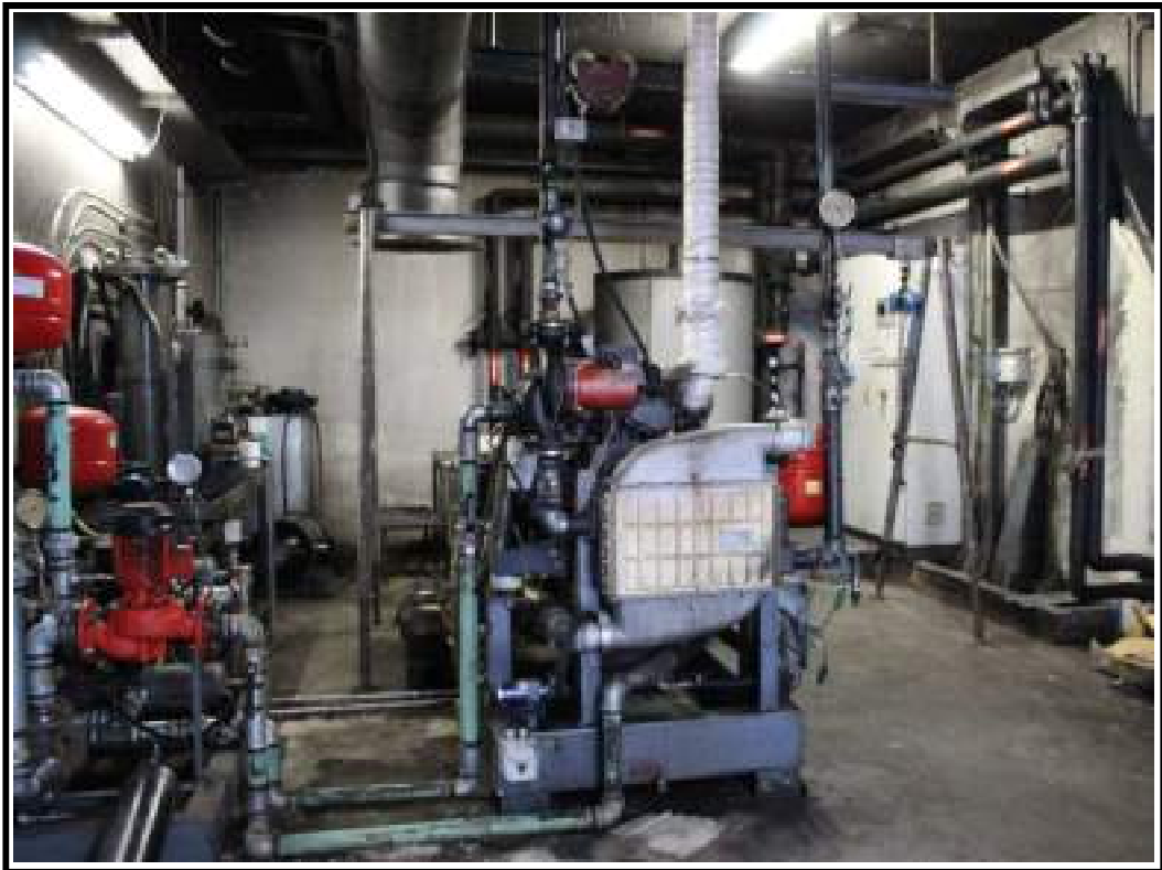
Foto 33 Impianto di cogenerazione