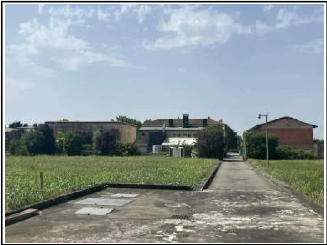
Foto 37 Area comune esterna