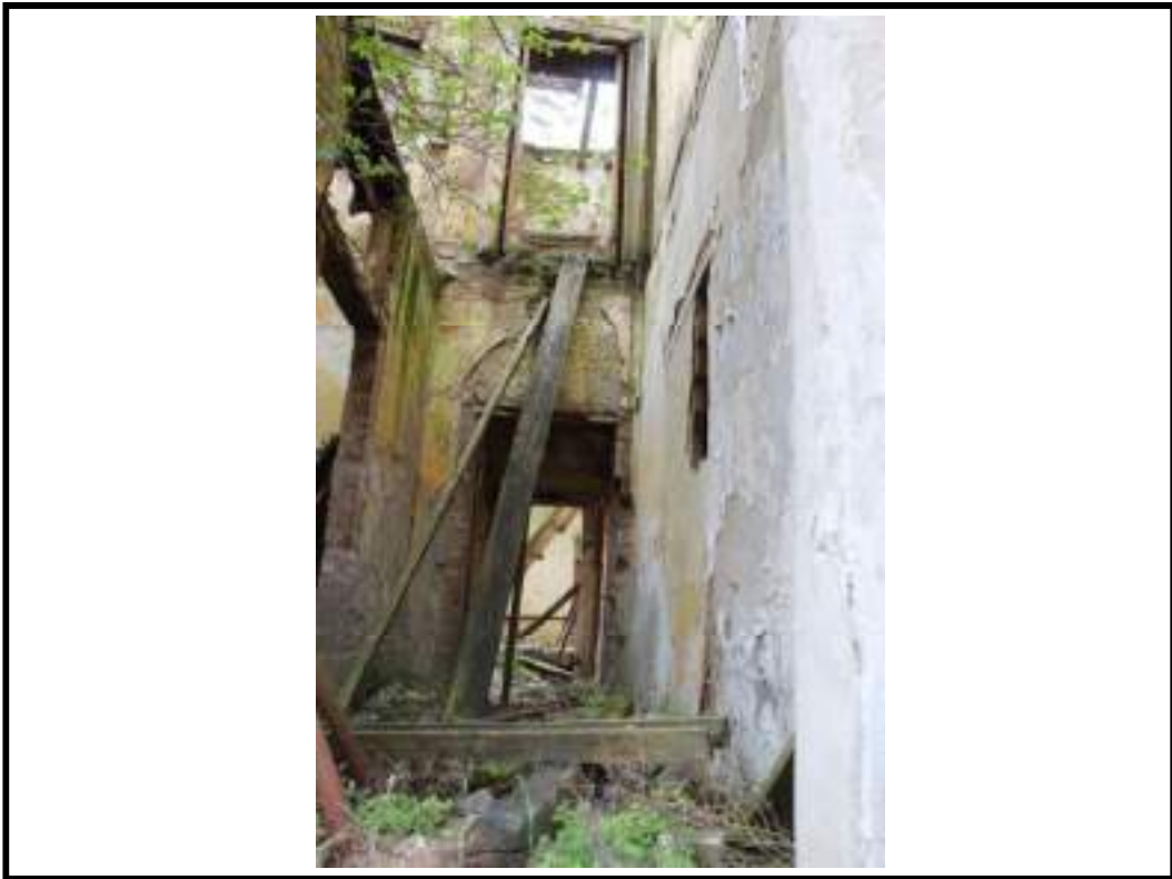
Foto 17 Vista interna