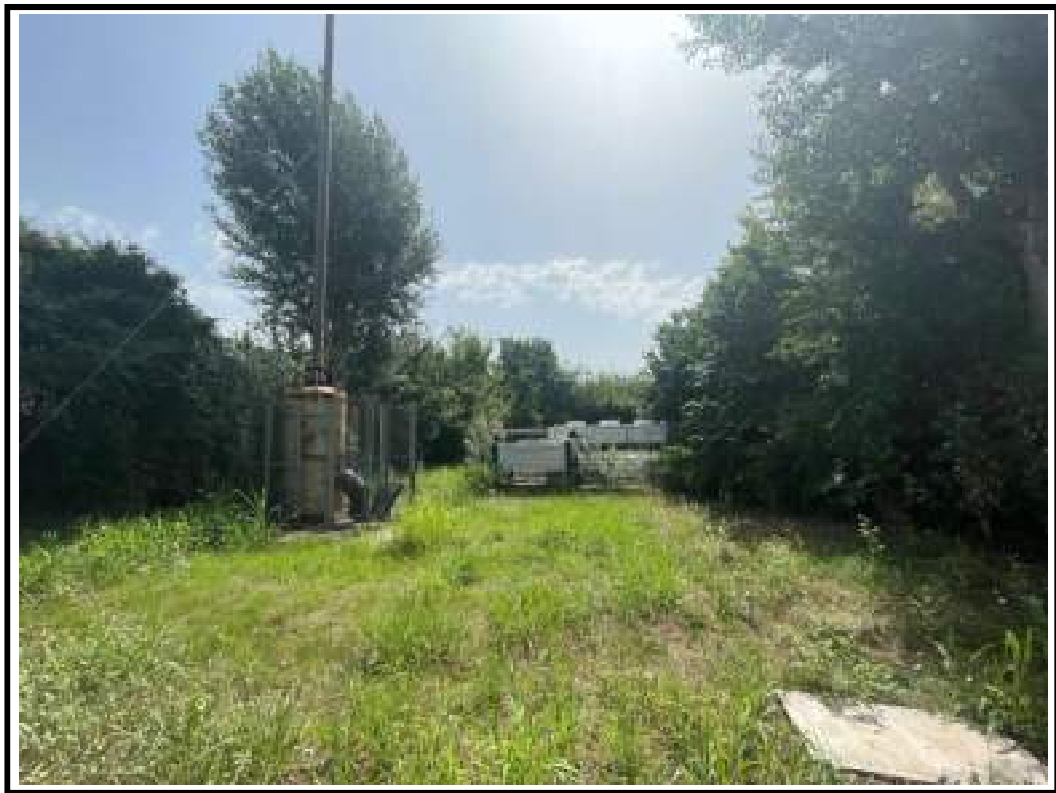
Foto 31 Accesso al locale interrato per la zona di cogenerazione