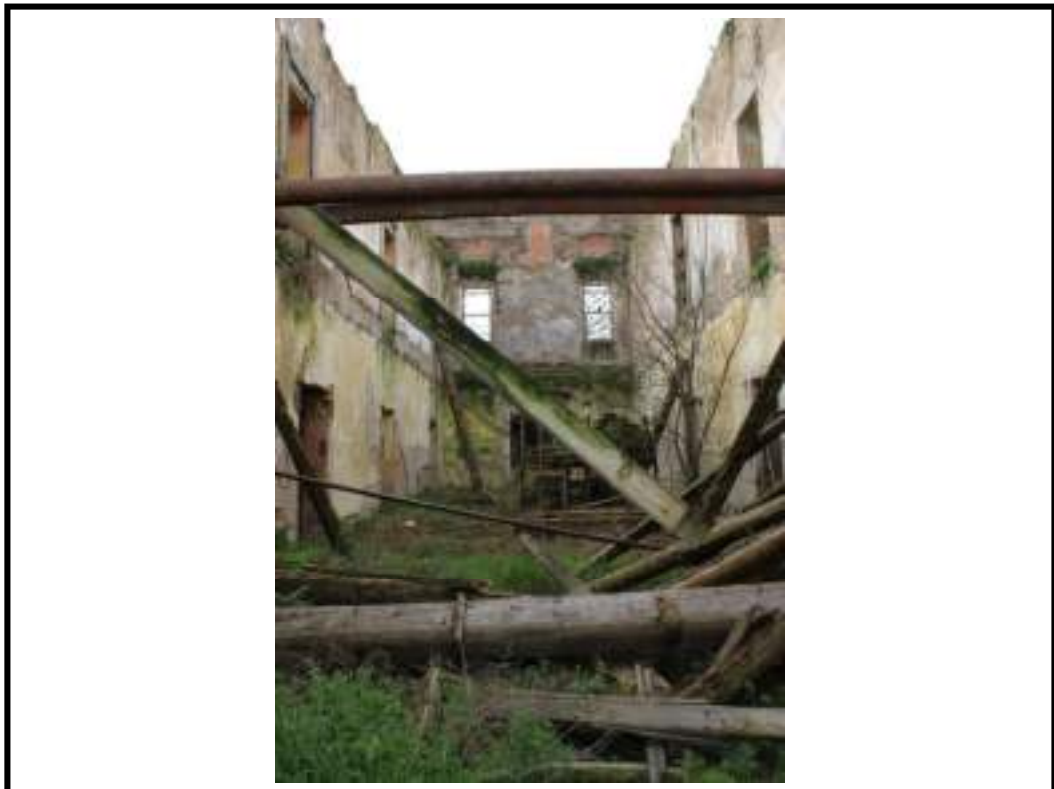
Foto 16 Vista interna