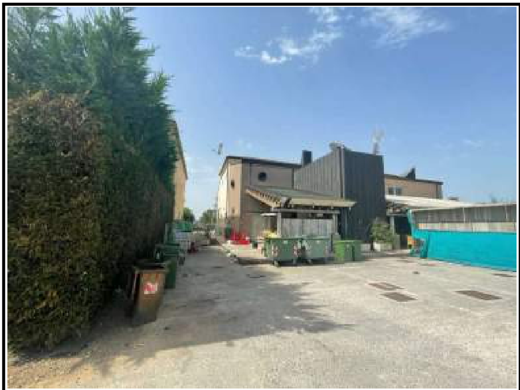
Foto 36 Area comune esterna