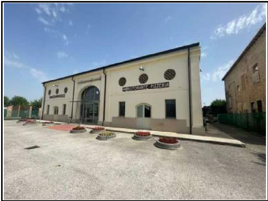
Foto 1 - Prospetto del ristorante