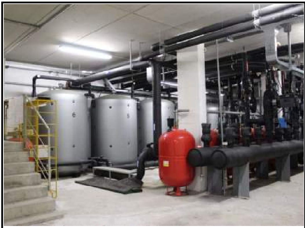
Foto 28 Locale interrato per gestione climatizzazione