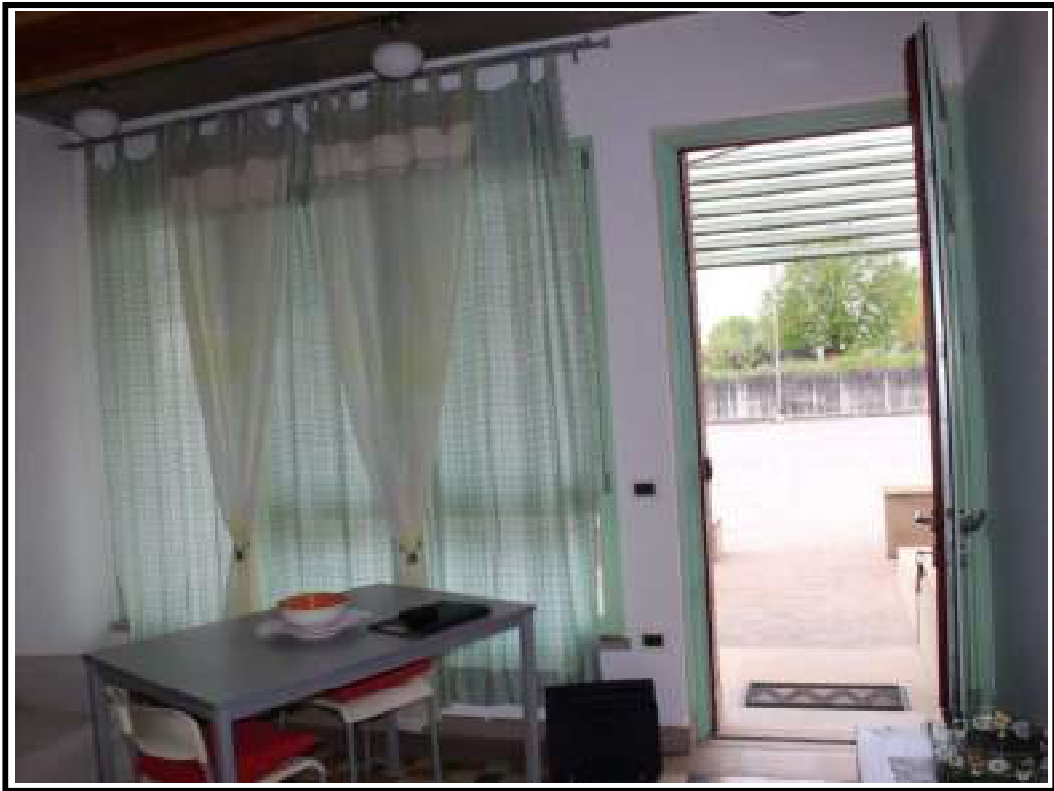
Foto 21 Ingresso