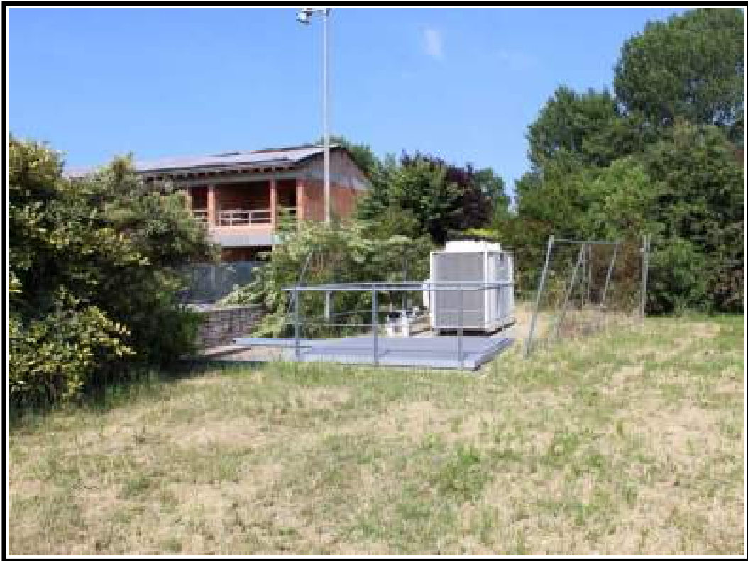
Foto 27 Accesso ai locali tecnici interrati