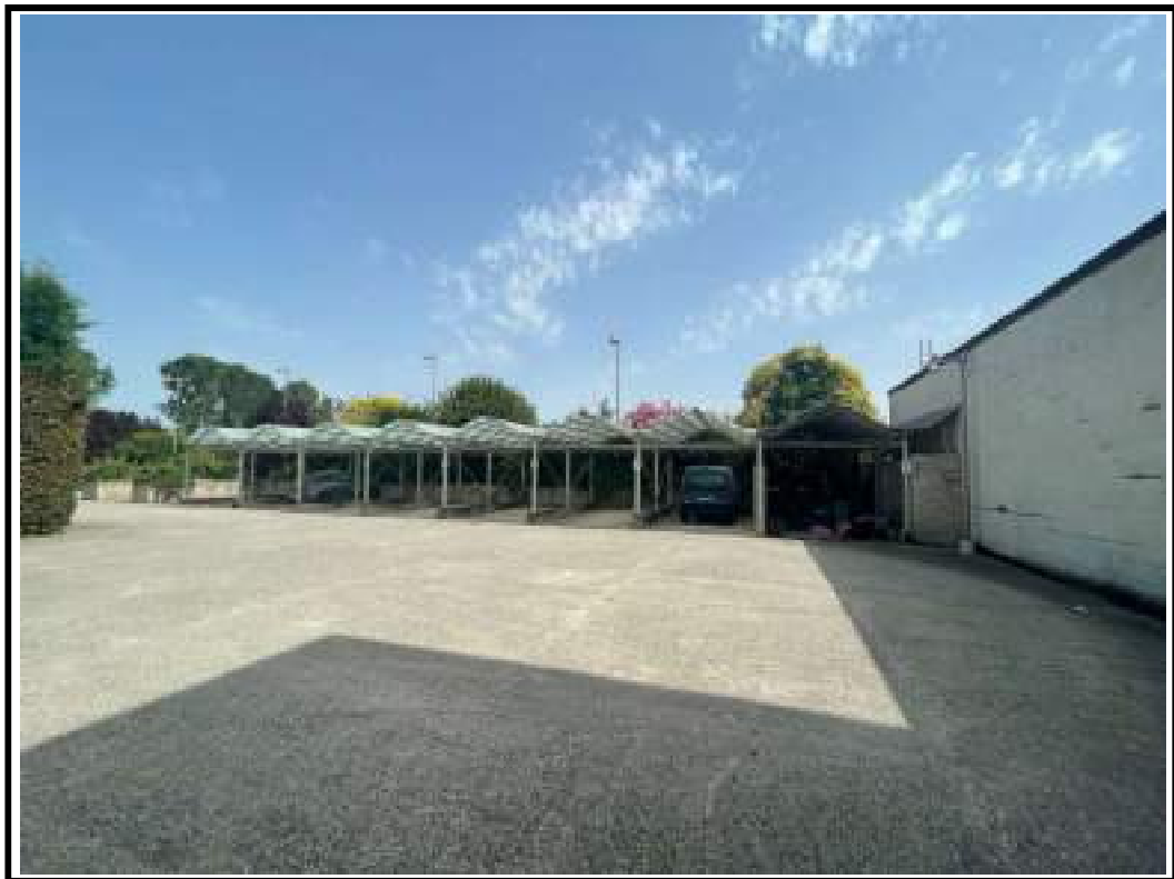
Foto 25 Posti auto coperti