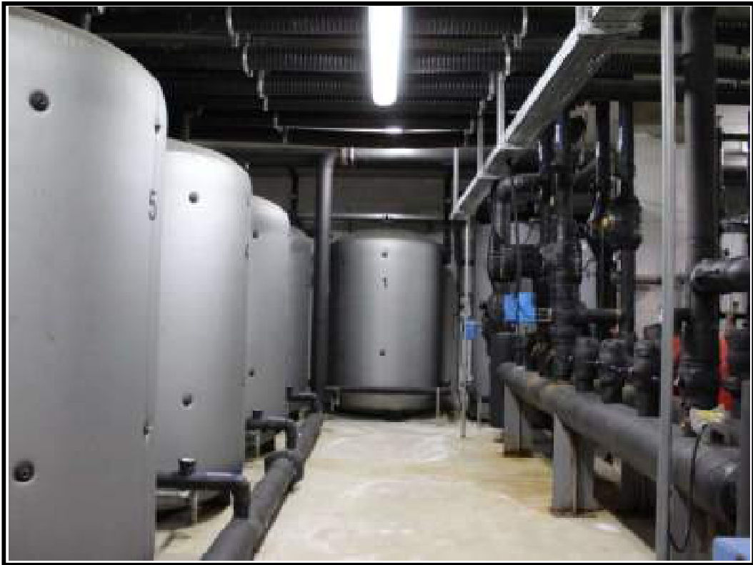
Foto 29 Locale interrato per gestione climatizzazione