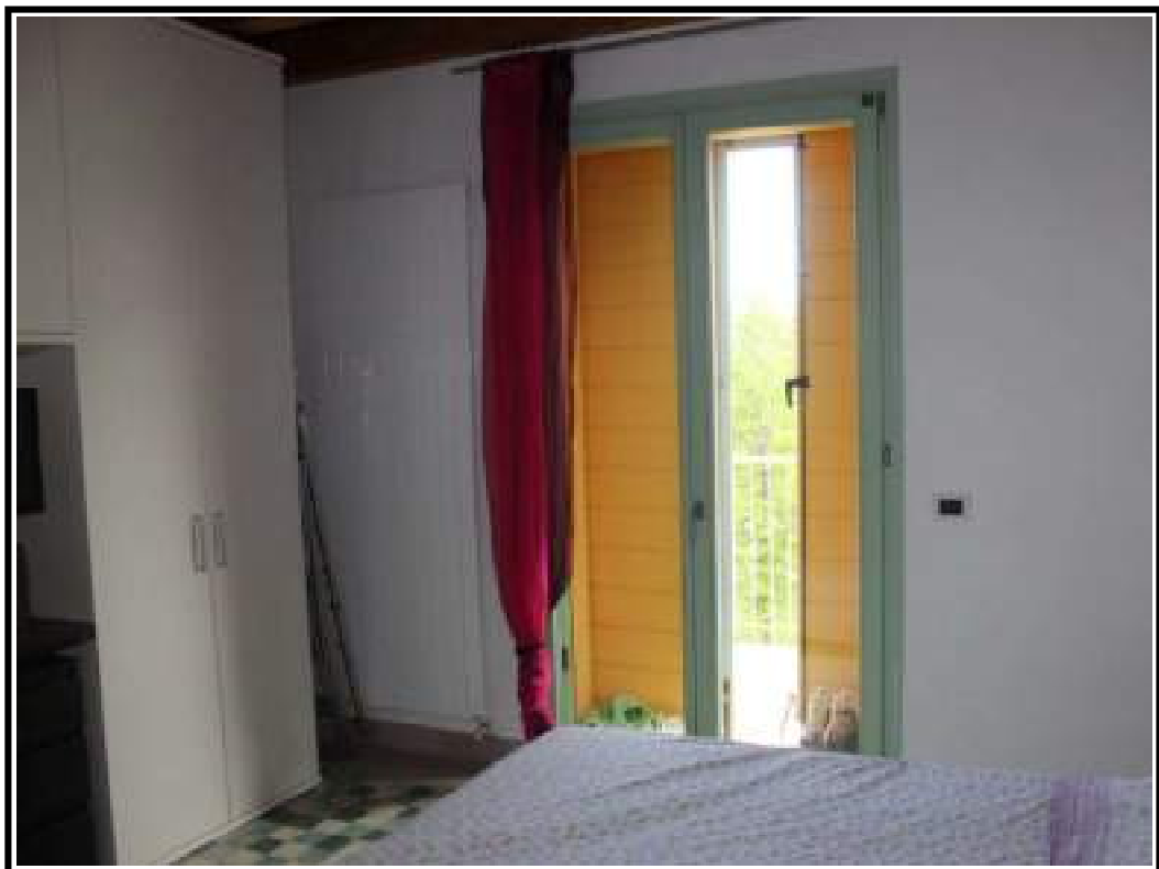
Foto 22 Camera matrimoniale