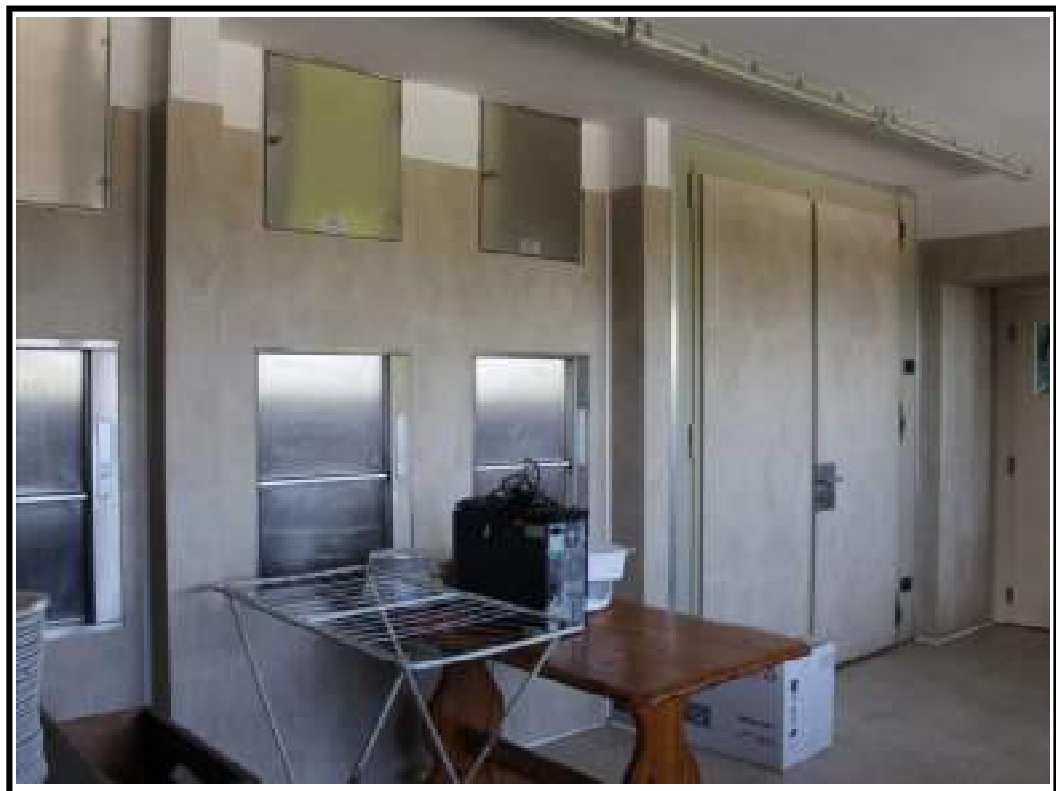
Foto 6 Zona montacarichi