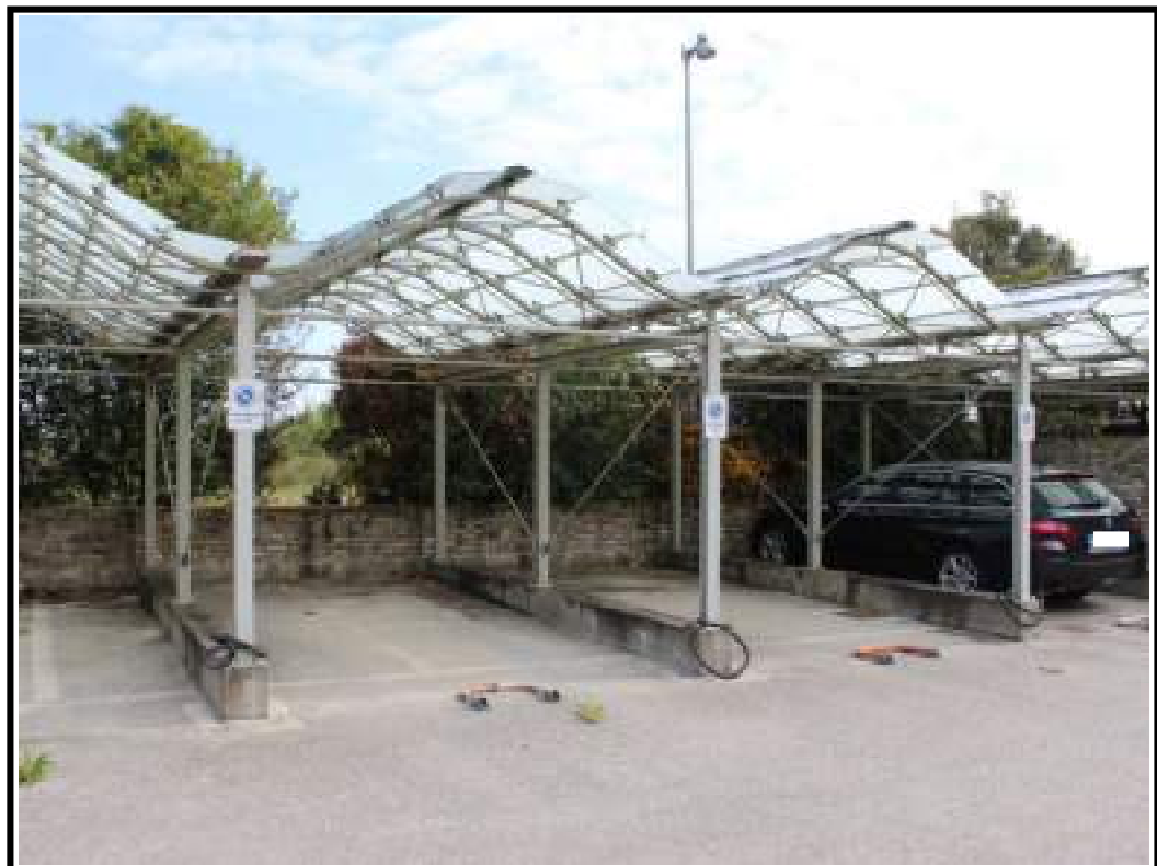
Foto 26 Posti auto coperti