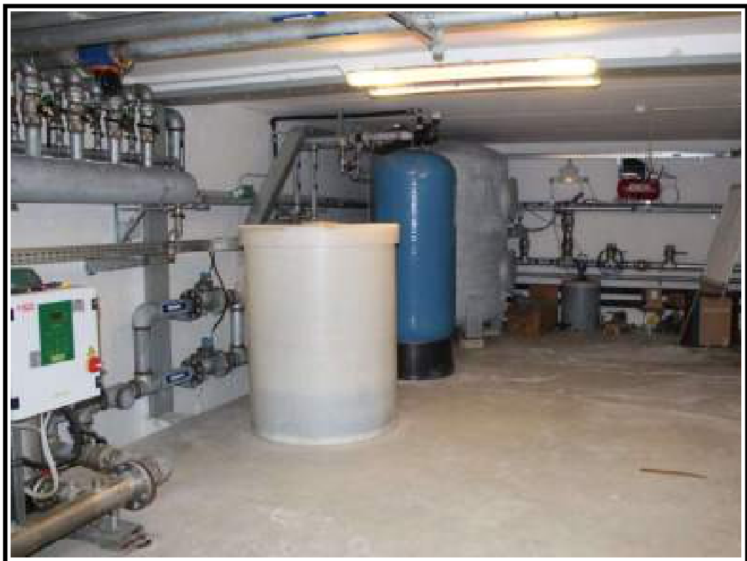
Foto 30 Addolcitore