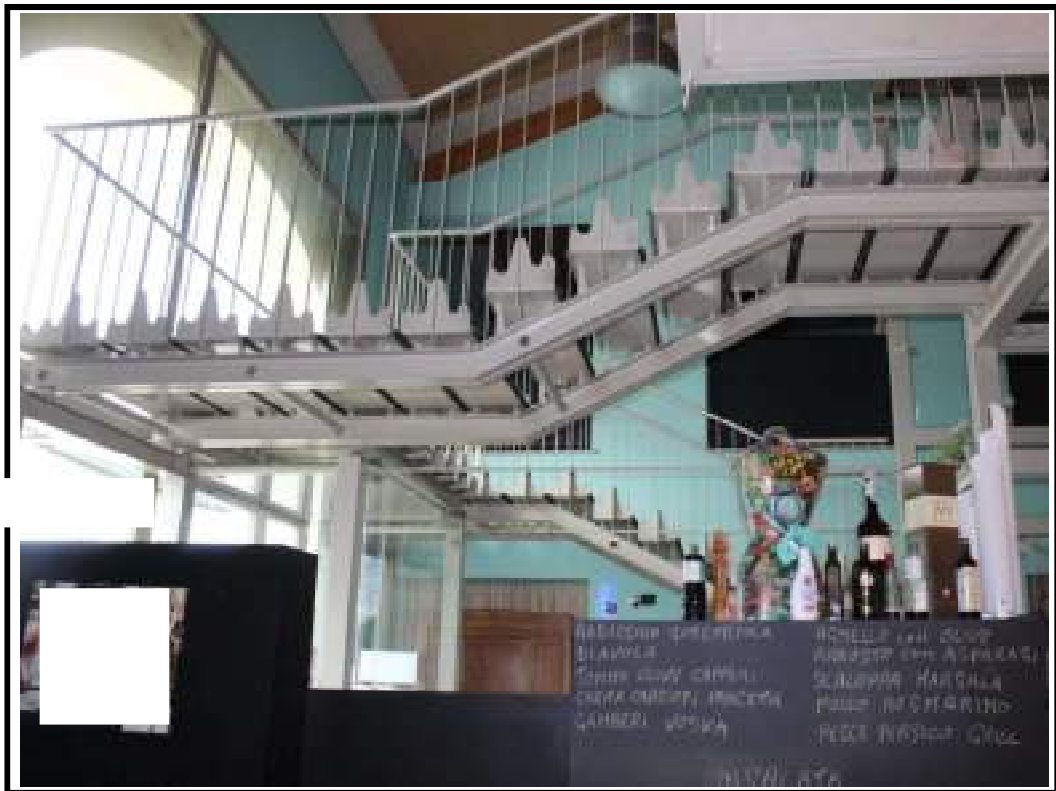
Foto 3 Scala di collegamento