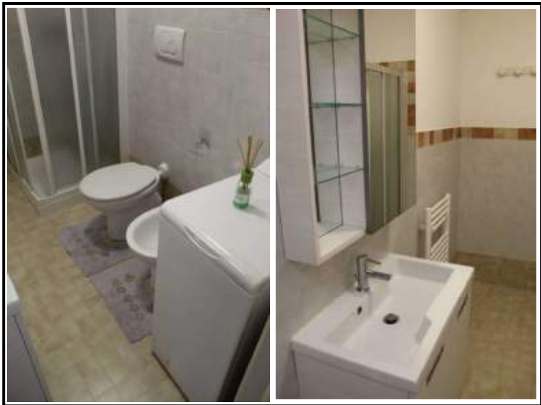
Foto 23 Bagno