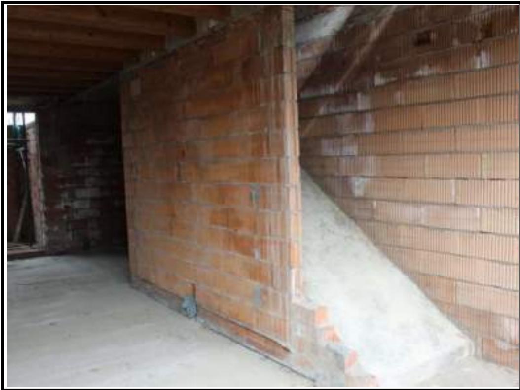
Foto 9 Vista interna