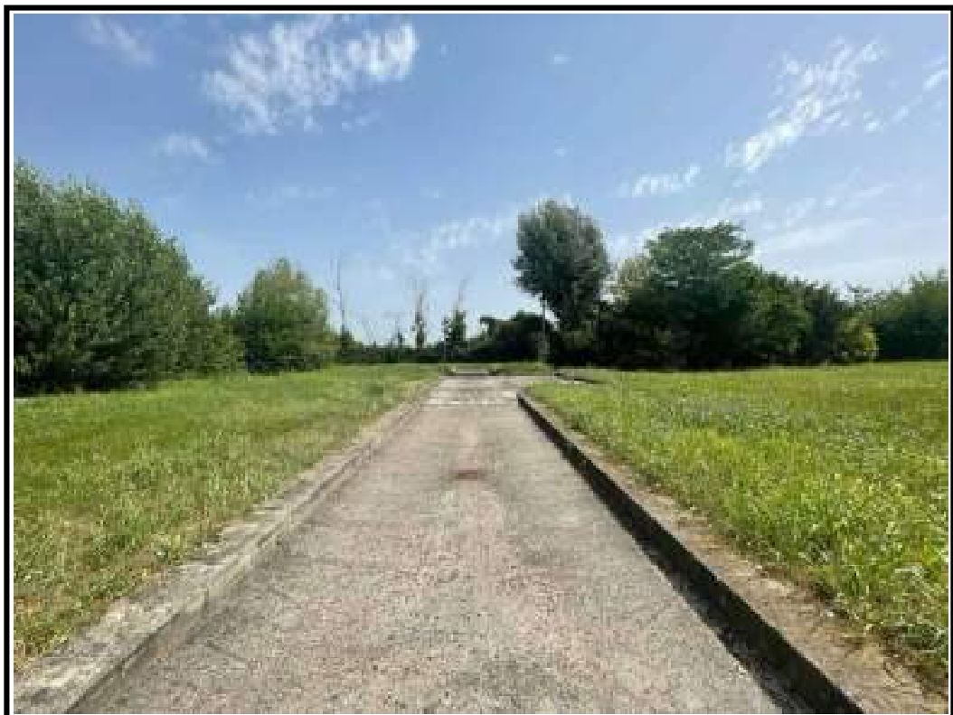
Foto 38 Area comune esterna