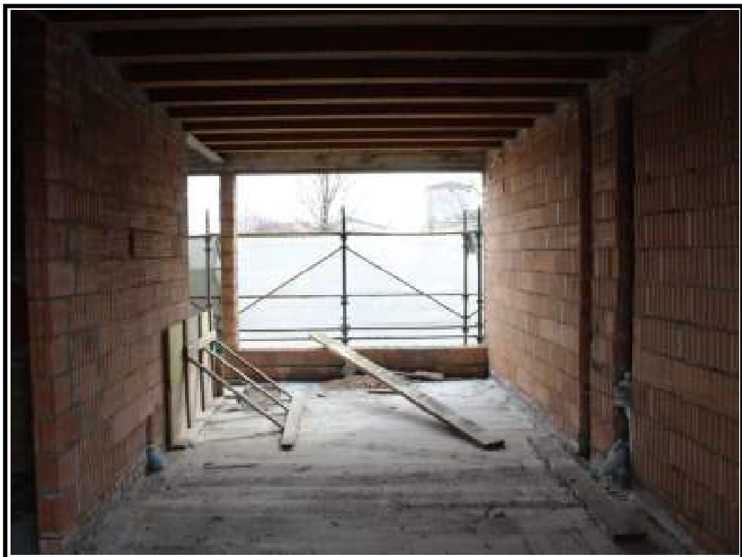
Foto 10 Vista interna