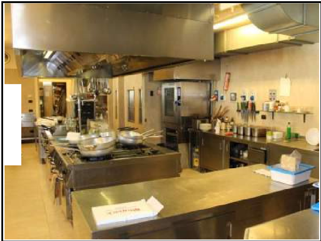
Foto 5 Cucina