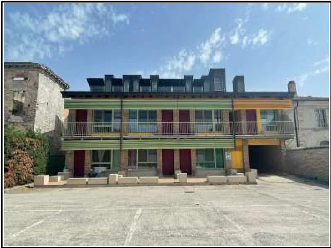
Foto 19 Prospetto fabbricato residenziale