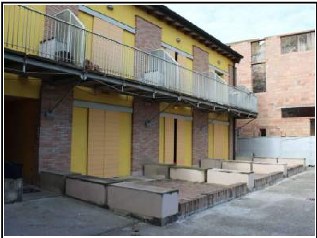
Foto 24 Balconi e aree pertinenziali