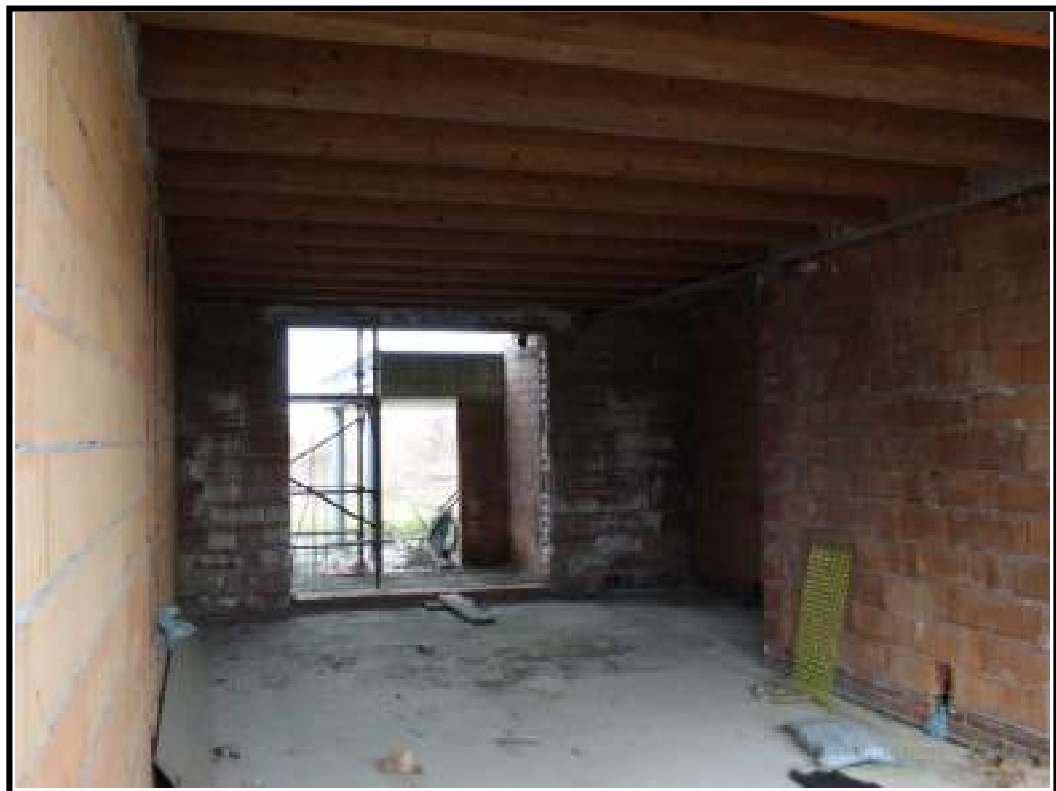
Foto 8 Vista interna