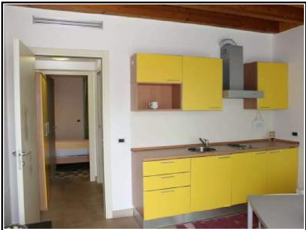
Foto 20 Zona giorno tipo