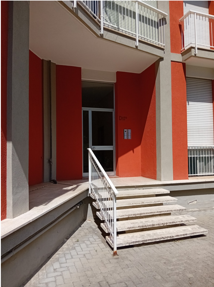
Riprese esterne fabbrica- to— ingresso fabbricato D