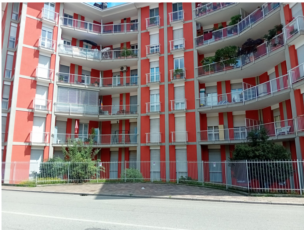
Riprese esterne fabbricato—lato su via Bengasi

LOTTO UNICO – Alloggio al piano rialzato inserito nel fabbricato D del complesso residenziale denominato “ORSA MAGGIORE” in Biella (BI), via Trento, 17