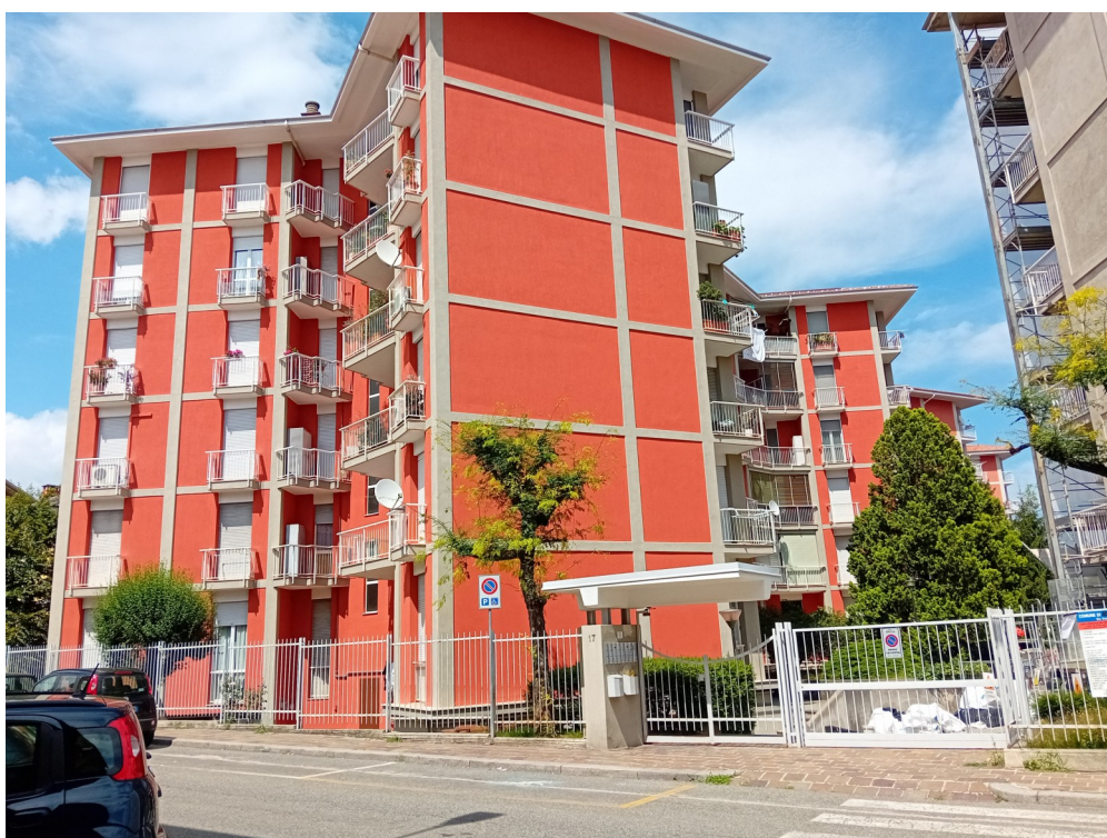
Riprese esterne fabbricato—lato ingresso su via Trento