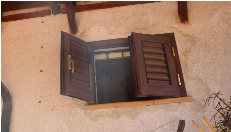
FOTO 47: UNITA' "B": Muratura perimetrale esposta su terrazzo di pertinenza dell'Unità "A"