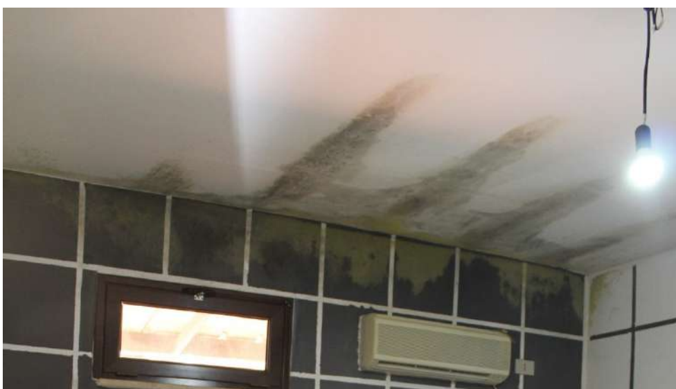
FOTO 48: UNITA' "B": Muratura perimetrale esposta su terrazzo di pertinenza dell'Unità "A"