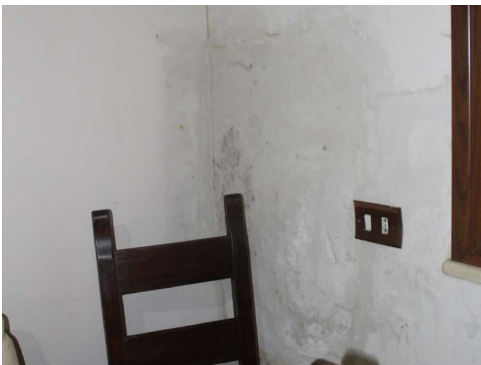
FOTO 50: UNITA' "B": Muratura perimetrale esposta su Ingresso cucina