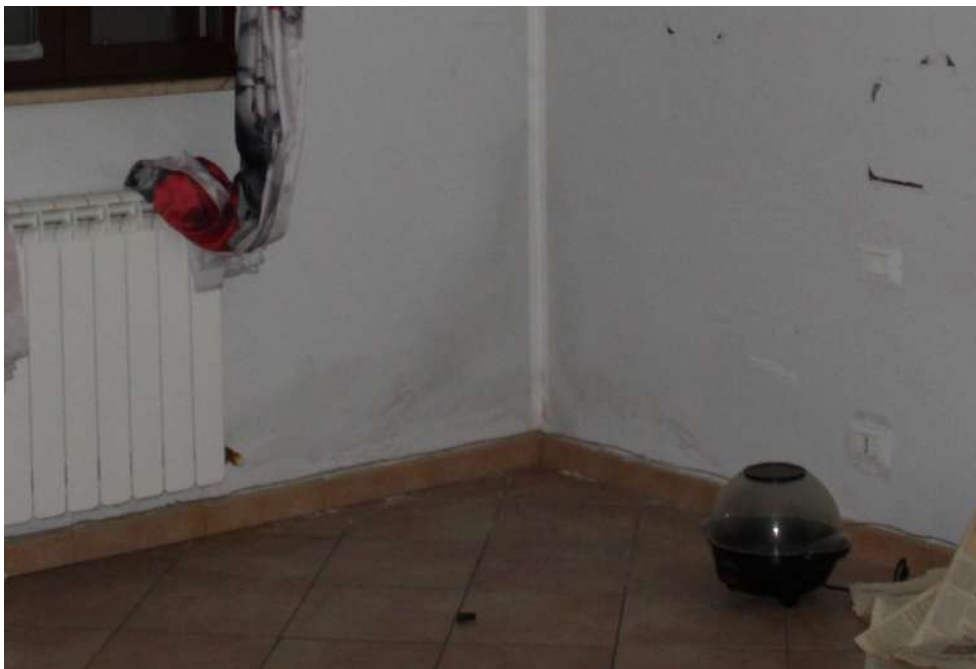
FOTO 43: UNITA' "A": Muratura che separa vano 6 dallo spazio esterno di pertinenza