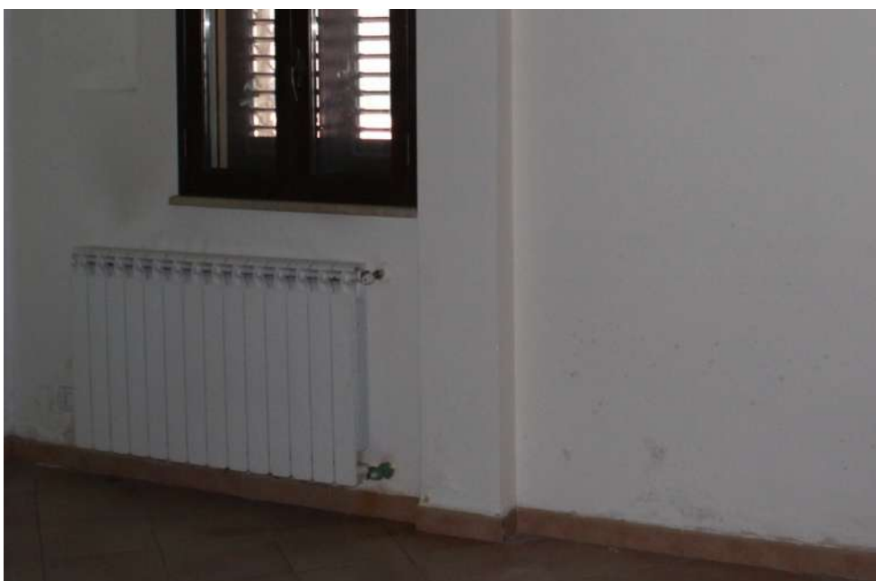
FOTO 44: UNITA' "A": Muratura che separa vano 7 dal terrazzo di pertinenza