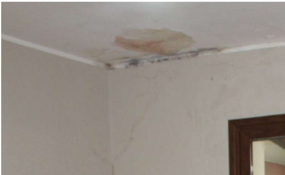
FOTO 49: UNITA' "B": Muratura perimetrale esposta su Ingresso cucina