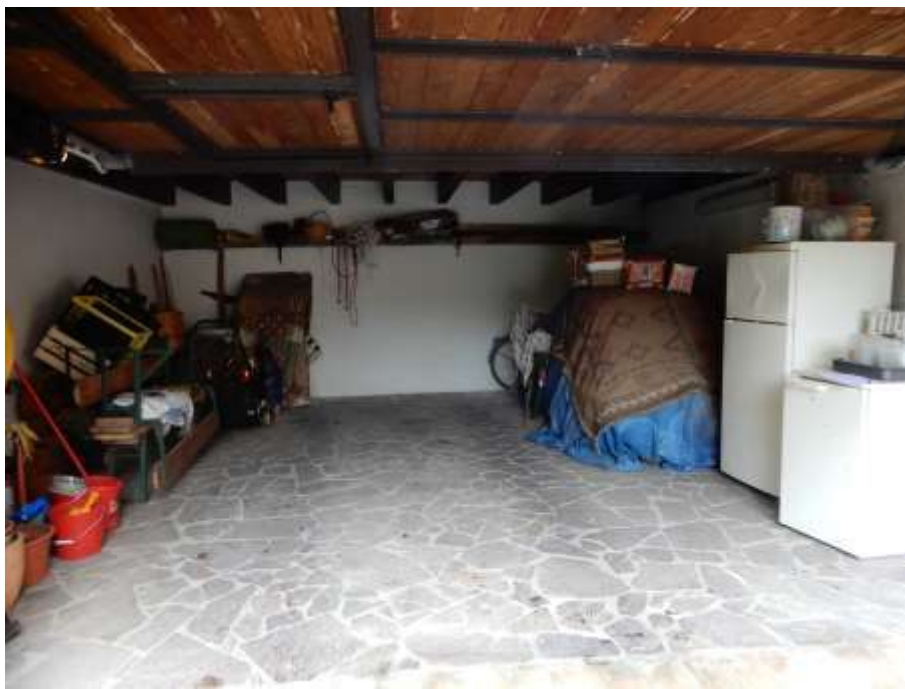
PERGOLATO COPERTURA ABUSIVA