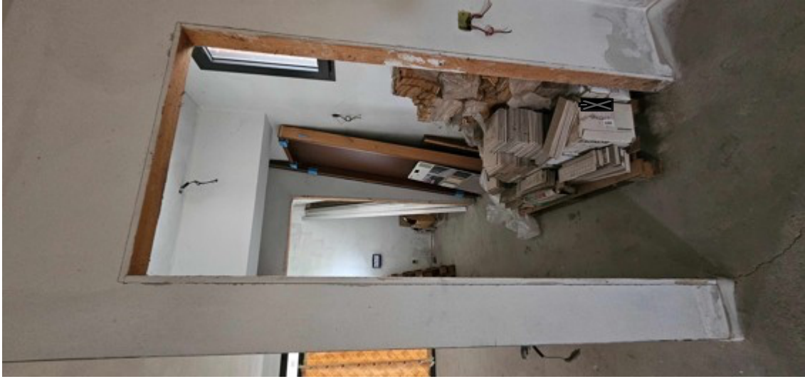
Fotografia B.5 - negozio