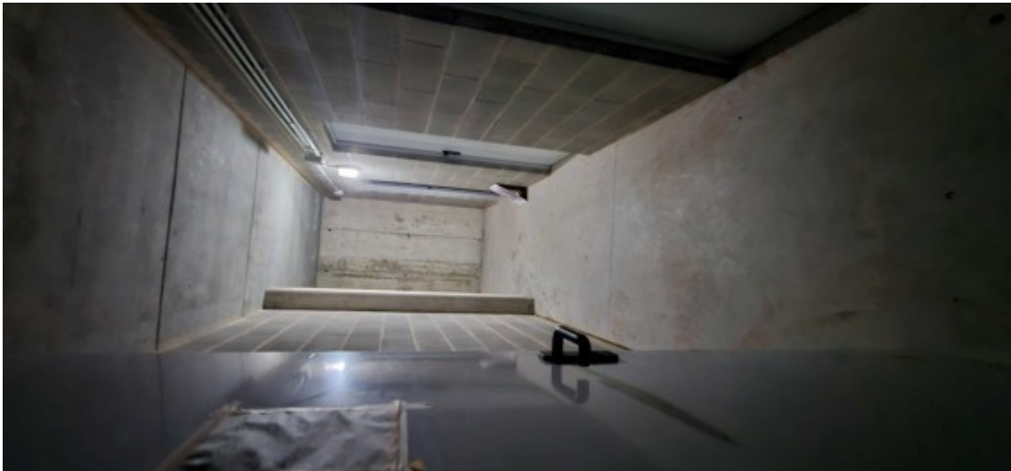
Fotografia B.10 - cantina corsello