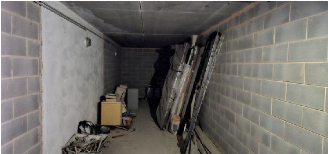
Fotografia B.11 - box auto