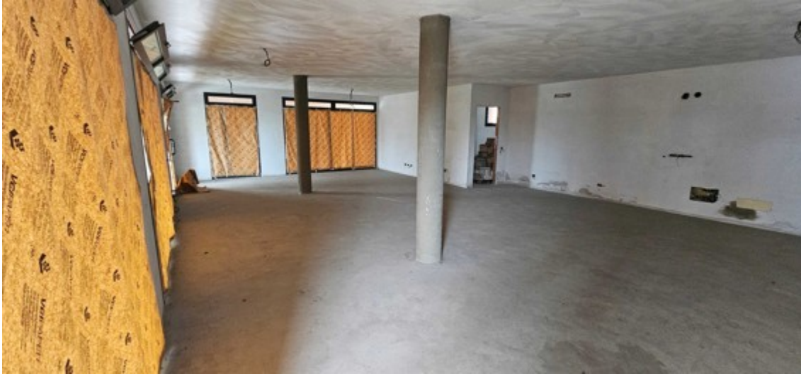
Fotografia B.3 - negozio