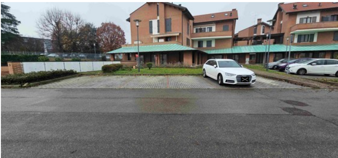
Fotografia B.8 - posti autoi pertinenziali scoperti