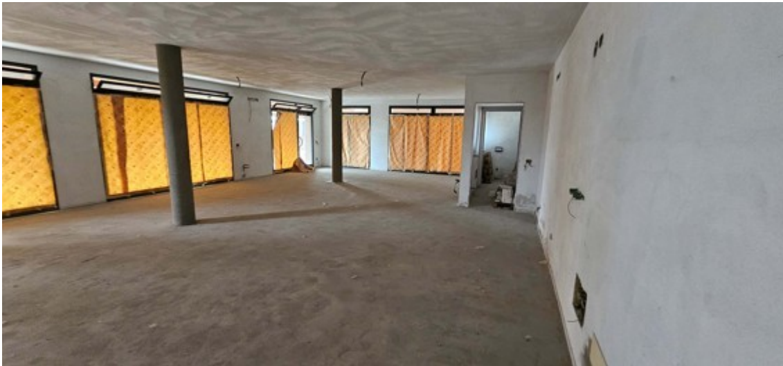
Fotografia B.4 - negozio