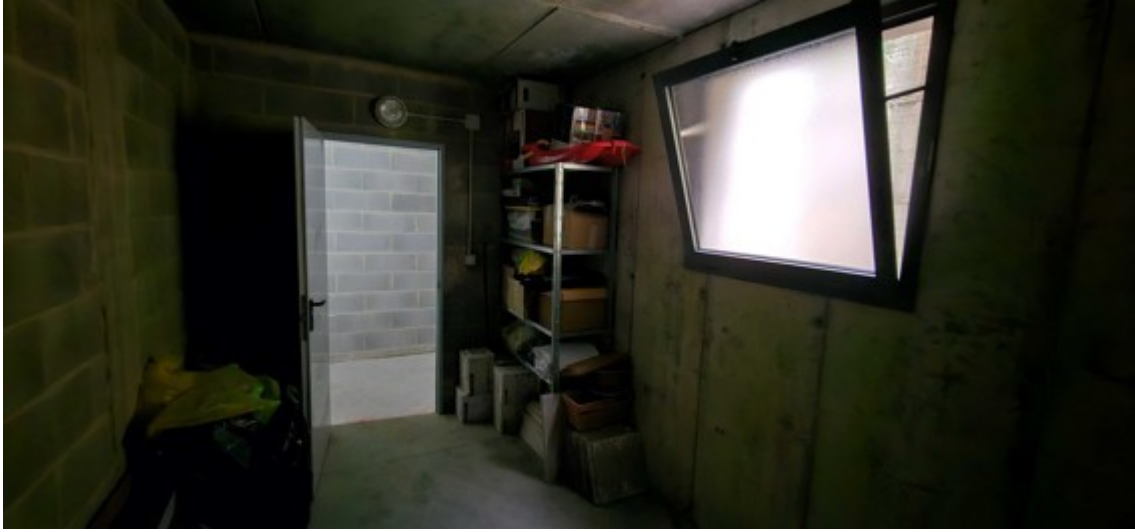
Fotografia B.9 - cantina