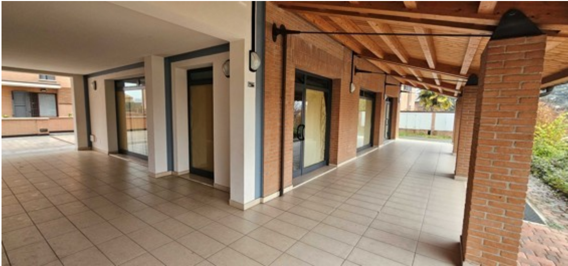
Fotografia B.7 - portico esclusivo