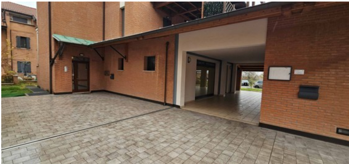
Fotografia B.2 - vista esterna sud ovest