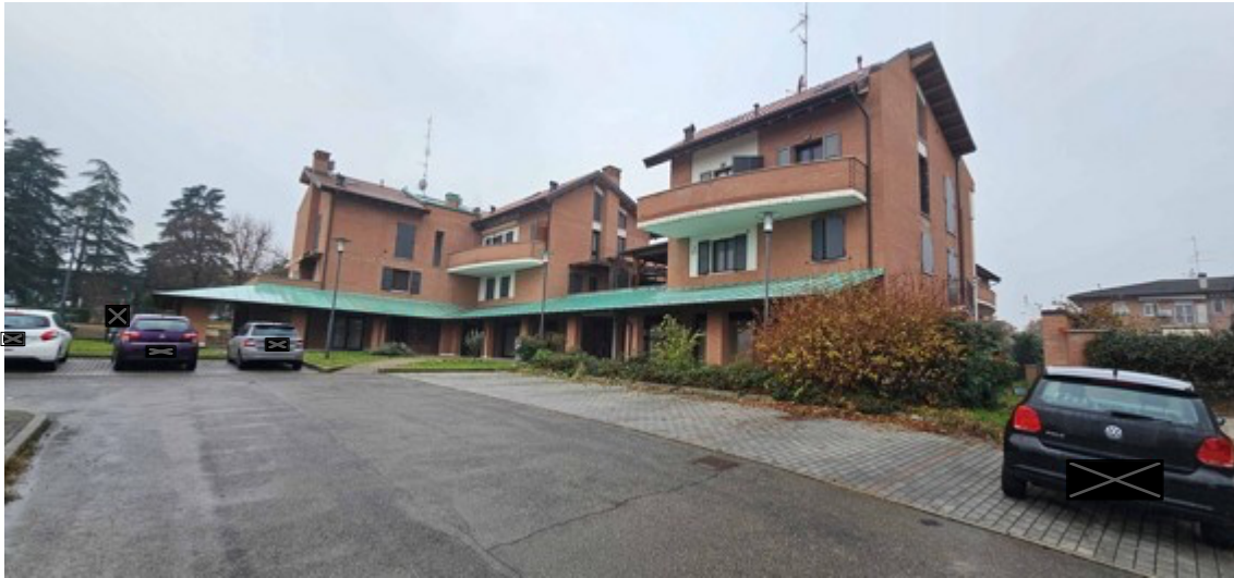
Fotografia B.1 - Vista esterna nord est