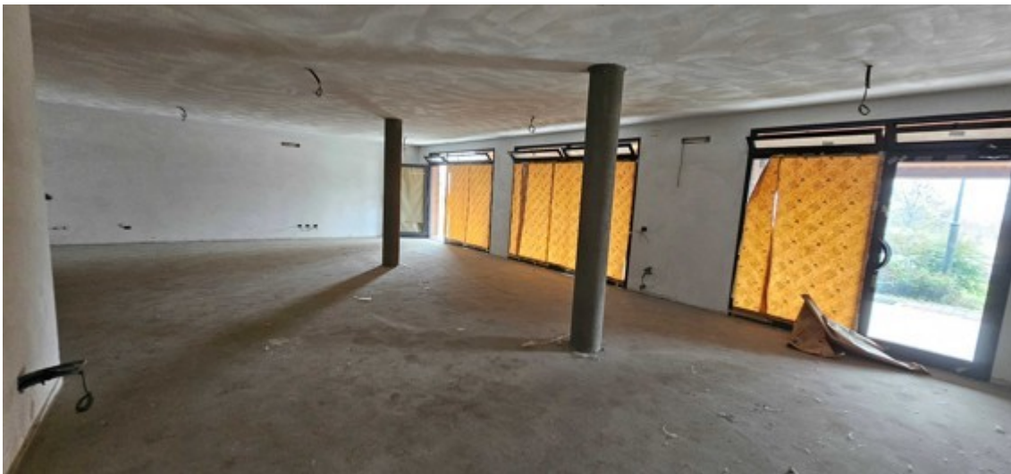
Fotografia B.6 - negozio