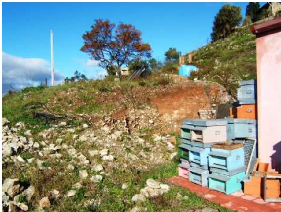
Foto n. 17: Lotto 2 – Spazi esterni circostanti il fabbricato