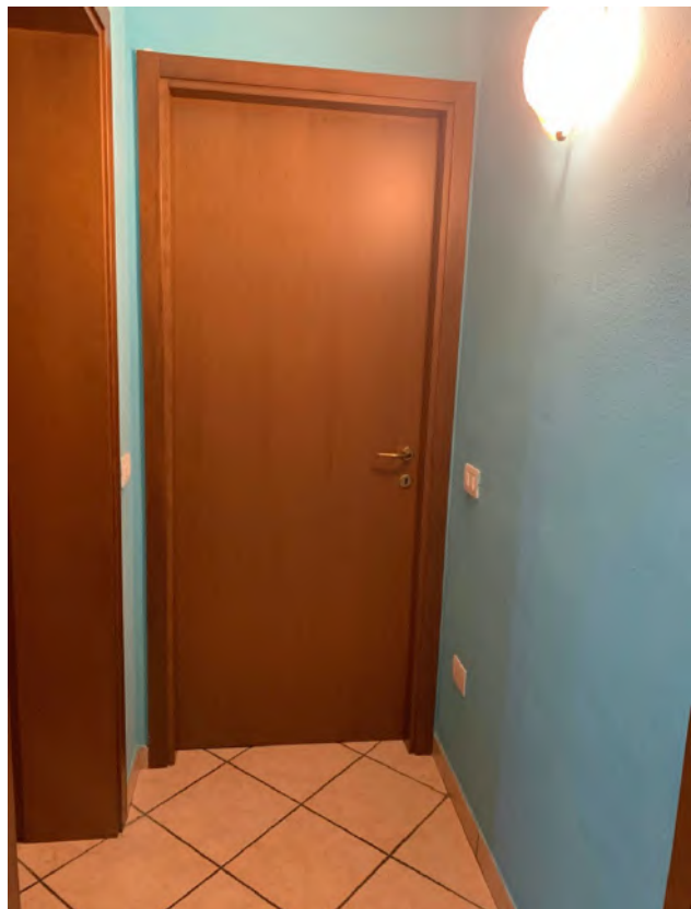
Atrio di Distribuzione – Accesso Stanze Letto