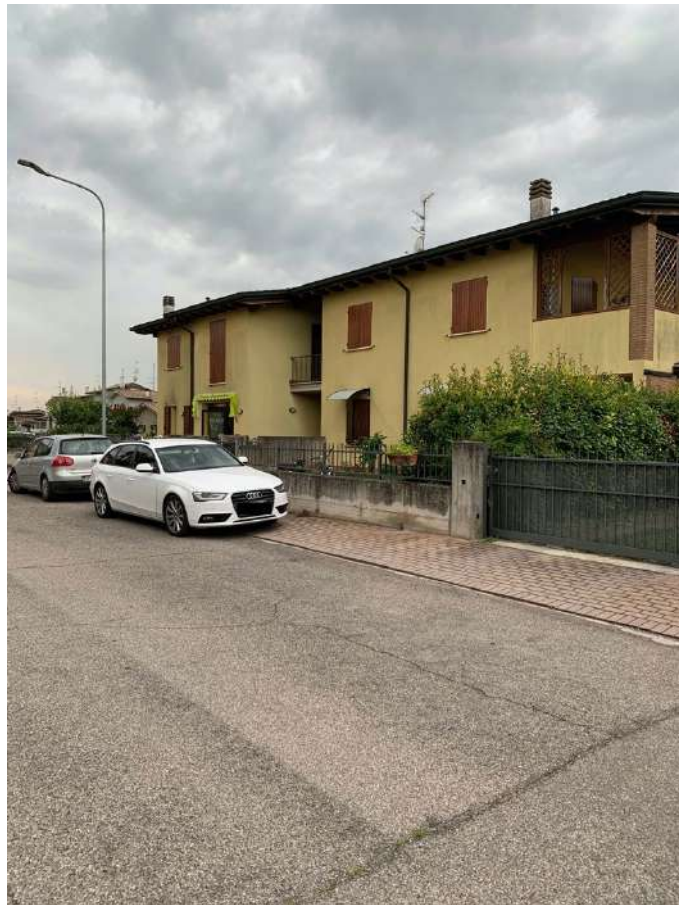
Vista Fronte da Via Puccini