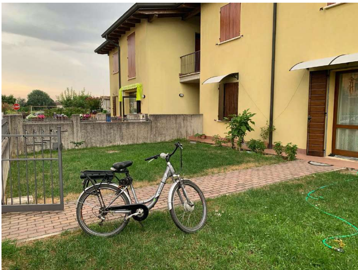
Cortile Esclusivo Fronte Strada