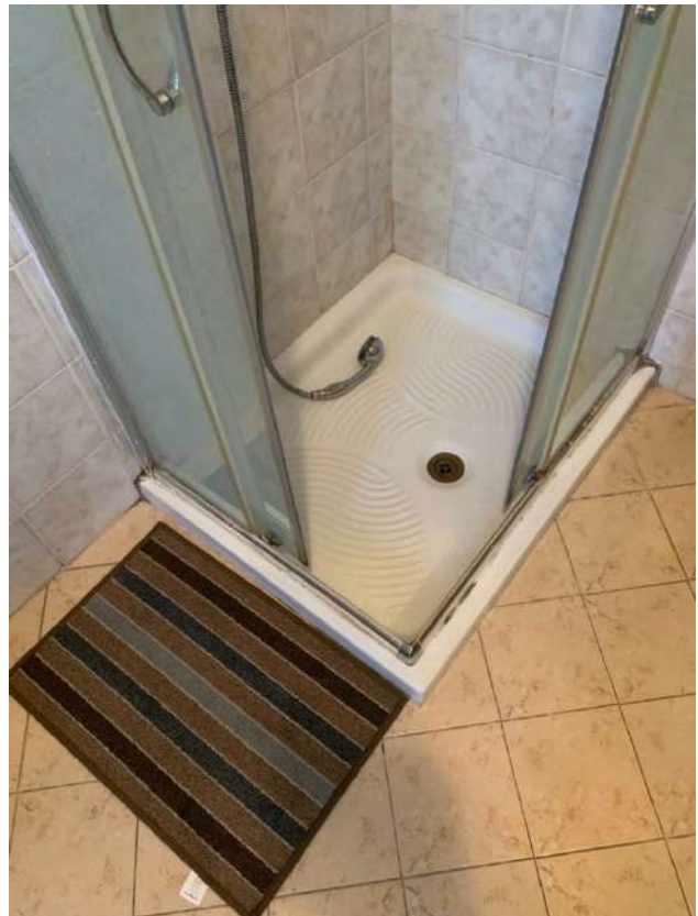
Bagno – Particolare piatto doccia