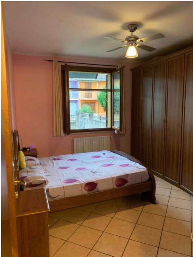
Stanza Letto su via Puccini