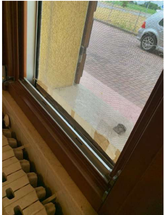
Bagno – Particolare finestra su cortile retro