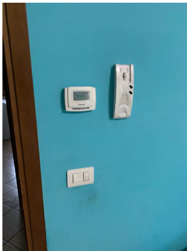
Particolare Termostato Ambiente e Citofono