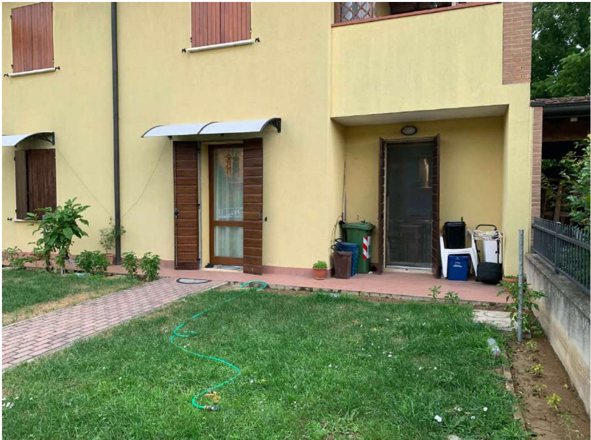
Vista Fronte – Cortile Esclusivo