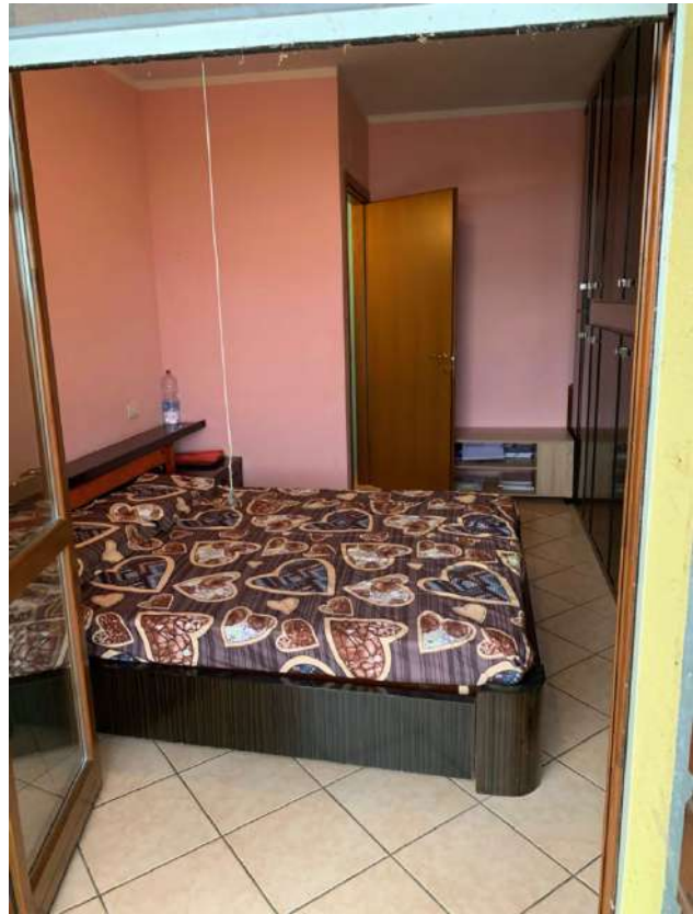
Stanza Letto su Cortile Retro