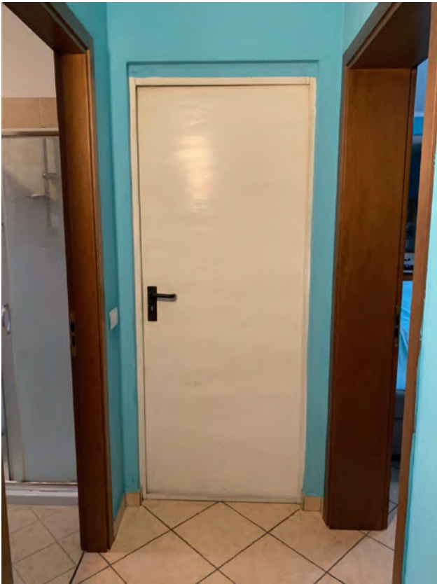
Atrio di Distribuzione – Accesso Autorimessa