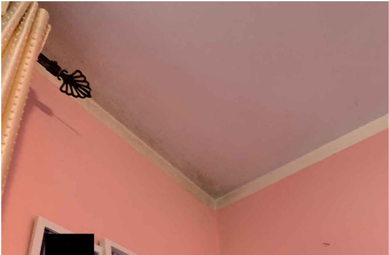
Stanza Letto – Particolare angolo Soffitto