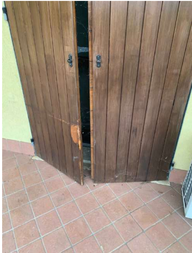
Stanza Letto – Particolare Ante esterne