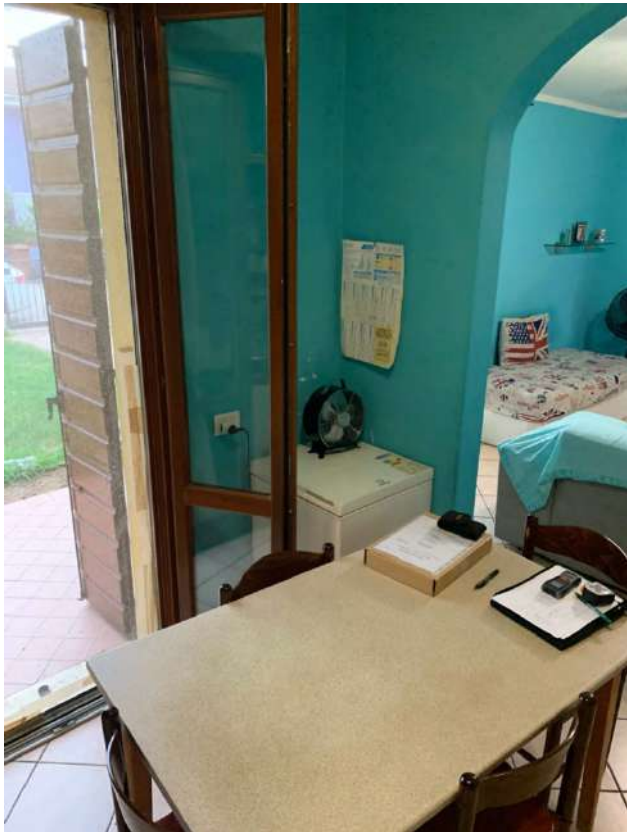
Cucina (Zona Giorno)