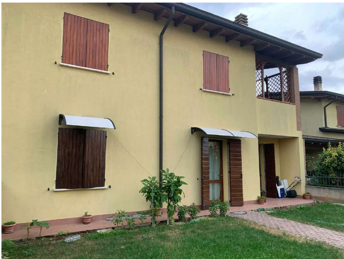
Cortile Esclusivo Fronte Strada