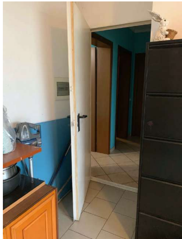
Autorimessa – accesso ad atrio di distribuzione