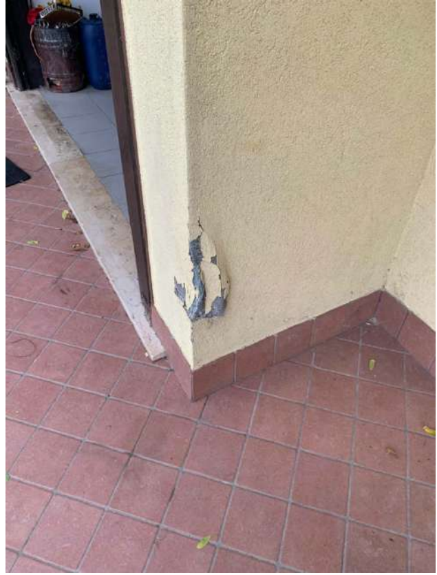
Angolo esterno Autorimessa