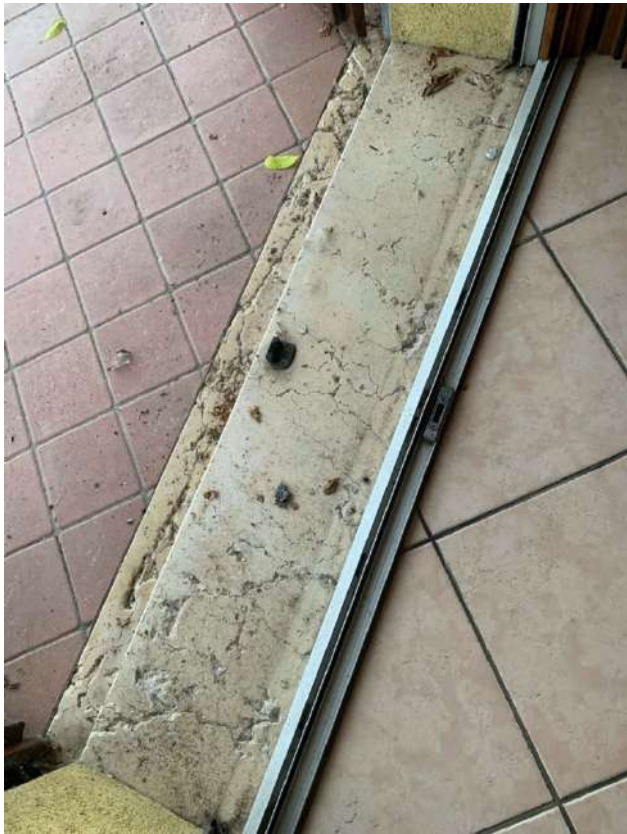
Stanza Letto – Particolare soglia Porta