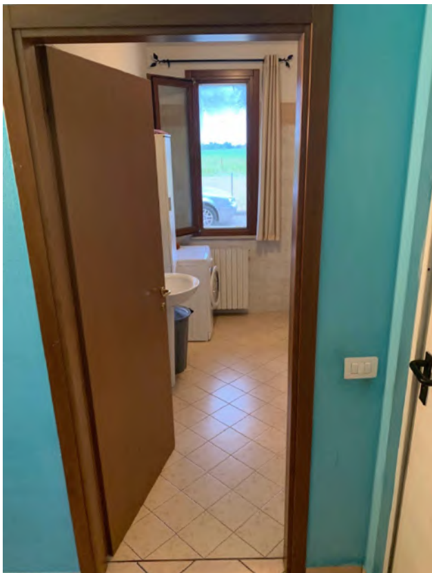
Atrio di Distribuzione – Accesso Bagno