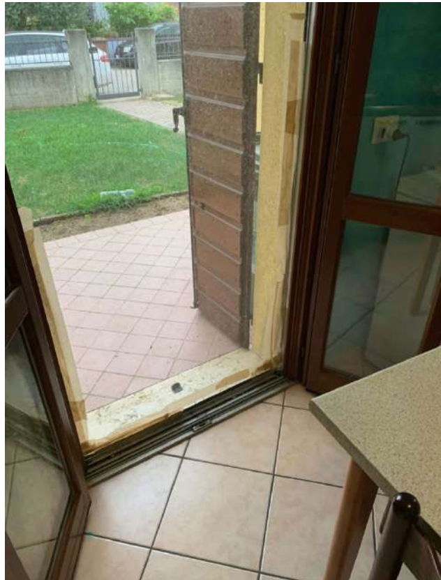
Particolare Porta Cucina in uscita su cortile