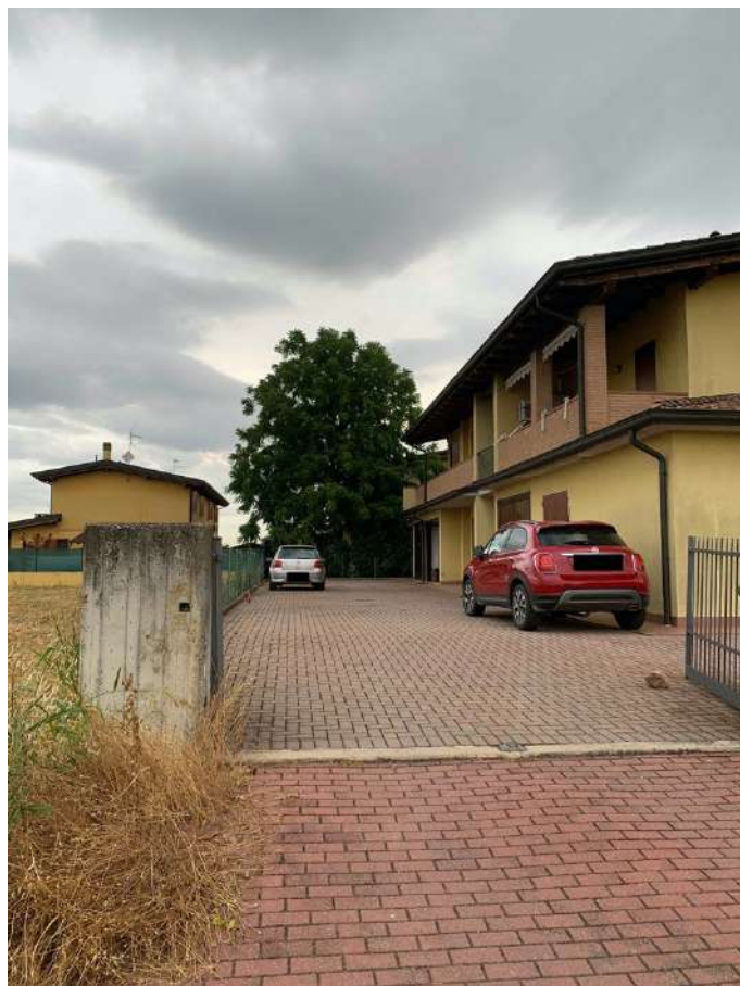
Cortile Comune di Accesso Autorimessa