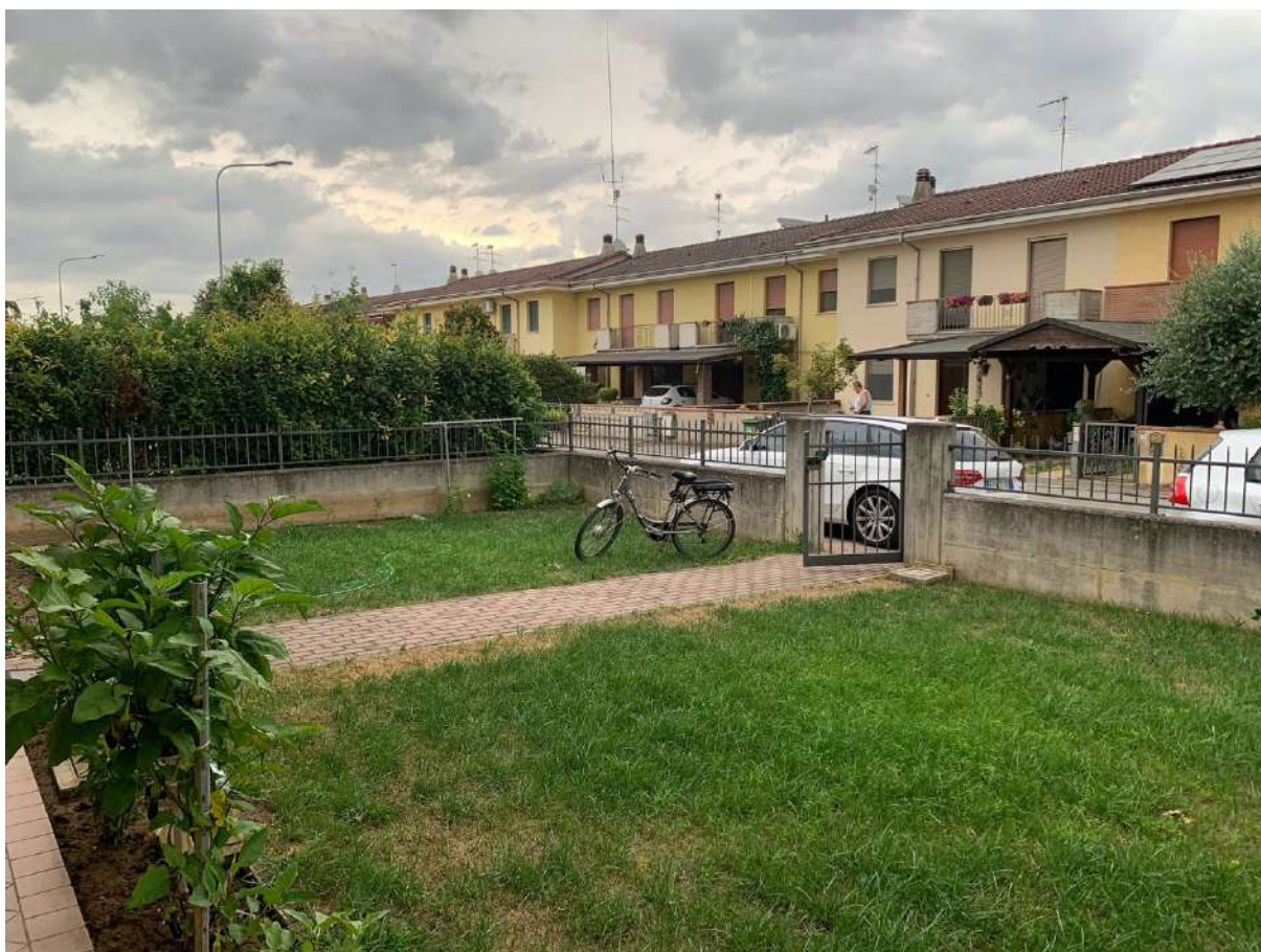
Cortile Esclusivo fronte strada