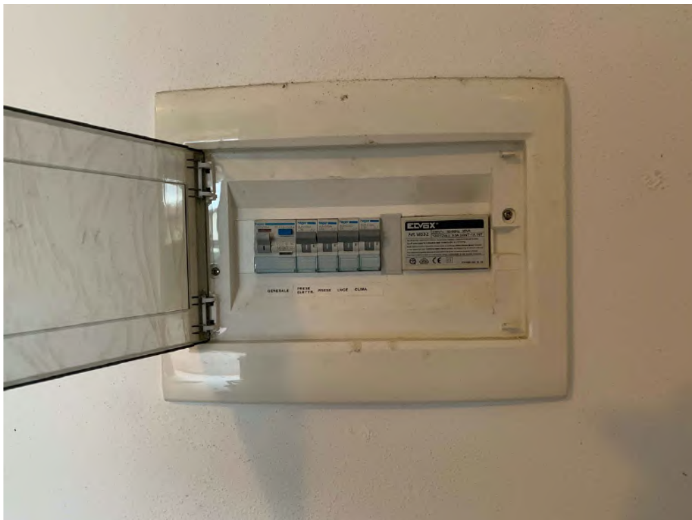
Autorimessa – Particolare quadro elettrico generale