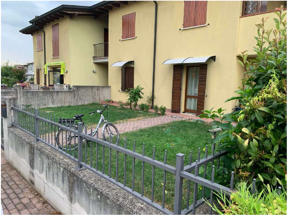
Vista Fronte – Cortile Esclusivo